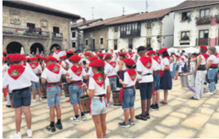
Udaletxeko balkoitik botatako txupinazoak eta danborradak hasiko dituzte jaiak.

Udaletxeko balkoitik jaurtiriko txupinagaz batera leher-tuko da jai giroa herriko kale eta bazterretan, uztailearen 17an. Jaiek iraungo duten aste bietan zehar, tradizio handiko ekitaldiek ez dute hutsik egingo. Besteak beste, herriko Urduri dantza taldearen saioa, Oihan-