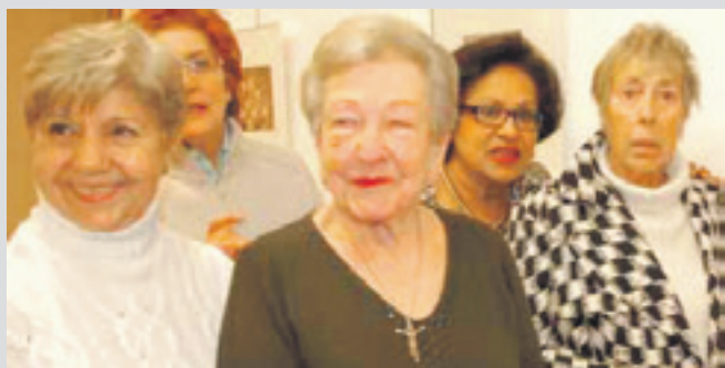
2009an Durangoko Udalak erraketistei egindako omenaldia eta erakusketa.

1940ko eta 1950eko hamarkadetan, orduko gizarteak inposaturiko ereduak gaindituta, Euskal Herriko hainbat emakume erraketista aritu zen kirol profesionalan. Kuban eta Mexikon ere aritu ziren. Pilotalekuak jendez lepo betetzen zituzten. Durangaldean ere hainbat erraketista izan zen.