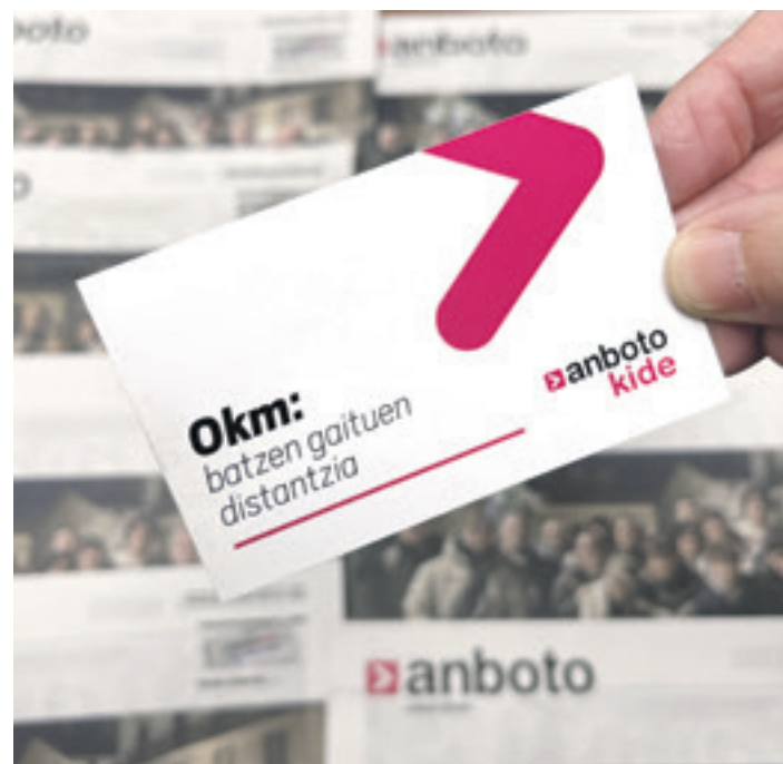
Anbotokide direnek jasotzen duten txartela.