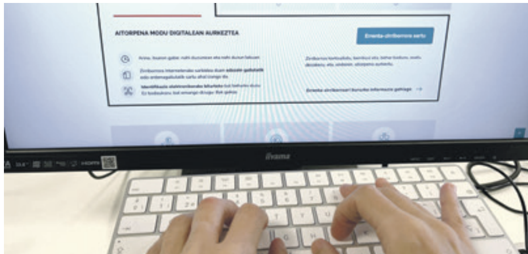
Errenta aitorpena Internetez egiten duenak euskarazko bertsioa jaitxi dezake.

UEMAK, Udalerri Euskaldunen Mankomunitateak, errenta aitorpena euskaraz egiteko kanpaina hasi du udalekin eta hainbat erakunde publikogaz batera. Eskualdeko datuek erakusten dute oraindino kontzientziazio lan handia dagoela egiteko