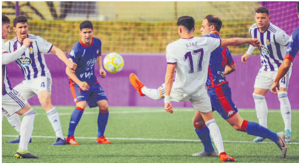
Amorebieta Futbol Klubak urte dezente daramatza Bigarren B Mailan.

Hirugarren Mailatik Bigarren B Mailara igoerarik ez egotea zen Amorebietaren iritzia. Zelaian eta