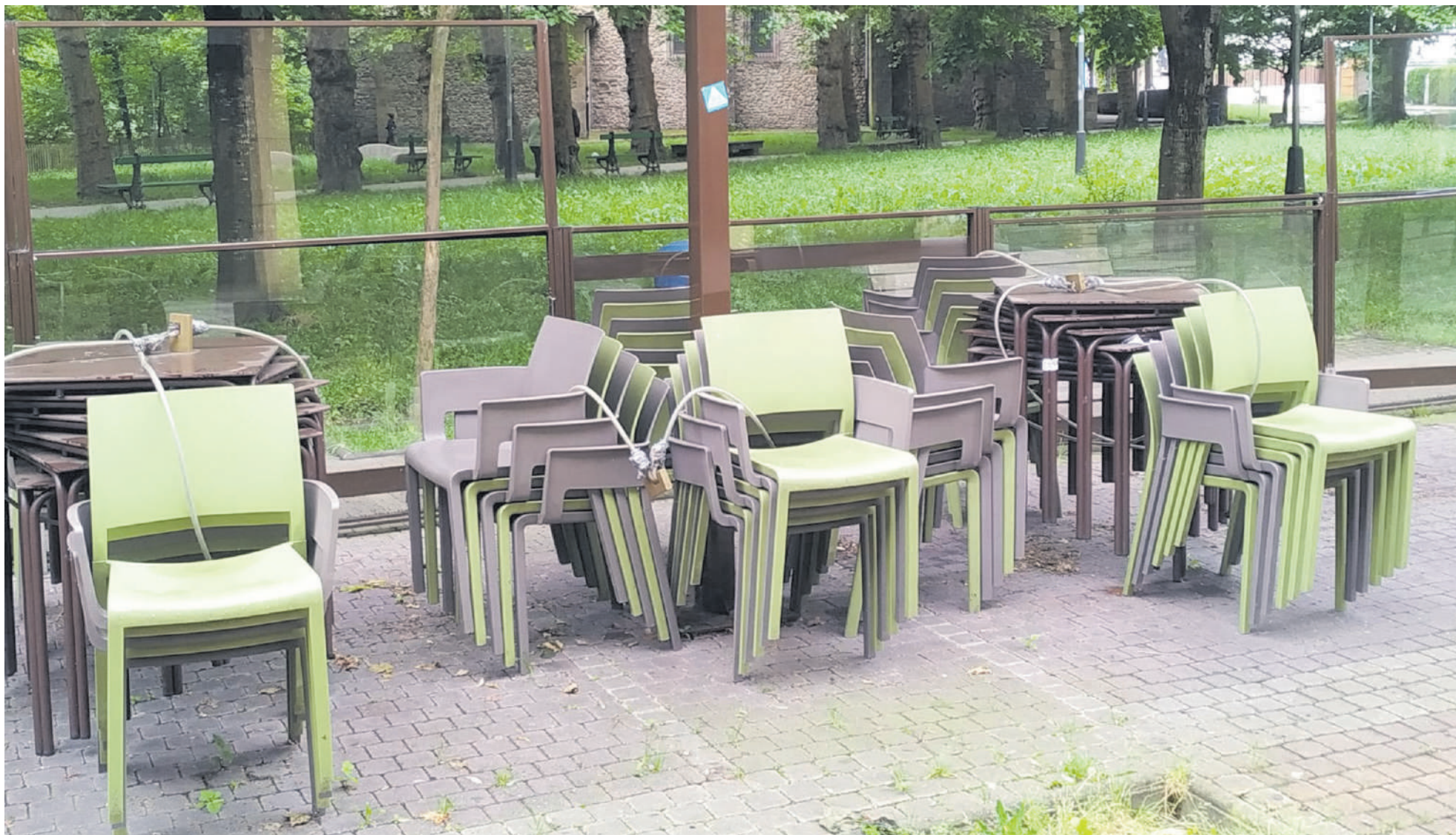
Taberna batzuetako terrazak beteta egon dira, baina beste ostalari batzuek ez zabaltea erabaki dute.