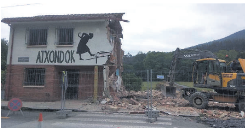
Martitzenean, Maisuen etxea eraitsi zuten.

AHTrik Ez plataformako kideek elkarretaratzea egin zuten astelehenean, Atxondoko udaletxearen aurrean