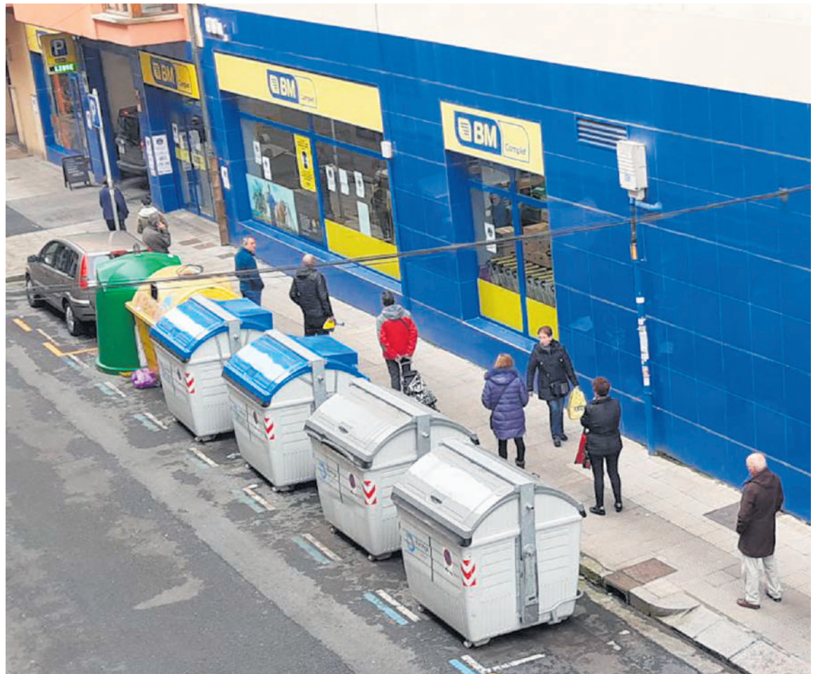
Durangoko supermerkatu honetan bezeroak metro eta erdiko distantzia mantendu dute.