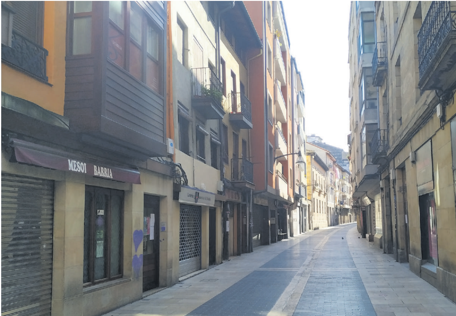
Durangoko Alde Zaharra domeka arratsaldean, hutsik.

Kolektiborik ahulenen aldeko zenbait neurri hartzen hasi dira erakundeak; "Gutxienez" hamabost egun iraungo duen alerta egoerak kaleak hustu ditu