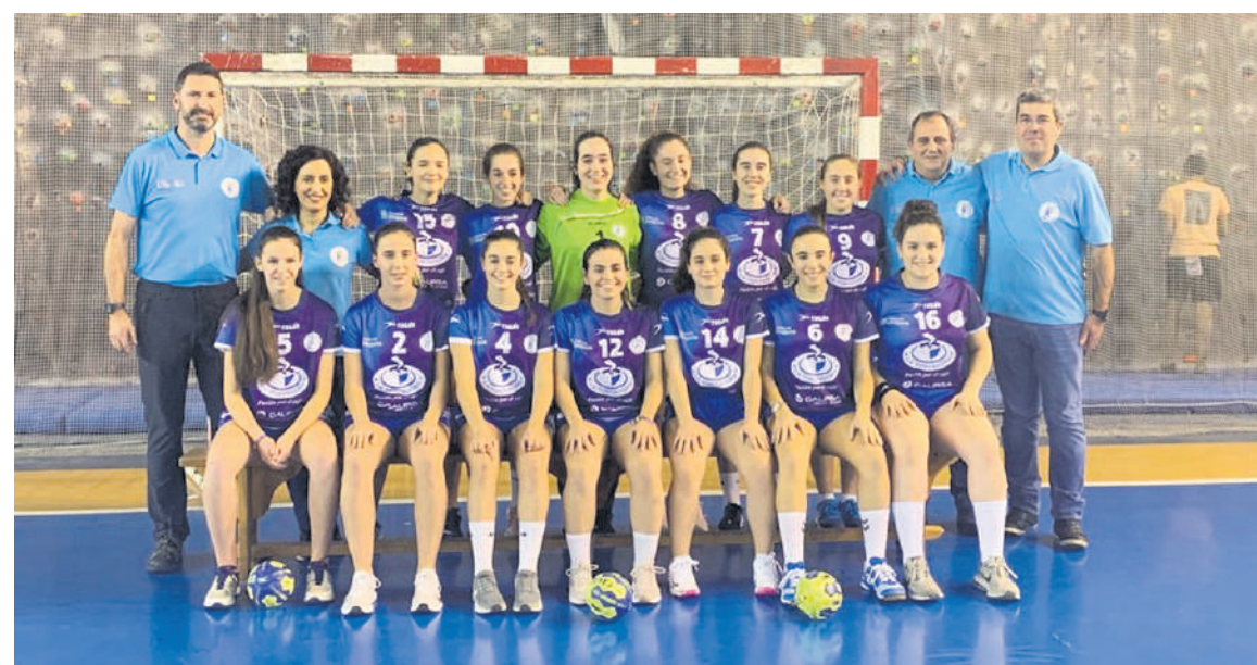
Ibaizabal klubeko gazteen taldea, iazko abenduan egindako aurkezpenean.

Ligan partidu guztiak irabazi dituen Barakaldoko Zuazo taldearen kontra jokatuko dute finalerdia, zapatuan