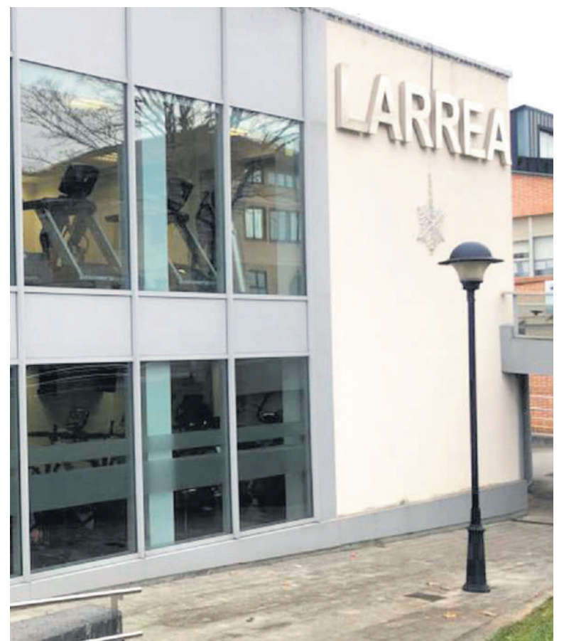
Lanuzteek Zornotzako Larrea kiroldegian izan dute eragina, besteak beste.

ELAren jarrera giltzarria da negoziazioetan. Kontuan hartu behar da balizko akordio batek izaera orokorra hartuko duela, baldin eta langileen erdiek babesten badute. ELAk kiroldegietako langileen %51 baino gehiago ordezkatzeko duenez, berak du negoziaketetako giltza.