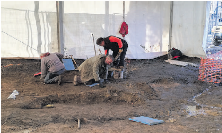
Ikerketa taldea Otxandioko indusketa gunean lanean.