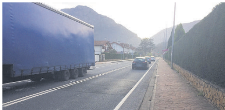
Izurtzako Udala urte askoan dabil autoen gehiegizko abiadurari aurre egiteko neurriak eskatzen.

Besteak beste, Izurtzako herrigunean semaforo berri bi eta zebraideak egitea aurreikusten du egitasmoak