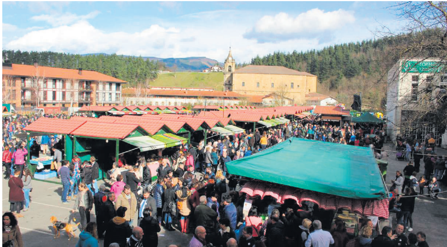
Otsailaren 3an, San Blas egunean, hainbat bisitari ibiliko da Abadiño kaleetan.

Txanporta inguruan 27 artisau batuko dira, euren artisau lanak erakutsi eta saltzeko. Bestalde, abelburu erakusketak arraza garbiko 50 abelburu, mando eta pottoka batuko ditu, Solozabal kalean; baita Euskal Herriko zaldiak ere.