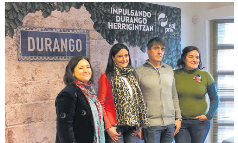
Durangoko EAJko kideek astelehenean egin zuten agerraldia.

"egoera larriagotu" egin dela esan dute. Bestalde, aurrekontu parte-hartzaileek "gastu inportante" bat eta herritarrenganako "engainu txiki bat" eragin dutela ere gaineratu dute. "Gobernu taldeak alde aurretik proposatzen zituen ideiak balioztatzen" balio izan dutela uste dute jeltzaleek.