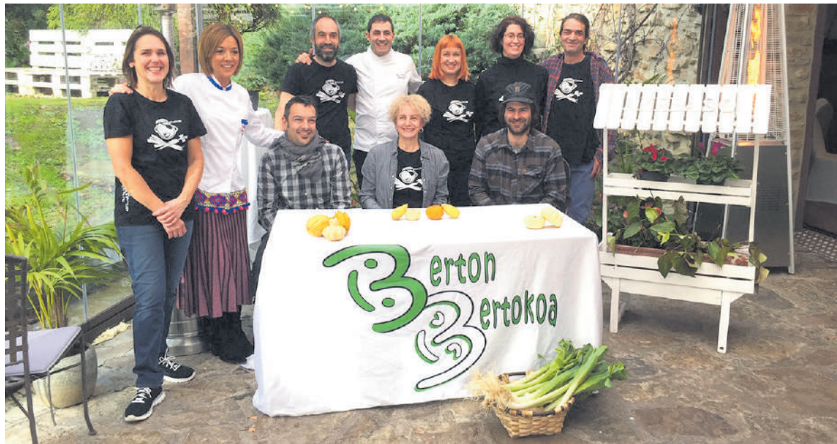
Berton Bertokoako eta Elikadura Burujabetza erakundeko kideak, joan zen astean, Akebaso jatetxean eskainitako prentsaurrekoan.