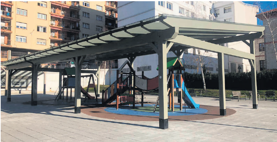
Egur House System enpresak egin du aterpea.

Aterpea ipintzeak 90.000 euroko kostua izan du guztira. Diru kopuru horretatik 37.500 euro inguru Bizkaiko Foru Aldundiak finantzatu ditu. Gainerakoa ordaintzeko ardura Zaldibarko Udalak hartu du bere gain. Egur House System enpresak hasi eta amaitu ditu aterpea egiteko lanak.