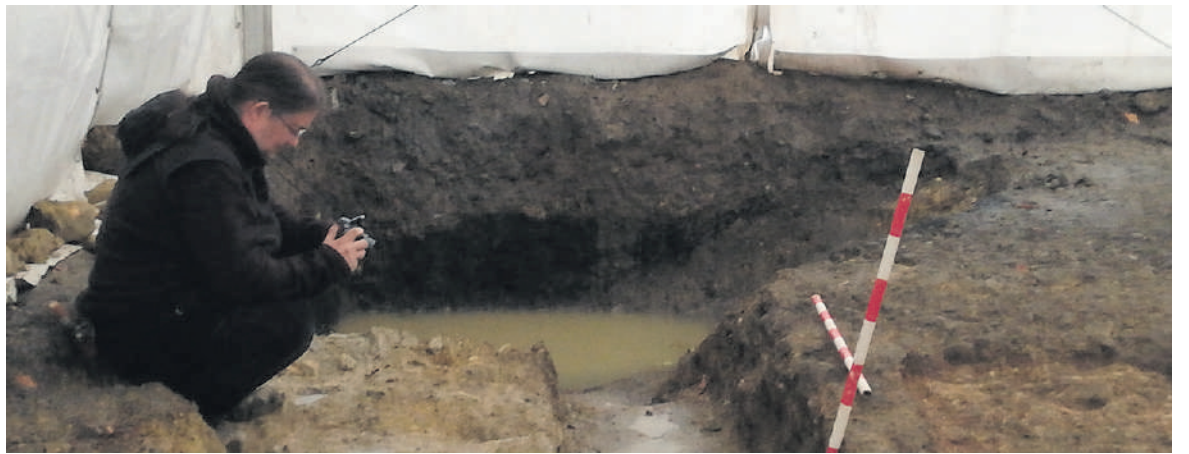
Iturri publikoaren aztarnak: hobia eta bertara doan kanalizazioa.