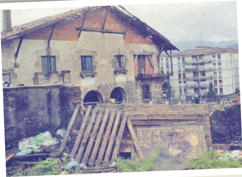
Behinola kamineroa bizi zen eraikin horretan.