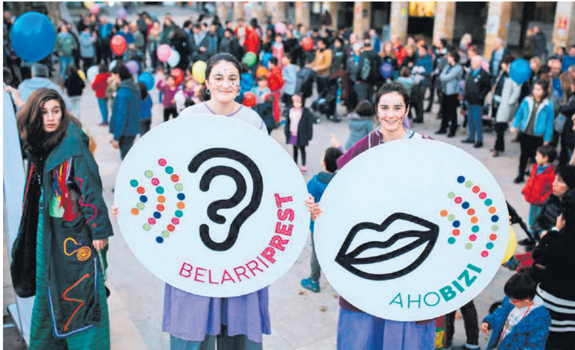
2018ko Euskaraldian egindako argazkia.

Aurtengo ekimenaren inguruko azalpenak emateko eta Durangoko batzordea martxan ipintzeko deitu dute batzarrera; aurten, euskararen entitateei zuzenduta egongo da