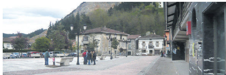
Txostenean jasotako beharrezanetan lehentasunak markatuko dituzte.

dute. Orain, beste batzar txanda batean, beharrezan zerrendako lehentasunak markatzen dabilta, nagusiekin eurekin elkarlanean. Prozesu horretako hurrengo batzarra astelehenean izango da, 17:00etan, kultur etxean.