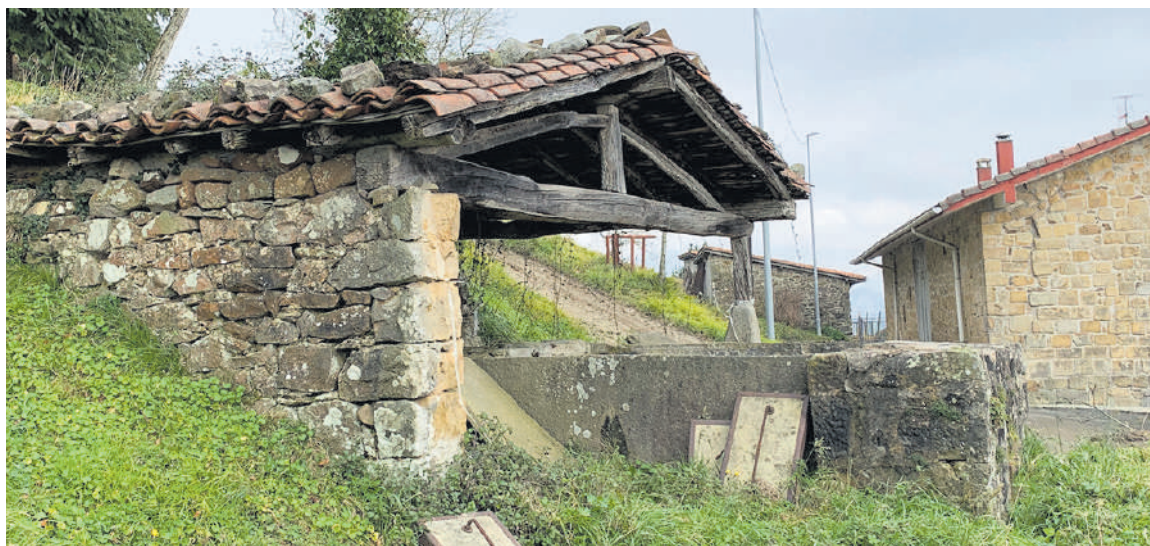
Zengotitako garbitegian teilatua eraberrituko dute, besteak beste.

Aurtengo aurrekontuak iazko azaro amaieran onartu zituzten eta urtarrilaren 3tik indarrean daude. EAJren aldeko botoekin irten ziren aurrera. EH Bildu abstenitu egin zen. Mallabian gazteleku bat sortzea da udalaren aurtengo beste helburu bat, eta, horretarako, 100.000 euroko atala gorde dute.