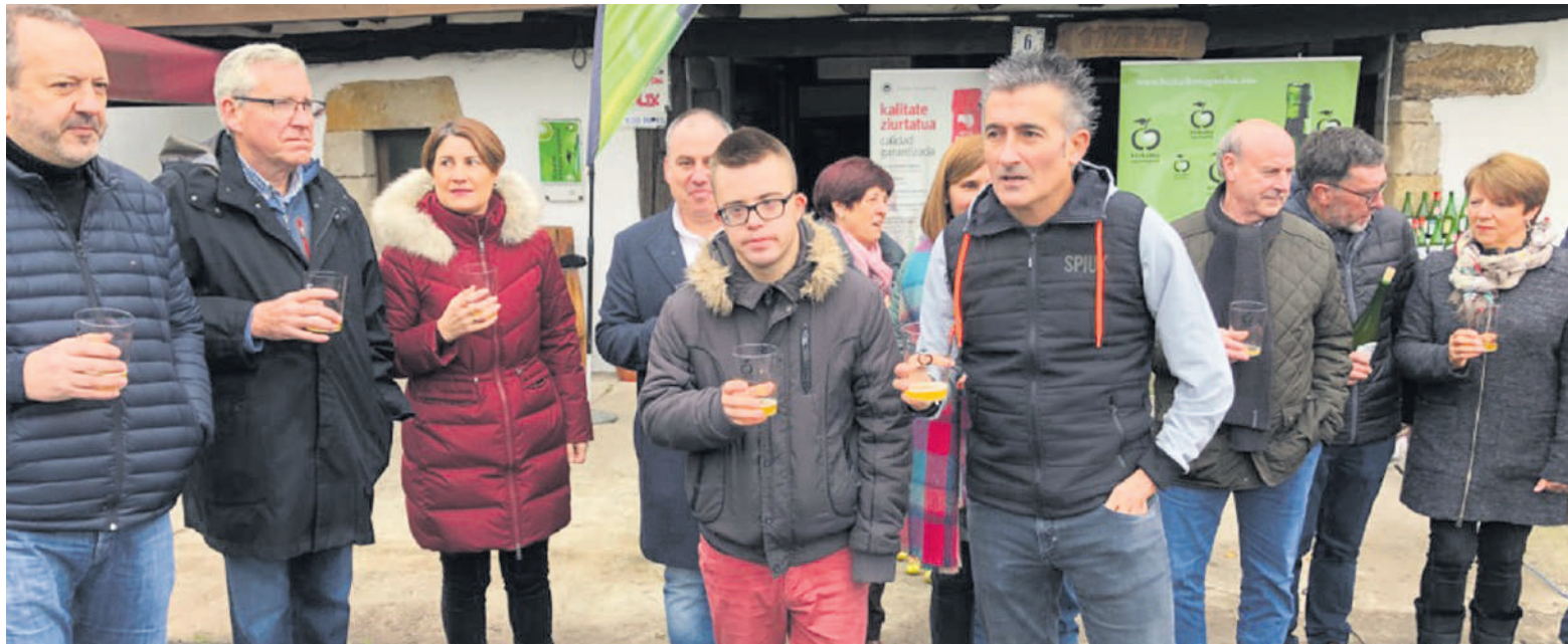
Ekoizleek, agintari politikoek eta sagardo denboraldia zabaldu duten protagonistek Zornotzako Uxarte sagardotegian bat egin zuten egunean.

Zornotzako Uxarte sagardotegian zabaldu dute, asteen, Bizkaiko sagardoaren aurtengo txotx denboraldia