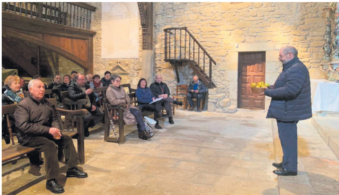
Elizpean barik, Elizabari barruan egin dute aurtengo erremata.