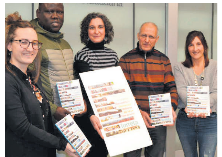
Udal ordezkariak eta lurretako elkarreetako kideak prentsaurrekoan.