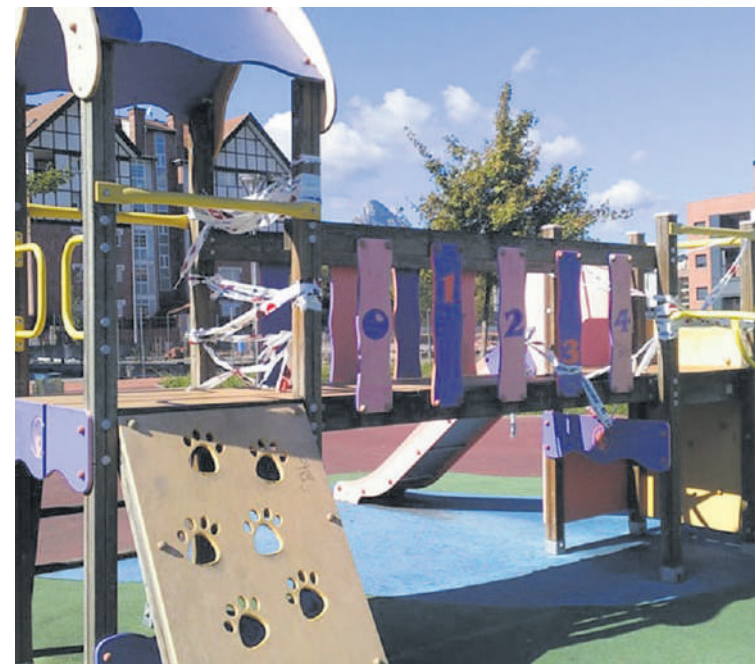
Muntsartz auzoko jolasgunea.

EH Bilduren ustetan, egoera konpontzeko, jolasguneetarako ekintza plana prestatu beharra dago. "Herriko haur eta gazteek gune seguru eta erabilgarriak izan ditzaten, beharrezkotzat jotzen dugu prebentziozko mantentze-plan bat gauzatzea, guneen jarraipen egokia eginez eta plana garatzeko beharrezkoak diren bitartekoak eskainiz", esan dute.