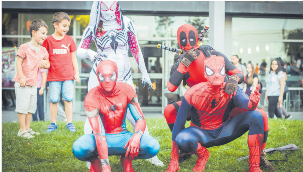
Iazko Mangamoreko argazkia.

berezia eskaini diote kirolari. Horrela, gune laranjan (Larrakon) V. Quidditch txapelketa jokatuko da. Arte martzial ikuskizunak egongo dira aurtengoz; karate, ninjutsu eta aikido ikuskizunak, hain zuzen ere.