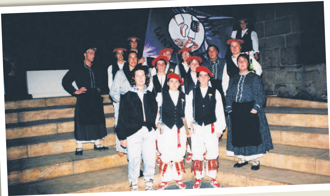
1997an ateratako argazkia.