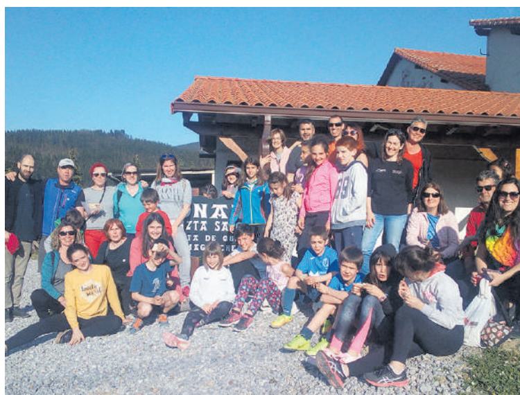
Iazko ibilaldian parte hartu zuten mallabitarrak, herriko gazta ekoizle baten baserrian.

Ekimenak udalaren babesa du eta Mallabiko eskolako umeek parte hartuko dute. Izen-ematea eskolan eta liburutegian egin daiteke.