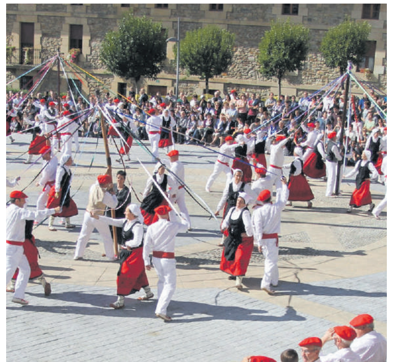
2014an ospatu zuten azken Urriena Lurretan.

sera pasatu aurretik, ahalegin hori egin zutenei merezi duten errekonozimendua aitortu behar zaiela pentsatzen hasi beharko genuke. Olatuak indarra hartu duenean, errazagoa da olatu hori hartzea, korronea kontrari datorrenean baino. Pertsona batzuek egin duten lana eta erakusti duten kementa aitortu beharko genuke. Gai hau mahai gainean inork ere ipini ez zuenean, ausardiaz eman zuten pausoa, baina inork ere ez ditu go-goan hartu. Azken txanpan sartu direnek, ostera, oihartzun guztia hartu dutela ematen du. Gauza hauekin zintzo jokatu behar dugu, ez direlako gai errazak, eta batzuk mintu egin daitezkeelako.