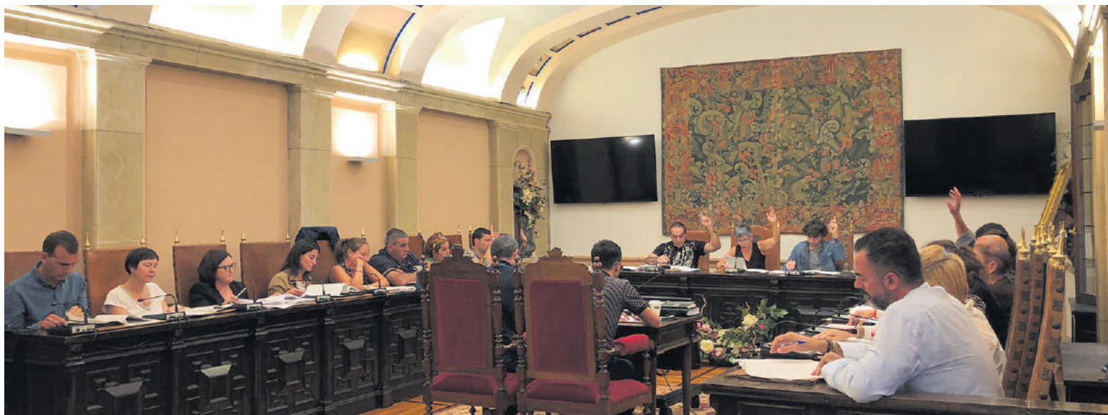
Martitzenean ezohiko osoko bilkura egin zuten Durangoko udalbatzan.