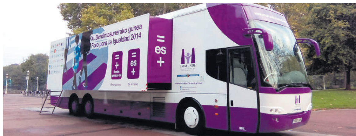
Abenduaren 13ra bitartean, Emakunderen autobusa Euskal Herriko herrietatik ibiliko da.

Berdintasunaren arloan lanean dabiltzan herriko eragileek euren ekintzak egiteko erabiliko dute autobusa