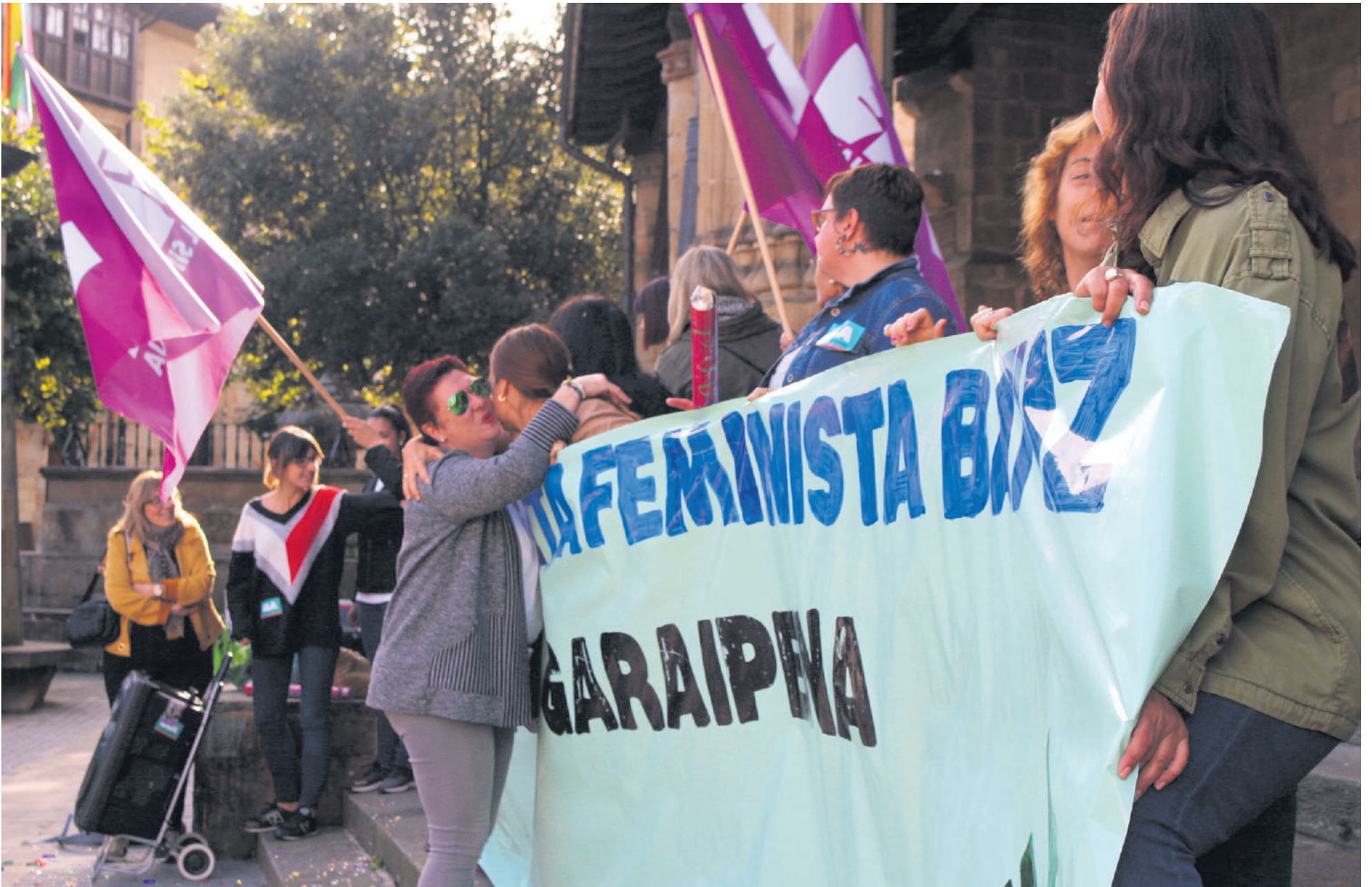
Astelehenean kontzentrazioa egin zuten udaletxe aurrean.