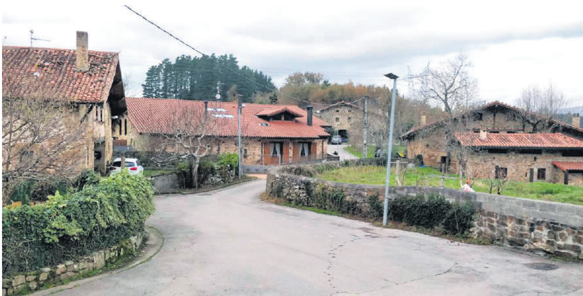
Abadiño Sagasta auzoa.