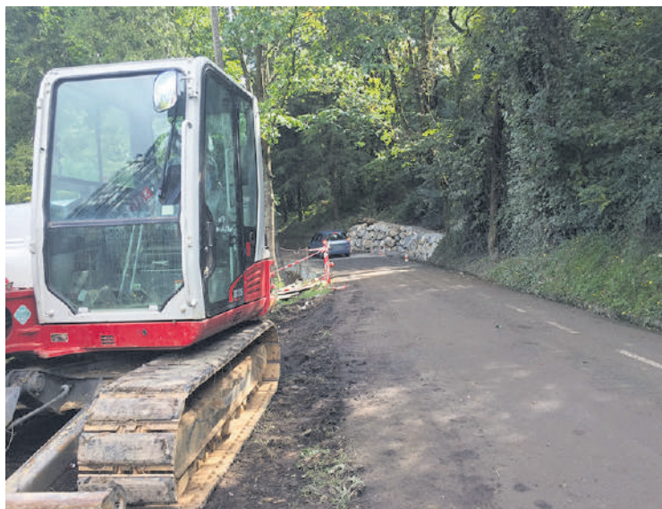
Bitaña auzorako bidean lanak egiten dabilta.

Lan horien ondoren, eta proiektu beraren barruan, Izurtzako auzoetako beste bide bitan ere egingo dituzte konpontze lanak, udal ordezkariak azaldu dutenez.