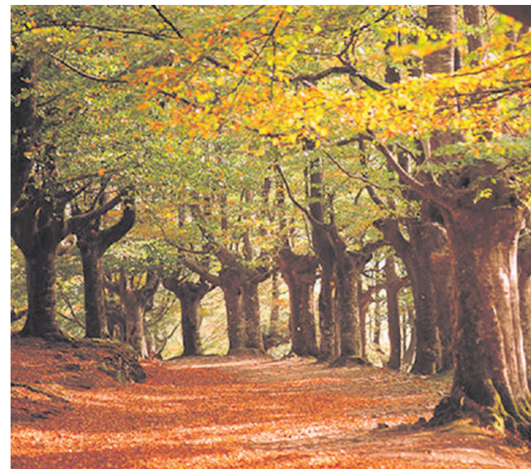
Bidean zehar hainbat geldialdi egingo dituzte.

Zornotzarrengan interes berezia sortu duen ekimena da; bete da izena emateko zerrenda