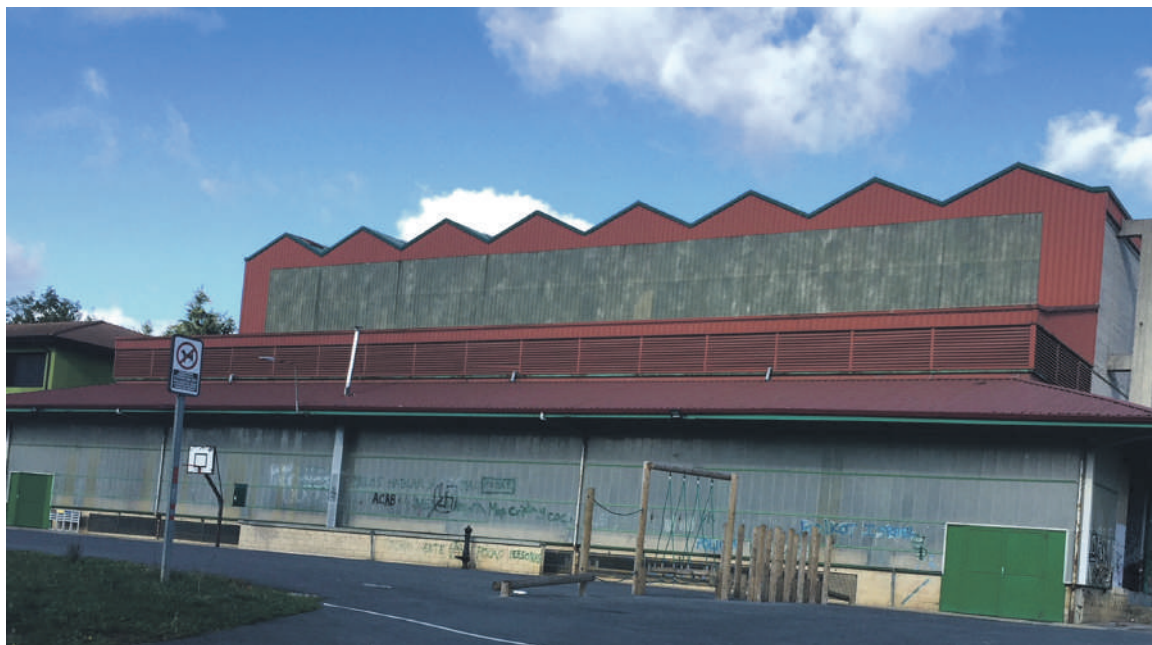
Mainondon dagoen frontoiaren azpialdeko espazioan egin dute kiroldegi berria.