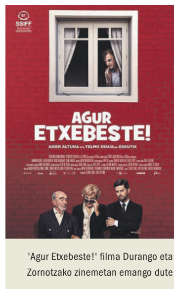
'Agur Etxebeste!' filma Durango eta Zornotzako zinemetan emango dute

IURRETA erakusketa 'Iurretak udalerrri izatea eskuratu ondorengo lehenengo sanmigelak' , Oreka tabernan. 10 argazkik osatzen dute erakusketa eta jaiak iraun bitartean egongo da zabalik.