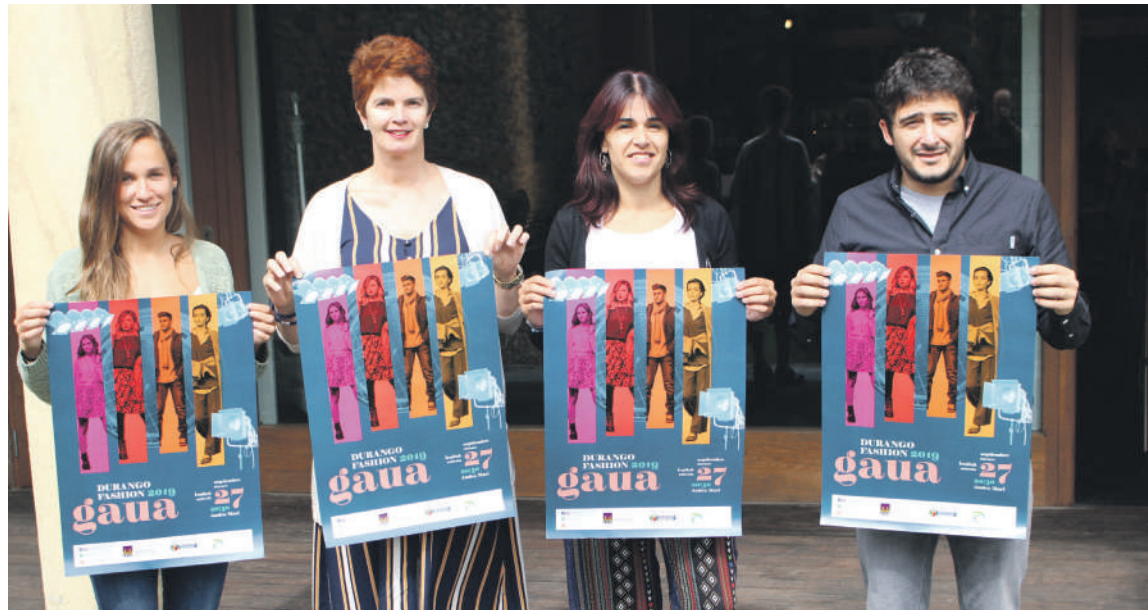
Dendak Bai elkarteak kideak, desfilea aurkezteko astelehenean eskainitako prentsaurrekoan.

Herritarrak izango dira pasarela gaineko protagonista bakarrak gaur iluntzeko desfilean