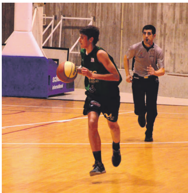
14 urterekin Kataluniara joan zen Aldekoa, Juventud taldera.

Bai, eta eskertzekoa da. Bolada txar bat duzunean, lagunekin geratzea edo gurasoak bertan izatea askoz ere hobea da ordenagailuko pantaila batetik berba egitea baino.