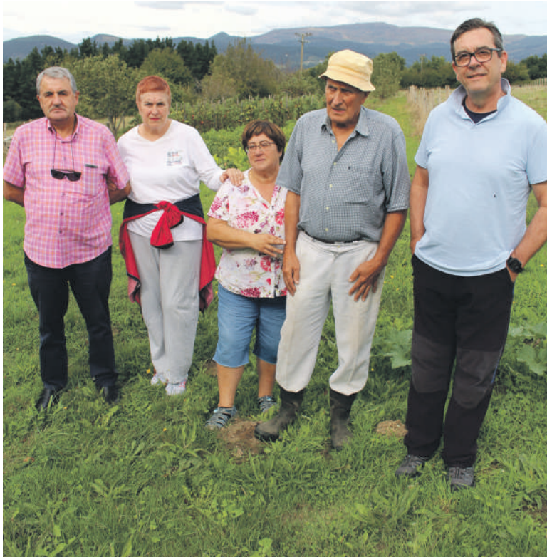
Bitañoko bizilagunak auzoko ortu batean.

Bitañoko hainbat auzotarrek etxe ondoan ehiza postuak izateak eragiten dizkien kalteak salatu dituzte