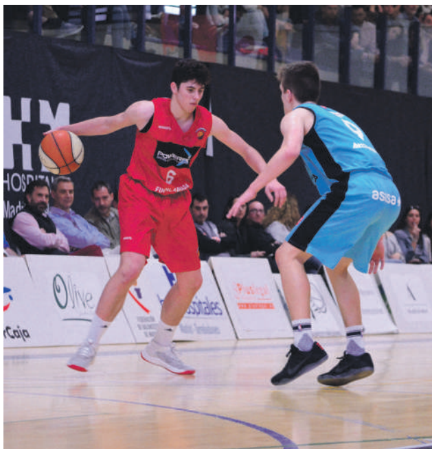
Urte bi eman zituen Fuenlabardara taldean.