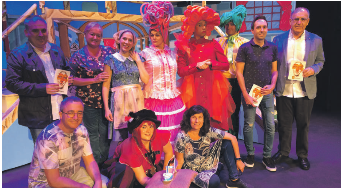
Glu-Glu konpainiako kideak, Zornotzako hainbat ordezkariagaz.

ratzi pelikula eskainiko dituzte bertan. Horrez gainera, aurten musika ardatz izango duten Europako Ondarearen jardunaldien barruan, abesbatzak, musika bandak eta pop eta rock taldeek eginiko bertsoak bilduko dituzte.