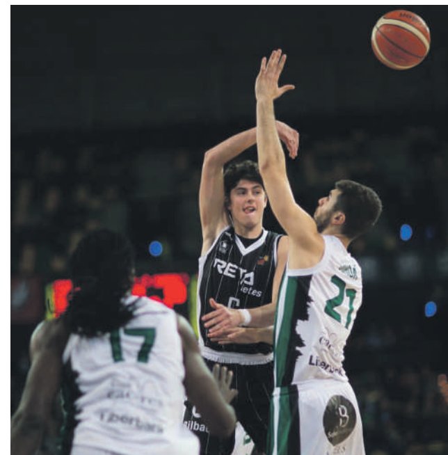
Iaz, Urrezko Ligan zebilen Bilbao Basket-ekin partidu bi jokatu zituen.