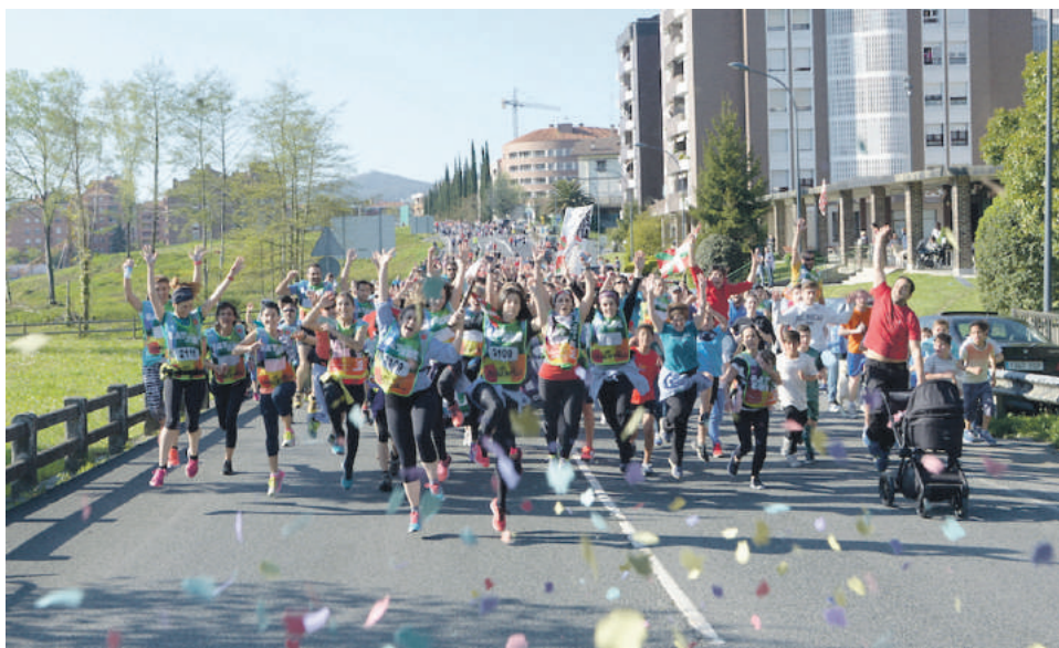
2017an Zornotza atzean utzi zuen unea.