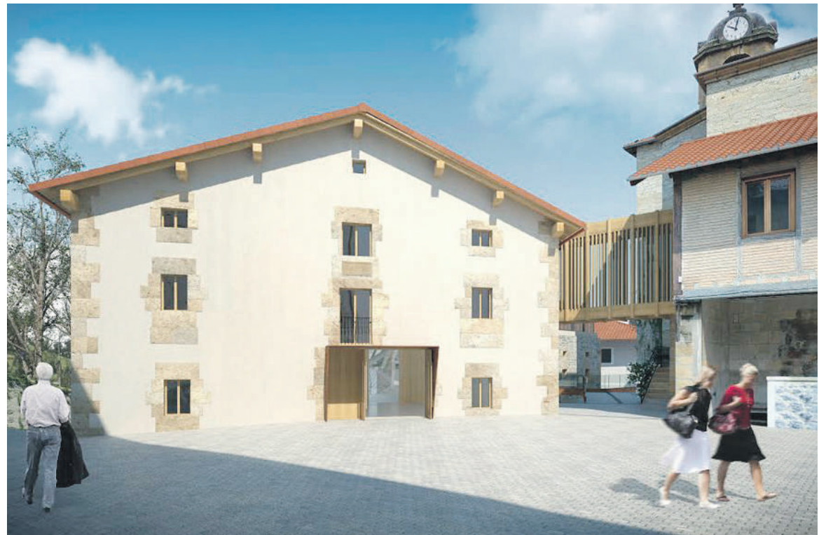
Kultur Etxea izango denaren irudia.

Eskolaren urbanizazio faseagaz batera, Zaldibarrek datorren urterako duen proiektu nagusietako