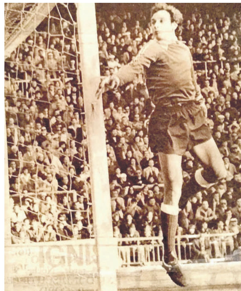
1971tik 1974ra bitartean, hiru denboraldi jokatu zituen Valentzia taldeagaz.

Gaur egun arazo bat izango zen, baina garai hartan, ez. Ez zegoen hainbeste kontakturik, ezta amarrukeririk ere. Jokoa askoz ere garbiagoa eta ondratuagoa zen.