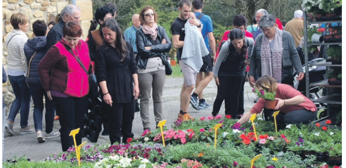
Elizatik hilerrira bidean ipintzen dituzte postuak.