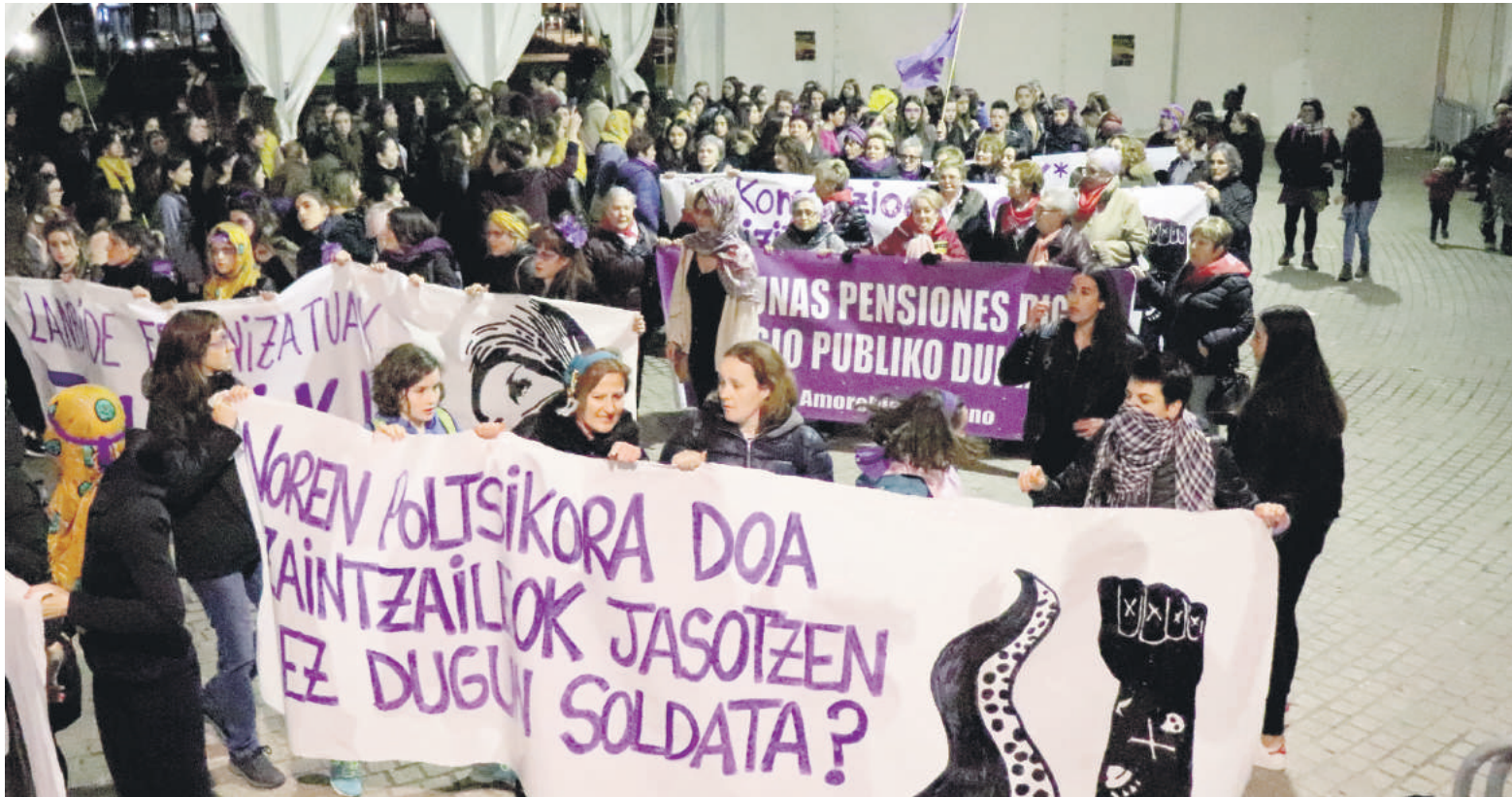
Azken lau urteetako datuak kontuan hartuta, indarkeria matxistaren 90 kasuren berri izan zuten Zornotzan.

Kasu horiei modu koordinatuan erantzuteko helburua duen erakundeen arteko protokoloa onartu zuten udalbatzarrean