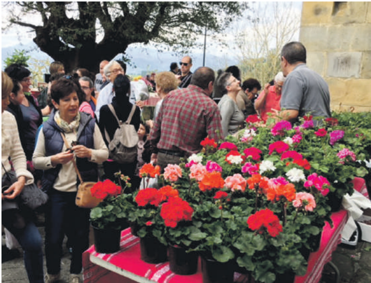
Askotariko loreak izaten dira salgai azokan.