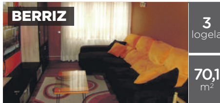
BERRIZ 3 logela 70,1 m 2 BERRIZ: Erdigunean. 3 logela, egongela, sukaldea jarrita, komuna eta balkoia. Trastelekua. Egoera onean, berogailu elektrikoak kontsumo baxukoak. Mendebaldera eta ekialdera begira 180.000€