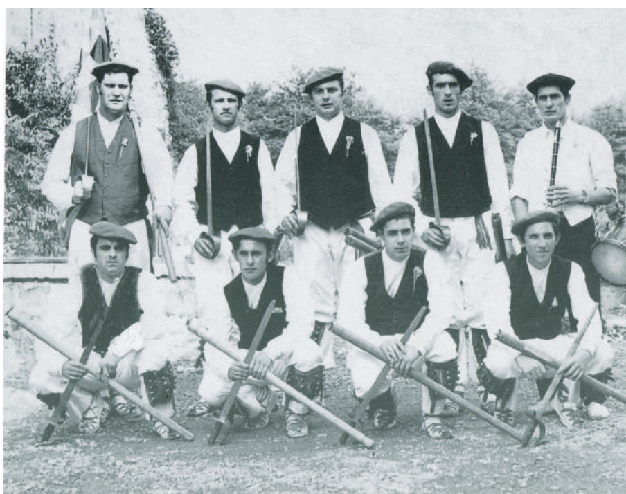
'Txiflis', beheko lerroan lehenengoa eskumatik.