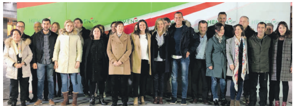
EAJk Durangon eginiko ekitaldiaren irudia.