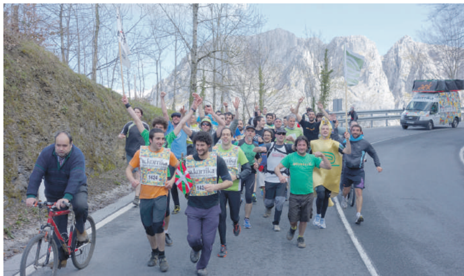
2013an Urkiolan behera etorri zen lehenengoz Korrika. Mañaria eta Izurtza zeharkatu zituen gero.