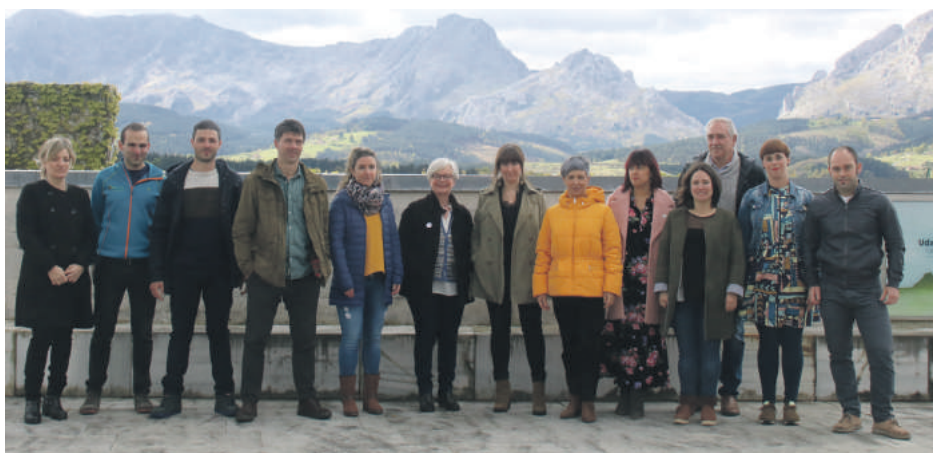
Abanzabalegi eta EH Bilduren eskualdeko alkategaiak, domekan, Gerediagan.

Bestalde, Iurretako EH Bilduk aurkeztu du zerrenda. "Esperientzia eta ilusioa" batuz herritarrekin lan egiten jarraitu gura dutela adierazi dute. Abadiñon gaur aurkeztuko dute zerrenda, Traña-Matienan, 19:00etan. Durangon, lokala inauguratuko dute Baurenkalean, gaur, 20:30ean.