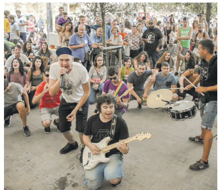
Elektro Txufla txaranga izango da Udaberri jaiko osagaietako bat.

Jai giroak gauean jarraituko du, Elektro Txufla txarangagaz. Iaz Otxandioko santamania jaien barruan San Martin egunean jo zuen talde bera da. Orduan herrian jarri zuen jai giroa gustatu zitzaieen antolatzaileei, eta Udaberri Jaia ekartzea erabaki dute. 23:30ean hasiko dira kaleko giroa alaitzen, eta 21. Korrika etorri arteko lotura izango dira.