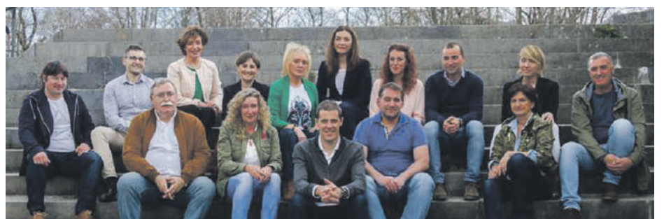
Abadiñoko EAJko kideak.