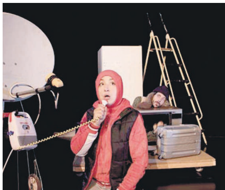
Limbo Planeta. Dejabu Panpin Laborategia.