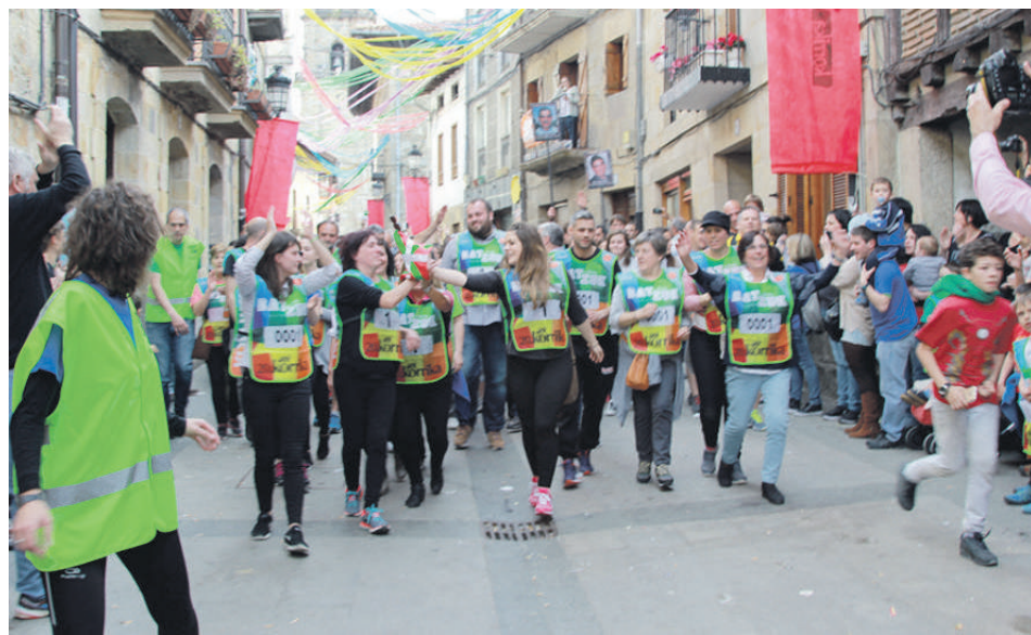
2017an Otxandion hasi zen 20. Korrika, eta Iruñean amaitu.