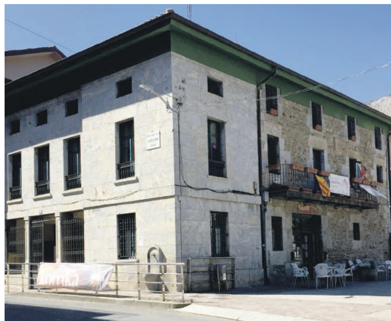
2018ko likidazioa itxi berritan jakinarazi dituzte udalaren egoerari buruzko datuak.

Gobernu taldearen iritziz, datu hori erakundearen "aurrekontu-egonkortasun eta ekonomikoaren" isla da