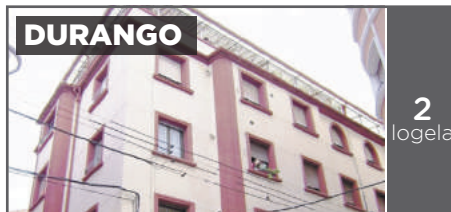
DURANGO 2 logela ZEARKALEA: Igogailuarekin. 2 logela, sukaldea jarrita eta bainugela. Dena kanpora begira. Ekialdera begira. 130.000€