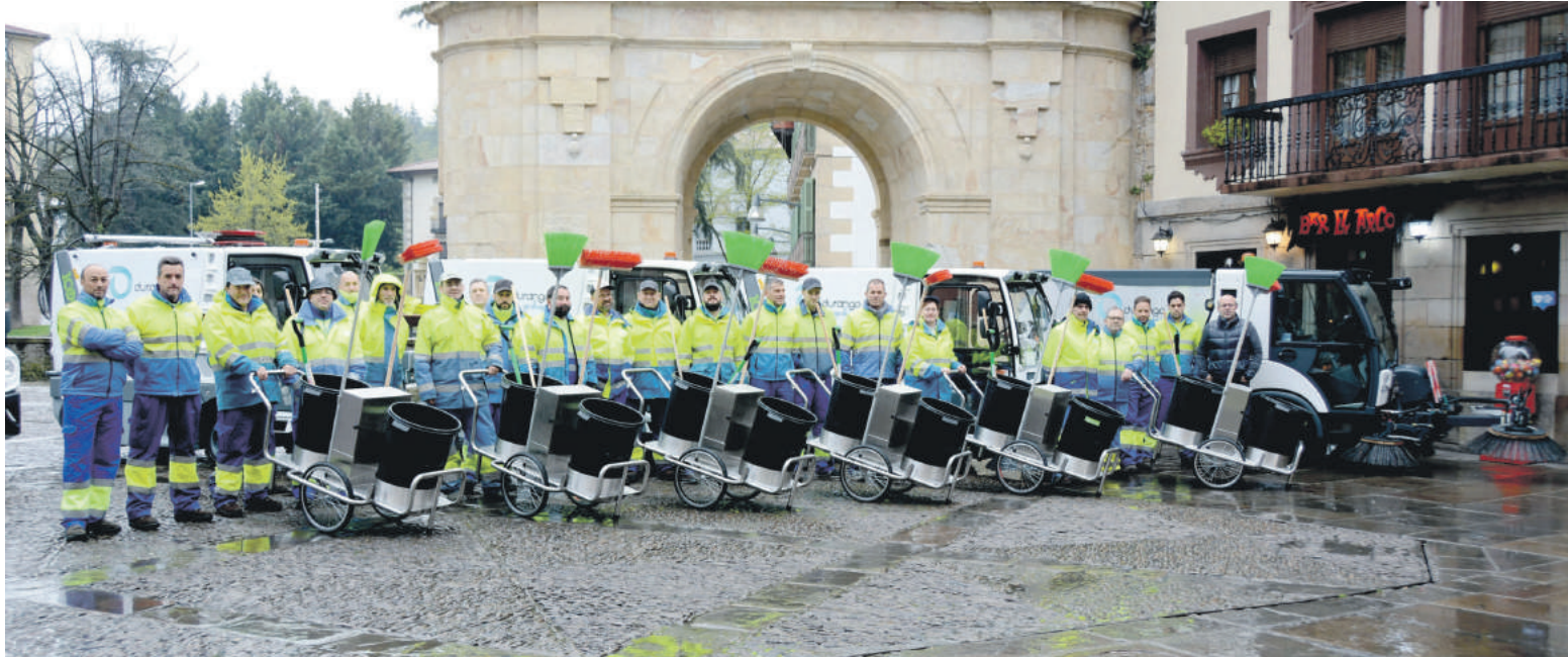
Kaleak garbitzen eta hondakinak batzen ibiliko den behargin taldea, Santa Anan ateratako talde argazkian.

Erdiguneko eremuan arratsaldeko erreposoa gehitu dute, eta kanpoaldeko auzoak astean bost bider garbituko dituzte