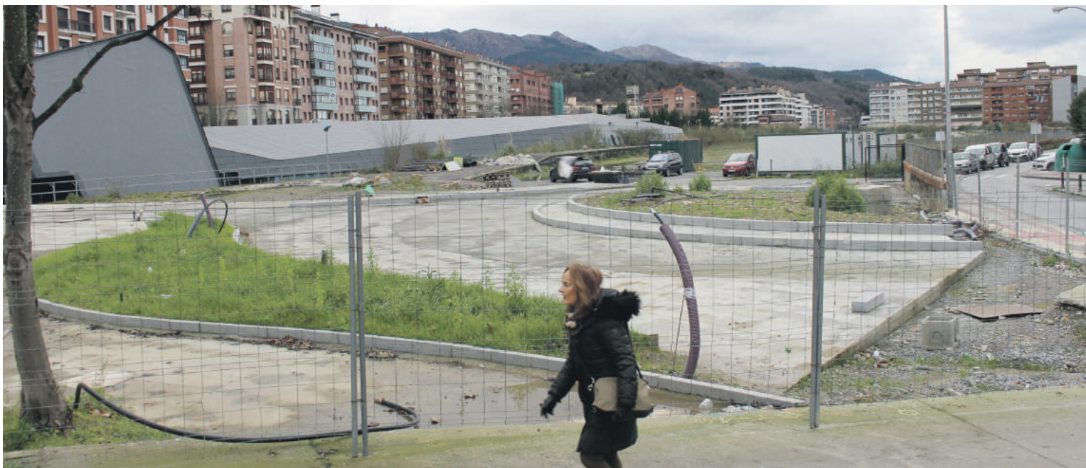
Estazioko planak atzerapauso bat eman du, baliorik barik geratutako hitzarmena beharrezkoa delako proiektua garatzeko.