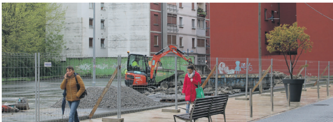
Tellitun 75 aparkaleku inguru egon dira egoiliarrentzat, eta beste batzuk egokitu dituzte herriko beste toki batzuetan.

Hamar urtetik gora dira lursail hori aparkaleku modura erabili du-