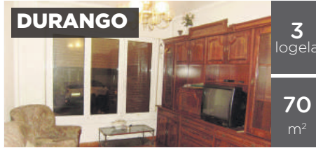
DURANGO 3 logela 70 m 2 ANTSO ESTEGIZ: 70 m2, 3 logela, bainugela (berriztatua dutzarekin). egongela, sukaldea jarrita. Egoera onean. 160.000€