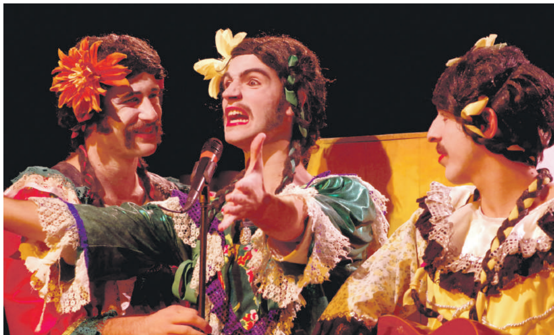
'Y me mori' kabaret mexikarra.

Emanaldiei dagokienez, Y me mori kabaret mexikarragaz hasiko da Topaklown, apirilaren 17an. LíquidoTeatro&DuoFácil konpainiaren ikuskizuna Euskal Herrian ikusleko lehenbiziko aukera izango da hau. Ez da kasu bakarra izango. La Tal (Herrialde Katalanetatik) eta Carnage (Frantziatik) konpainiek The Tapas eta Italino Grands Hotel ikuskizunak lehenbizikoz antzetzuko dituzte Euskal Herrian. Zanguando konpainia ere egongo da to-