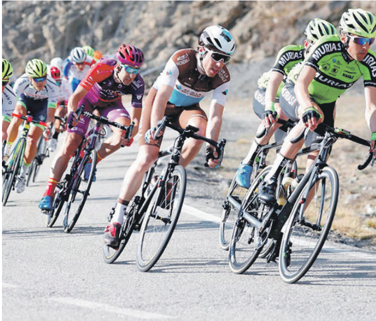
Autzagane eta Muniketa hiru bider igoko dituzte txirrindulariek.

Azken lau edizioak irabazi dituen Movistar UCI Pro Tour mailako talde bakarra izango da domekako lasterketan