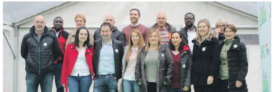
Elorriko Batzoki aurrean egin zuten ekitaldia.