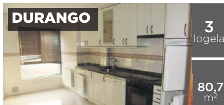
DURANGO 3 logela 80,7 m 2 ASKATASUN ETORBIDEA: 3 logela, egongela, sukaldea jarrita (beste bainugela bat ateratzeko aukera). Gas natural berogailuak. Igogailua. 180.000€