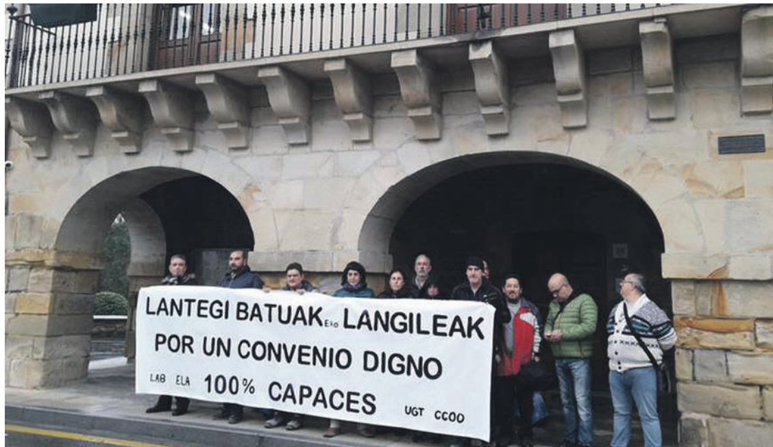
Abadiñon elkarretaratzea egin zuten langileek azaroaren 12an.

LAB, ELA, UGT eta CCOO sindikatuek babestu dituzte langileen eskaerak