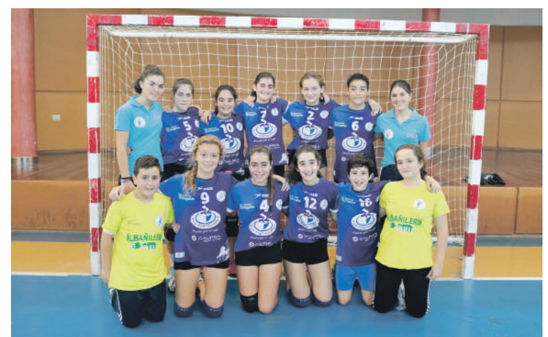
Kadeteetako lehenengo urteko taldean mutil bi dabilta.