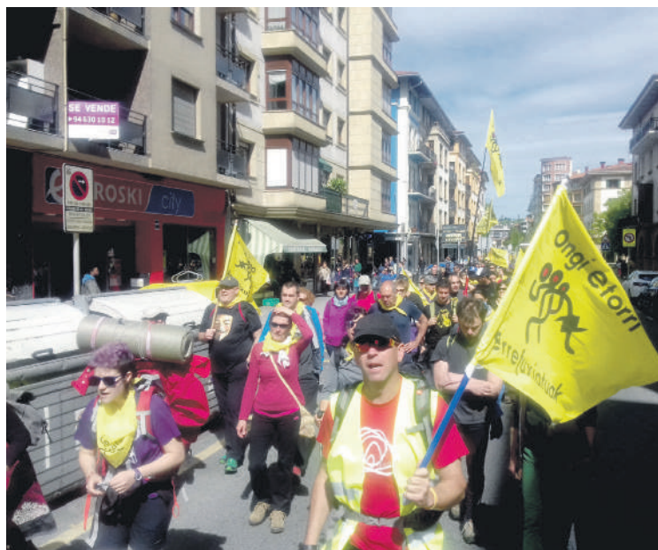
Zornotzan errefuxiatuen alde egindako ekitaldi bateko irudia.

Besteen errealitatea ezagutzeko helburua duen ekintza Hortzmuga taldeak gidatuko du Zornotza aretoan