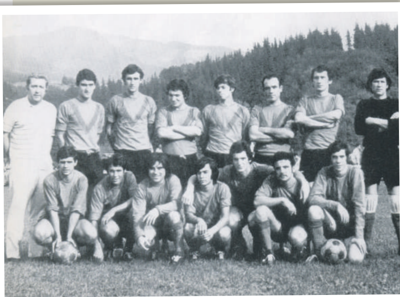
Azkarate goiko ilaran ezkerrekoa da; Gorroño goiko ilaran ezkerretik hirugarrena