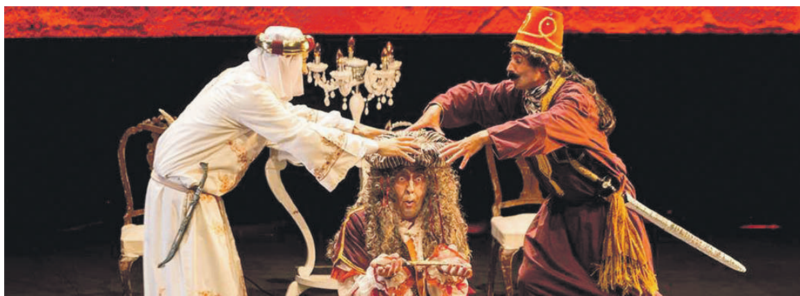
Un Burgués Gentilhombre.

Martxan da Abadiñoko antzerki jaialdiaren laugarren edizioa; sarrerak 3 euroan daude