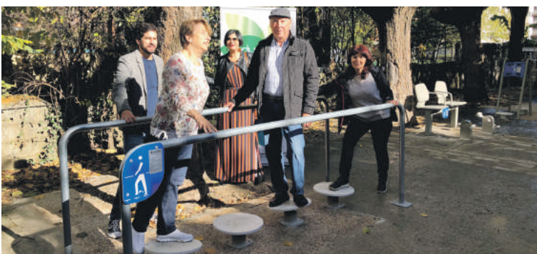
Gizarte Ekintza Saileko arduradunak, zenbait nagusigaz, aurkezpenean.

Gunera ezartzeko, guztira, 18.150 euroko inbertsioa egin du Durangoko Udalak.