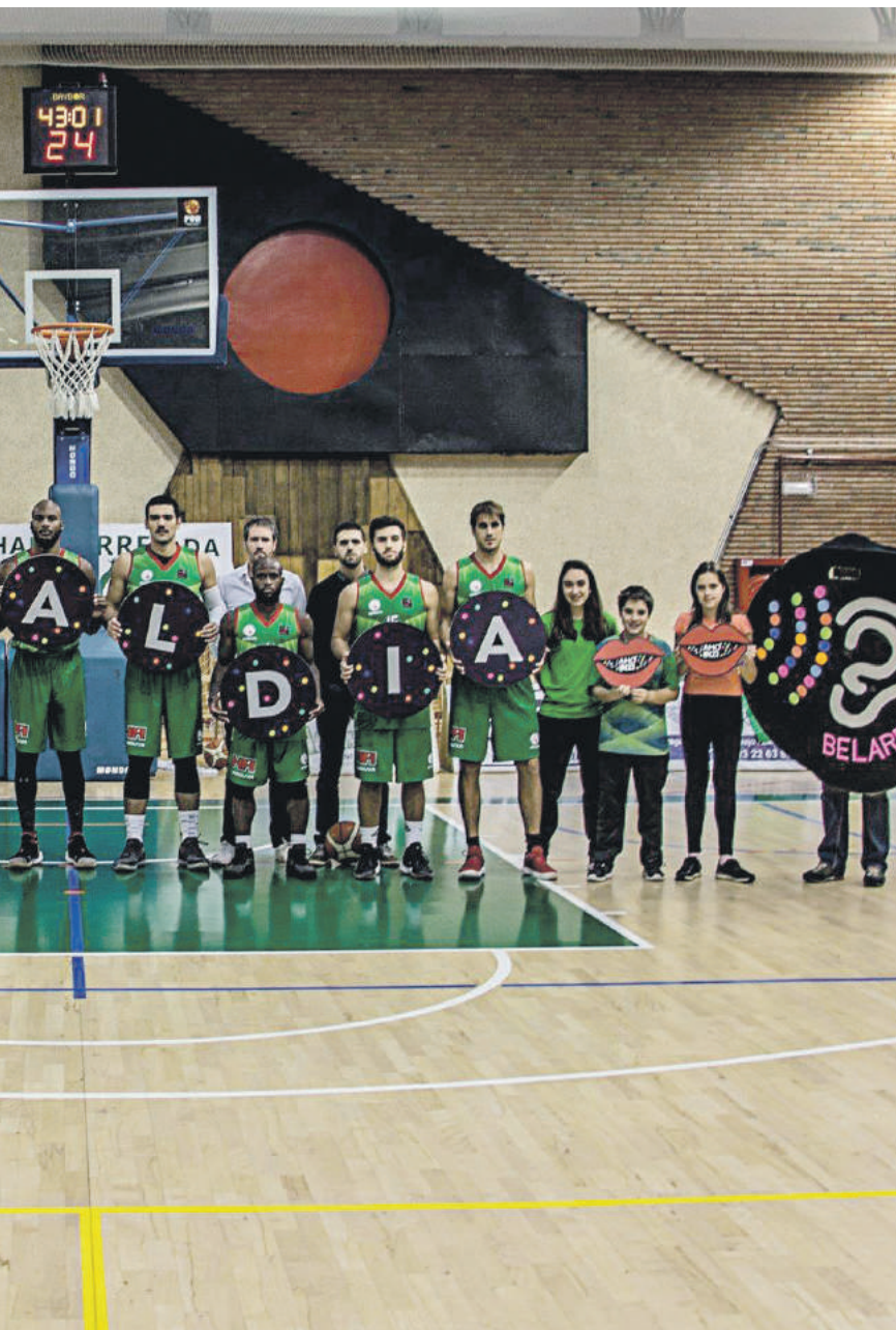
Euskaraldia aurkezteko, ekintza ugari egin dituzte herririk herri.