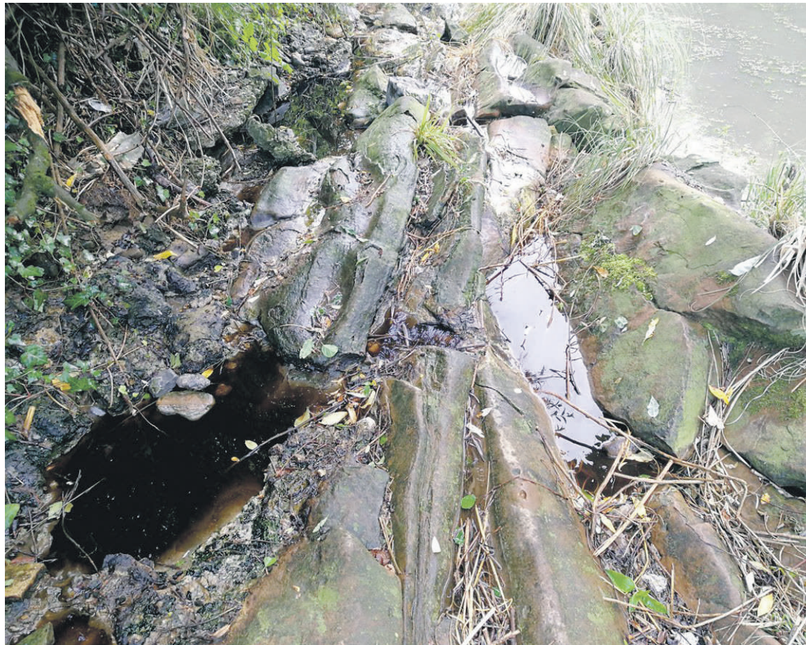
Ibaizabal errekan joan zen asteen ere ikusi zitekeen isurketa, EH Bilduk erakutsitako argazkiak islatzen zuenez.