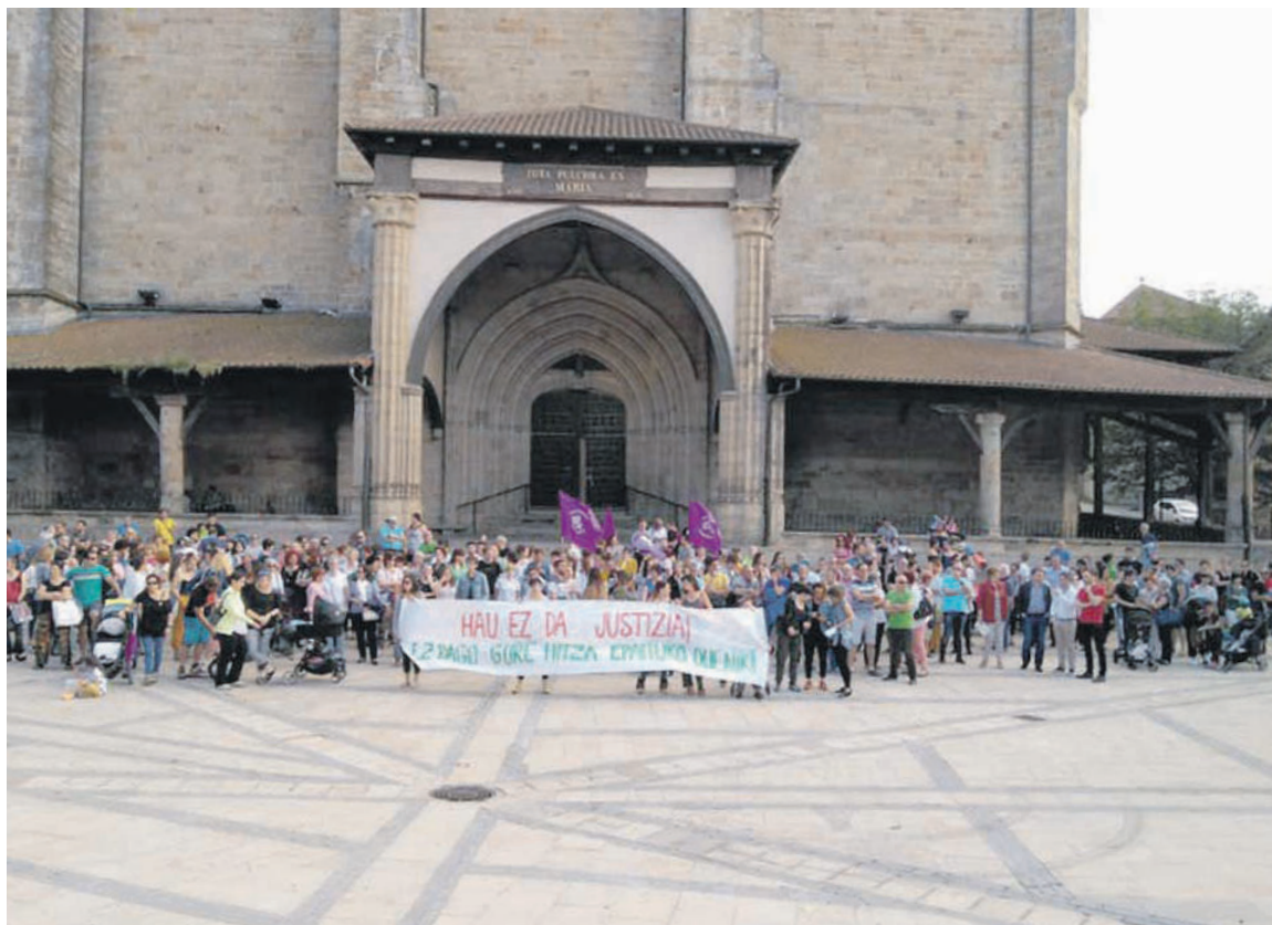
Ekainean egindako elkarretaratze bateko argazkia.