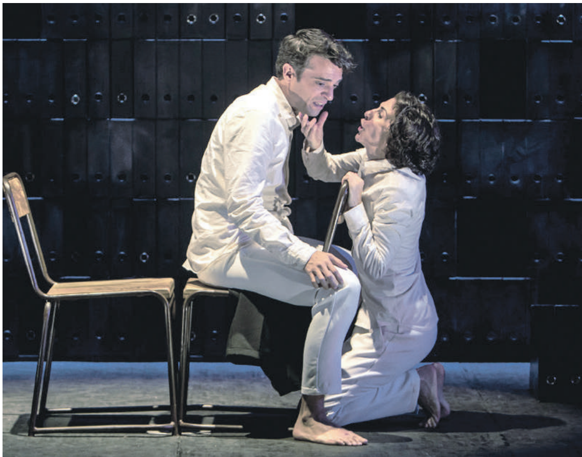
Lorcaren dualtasuna islatzen du obrak.

'Lorca, la correspondencia personal' antzezlanak ikusgai egongo da asteburuan