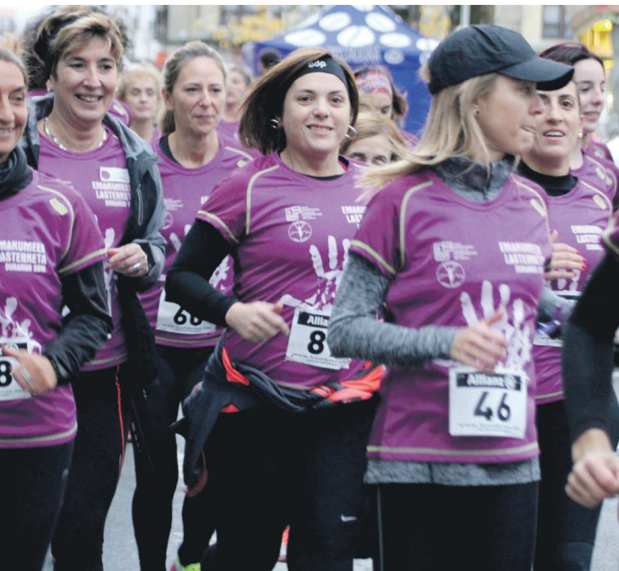
lazko Emakumeen Lasterketako argazkia.

Prozesu guztia grabatu egingo dugu, hasieratik amaierara. Transformazio guztia iruditan jasoko dugu. Hau guztia azaroaren 29an aurkeztuko dugu, Errota kultur etxean, 19:00etan. Berbaldira labur batean, obra zein izan den eta emaitza zein izan den azalduko dut. Agian horma ez da guztiz eraitsiko. Hori ikusi egin beharko dugu. Herritarrek ze esaldi idatzi dituzten ere ikusiko dugu. Agian batzuk ez dira egokiak izango, baina horiek ere aztertzeokak dira, kalean dauden diskurtsoak oso anitzak direlako, berdintasunagaz denok bat egiten dugula diogun arren.