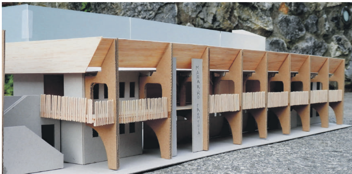
Lanak amaitzean frontoia zelan eratuko den erakusten duen irudia.

kritikatu zuen. "2018ko aurrekontuei eta ekainean proiektuari egindako kreditu gehikuntzari baiezkota eman zioten. Zer aldatu da ordutik hona? Orduan beharrezana zegoen eta orain ez? Ez dute ezer esan azken unera arte, ez dute proposamen bakar bat egin". Jeltzaleen "utzikeria" salatu zuen.