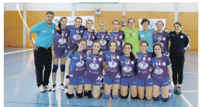
Kadeteetako bigarren urteko taldea.