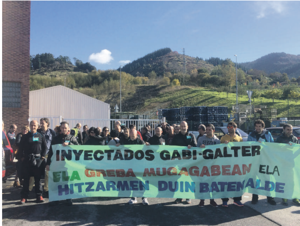
Azaroaren 9an, langileek manifestazioa egin zuten.

Besteak beste, enpresa-hitzarmena eskatzen dute Zaldibarko enpresa bietako langileek