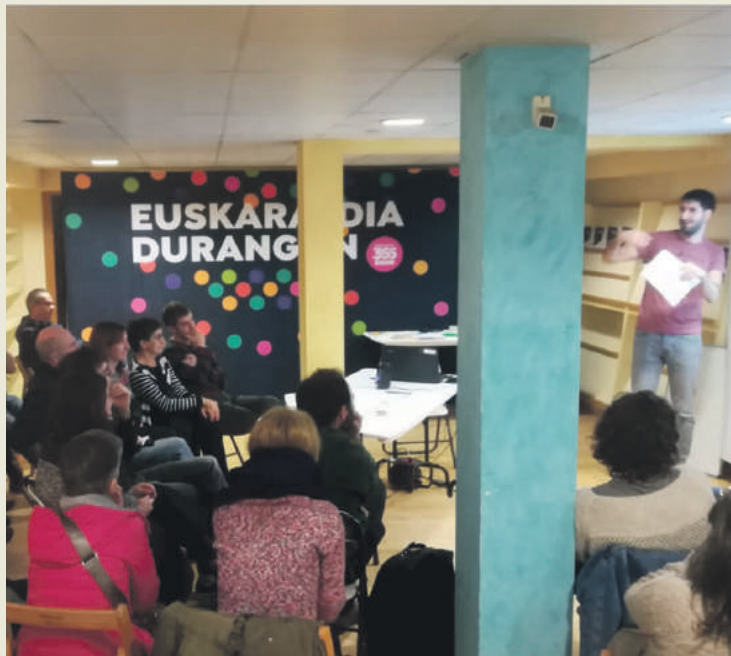
Irudian, Durangon eginko formakuntza tailer bat, Euskaraldiaren Artekaleko lokalean.

11 egun iraungo duen ariketan ahobizi eta belarriprest rola garatzeko aholkuak eman dituzte tailerretan