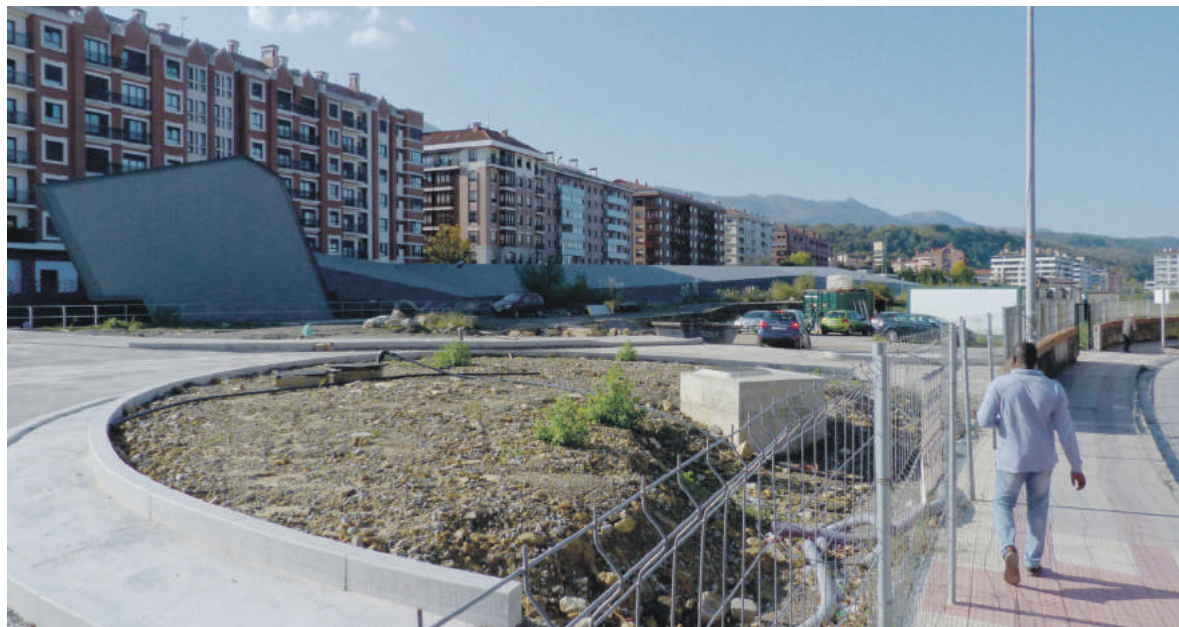
Estazioko lurren planak 550 etxe eta aisialdirako guneak aurreikusten ditu. Biribilgune erdi eginda dago.

Bestalde, tren geltokiko sARBIDE eraberrituan sortutako itoginak konpontzea eta aldapa saihesteko eskailera mekanikoak jartzea proposatu zuen EH Bilduk osoko bilkuran, baina Herriaren Eskubideak soilik babestu zuen.