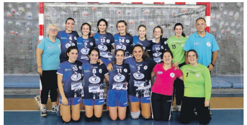
Gazteek nagusiekin jokatzen dute, txandaka.