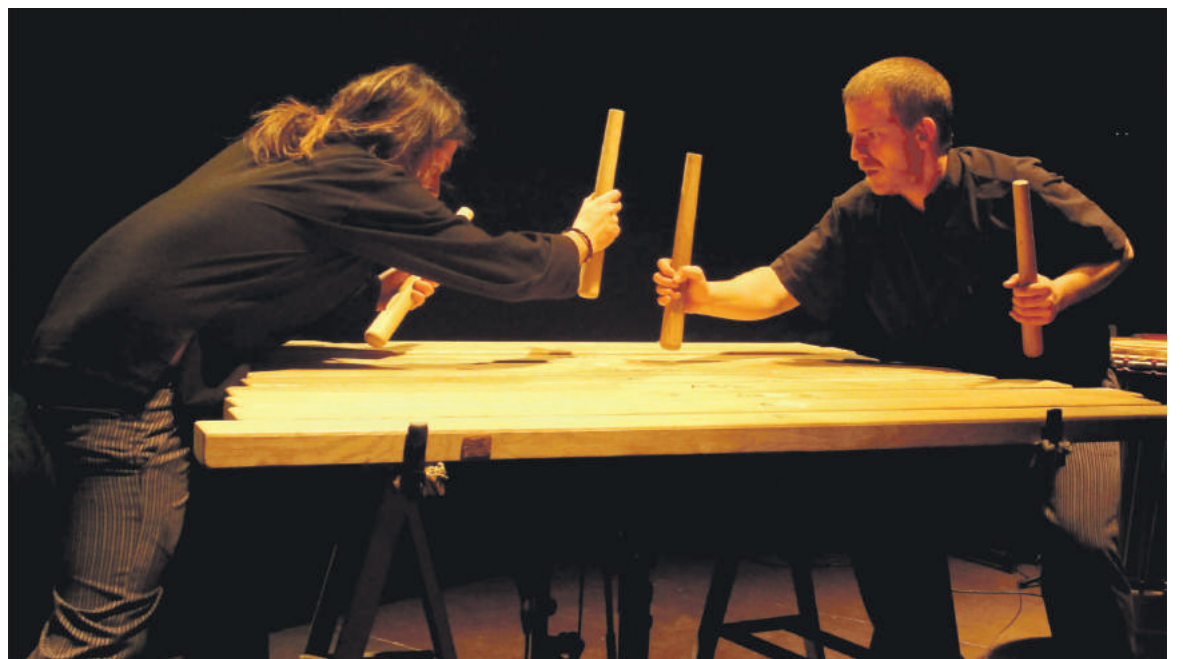
Hutsun txalaparta taldeak kontzertu didaktikoa eskainiko du azaroaren 23an.