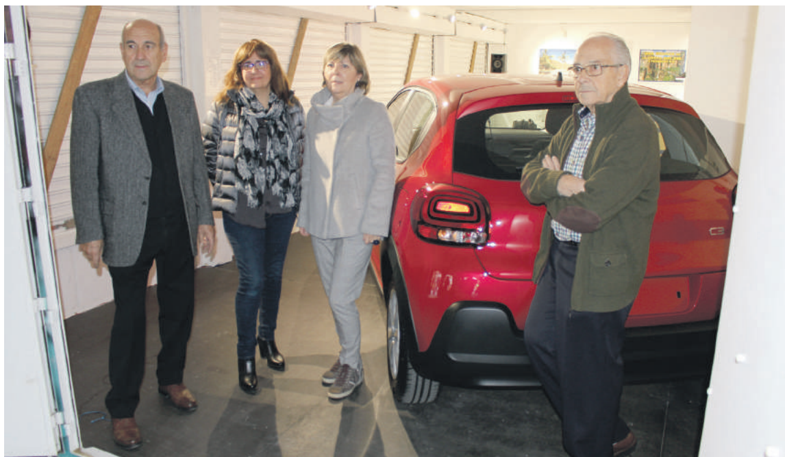
Citroen C3 autoa atzo bertan ailegatu zen Andra Mariko standera.

Citroen C3 autoa da zozketako sari nagusia; aterako duten dirua JAEDen ekintza solidarioarako erabiliko dute