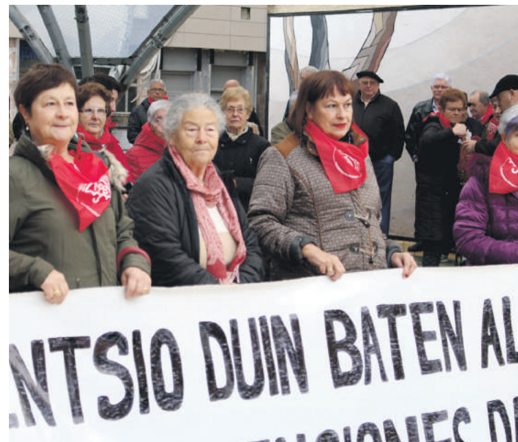
Iurretan Askondo kalean elkartzen dira astelehenero, 12:00etan.

Espainiako Gobernuak pentsioen igoera 0,25ekoa izango zela iragarri zuenean hasi ziren protestak. Tartean gobernu aldaketa egon da, eta orain hilabete Magdalena Valerio ministro sozialistagaz batzartzeko aukera eduki zuten pentsiodunek. Pentsioak KPIaren arabera igoko direla berba eman zuten, baina beste eskariak, alarguntasunarena eta 1.080 euroko gutxieneko pentsioarena, ez direla posible adierazi zuten ministroak.