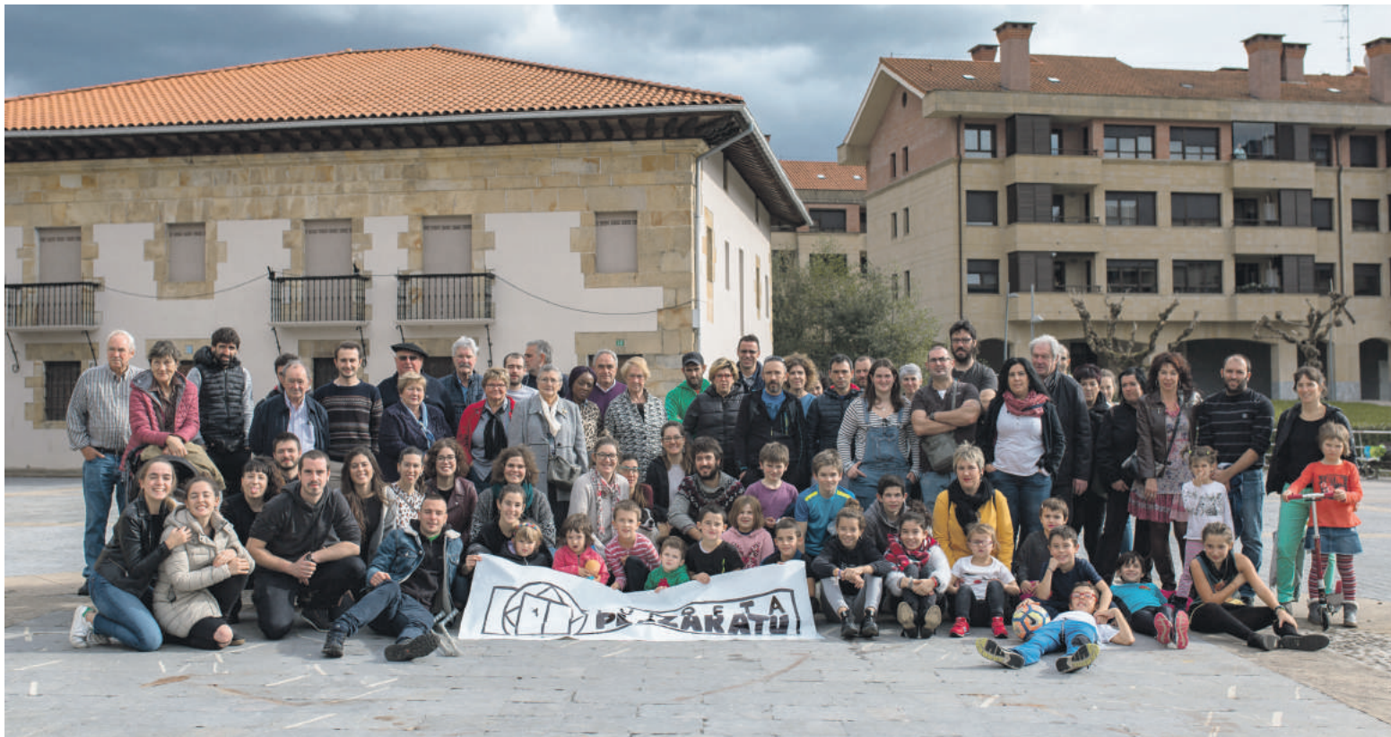
Iurreta Plazaratu dinamika joan zen asteburuan aurkeztu zuten, Aita San Migel plazan.

Bigarren Eskuko Azoka antolatu dute abenduaren 2rako, 10:00etatik 14:30era, Aita San Migel plazan