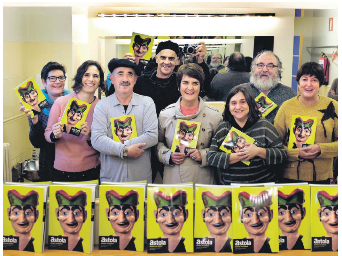
Durangoko Azokan ere egongo da Astola.

Eskualdeko hainbat herritan dago salgai Astola aldizkaria, bost euroan. Durangoko Azokan ere egongo da eskuragai, Gerediaga elkartearen erakusmahaiagaz batera.