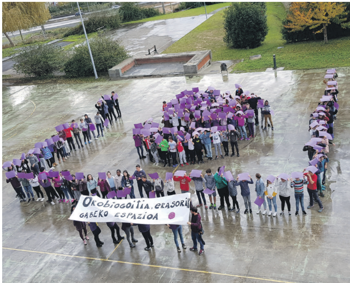
Iaz ere egin zuten 'Adierazpenak-Expresiones' erakusketa eta oso harrera ona izan zuen.

Indarkeria matxistaren inguruko hausnarketa islatu gura duen 'Adierazpenak-Expresiones' erakusketa antolatuko dute azaroaren 22tik 26ra bitartean Iurretako Ibarretxe Kultur Etxean