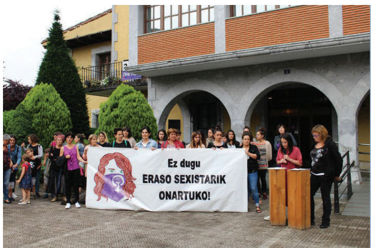
Kontzentrazioa egingo dute zaldibarren.

Azaroaren 25ean kontzentrazioa egingo dute Zaldibarren