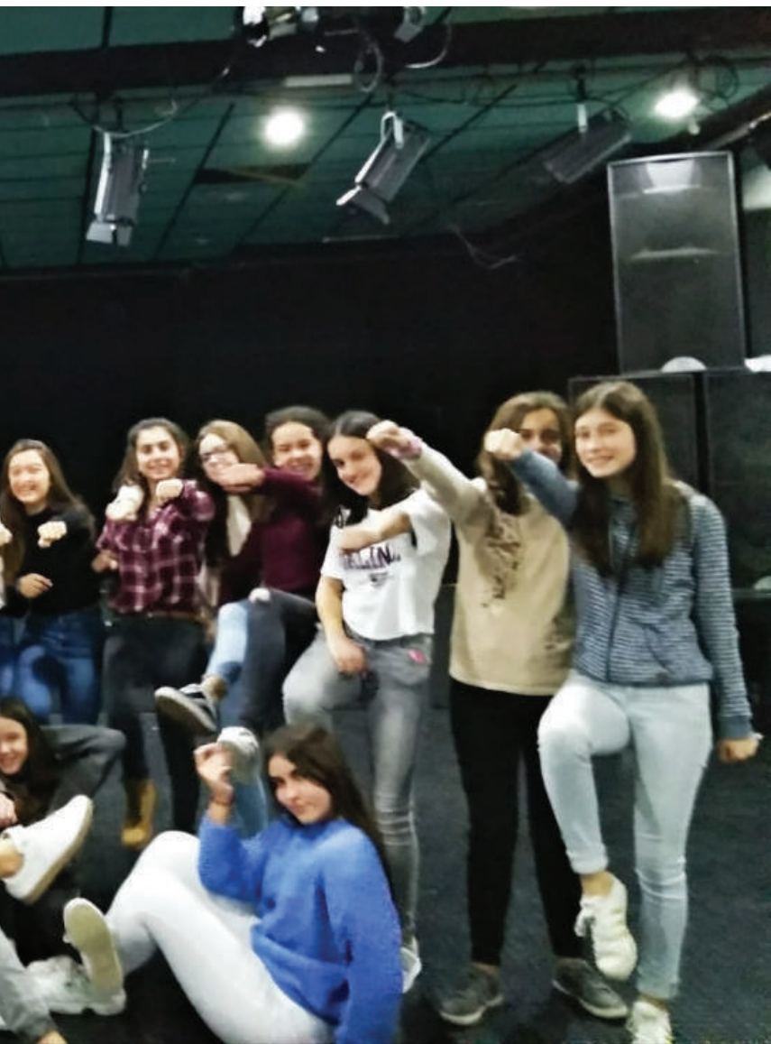
Joan zen barikuko lehenengo entsegura batu zen zornotzar taldea.