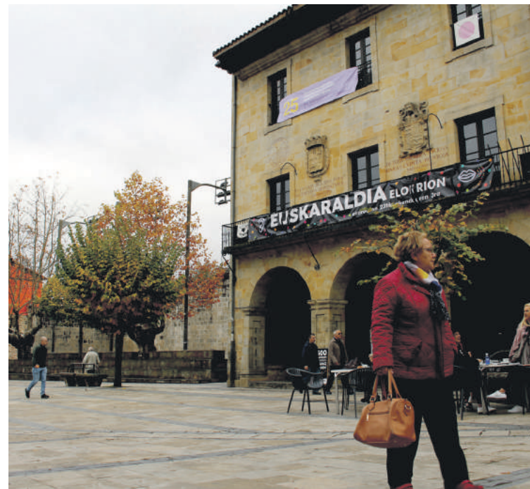
Inkestaturen %73 gustura daude udalak eskaintzen dituen zerbitzuekin.

Etorkizunerako proposatutako ideiek harrera ona izan dute orokorrean. Adibidez, %84,4k ondo ikusi dute eskola eta bertako patioa konpontzea. Herriko arazo nagusiei dagokienez, aipagarria da ez dela bat nabarmendu. Puntuaziorik altuena jaso duena garraio publikoarena da, %8,1egaz. Buruagak azaldu du Aldundiari hobekuntzak egiteko eskatzen diotela elkartzen diren aldiro.