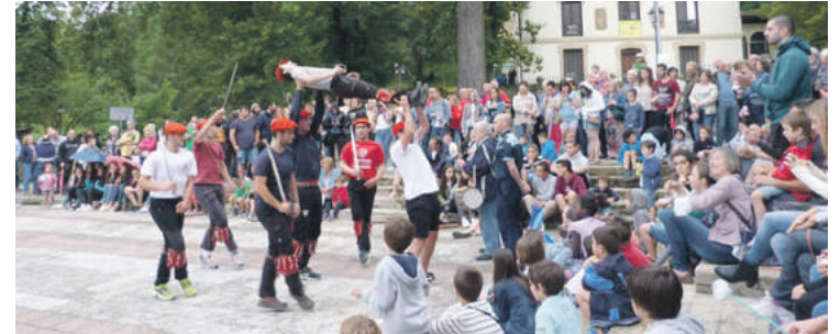
Uztailaren 2ra arte jai giroa izango da nagusi Berrizen.

"Jai gunetik" trafikoa pasatzea kritikatu du EH Bilduk