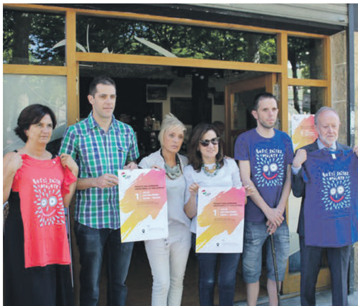
Ekimenaren sustatzaileak elkartasun azokaren aurkezpenan.

diote, bere betebeharreran laguntzeko. Abadiñoako EAJK antolatzen duen hirugarren elkartasun azoka izango da aurtengoa. Lehenbiziko bietan Geube elkarteari eta Abadiñoako Elikagai Bankuari eman zizkioten irabaziak. ADEMBI hiru hamarkada baino gehiago daramatza esklerosi anizkoitza duten pertsonekin behar.