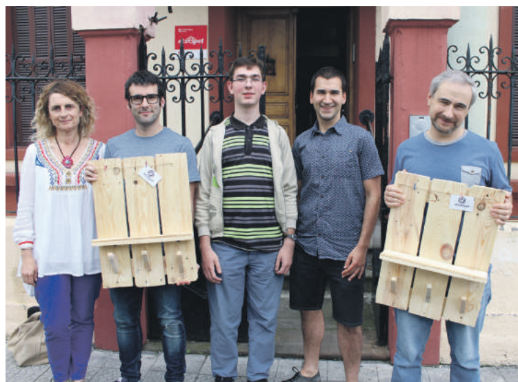
Erdian, proiektuko gazte bat eta, alboetan, Caritaseko eta Amankomunazgoko ordezkariak.

Lan merkatura sartzeko zailtasunak dituzten gazteei laguntzeko Behargintzak sustatu duen proiektuan aritu dira