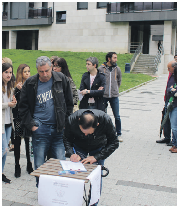
Mikeldi inguruko berdegunean 26 plazako aparkalekua eraiki gura dute.

EH Bilduk sustatu eta udalak onartutako Parte-Hartzerako ordenantzari esker, bilkuran mozioa