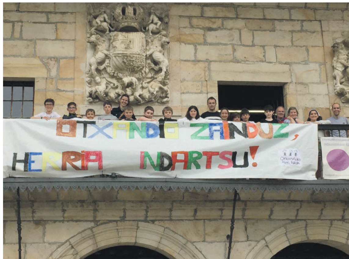
Otxandioko eskolako ikasleak eta udaleko zinegotziak joan zen asteko udalbatzarrean aurretik, pankarta balkoian eskegitzen.

Herria zaintzea aldarrikatzen duen pankarta eskegi dute udaletxeko balkoian