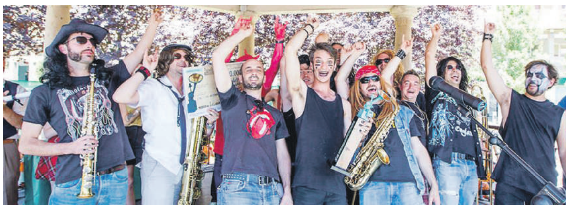
Pastor of Muppets saria jasotzen.

Pastor of Muppets talde frantziarrak eraman du 10.000 euroko saria