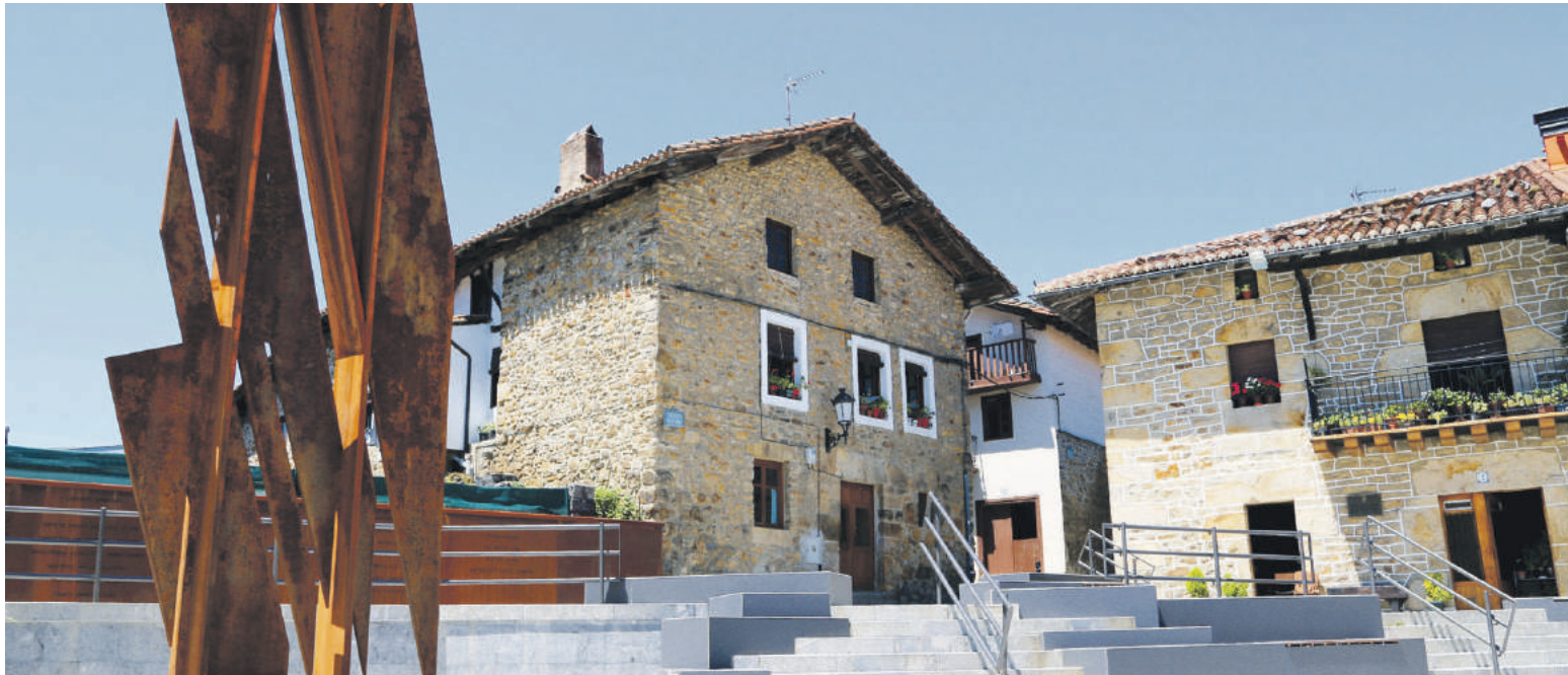
Andikontan hasi eta Elizabarrin amaitzen da gerra zibilaren inguruan sortutako ibilbidea.

Ibilbidea gidari baten laguntzagaz egiteko aukera eskainita, turismo arloko eskaintza sendotu gura dute