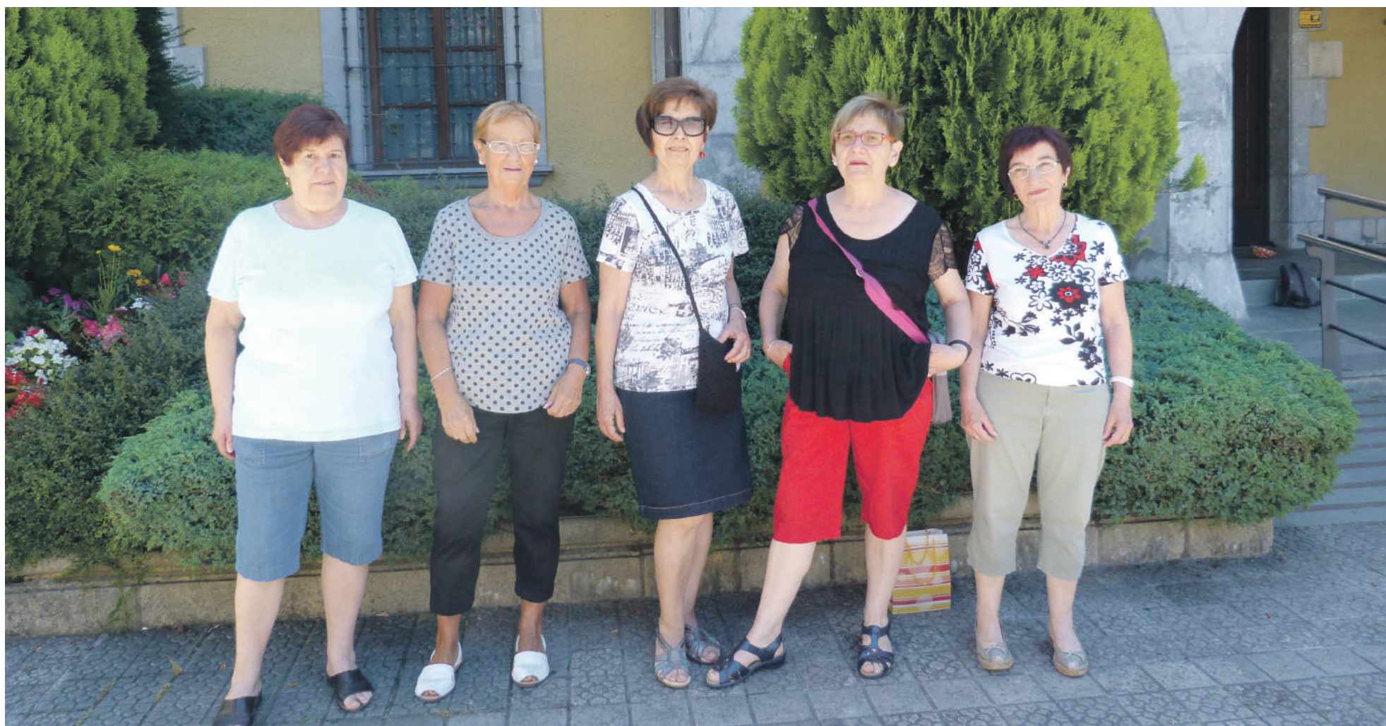
San Martin jubilatuen elkartearen kideak.