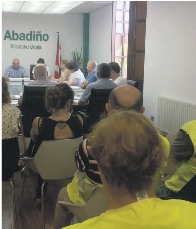
Auzotarrak txaleko islatzaileekin, Abadiñoako osoko bilkuran.

Aurretik, EH Bilduk udalaren "utzikeria" salatu zuen. "Udalak ia 700 herritarren sinaduragaz aurkeztutako mozioaren aurka bozkatu zuen, eta, hala ere, berdin jarrai-