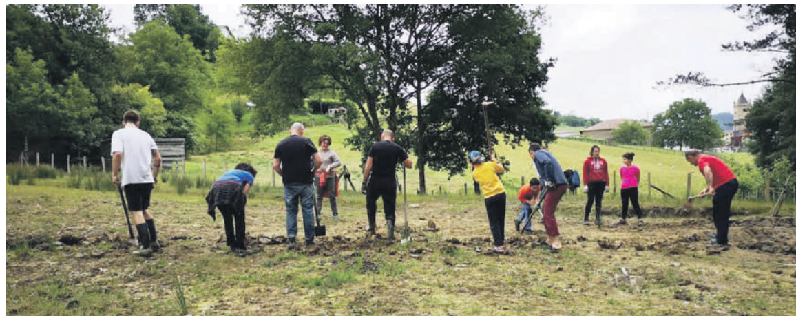
Anfibioentzako putzuak egiteko deitutako auzolanak 20 bat mallabitar batu zituen.

dira putzuak erabili ditzaketen anfibioetako batzuk. "Denboragaz beste hainbat anfibioek ere putzuak erabiltzea itxaroten dugu", azaldu du Hidalgok.