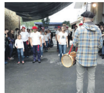
lazo jaietako irudia.

ten deskribapena zehazten du. Biktima izanez gero egin beharrekoa azaltzen du, edo biktima hurbilduz gero, hartu beharreko jarrera. Erasoen aurrean eman beharreko erantzuna ere aipatzen du. "Eraso sexistarik bako herria izatea gura dugu Zaldibar, eta horretarako lanean jarraituko dugu", esan zuten eguazteneko agerraldian.