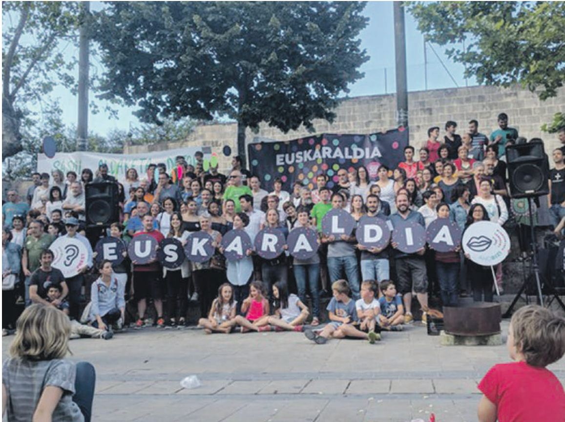
Barikuan aurkeztu zituzten ahobizi eta belarriprestak Elorrion.

Joan zen barikuan egin zuten Elorrioko Euskaraldiaren aurkezpena, herriko plazan