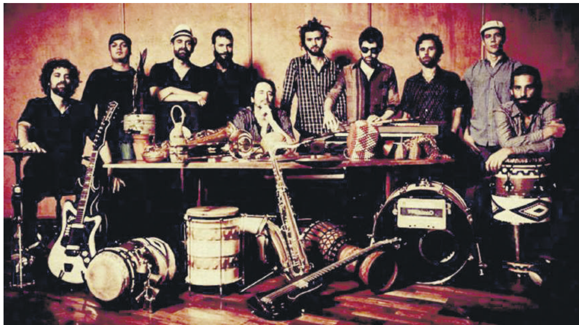
The Souljazz Orchestra Kanadatik dator.

honek. Aurtengo edizioa Elorrioko Enekora taldeak itxiko du, Tola jauregian eskainiko duen kontzertuagaz. Taldearen kontzertuetan munduko hainbat txokotara egiten dute jauzi musikaren bidez.