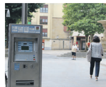
TAOren kontratua amaituta dago.

Mozio biek antzekotasun handiak zituzten. Desberdintasunetako bat zen EH Bilduk auzoan bertan bilera bat egitea proposatzen zuela, udalera gonbidatu beharrean.