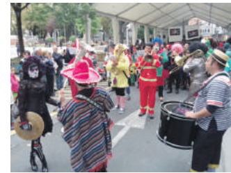
Urrian hasiko dira sanfaustoak.

Muntzarazko auzotarrek semaforoa behintzat "ahal bait arinen" konpontzeko exijitu zioten alkateari, eta, bitartean, protestekin jarraituko zutela esan zuten. Esaterako, atzo protesta egin zuten Muntzarazko sarbideetako semaforoetan.