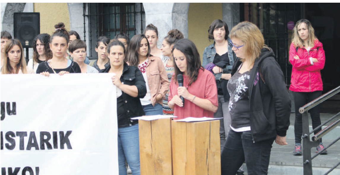
Eguaztenean egin zuten agerraldia brigada feministen berri emateko.

"Eraso sexistarik bako herria izatea gura dugu Zaldibar", esan dute prentsaurrekoan