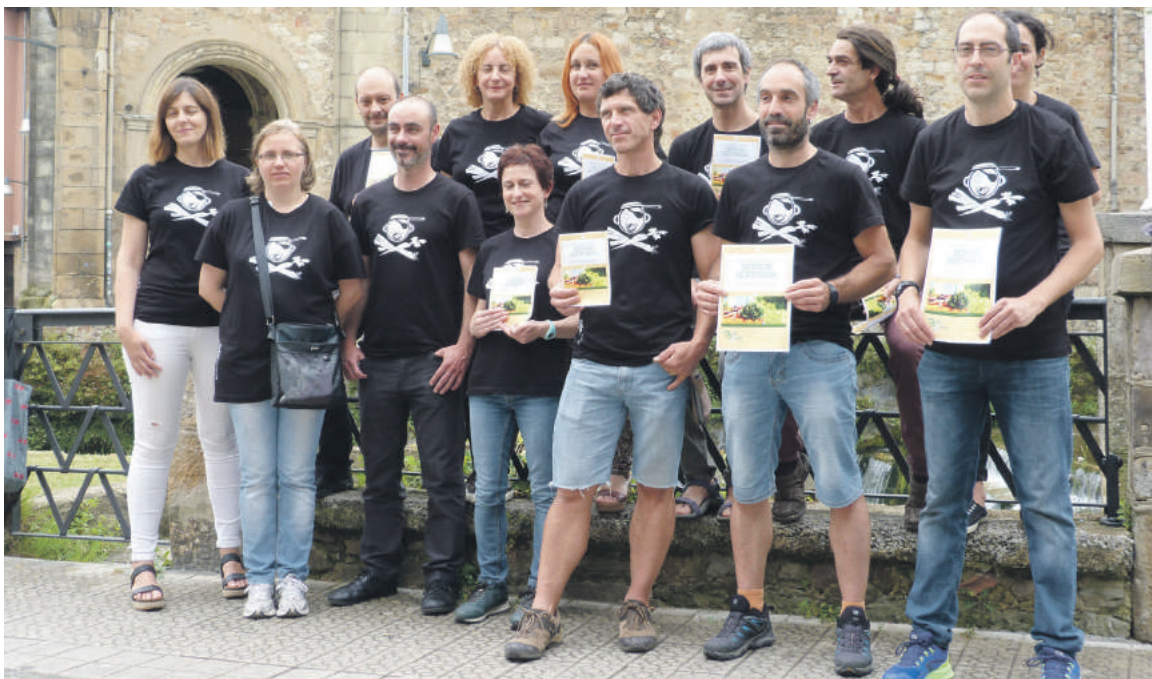
Berton Bertokoa dinamikako kideak Durangoko Pinondo Etxean, eguazteneko agerraldian.

Bestalde, Durangoko Zabala-rran, Iurretako Juan Orobiogotian, eta Atxondo eta Zaldibarko eskoletan ez dute sukaldetik. Azpiegiturak bermatzea eskatu dute Eusko Jaurlaritzan eta udaletan. Atxondo da ildo hori aurreratuen daramana, Jaurlaritzak proiektua egin duelako eta udalak ere dirulaguntza bermatu duelako. Beste hiruren kasuan, Hezkuntza Sailak aurreikuspena egiteko talde teknikoak bidali zain daude.