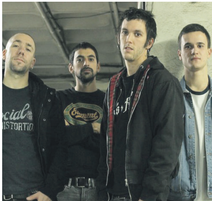
Bultz eskualdeko taldea arituko da Zaldibarren.

Uztailaren 6an musika zaleen nahia asetuko dute Bultz eta Stormen doinu rockeroek eta Koban taldearen eskaintza dantzarriak