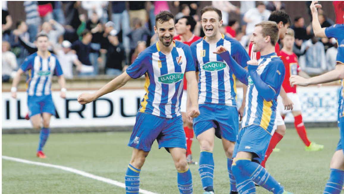
Durangoko Kulturala taldeko jokariak Alcalaren kontrako lehenengo gola ospatzen. Luis Iturrioz.

ertzainak kokatu ziren. Kontua ez zen irainez eta oihuez haratago joan. Beste aldean, zelaiko harmaila nagusian batutako zaleek etengabe animatu eta hauspotu zuten taldea.