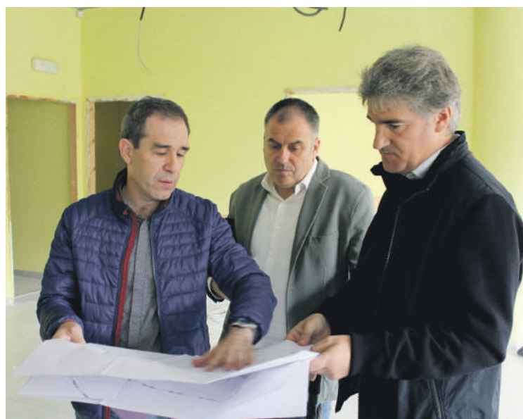
Udal ordezkariak Nafarroa Zentrorra egindako bisitan.

Azpiegiturak solairu bietan berriztuko dituzte: aire egokitua, berogailu sistema, argindarra... Energia kontsumoa %60-65 jaistea itxaroten dute. Lehenengo faseko eraikin zatian ere aldaketa berdinak egin zituzten azpiegiturretan.