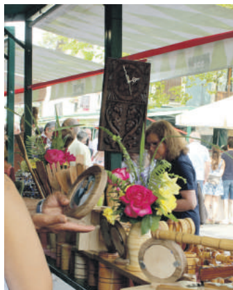
Artisan Azokako argazkia.

Bestalde, postua jartzeko aukeratuaren zerrenda uztailean zehar argitaratuko dutela jakinarazi dute udaleko kideek.