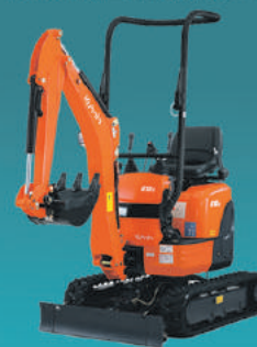
HONDEAMAKINA TXIKIA 1000 KG.