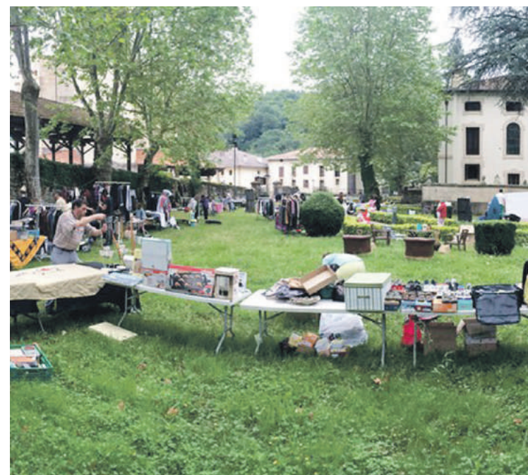
Euria eginez gero, udaletxeko lorategian beharrezko probak egingo dute.