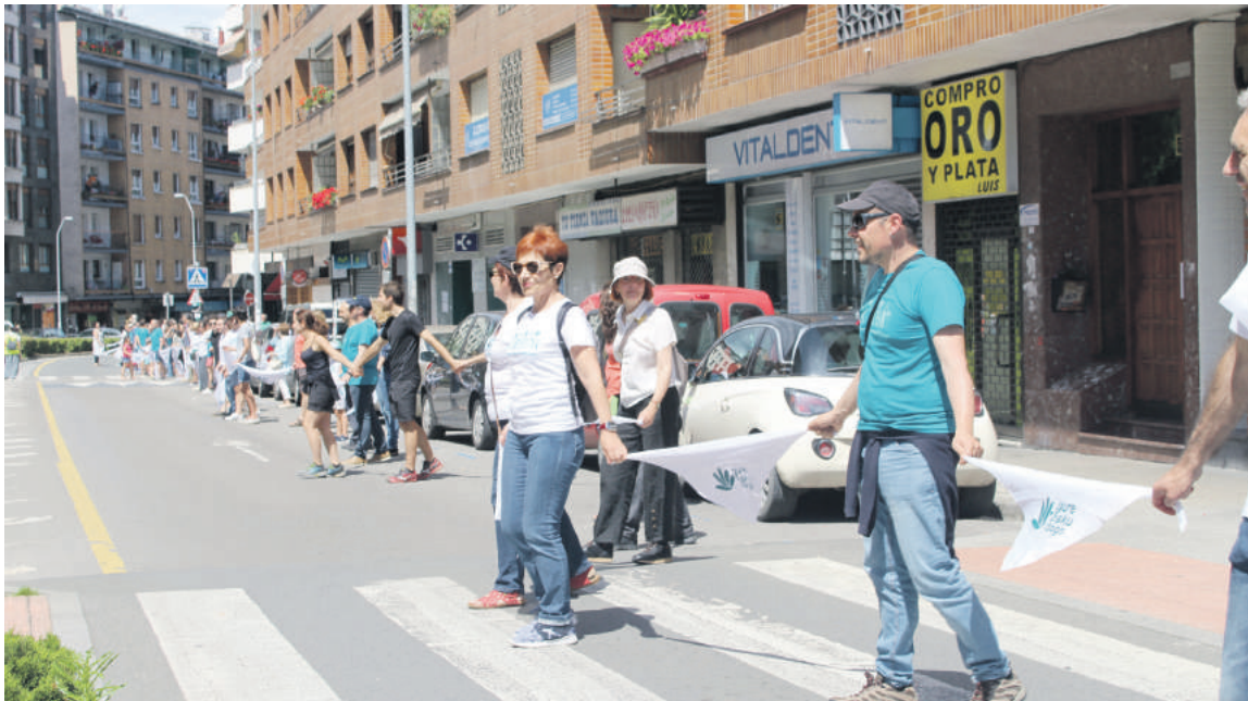
Durango jende andana batu zen, 1.500 lagunetik gora.