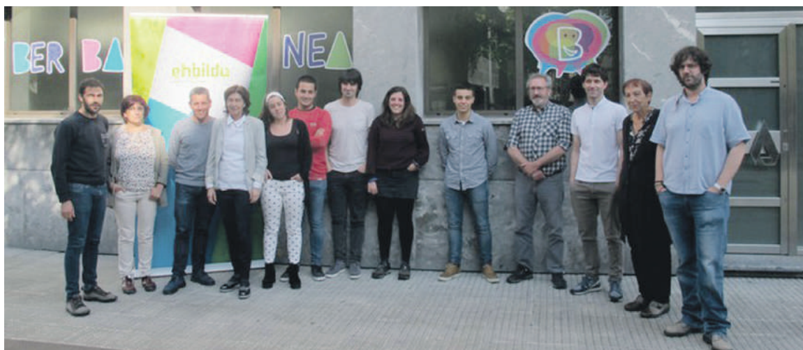
Zazpi zinegotziek eta EH Bilduko asanbladak proposaturiko beste zazpi kidek osatzen dute talde eragilea.

2019an egingo diren udal hauteskunderi begira, lan talde berria osatu du koalizioak