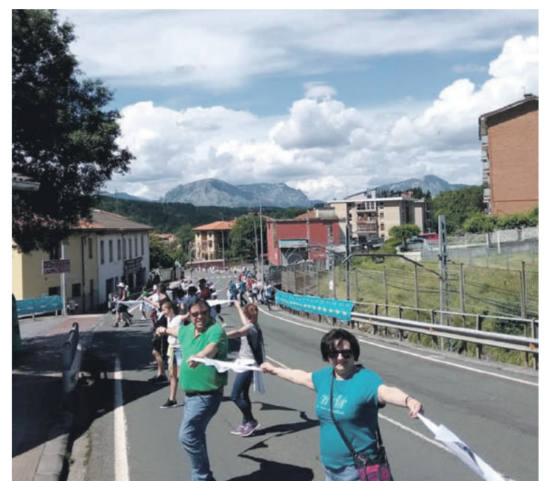
Zaldibarren aldapan behera egin zuten katea, batzuetan olatu bihurtzen zena.