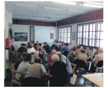
30 bat lagun bildu ziren.