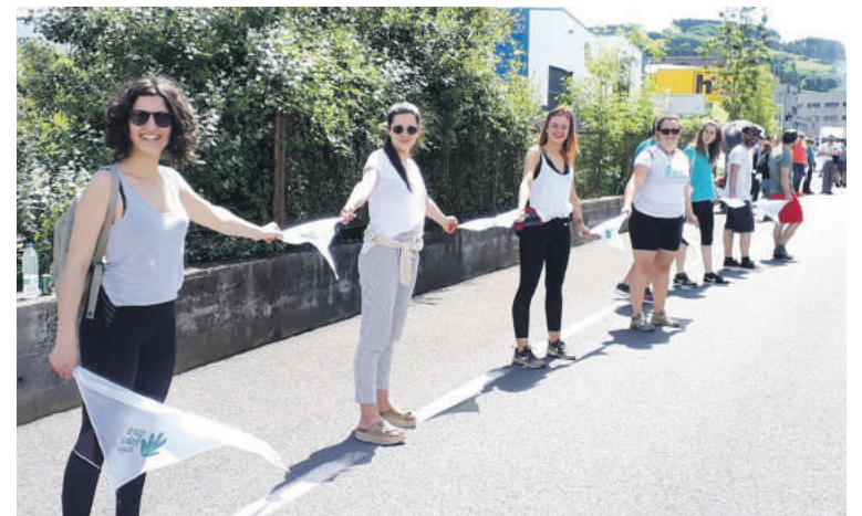
Elorriokoei Berrizen egotea tokatu zitzaion.