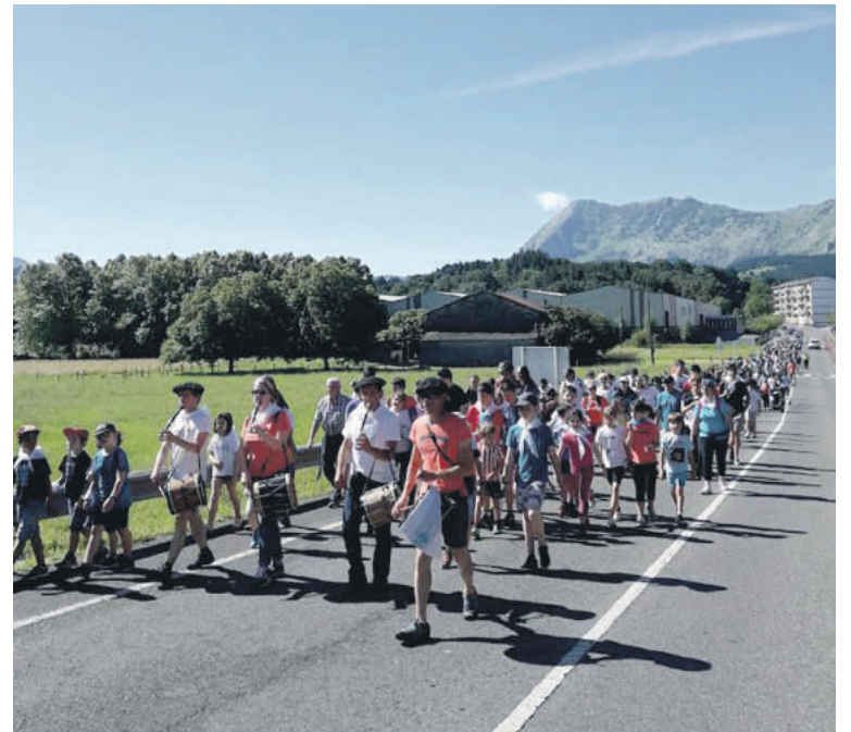
Abadiñon kalejira egin zuten txistulariekin.