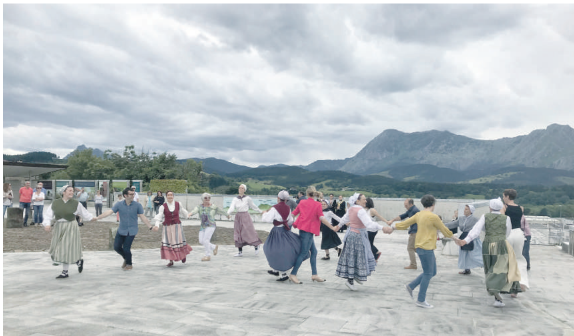
Durungaldeko dantzarien soka-dantza amaitzeko, ordezkari politikoak atera zituzten dantzatzera.