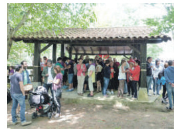
Santa Agedako aterpea jaietan.

herriko ekomuseoa eta elizako kriptak erromanikoak bisitatuko dituzte, eta bazkalostean Lizarrara joango dira. Izena emateko azken eguna ekainaren 26a da, jubilatuen lokalean edo udaletxean (24 euro).