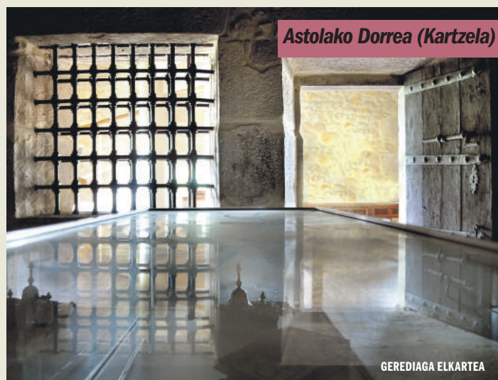
Astolako Dorrea (Kartzela)

Amankomunazgoaren eraikina kartzela izan zen 1843ra arte