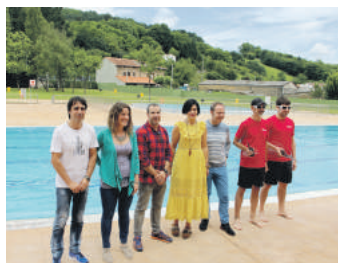
Joan zen barikuan izan zen aurkezpena