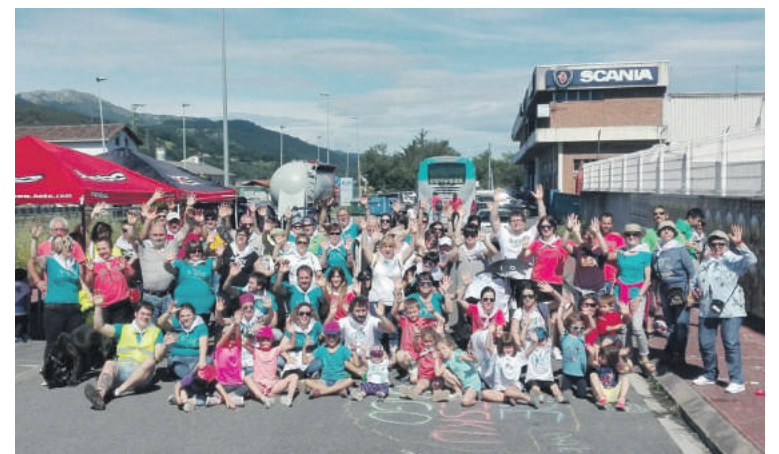
Atxondokoak, esaterako, Iurretara mugitu ziren.