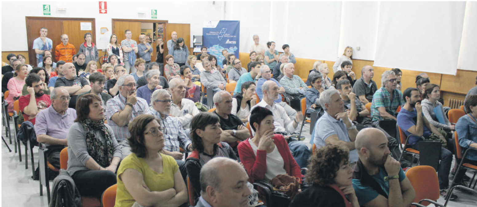
Maristak ikastetxean egindako aurkezpenak ikusmina sortu zuen. 100 lagunetik gora batu ziren, eta batzuek galderak egin zituzten.