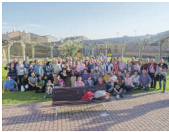
Garaitik 32 lagun joan ziren.