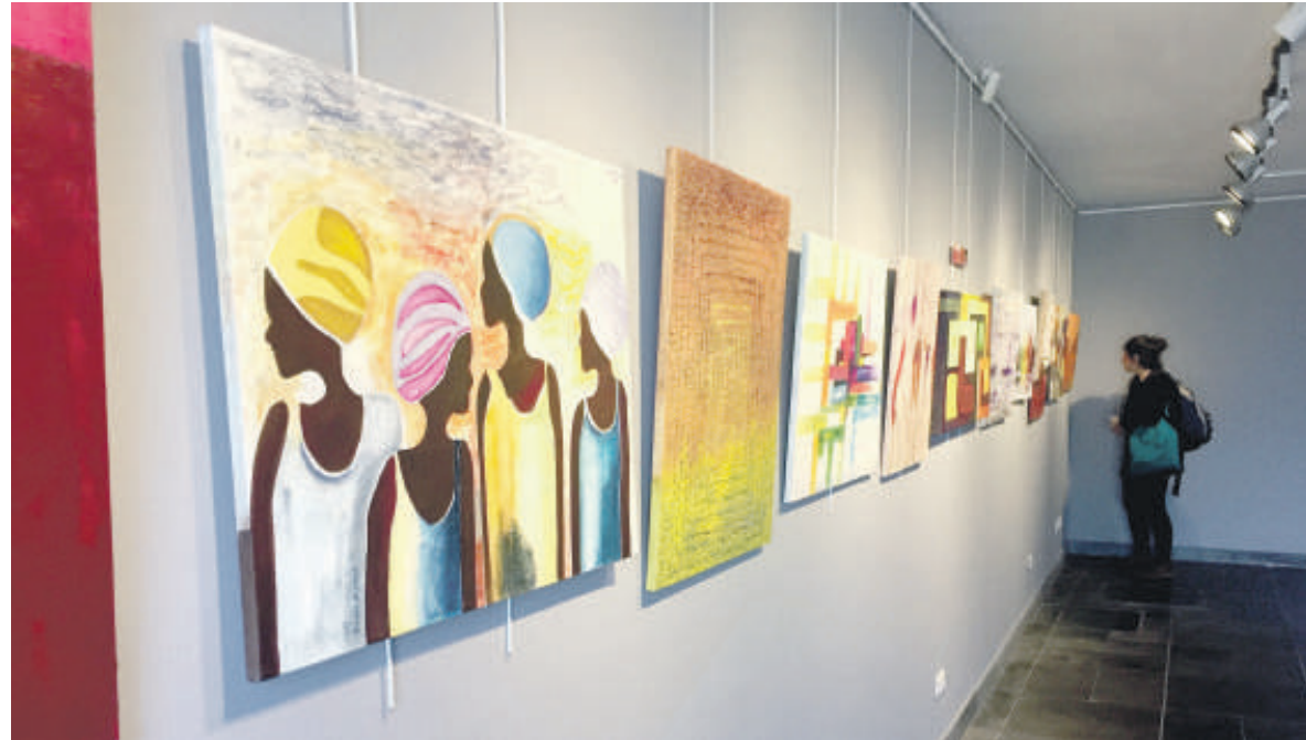
Lau elorriarren lanak erakusten ditu erakusketa kolektiboak