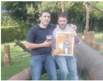
Hainbat postu jarriko dituzte plazan.