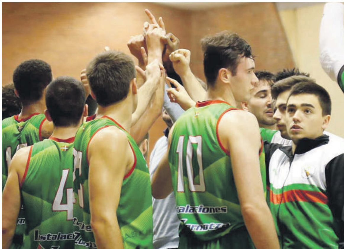
Aurtengo denboraldian 35 partidutik 32 irabazi ditu Zornotza Saskibaloi Taldeak.