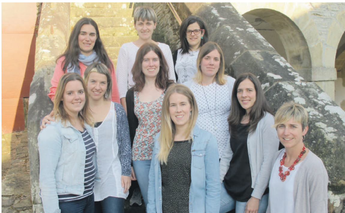
Azken hiru urteak elkarrengaz igaro dituzte Jasokundeko kideek, eta talde egonkorra osatu dute.

Urte hauetan zehar, hamaika ekitalditan egon da Jasokunde, eta, besteak beste, Benito Lertxundi eta Pantxoa eta Peiogaz partekatu dute oholtza; Mikel Laboaren omenaldian ere parte hartu zuten. Berezi, baina, telebistako 'Oh Happy Day' saio entzutetsuan parte hartu zuteneko garaia oroitzen dute. "Herria irauli egin zen gugaz, eta finala, adibidez, zuzenean ikusi ahal izan zen pantaila erraldoian; Mallabira itzuli ginenean, sekulako harrera egin ziguten", gogoratu dute kideek. Hamaika lagunek osatzen dute gaur egun abesbatza, eta taldea sasoiko dagoen arren, abesteko gogoia duena parte hartzerantz animatzen dute.