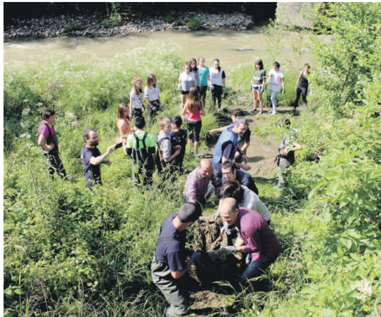
Agintariak parte hartu zuten jardunaldian.

Joan zen astean Durangoko Fray Juan Zumarraga institutuko ikasleak ere aritu ziren ibaia garbitzen.