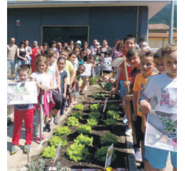
50 umeri jaten emango diote gurasoek.