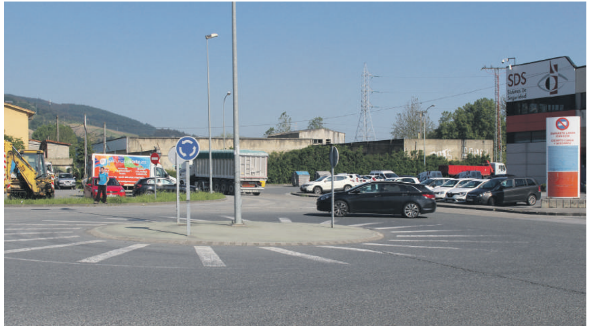
Proiektua lantzen ari dira. Ondoren, Aldundiaren baimenak jaso bezain laster esleituko dituzte lanak.

tola, nagusien egoitza... eta haxe da arazoari emango dioten irtenbidearen oinarria: oinezkoek barik autobusak gurutzatu dezala errepidea. Geltoki berri bat egingo dute industrialdean dagoen biribilgune txikiaren ondoan. Noranzko bie-