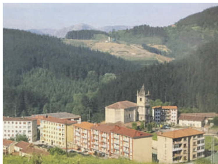
Mallabiko Betearte da Gipuzkoako lehiaketara aurkeztu den zabortegei bakarra.