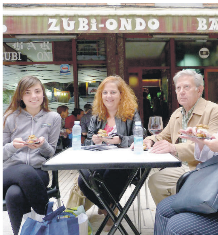
Parte-hartzaileek hiru pintxo probatu behar dituzte gune bakoitzeko.

Jan Alai lehiaketaren barruan 35 pintxo dastatu daitezke beste hainbeste taberna eta jatetxetan. Domeka iluntzeko sari banaketan aukeratuko dituzte pintxorik onenak