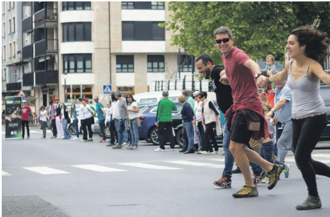
Zaldibarren giza katearen aurkezpena eta entsegu bat egin zituzten joan zen zapatuan, 120 lagun inguru batuta.

dago apuntatzeko aukera. Datozen egunotan, eskualdean leku ugari-tan ipiniko dituzte mahaiak. Durangon, Andra Marian egongo dira, eguenetan, 19:00etatik 21:00etara, eta zapatuetan, 12:00etatik 14:00etara. Abadiñon, eguenero