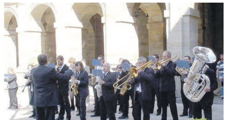
Musika banda, Orfeoia eta Zarandona elkarregaz arituko dira.

"ikuskitzen kementsua" da, melodia "ederrak" eta erritmika "bizkorrak" uztartzen dituen. Gainera, kontzertuan euskal folkloreak kanta herrikoiak ikuspegi "berri" eta "liluragarri" batetik entzuteko aukera egongo dela jakitera eman dute.