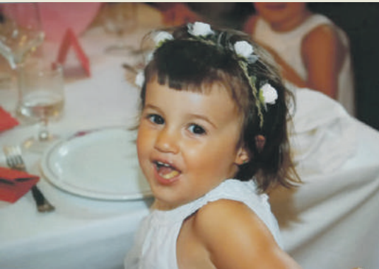
Abadiñoko Libe Etxegaraik 3 urtetxo betetzen ditu gaur, maiatzak 25. Zorionak eta mosu handi handi bat familia guztiaren partez.