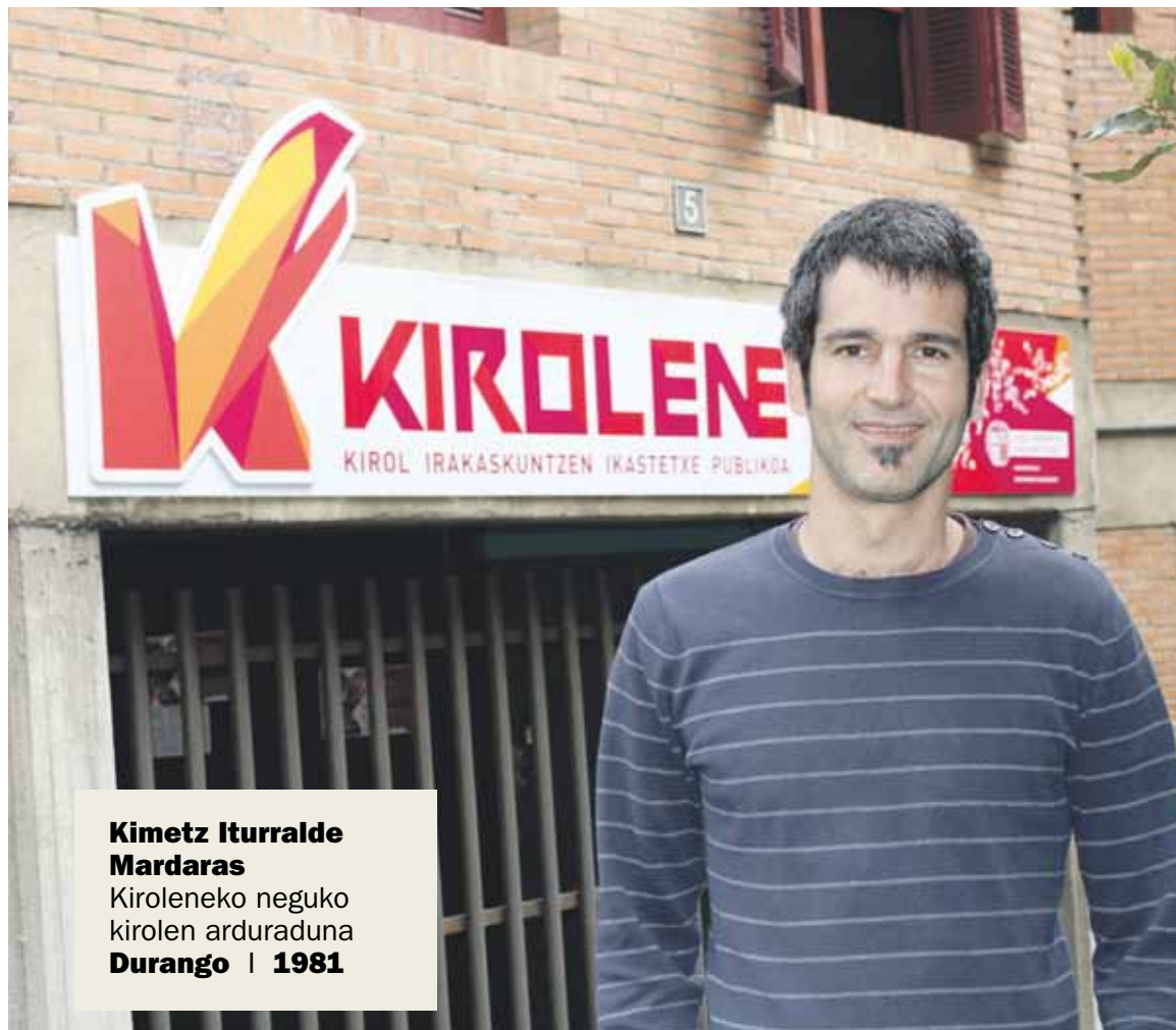
Kimetz Iturralde Mardaras Kiroleneko neguko kirolen ardura Durango | 1981

“ Lehiaketa eta jaialdia antolatzeak lan handia du, baina erantzuna ikusita, merezi izan du. Pozik gaude ”