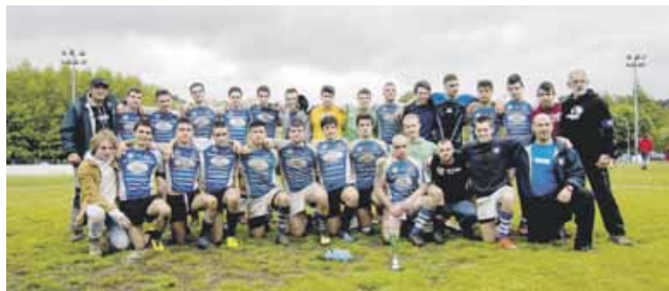
Durango-Elorrio errugbi taldeko gazteak.

eskualdeko taldeak azken unera arte irabazteko aukera izan zuen. Azkenean, Zarautz nagusitu zen, 25-19. Egunean bertan Elorrioko udaletxean harrera egin zieten jokalariei, denboraldi osoan emandako maila eskertzeko.