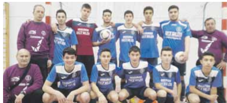
25 partidutan 228 gol sartu dituzte Mallabiko gazteek.