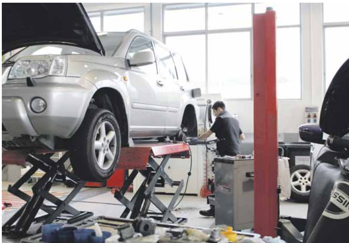
Gaurako tailerraren irudia.