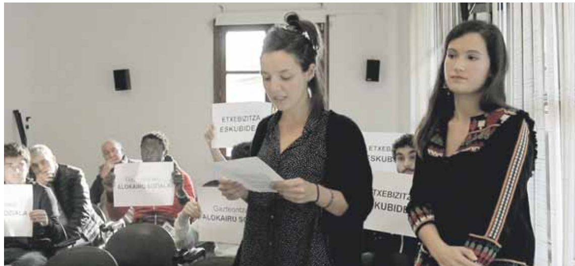
Barrura ekimeneko gazteek hitza hartu zuten joan zen asteko udalbatzan.