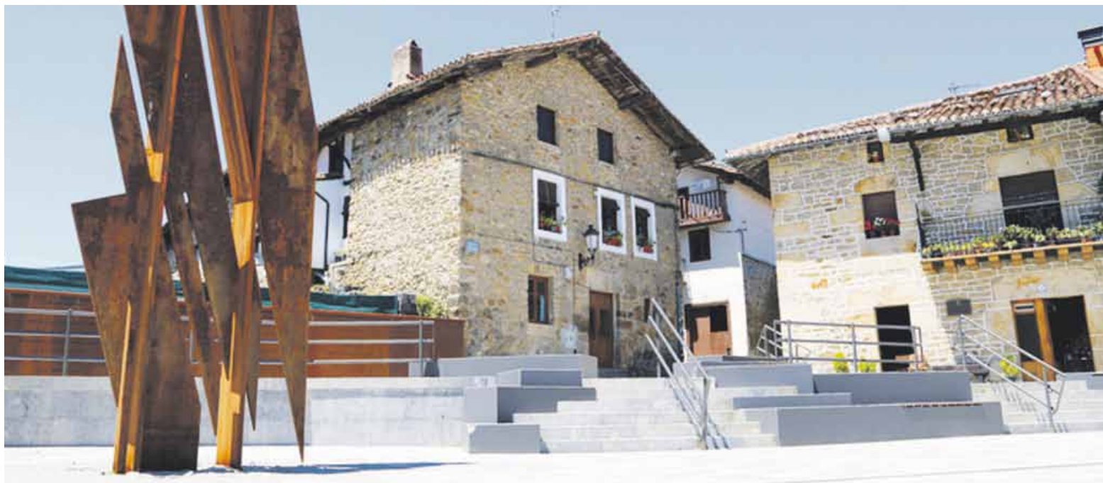
Faxistek Andikona plaza bonbardatu zuten 1936an.