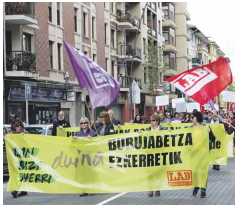
LABek Zornotzan deitutako manifestazioaren irudi bat.

LABen ustez, "enplegu duina behar da bizi duina eta pentsio duina bermatzeko" eta "garai berri bati aurre egiteko prest" dago. Politikan eragin gura du sindikatuak eta "borrokaren giltza" pentsiodunek, emakumeek, gazteek... dutela dio. Erronka bikoitza du LABek aurten: "Eraldaketa sozialerako grina gauzatuko duen mobilizazio soziala indartzea eta aldaketa hori burujabetza prozesuagaz lotzea". Gaineratu dutenez, lan istripuak, laneko gaixotasunak eta prebentzio falta salatzen jarraituko dute, "langileen osasuna eta bizi erdigunean jartzeko ordua heldu delako".