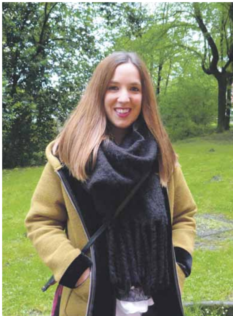
Proiektu interesgarria iruditzen zaio emakumeen kirola sustatzeko.

Izen-ematea hasita dago. Interesa dutenak Mendibeltzen sare sozialean (Instagram eta Facebook) bidez jarri daitezke, besteak beste, hartu-emanetan. Atea zabalik dute, Durangaldekoentzat zein handik kanpokoentzat.