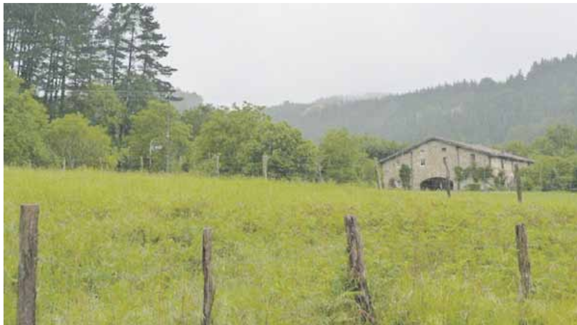
Baserri guneeetako herritarrek haserre agertu ziren igoeragaz bere garaian.

Soberakinaren ia erdia OHZren bidez biltzea egotzi dio EH Bildu udal taldeari