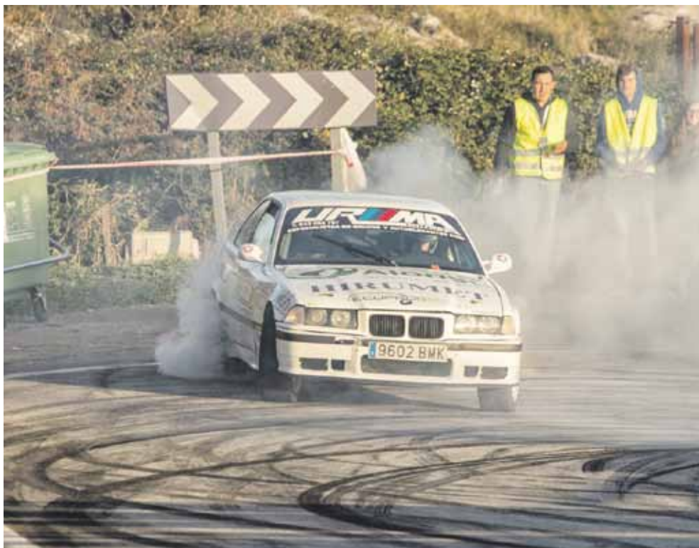
Aurten arte bere modeloko onena zen BMW M3 bategaz aritu dira.