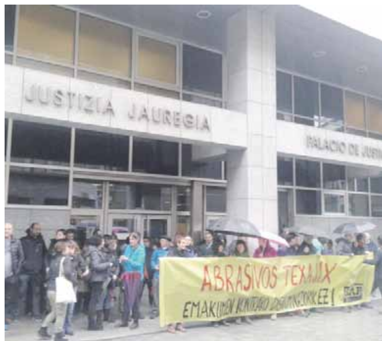
Apirilaren 10ean egin zuten epaiketa, Bilboko auzitegian.