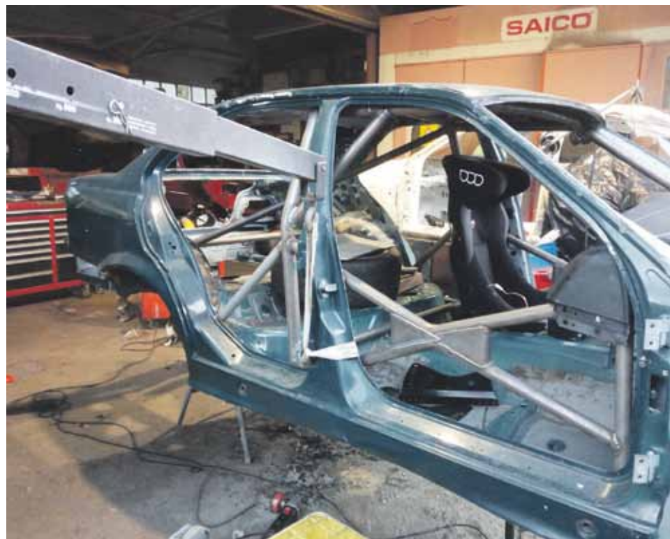
Irudietan, laster prest izatea espero duten auto berriaren egitura.

zein modalitatetan, baina lasterketak lehiatuz gozatu gura dut, eta ez bakarrik irabazi.