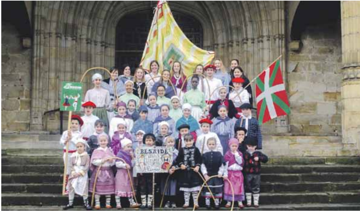
Hamaika ekimenetan parte hartu du Besaide dantza taldeak urteotan.

Elorrioko dantza taldeak 'Maiatza Dantzan' ekitaldi sorta antolatu du, 50 urteko ibilbidea ospatzeko; bihar, zapatua, Goizaldi dantza taldeak ikuskizuna eskainiko du Arriolan