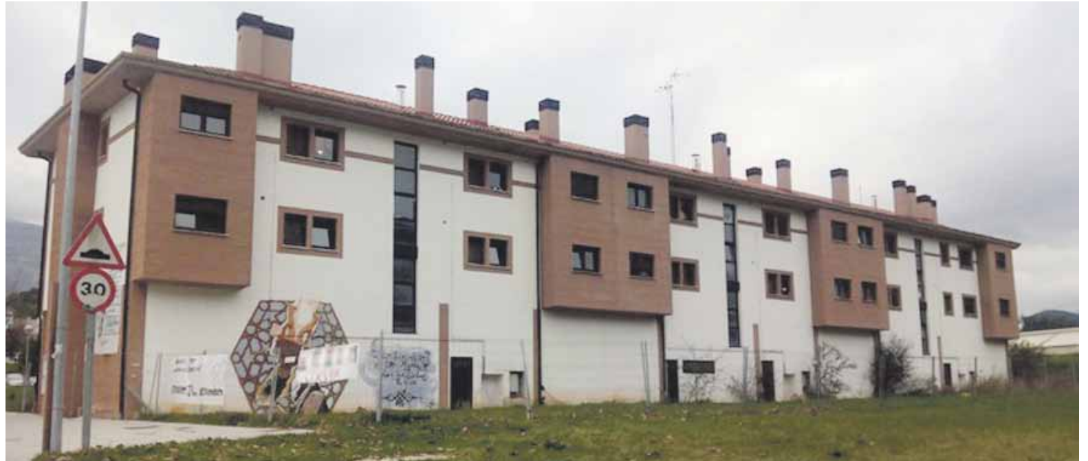
Barraski inguruaren irudia, Atxondon.

Orain zortzi urtetik hona euren etxebizitzaren zain dauden hiru erosleri itzuli beharko die dirua bankuak