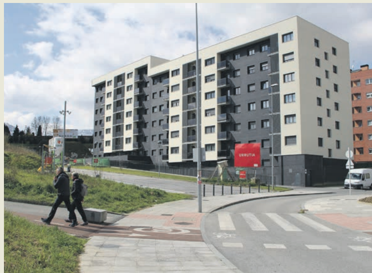
San Fausto auzoan egongo dira gazteentzako alokairuko etxeak.

Martitzenean eman zioten behin-betiko onarpenera ordenantzari, eta egunotan zabalduko da inskripzioa