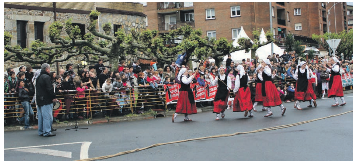
Iluntze dantza taldeko kideak, iaz, jaien hasierako ekitaldian.

egingo dute arratsaldean. Eta, gauean, Els Diablos de la Gradera taldearen Correfocen bengala eta suzuriaren txanda izango da.