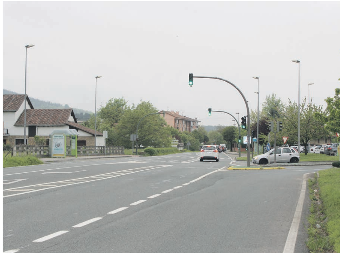
Auzotarrek 564 sinadura bildu zituzten arazoa konpontzea eskatzeko.

Aldundiagaz akordioa sinatu du udalak, eta Elorrio-Durango errepidearen zati horretako titulartasuna utziko dio bertan obrak egin ahal izateko; biribilgunea eraiki gura dute