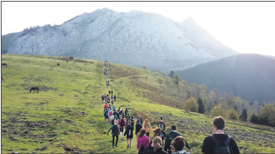
Abiapuntu ezberdinetatik, helmugara jotzen dugu.

1967an sortu zen Fray Juan de Zumarraga institutua. Ikasturte honetan, beraz, 50. Urteurrena ospatzen ari gara. Ospakizuna gogoratzeko, zenbait ekimen egin ditugu, eta, INSTITUTUA JAKINA! Aspaldiko lema berretsi dugu. Kurtso osoan zehar gura genuke efemeride hori gogoan izan, eta, horrela, eskertu Durangaldean kalitatezko hezkuntza publiko, euskaldun, kritiko, sortzaile, parte-hartzaile eta oso bat sortzen jardun duzuen guraso, ikasle, irakasle eta bestelako langile askoren lana.