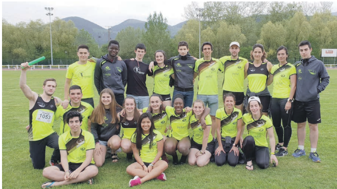
DKT taldeko kideak Landakon.

ekainerako eta uztaileko. Bertan parte hartu gura dutenek maiatzaren 31ra arte izango dute aukera izena emateko 620 847 853 zenbakira deituta edo udalekuakDKT@gmail.com helbidera idatzita.