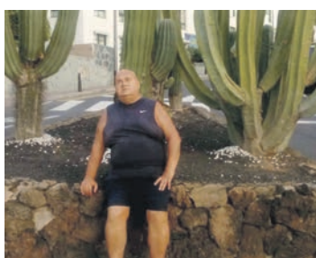
Zorionak Txiki familiakoen eta lagunaren partez!