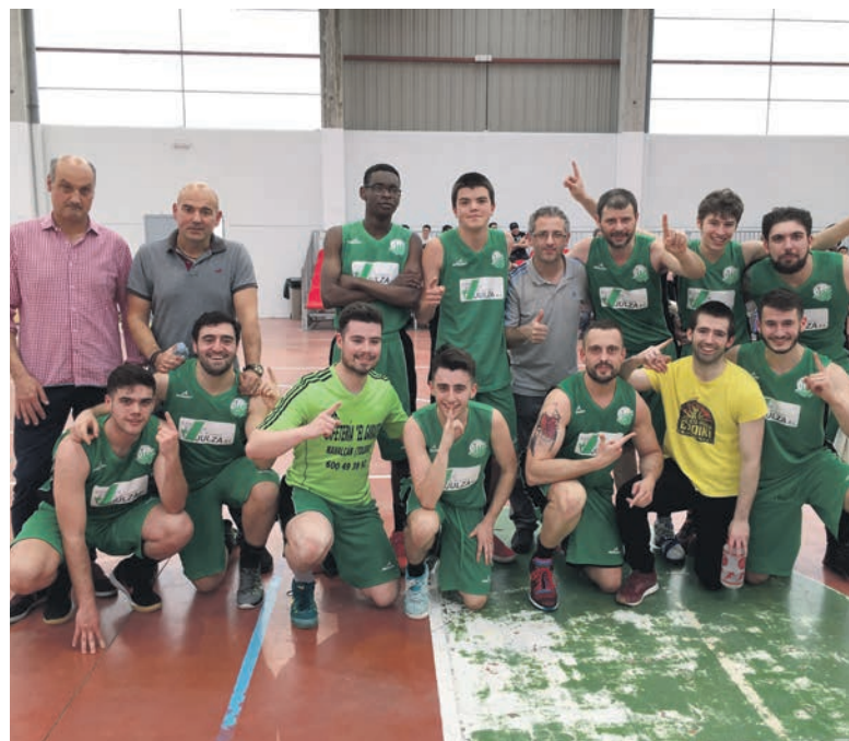
Zalduako jokalariek igoera ospatzen.