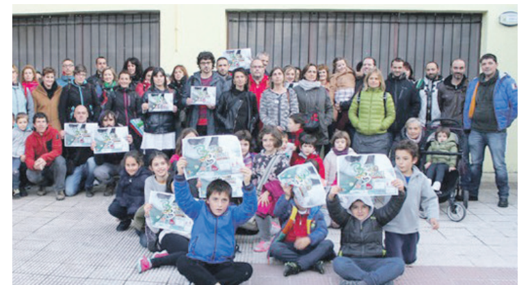
Berrizen sindikatuek dinamika atxikimendua eman zioteneko argazkia.

Bestalde, gaur da bazkarirako txartela erosteko azken eguna. Txartelak Ganeko, Fonda eta Kantoi tabernetan eta Amalur liburudendan daude salgai.