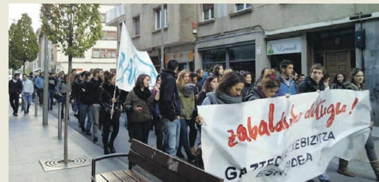
Zabalduko Ditugu taldeak iraganeko egindako manifestazio baten irudia.

festaziora deitu dute biharko, 18:00etan, Andra Maritik. Goizean, jardunaldi bat egingo dute, 11:30ean, eta ostean, bazkaria. 17:00etarako, hausnarketa iragarri dute. Euren ustez, udalaren 6 etxeak "ez dira nahiko" arazoari aurre egiteko.