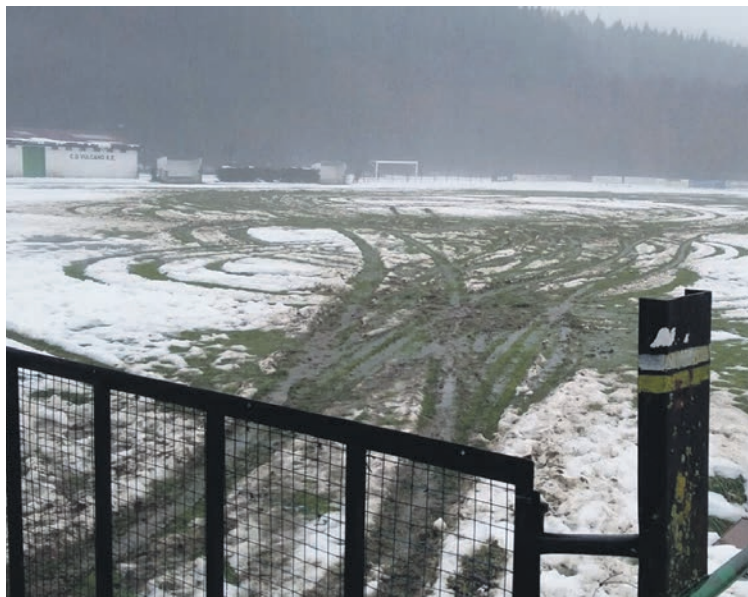
Futbol-zelaia zangaz eta zuloz beteta geratu zen.

Udalak konponketak ordaindu ditu eta Vulcano gestioaz arduratu da. Zangak estalita daude, eta belarra ereinda, baina ezin dute erabili harik eta lurra egonkortu eta belarrak indarra hartu arte.