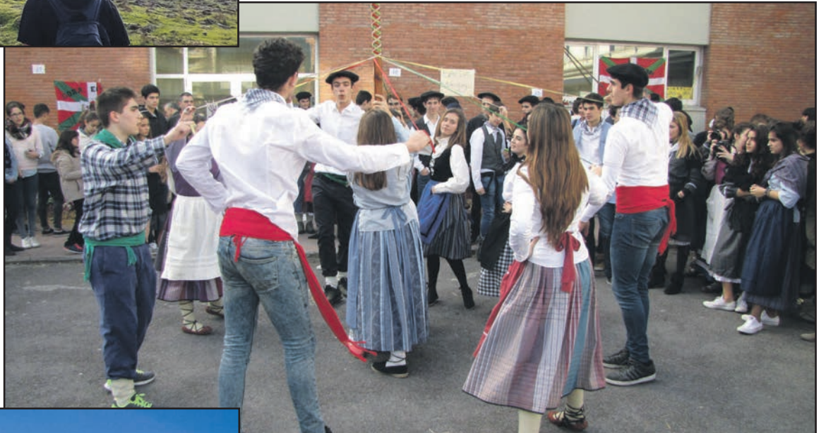
Urteak pasa eta gero...

ikastetxean, bi orientatzaile ditugu-eta; bata derrigorrezko hezkuntza etaparako (DBH eta GE), eta bestea derrigorrezkoaren ondorengorako (Batxilergoa, ZIG eta Zikloak). Hauek, tutore eta irakasle taldearekin batera, ikaslearen jarraipen zehatza egin, eta honen ibilbidea bideratzeko laguntza ematen dute.