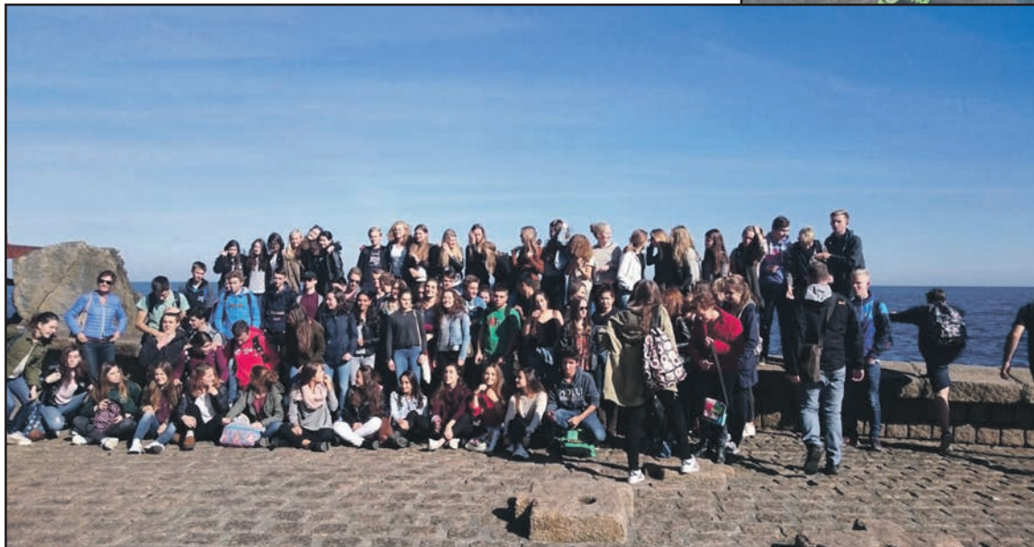
Denok elkartzen gara.