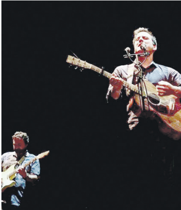
Hurrengo hitzordua Tomasa tabernan izango da, Inun musikariagaz.

Goiza ezohiko ordua da horrelako ekimenetarako, baina, hain zuzen, horregatik aukeratu dute ordu hori. "Umeak ikastetxeetan utzi ostean tabernetan batzen ziren gurasoei horrelako ekital-