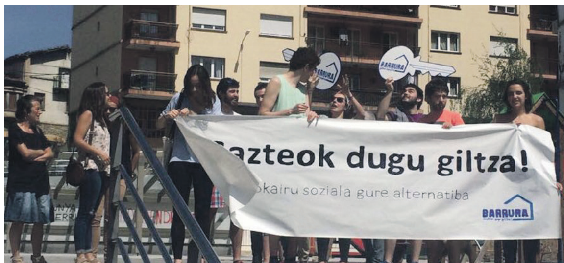
Zapatuan elkarretaratzea egin zuen Barrurak.

tarte horretako zaldibartarren %40 baino gehiago) proposamenak, baita herriko hamar eragile sozialen atxikimendu publikoa ere. "Gure proposamena ez da itxia. Eztabaida piztu eta Zaldibar-ko gazteak emantzipatu ahal izateko aterabiderik egokiena eraikitzeke abiapuntua da", azaldu du Pello Zabarte Barrurako kideak.