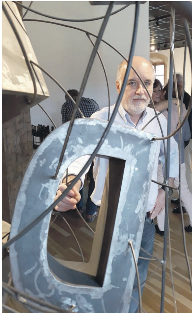
Arrizabalaga Arte eta Historia museoan, 'Letra Artean' erakusketaren inaugurazioan.

“ Pop-eko kolorea albo batera utzi eta beste muturrera egin dut jauzi, eskultura beltzetara ”