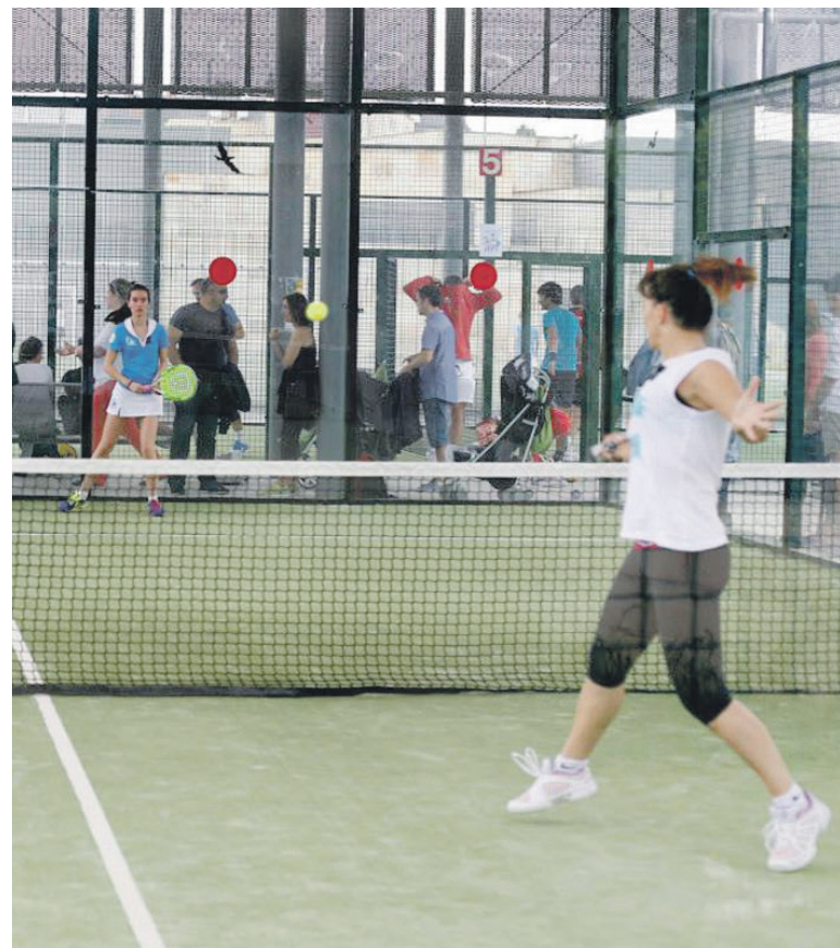
Gizonezko 32 bikotek eta emakumezko beste hainbestek parte hartu dezakete gehienez.

gizonetan eta emakumeetan. Maiatzaren 18an, 19an, 20an eta 25ean ligaxkako partiduak jokatu dituzte. Bikoteek egun berean jokatu dituzte ligaxkako partiduak denak. Multzo bakoitzeko irabazleek finalerdiak jokatu dituzte, maiatzaren 26an. Finalak hurrengo egunean izango dira.