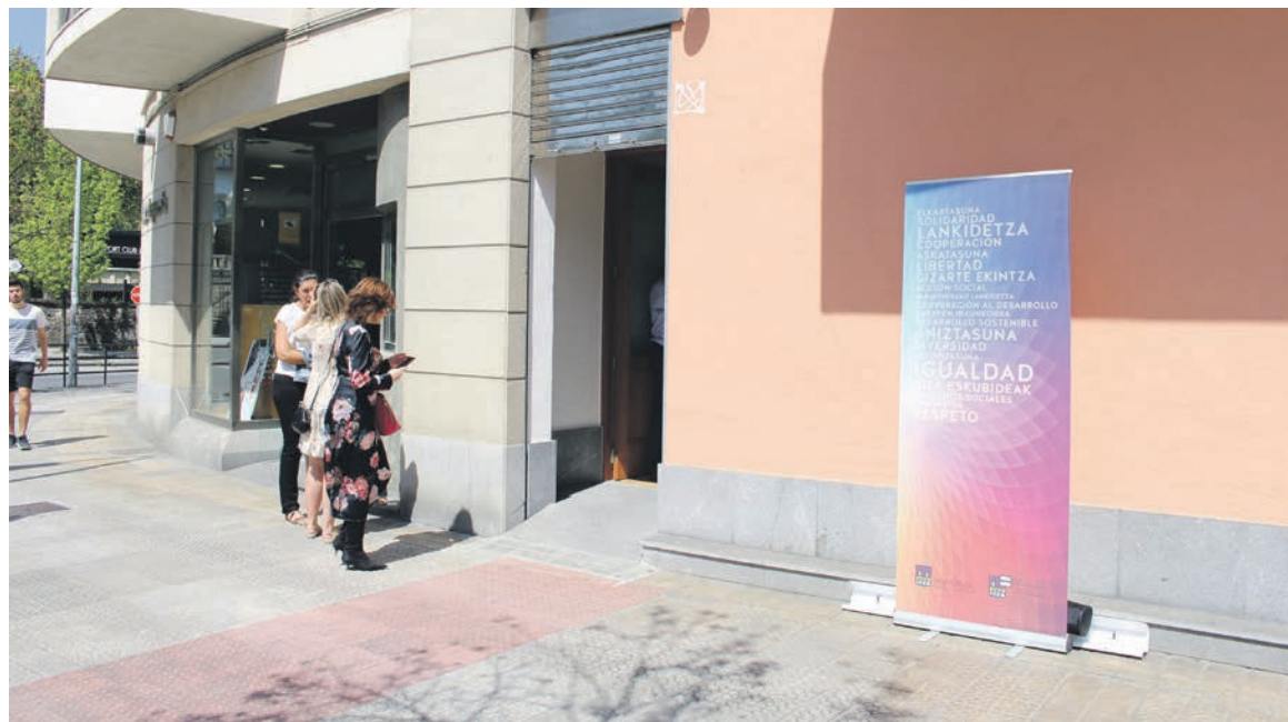
Laubideta kaleak Pinondorantza ematen duen izkinan dago lokala.

Amankomunazgoko presidentea ere egon ziren ekitaldian. Dibortzio gatazkatsuak izan dituzten bikoteei eskainiko diete zerbitzua; umeak bisitatzeko aukera edukiko dute lokalean, teknikarien