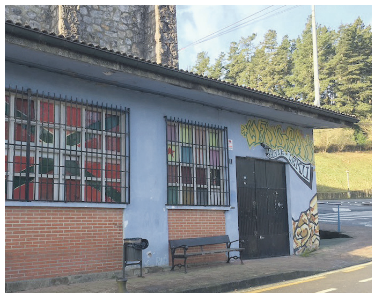
Izurtzako gaztelekuaren argazkia.