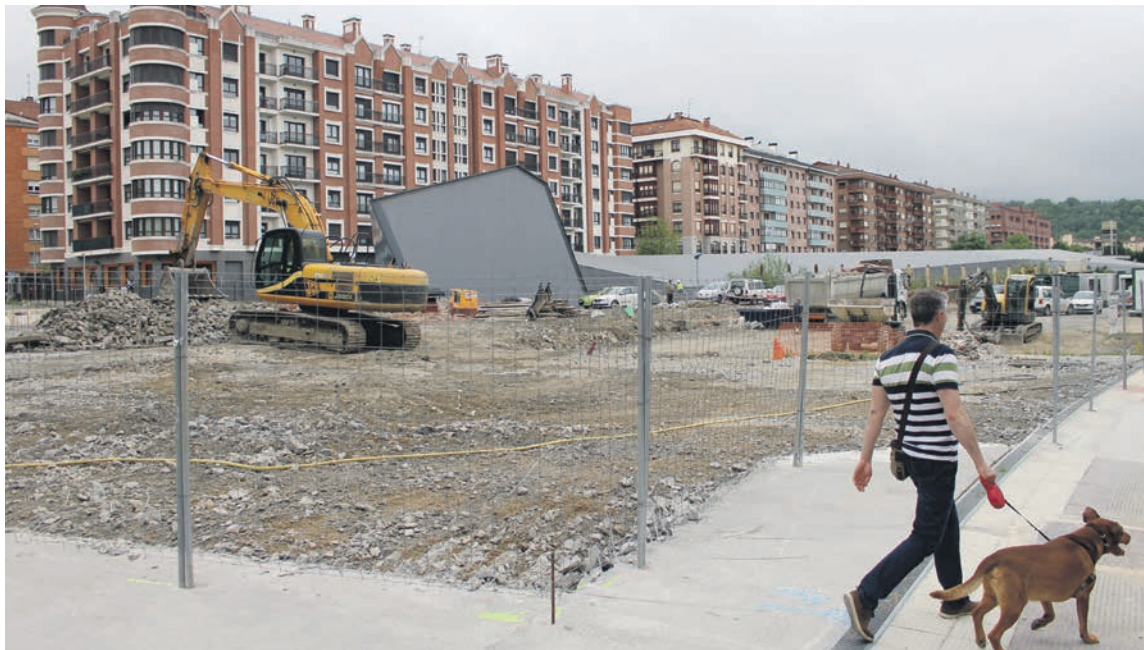
Estazio zaharra bota zutenetik, ingurua urbanizatzeko lanetan dabilta beharginak.

2006an landutako plan bereziari otsailean eman zion onarpena udalak; eremu horretako zehaztasunak ez daude argi