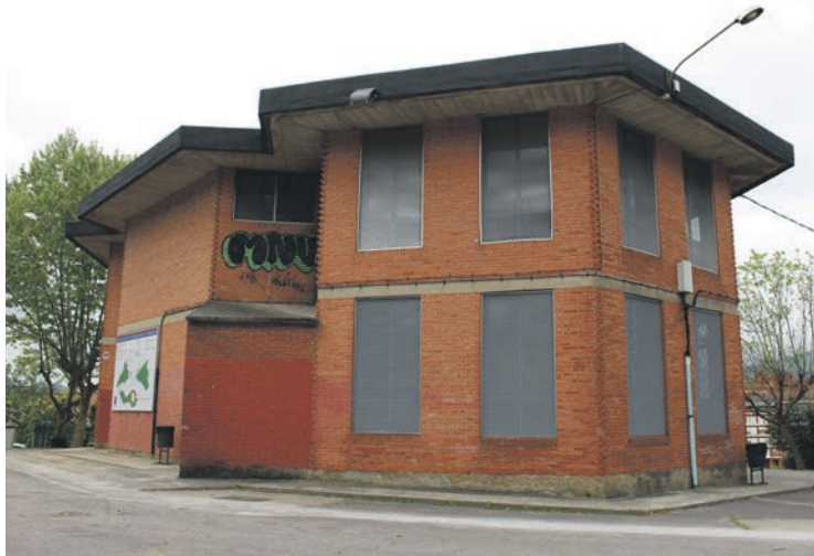
Eraikin hexagonalak Maiztegi ikastetxearen ondoan dago.

Sanmigeletarako erabiltzeko moduan egongo den eraikina IUGazte programa garatzeko erabiliko dute