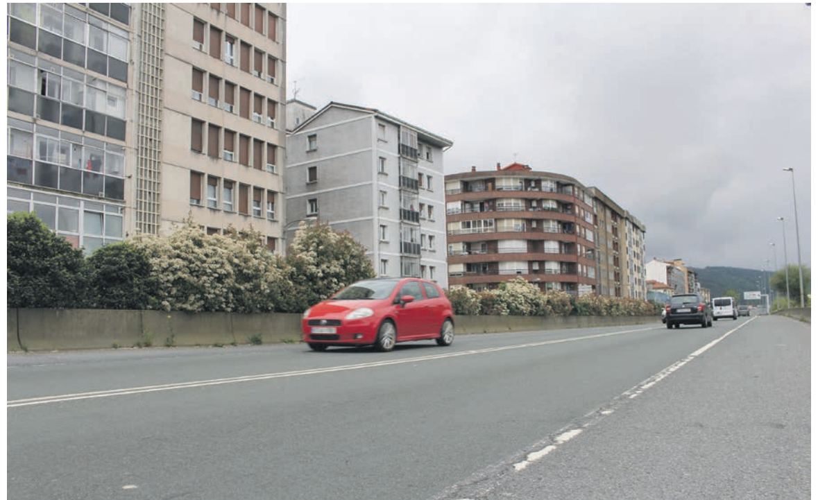
N-634 errepidearen berrantolaketa lanei 1,5 milioi euroko inbertsioa eskatuko dute guztira.