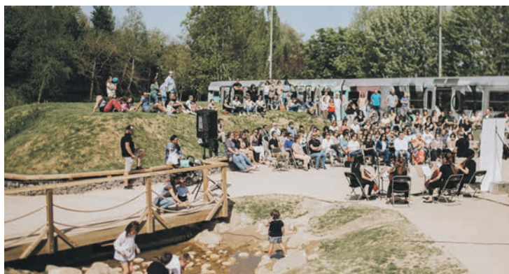
Eguraldi ona lagun zutela inauguratu zuten gunea. Lehiur Elorriaga

Lau urteko prozesu baten ostean zabalduta dute jolasgunea. Ikasleei galdetuta eraldatu dute; mutilen protagonismoa bajatu eta erabileran parekidea izan gura du, baita naturagaz hartu-emanean ere.