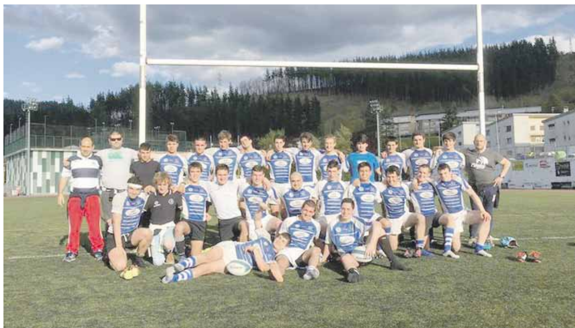
Durango-Elorrio taldea 25 bat jokalarik osatzen dute aurten; aspaldiko kopururik handiena da.