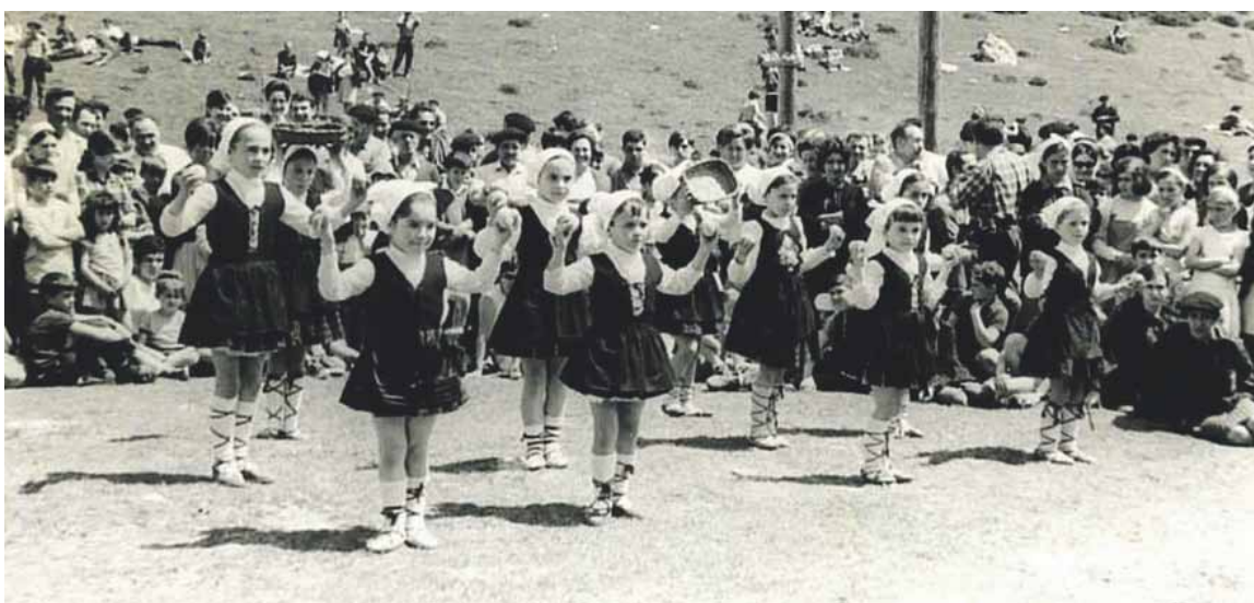
1968an Mugarrikolandako iturria inauguratu zuten Txoritxu Alaiko dantzariak.