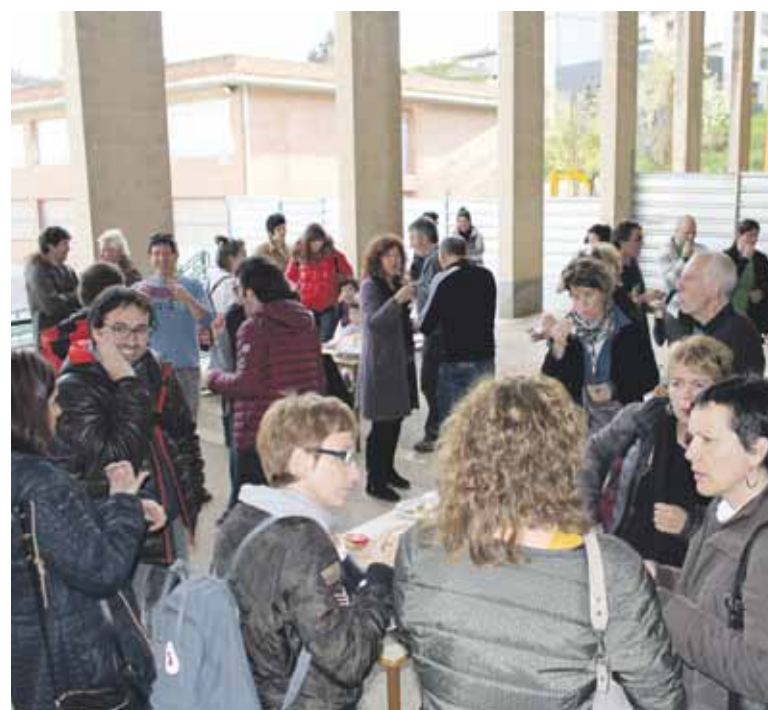
Jai-giroan egin zuten aurkezpena.

Bestalde, Urkiola Landa Garapeneren bidez, catering enpresetako ordezkariekin batu dira mugimenduko kideak. Udara bitartean, astean behin bertako eta sasoiko produktuak eskaintzea eskatu diete enpresei.