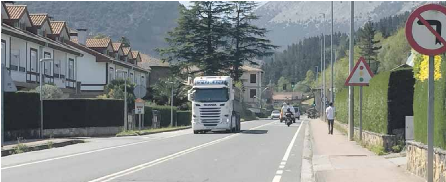
Gaur egun errepideak erditik zeharkatzen du Izurtzako herrigunea.

Plan orokorrean jasotzeko, herritarren partetik ahalik eta sostengurik handiena izango duen irtenbidearen bila dabilta