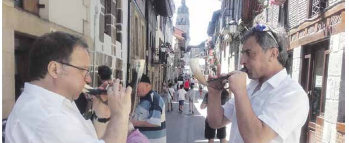
Jaia, batez ere, Artekale kalean dauden tabernen inguruan izango da.

Plazan Basajaun taldearen erromeria hasiko da iluntzean; Gaztetxeak ere musika kontzertuak antolatu ditu gauean, Backbone eta Kohatu taldeen zuzenekoekin