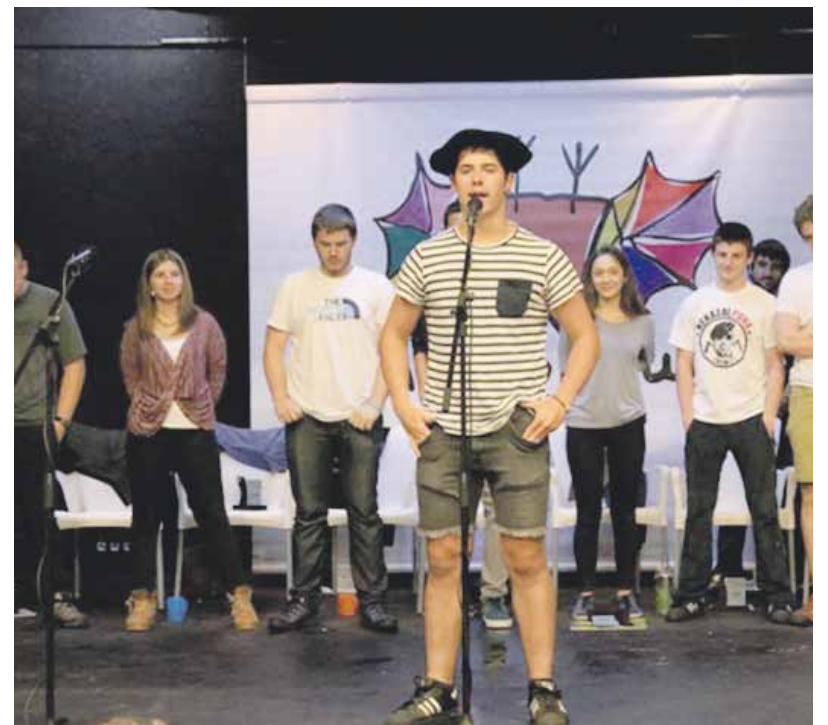
Gonbidapen-txartela Errota kultur etxean jaso daiteke, apirilaren 30etik aurrera.

Jaietako antolatzaileek adierazi dutenez, pertsonako bi sarrera emango dituzte, gehienez jota.