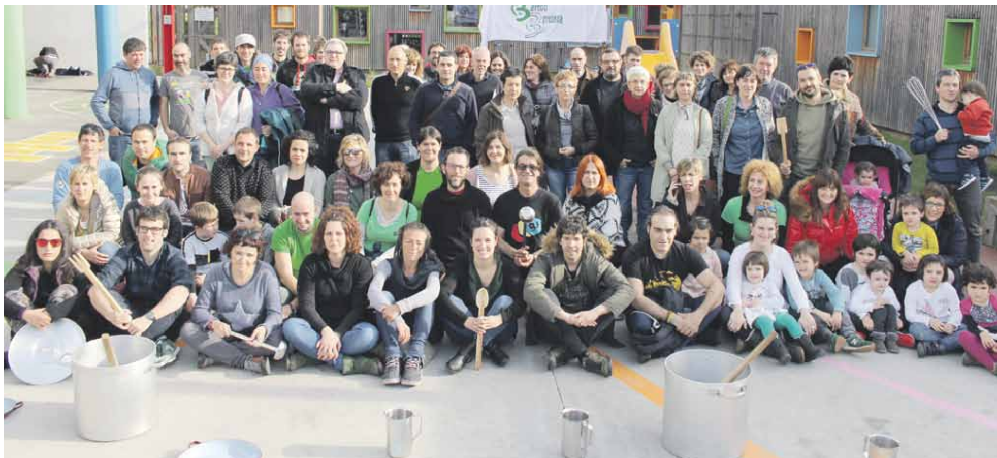
Dozenaka guraso, ordezkari eta eragile elkartu ziren bideo kliparen aurkezpenean.