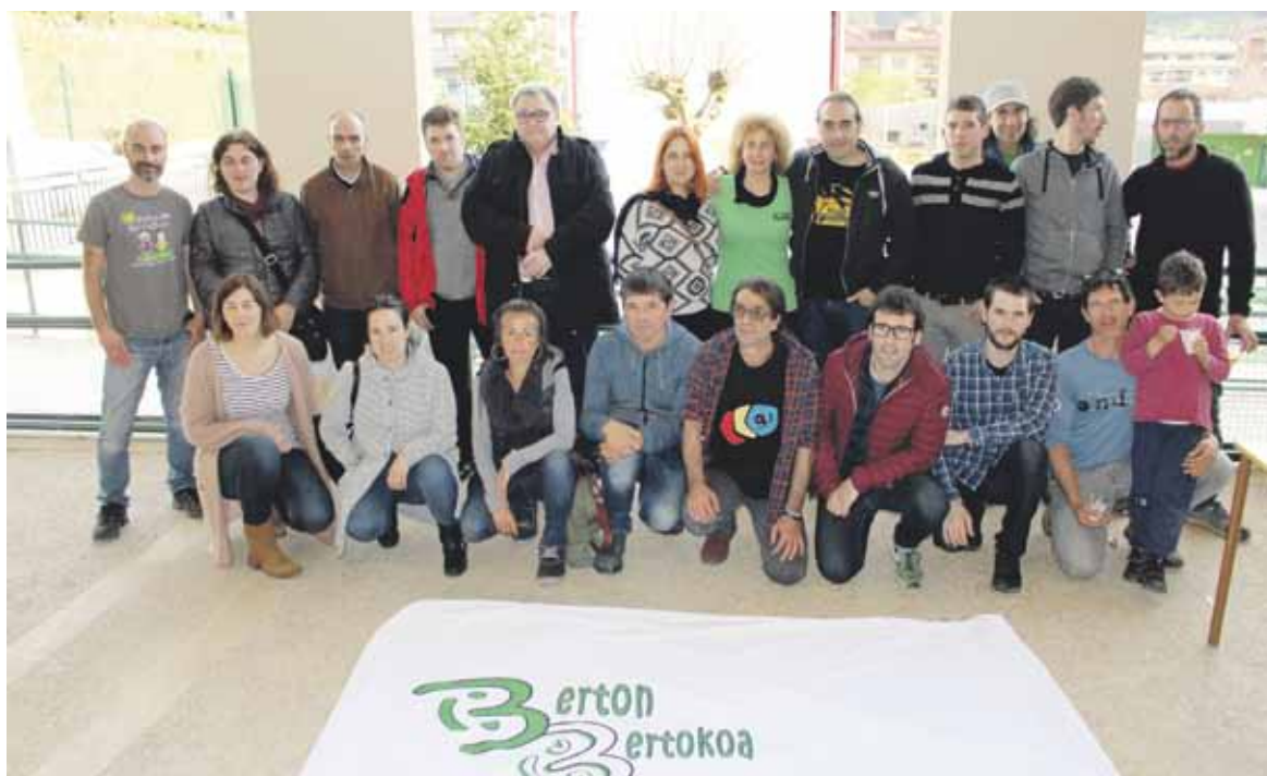
Dinamikaren bultzatzaileak, politikariek batera ateratako argazkian.

Aldarrikapen soiletik harago, euren nahiak praktikara eraman ahal izateko lanean dabilza Berton Bertokoako kideak. Eusko Jaurleri-