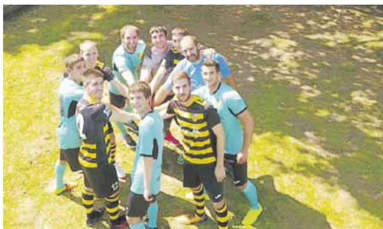
Ligako azken-aurreko jardunaldian Zaragozako Pinseque taldea hartuko dute etxean.

Mailari eusteko borrokan, aurkari zuzen baten kontra jokatu du asteburuan, Elorri-