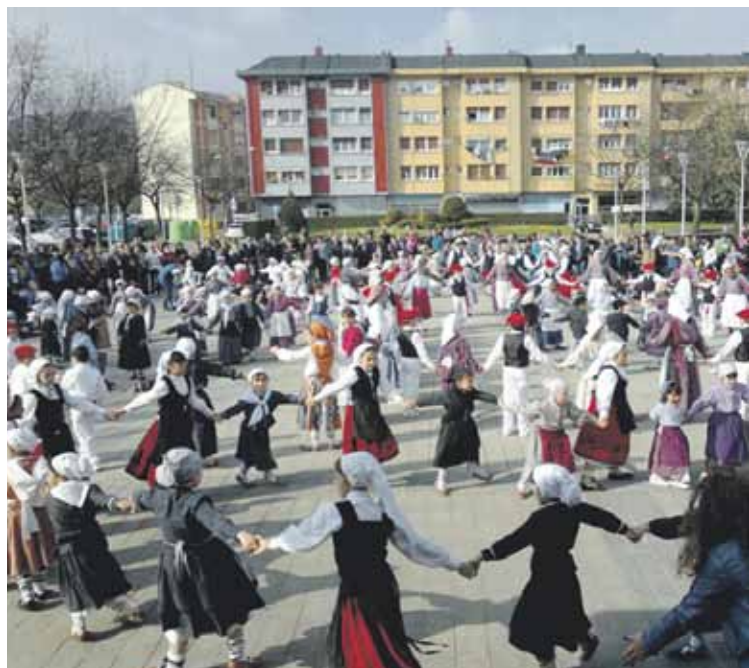
Jendetza batu ohi da Abadiñoan dantzez gozatzeko.

Egun osoko egitaraua antolatu dute Iluntzekoek. Eguerdian hasiko da jaialdia, eta taldeetako kideek Matiena osoan zehar egingo dute dantza, kalejiran irten eta gero. Arratsaldean, 17:00etan, denek elkarregaz egingo dute dantza, Traña Plazan.