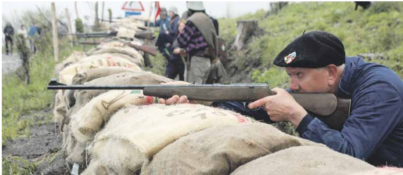
Domekan, 12:45ean, Elgetako kaleetan faxisten sarreraren errekreazioa egingo dute.

Fronteak Elorrion ere eragina izan zuela gogora ekarri guran, udalak ere Intxortako ekitaldiekin bat egin du