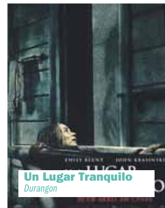
Un Lugar Tranquilo Durangon

ANBOTOk agendan ezer iragarri gura baduzu, idatzi agenda@anboto.org helbidera edo deitu 946 232 523 telefonora, eguazten eguerdia baino lehen.