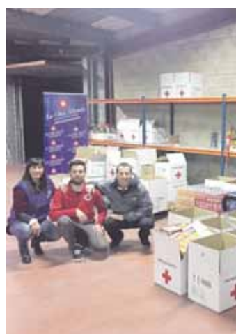
Gurutze Gorriak kudeatuko du janaria.

Bestalde, tuneleko ondotik Autzaganeko gainera doan errepide zaharrean oinezkoentzako eta bizikletentzako bidegorria egingo dutela azaldu zuen inaurgurazio ekitaldian Unai Rementeria ahaldu nagusiak. 725.000 euroko aurrekontua izango du.