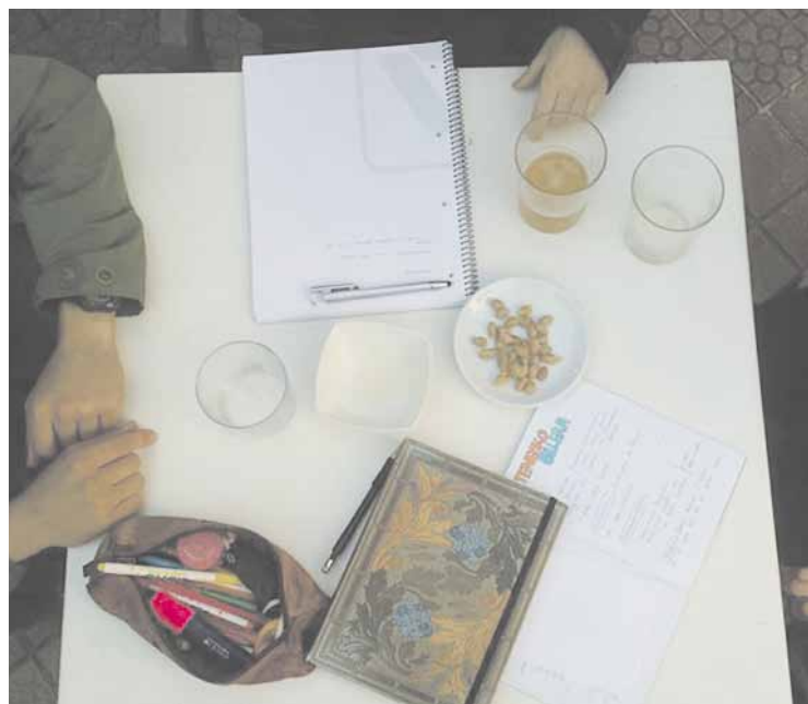
24 orduan testu bat idatzi beharko dute parte-hartzaileek.

dizkariak hainbat atal izango ditu: literatura, margolaritza... eta ekainean argitaratuko den lehen alean 24 Ordu Paperean jolasean sortutako lanak ere argitaratuko dira. Bihar, 12:00etan, abiatuko da 24 Ordu Paperean . Sare sozialen bidez gai bat eta berba bat jakinaraziko dituzte, eta horiek abiapuntu hartuta, parte-hartzaileek testu bat osatu beharko dute 24 orduan.