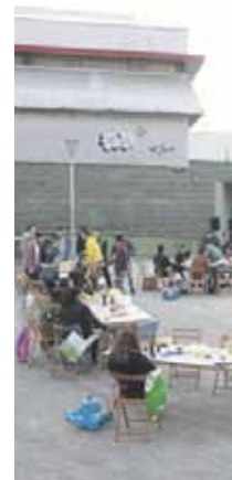
Jendetza batuko da maiatzaren 5eko tortilla txapelketan

23:00 Jaialdia Traña plazan: Puro Relajo eta Garilak 26 .