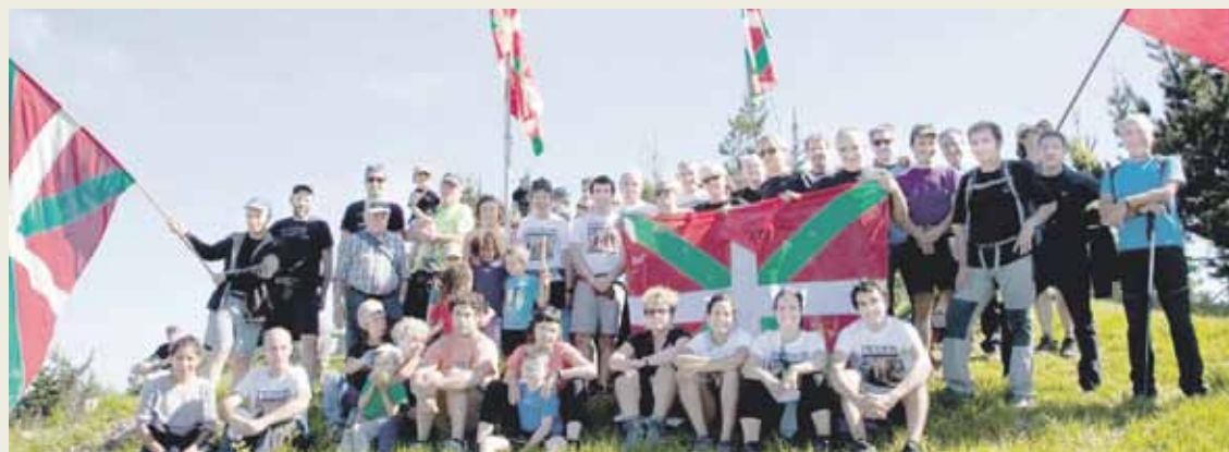
Urtero lege, jende ugari batu zen Santamañezarren Castet eguna ospatzeko.

Hilaren 25ean 81 urte beteko dira Santamañezarreko borrokaldian 40 gudari hil zirela