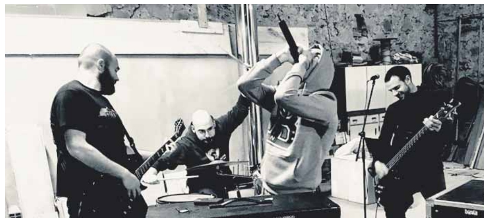
Basque Street Boys taldekoek jaietarako bereziki sortutako abestia dute: 'Trañakaña'.

Jai egitarauari erreparatu gero, musikak presentzia handia edukiko duela nabari daiteke. Ugari izango dira kalejirak, Trañabarren etorbideko erromeriak eta Traña plazako kontzertuak. Maiatzaren 5erako programatu dute emanaldi interesgarrietako bat: Muted, Basque Street Boys eta Eskupitajo etxeko taldeena. Gau berezi bat sortzeko asmoz igoko dira oholtzara rockzale horiek.