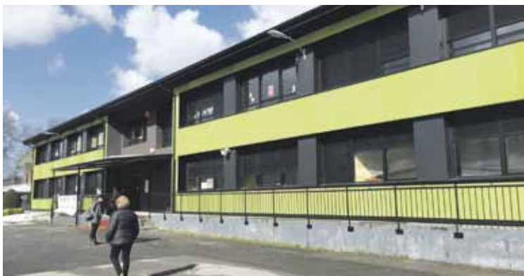
Eskola inguruko guneari buruzko hausnarketa egingo dute saio parte-hartzaileetan.

Horrez gainera, gazteekin ere lan saio bat egingo dute maiatzaren 5ean, 10:00etan, eta aste honetan zehar umeekin batzen dabilta, euren ikuspegia jasotzeko.