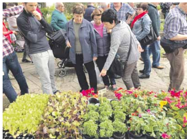
Landare, lore eta erreminta ugari ikusteko aukera eduki zuten azokara joan zirenek.