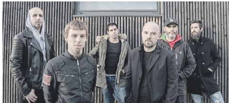
Muted taldeak orain zortzi urte amaitu zuen bere ibilbidearen lehen zatia.

Abadiñoako rock taldeenaz gainera, San Prudentzio jaietan antolatutako egitarauan Kaotiko taldearen zuzeneko da nabarmentzekoa