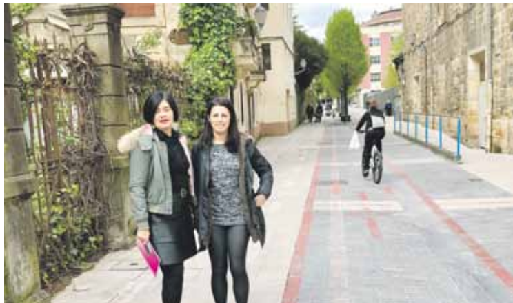
Rios eta Iriondo, ekimena aurkezteko ateratako argazkian.

Bide segurtasunagaz eta gidatzeagaz lotutako berbaldia eta tailerra eskaini dituzte