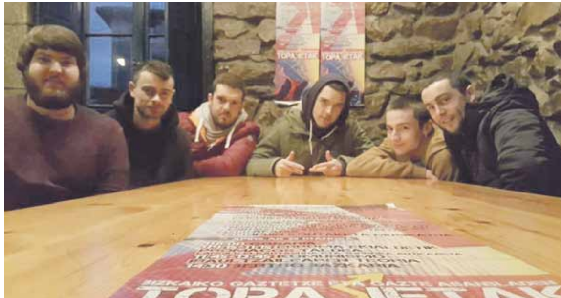
Abadiñoako Gazte Asanbladako kideak topaketarako deialdia egiten.

150 bat gazte biltzea aurreikusten dute antolatzaileek; hiru eguneko egitaraua prestatu dute, eta, besteak beste, hitzaldiak, kontzertuak eta tailer praktikoak egingo dituzte