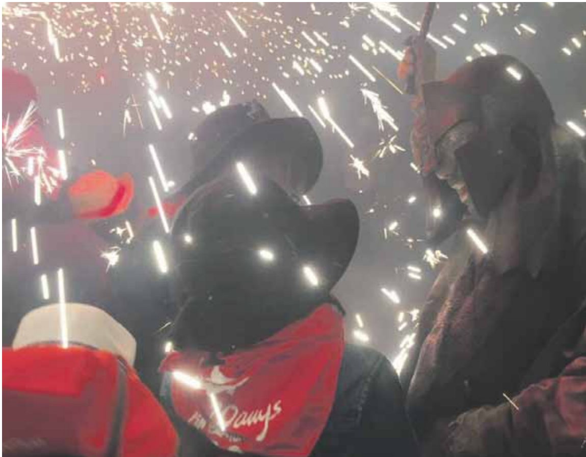
Herrialde Katalanetan horren errotuta dagoen correfoc-a ikusteko aukera egongo da jaietan. Penya AOAPIX