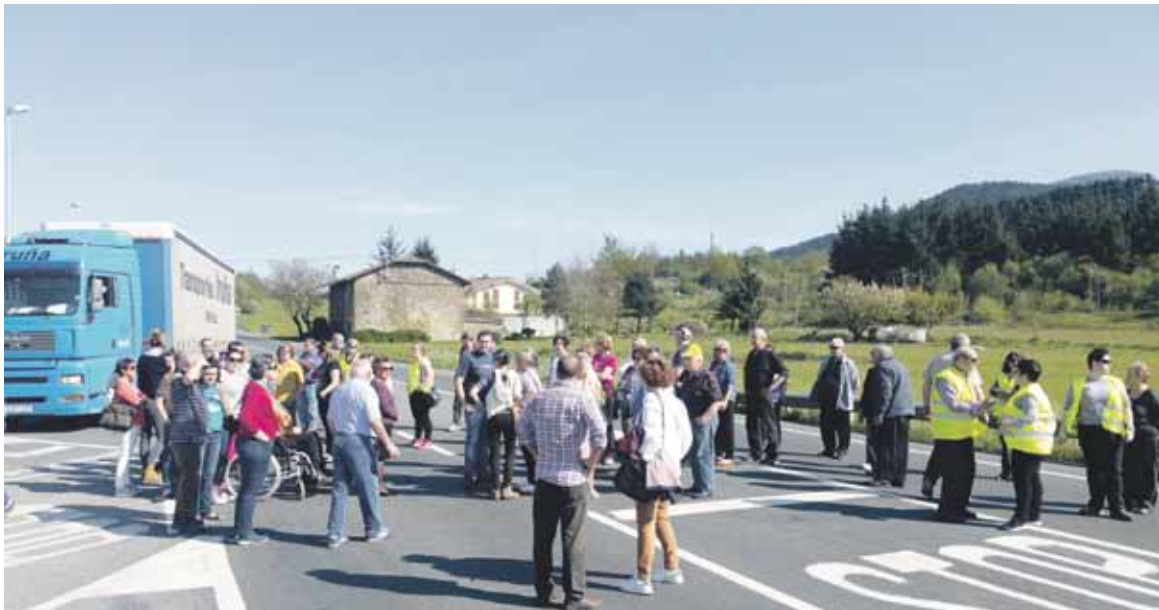
San Antonioko auzotarrak N-634 errepidearen erdian, protestan.

Astelehenean emakume bat hil zen Zornotzako auzoan, N-634 errepidea gurutzatzen zebilela; biharamunean auzotarrek errepidea itxi zuten, segurtasun neurriak eskatzeko