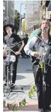
Txapito Guzman & Ibarako Langostinuek taldeak kontzertua emanango du merkatu plazan, maiatzaren 5ean, 17:00etan

10:00 Kickboxing opena Traña-Matienako kiroldegian.