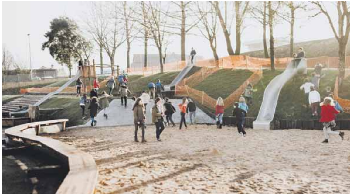
Ikasleen iritzia ezagutu eta gero, guztiz eraldatu dute jolastokia. Lehiar Elorriaga

Lau urteko barne prozesu baten emaitza da ikastolako jolas eremu berria. Guraso talde batek sustata, ikasleei zelan jolasten ziren galdetu zieten, eta etorkizunean zelako gunea gurako zuten marrazteko ere eskatu zieten. Emaitzetako bat aurreikusitakoa izan zen: jolas eremuan mutilek hartzen zutela protagonismoa. Beraz, horri buelta emateko berrantolatu dute espazioa. Genero ikuspegia duen Durango lehen parkea da,