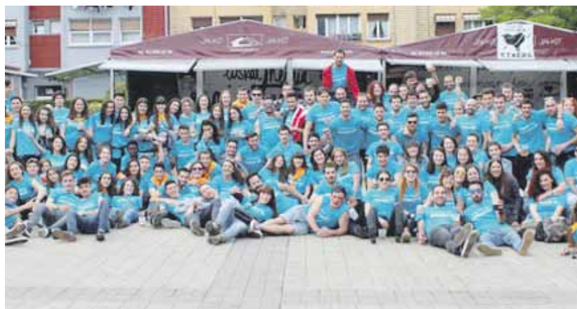
Urtero lez, gazteen artean jokoak egingo dituzte.