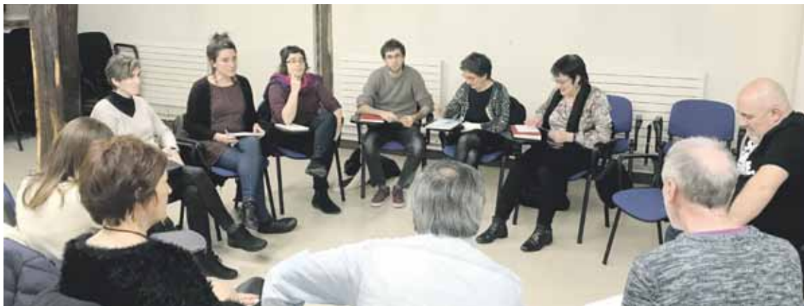
Euskara Kontseiluak eguaztenean egindako batzarra, Pinondo Etxean.

Bestalde, Euskaraldiaren inguruko bilera irekia egingo dute martxoaren 13an, 19:00etan, AEKn. Euskal Herri osoan euskararen erabilera ohituretan eragin gura duen egitasmoan parte hartu gura dutenen ideiak ezagutu gura dituzte.