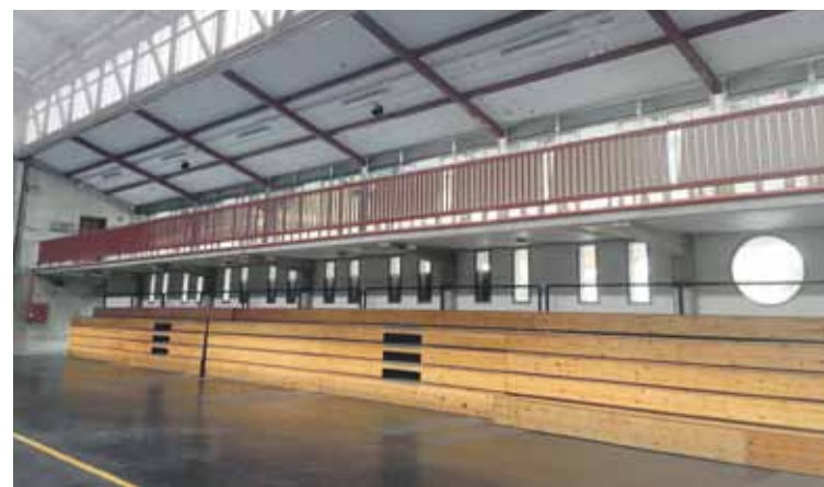
Gaur egun lehenengo solairuko pasilloak ia ez du erabilerarik.

Aurrekontuan 87.000 euroko diru atala gorde dute proiektu horri ekiteko