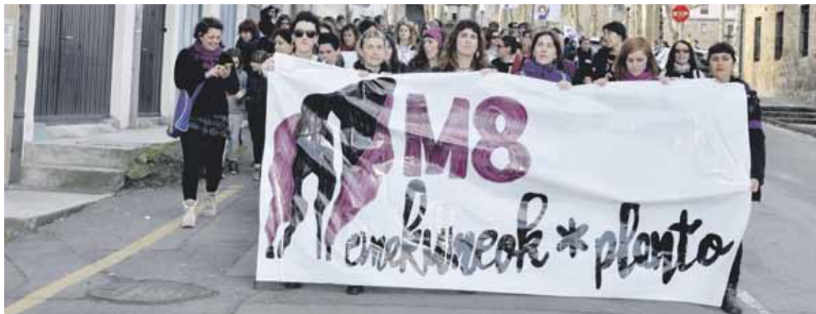
Abadiñon manifestazioa egin zuten.