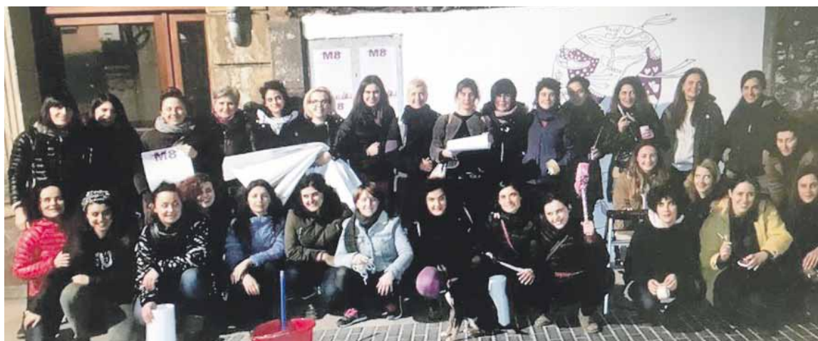
Durangoko emakumeek* planto plataformako kideak Goienkalen egindako muralaren aurrean.