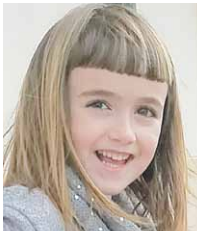
Zorionak, pitusi, familia osoaren partez! Segi beti bezain alaia izaten. Maite zaitugu. Muxutxu pila!