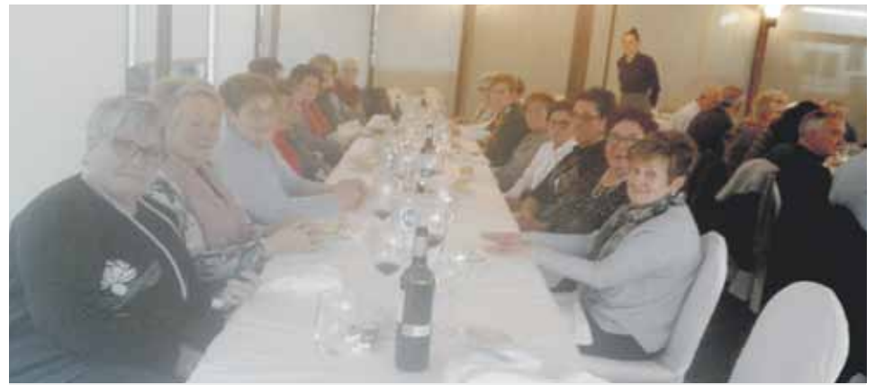
Paper-fabrikari lan egindako andrak Olajauregin batu ziren aurreko zapatuan, giro ezin hobean.

Hamabostean behin jasotako zorion-agurren artean tarta bat zotz egingo dugu . Zozketan parte hartzeko bidali kontakturako datuak zorion agurrekin batera.