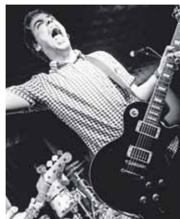
Mocker's eta Sermond's elkarregaz arituko dira Zaldibarko gaztetxean, honen urteurrena ospatzeko.