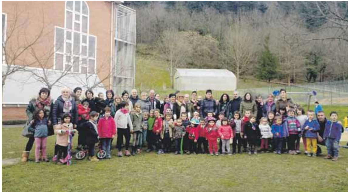
Zelaietako eskolako hainbat familia, sinadurak biltzen egon ostean.

Azken asteetan, Zelaietako guraso talde bat martxan jarri da umeen aisialdirako dauden gabeziak betetzeko alternatiba eske. Sinadurak biltzen ari dira, umeentzako agenda kulturala areagotzeko eta umeentzako jolas parke berri eta estalia eskatzeko. Jadanik, 350 sinaduratik gora bildu dituzte, eta Aste Santuko oporren aurretik hauek udaletxean entregatzeko asmoa dute. “Zelaieta oinezkoentzat egokitze obrak direla-eta, ume eta