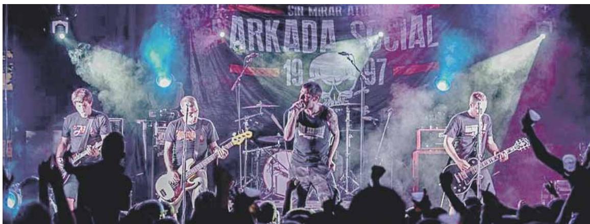
Arrasateko Arkada Social taldeak 21 urte daramatza streetpunka lantzen.

Txalainak, K.O. Etiliko eta Primeros Auxilios taldeen kontzertuak izango dira