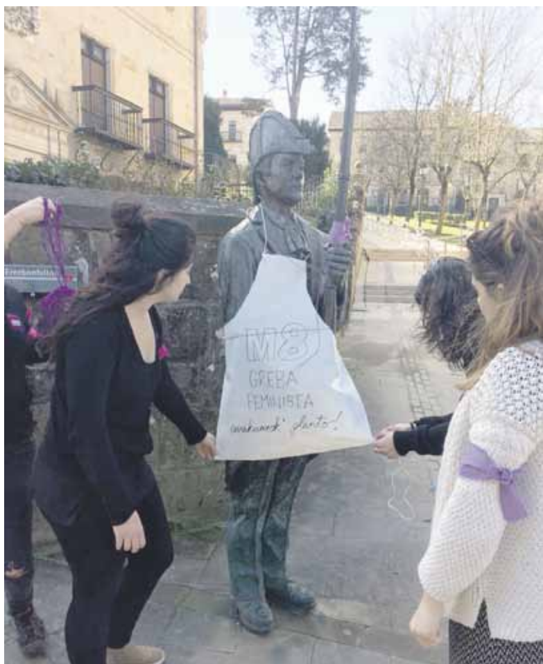
Elorriko hainbat mobilizazio antolatu zituzten atzo.

Bestalde, ANBOTOk emakumeek planto egin zuten, eta mobilizazioe- tan parte hartu ahal izateko, ados- tasunera heldu ziren erredakzioan.