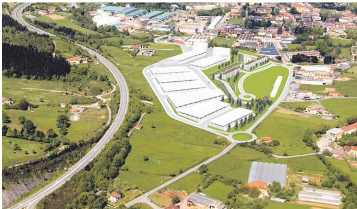
Pulla-Azkarretan 7 hektareako industrialdea eraikitzea gura zuten.