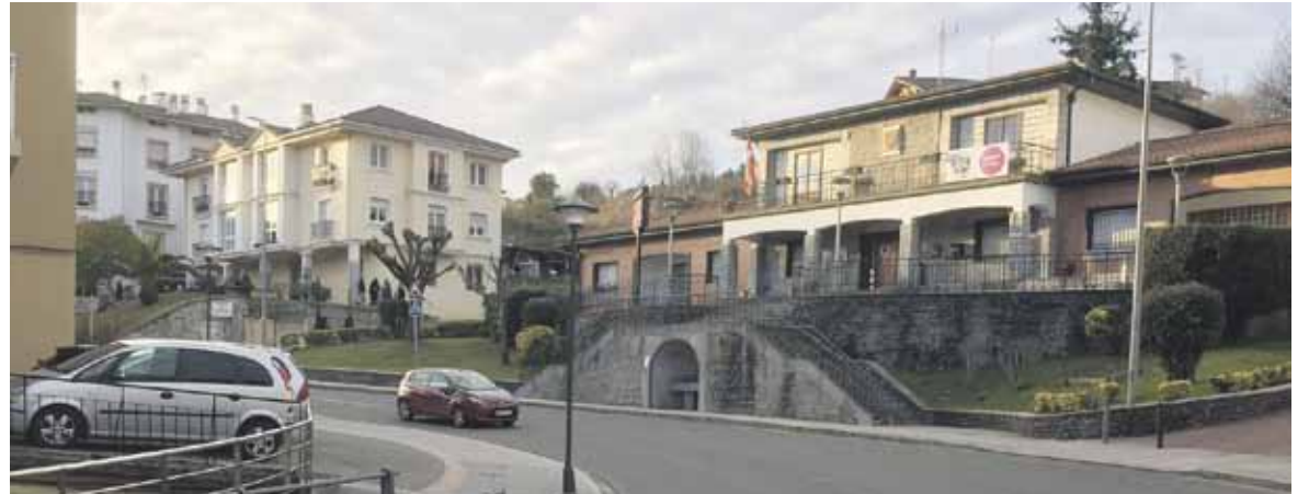
Udalak udaletxe aurrean duen aparkalekuan izango du geralekua taxiak.

Iurretako eta Berrizko udalekin ere batzartuko dira, euren esperientzien berri jasotzeko.