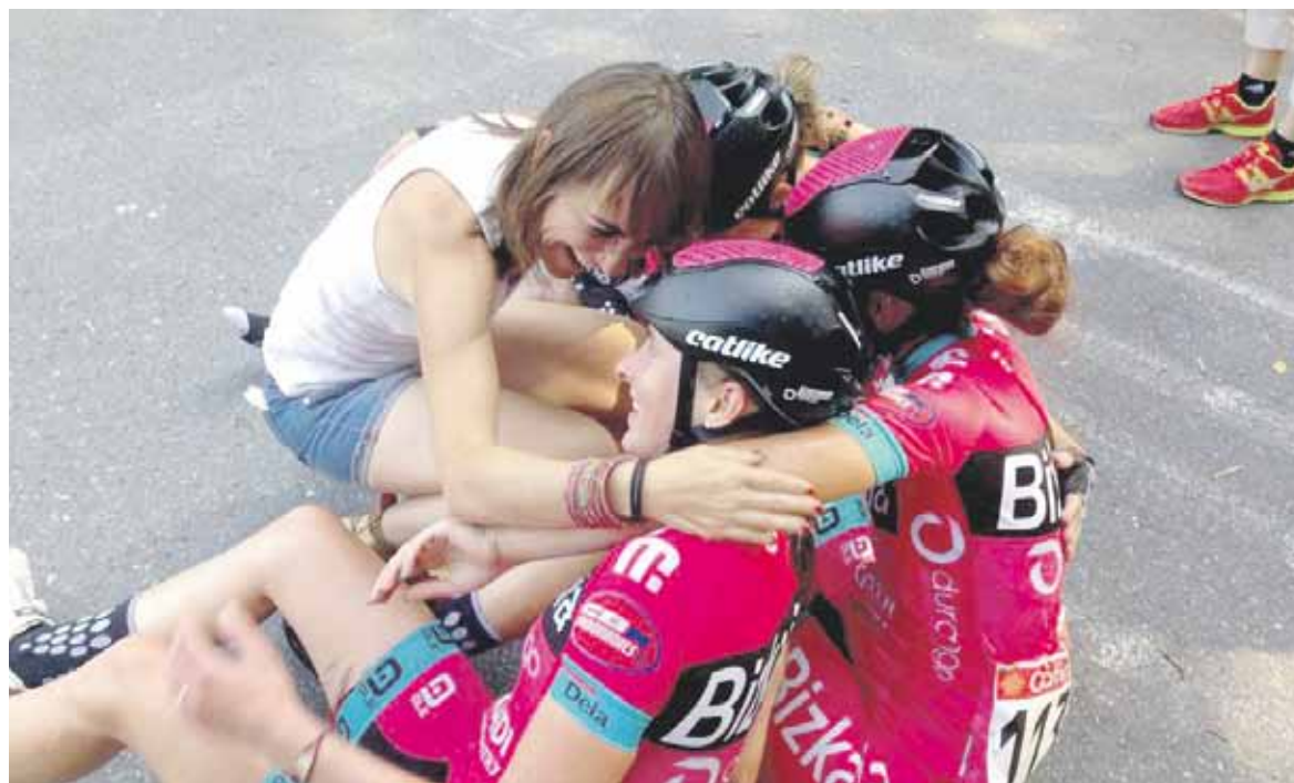
Talde batua osatzen dute eta ilusioz ekin diote denboraldi berriari.