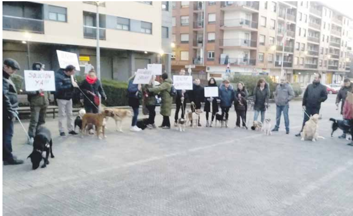
Orain aste bi, udaleko plenoaren orduan elkarretaratzea egin zuten udaletxearen ondoan.

Txakurren jabeek sinadura bilketa abiatu dute 'change.org' webgunean. Dagoeneko 359 sinadura batu dituzte