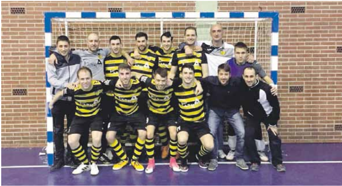
Elorrio Parra Taberna taldeko jokalariek joan zen asteburuko garaipenaren ostean.

Elorrioko kiroldegian jokaturako azkenengo bost partiduak irabazi dituzte