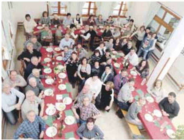
Martxoko lehenengo domekan Oromiñoko Eskolan ibili garienok alkartu gara eta giro ederraz bota dogu egune. Betiko kontuek eta auzuneko eta txikitteko zarraparrak ahotan ibili ditugu. Datorren urtien be antolatuko dogu, martxoaren lehenengo domekan; parte hartzeraz animau, bertako ikasle izan bazara.