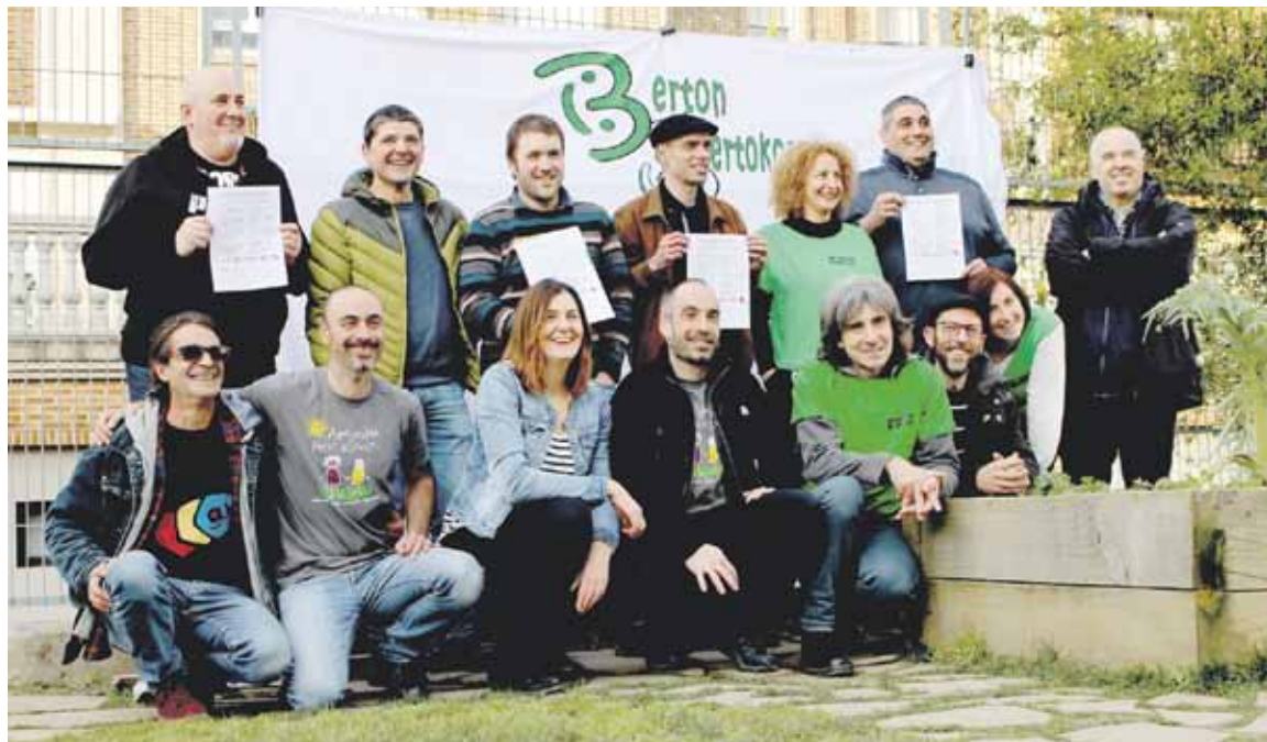
Eguazteneko prentsaurrekoan politikariak ere egon ziren, dinamikako kide diren zenbait gurasogaz batera.

Alderdi guztiek agertu diote atxikimendua Durangaldeko eskola jantokietako dinamikari