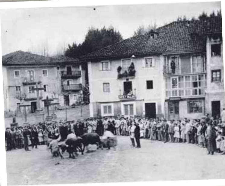
UNAI INGUNZA. 'ZORNOTZA ATZO'