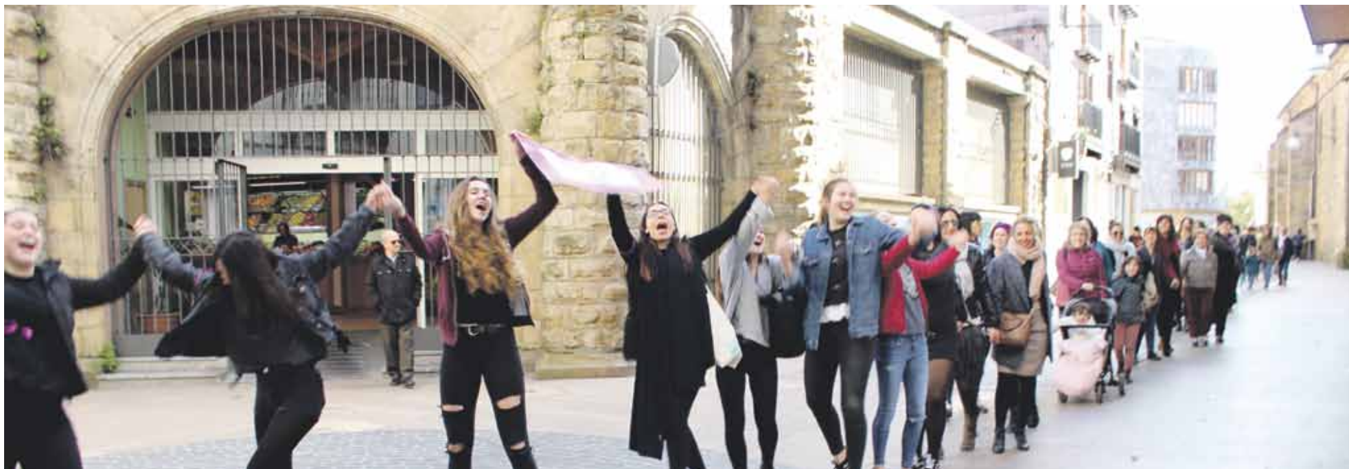
Durangon emakumeen katea egin zuten atzo Barandiaran nagusien egoitzatik Kurutzia gako zahar-etxera. 2.000 emakumek parte hartu zuten ekimenean.