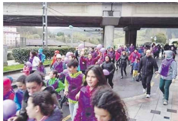
Adin guztietako herritarrak batzen ditu Añeketanek.