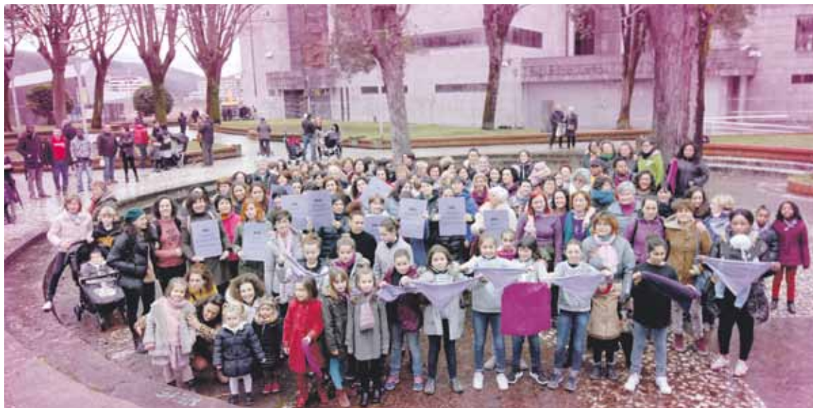
Durangon emakume ugari egin dute grebarako deialdia.