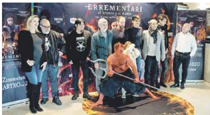
Errementariko lan taldea, aurkezpen egunean.

Hego Euskal Herriko zinemetan; eskualdean, Durangoko Zugazan eta Zornotzan eskainiko dute.