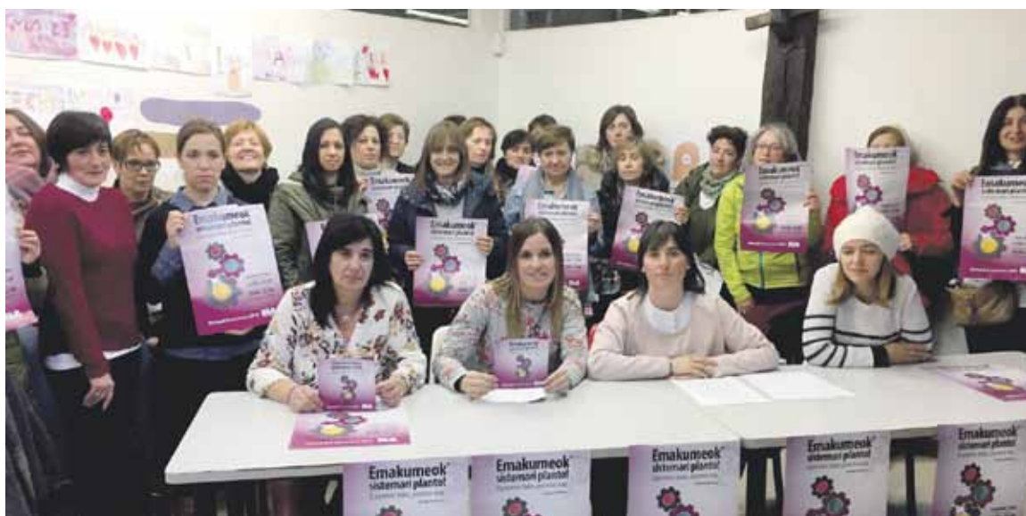
Garbiketa sektoreko ELAko beharginen soldaten desberdintasuna salatzen eta greba babesteko dute.