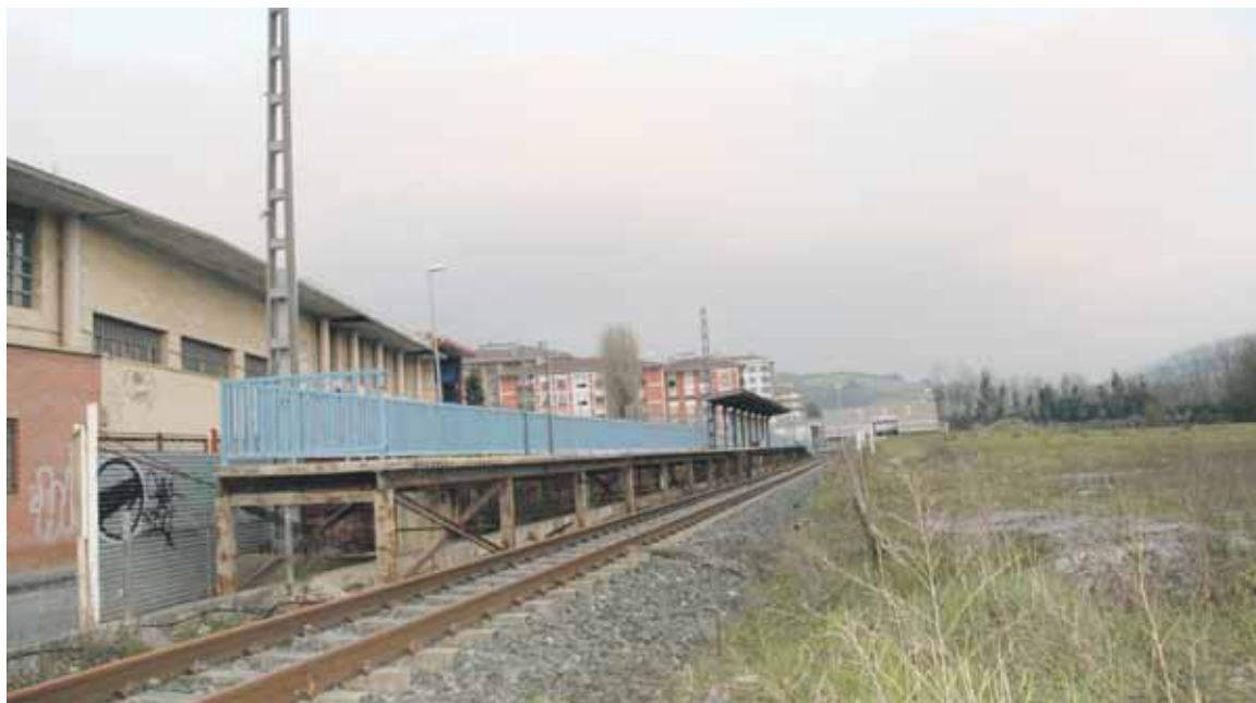
Atontze lanez gainera, aparkalekuak egingo dituzte.