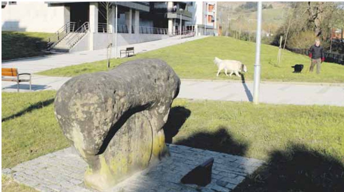
Muruetabarriko etxe berrien ondoan dago ipinita Idoloaren erreplika.

Kristo aurreko mendeetako datazioa duen eskultura historikoa sorterrira ekartzea gura dute; Euskal Museoak emandako ezezkoen aurrean, bide judizialari ekitea da asmoa