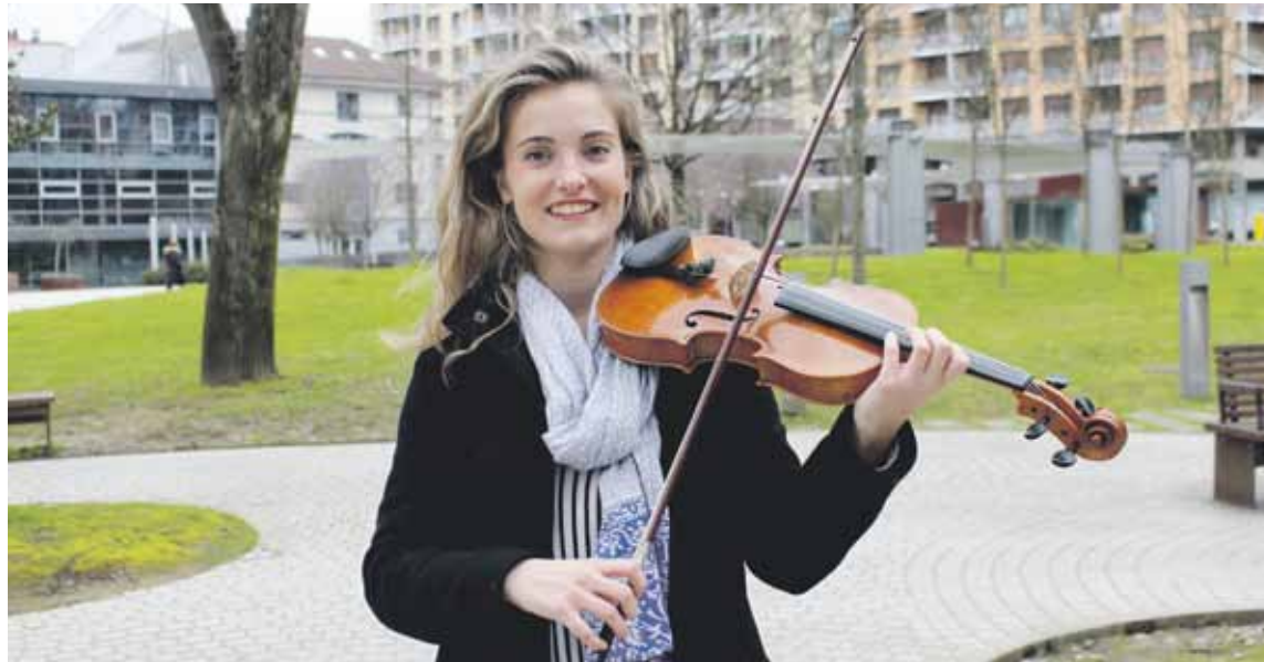
Musika klasikoetik aparte, jaza, rocka eta bestelako estiloak ere gustatzen zaizkio Zornotzako musikariari.

Kresala eta Lur Laukotea. Biak Musiken ezagututako lagunekin