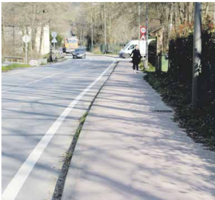
Bizikletariak hiru metro zabaleko erreiak eta oinezkoek metro biko espaloiak izango dituzte.

Etxanorako bidegorria amaitzeko bigarren faseko lanak hasi dituzte, 500.000 euroko inbertsioagaz