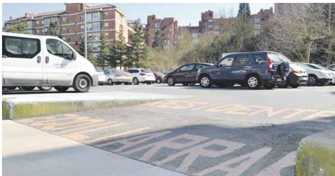
Tellituko aparkalekuan 70-75 leku daude gordeta egoiliarrentzat.

Bestalde, Aita San Migel plazaren inguruan aparkalekua egokitzeko aukerak ere aztertzen ari dira udal arduradunak, Belakortu ze-