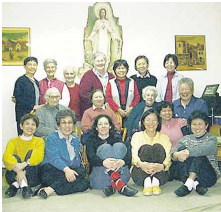
Berrizko misiolariak Japonian.