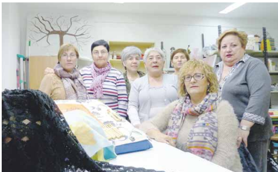
Helmuga elkarteko kideetako batzuk.

meek espazio publikoa okupatzea, bizikleta martxa finkatzea, ahalduz gaituta izatea eta ekimena modu autogestionatuan aurrera eramatea dela nabarmendu dute.