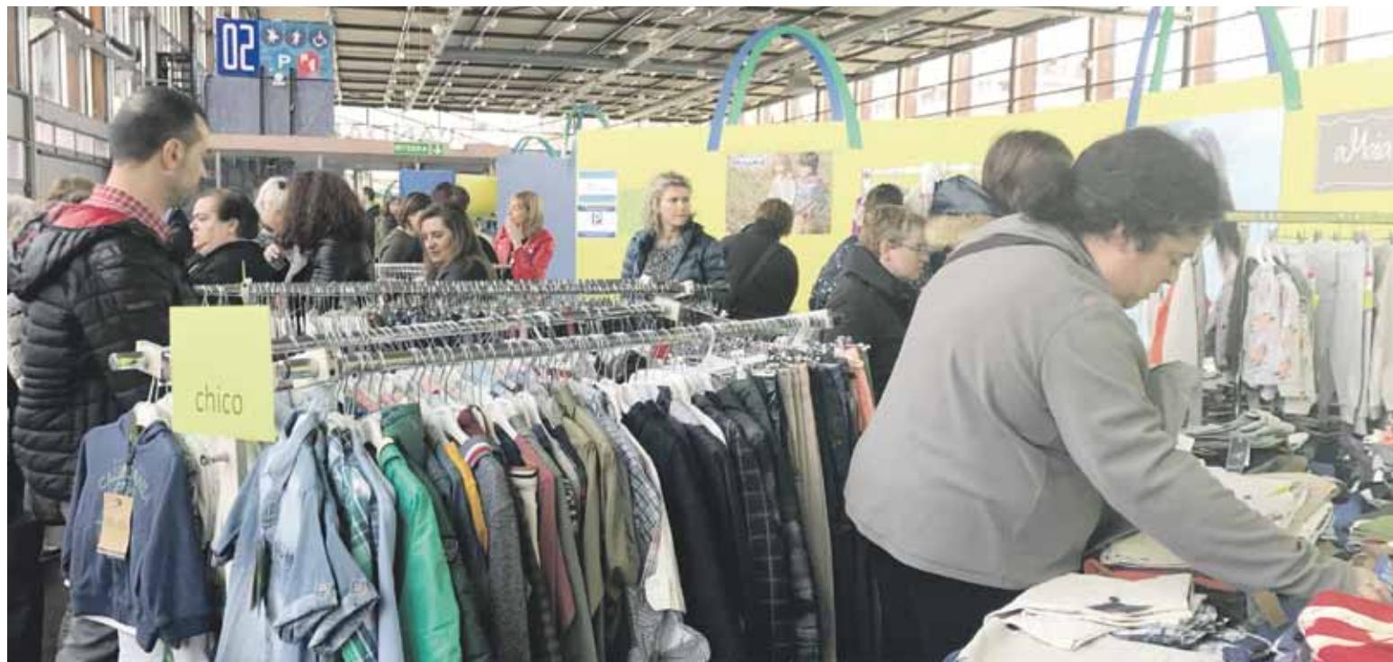
Barikuan, zapatuan eta domekan goiz zein arratsaldetan irekiko dute azoka.

Aurten 25 urte egingo ditu Mallabiko Jasokunde Abesbatzak. Hainbat ekitaldi prestatzen dabilta urteurren berezi hori ospatzeko. Esaterako, maiatzaren 26an, jaialdi bat egingo dute dantzariekin batera pilotalekuan. Abesbatzako partaide ohiei gaur egun koruan dabilzanekin batera kanta bat abes-teko deia egin diete. Hori izango da urteurrenako ekimen nagusia, baina ez bakarria. Izan ere, kultur hamabostaldian Jasokunderen ibilbideko argazkiak erakutsi gura dituzte. Horregatik, helbide elektronikoko bat bideratu dute abesbatzako argazkiak bidaltzeko ( jasokundeabesbatza@gmail.com ), eta herritarrei euren argazkiak helarazteko eskatu diete.