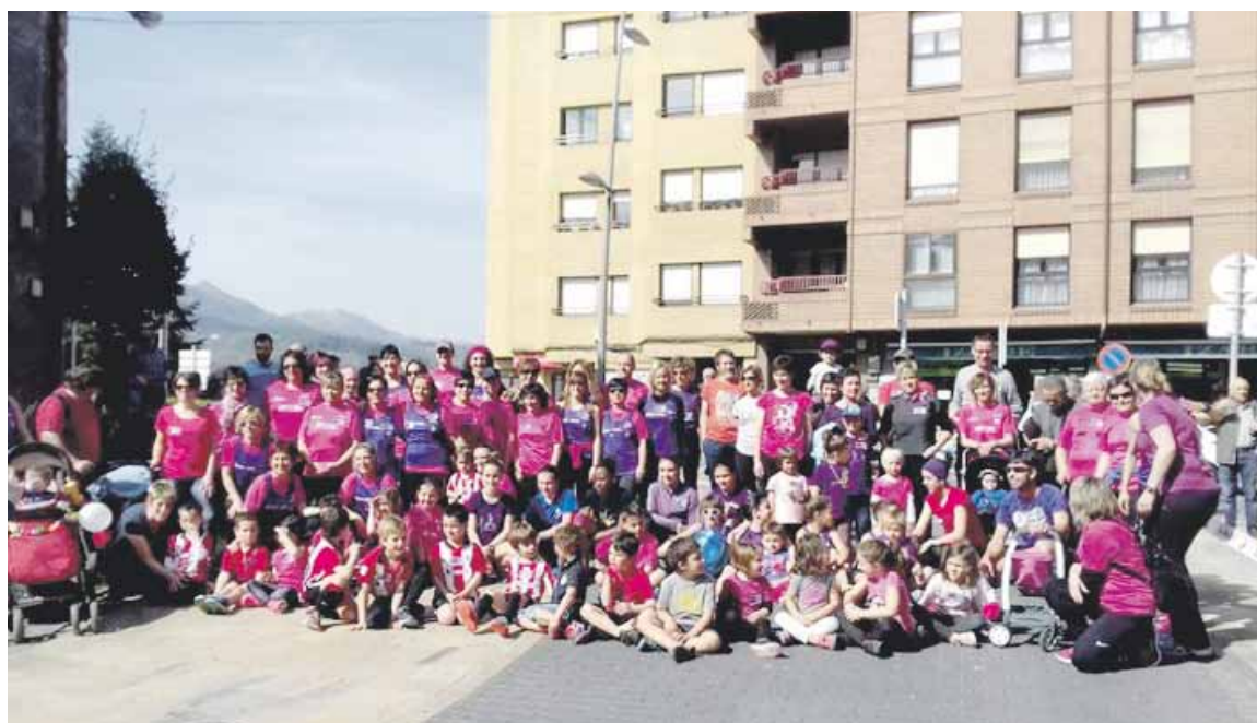
Iaz Iurretan antolatutako Milia Moreak hainbat korrikalari batu zituen berdintasunaren alde.

genuen, eta iaz Donostiako Lilatoia egin zen egunean. Aurten, beste lasterketaren bategaz ez kointziditza lortu dugu. Herri bakoitzak bere