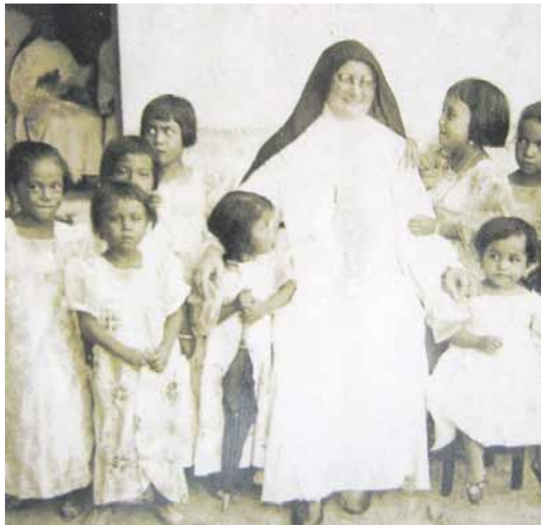
Margarita Maria Lopez de Maturana misiolaria.