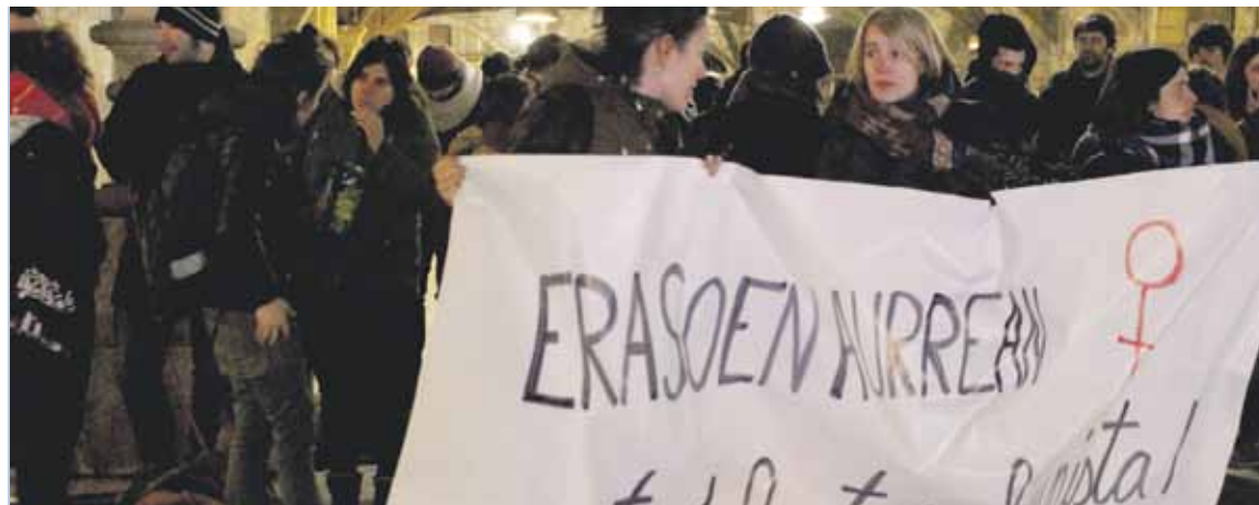
Martitzeneko Andra Marian egindako elkarretaratzea. Atzorako ere deituta zegoen.

Aipatutako erasoetako lehena astelehenean atera zen argitara. Emakume batek otsailaren 21ean bere gizonarengandik eraso jasan zuela salatu zuen. Udalak eman