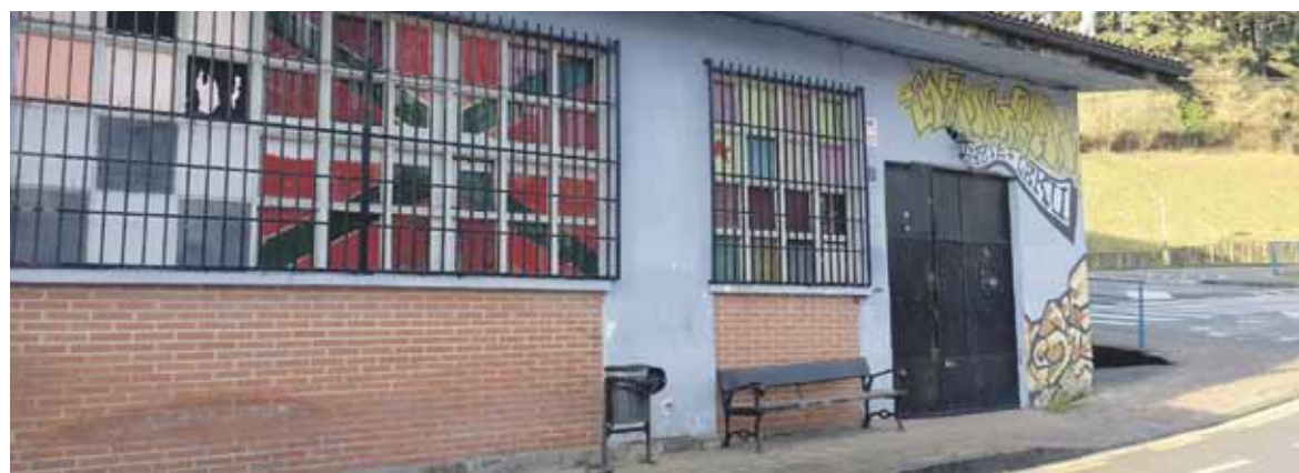
Gaur egun gazte gutxi erabiltzen dute aparkalekuaren ondoan dagoen Gaztelekua.

Herritar batzuek Tokiko Agenda 21eko batzar batean egindako eskaera da