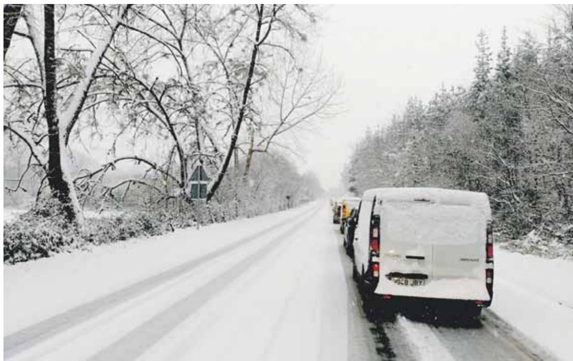
Zornotzara bidean ordu bitik gora egon ziren autoak geldirik.

Eguna argitzerako, Areitio zarratuta zegoela abisatu zuten Trafiko zuzendaritzatik, eta gainerako mendateetan kontuz ibiltzeko gomendioa emanda zuten. Orokorrean, trafiko sarea kolapsatuta zegoela jakitera eman zuten. Iurretan eta Zornotza artean, ordu bitik gora geldirik egin behar izan zituzten askok. Elurra kentzeko maki-