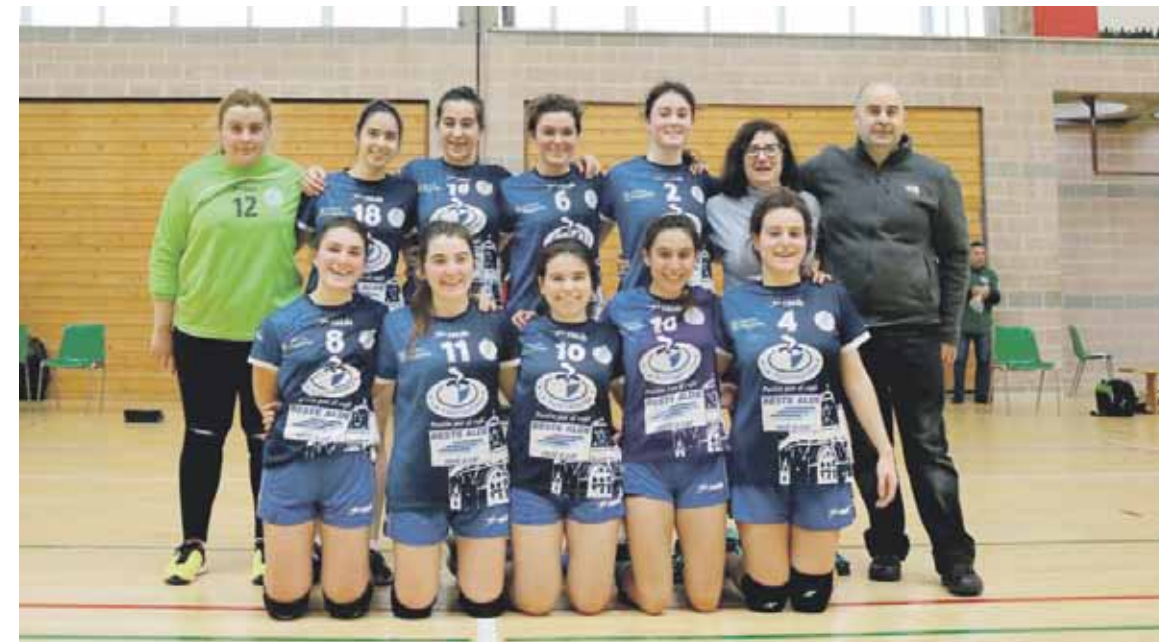
San Adrian taldearen kontra lortu zuten garaipen garrantzitsua ostean ateratako argazkia.

Sei taldeko ligaxkako onena Euskal Ligara igoko da zuzenean. Gainerako bostek beste fase bat jokatu dute mailaz igoko duen bigarren