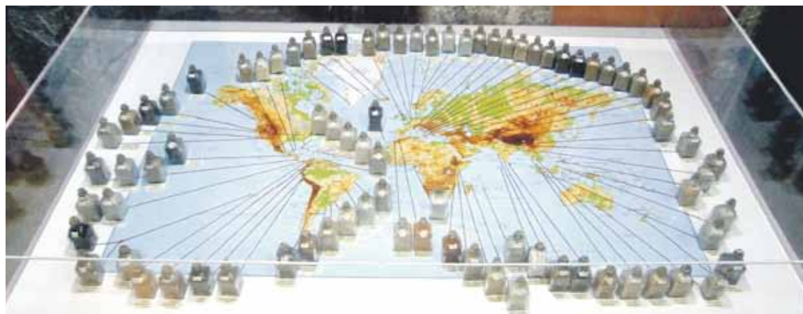
Mundu osoan batutako hareak poteetan sartuta eta sailkatuta dute.

Atxondoko Udaleko kideek jakitera eman dutenez, nahiz eta herritarren partaidetza handia izan ez, auzo batzarren balorazio "positiboa" egiten dute. Behin herritarrei aurrekontuak azalduta eta haien iritzia jaso eta, martxoan zehar aurrekontuak onartuko dituztela jakitera eman dute udal arduradunek.