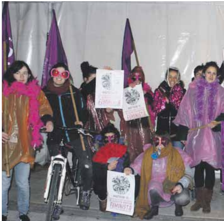
Joan zen eguenean feministak pintxo-potean ibili ziren Elorrion.

Datorren zapatuan, martxoak 10, Zaldibarren hasi eta Elorrion amaituko da VI. Bizikleta Martxa Feminista