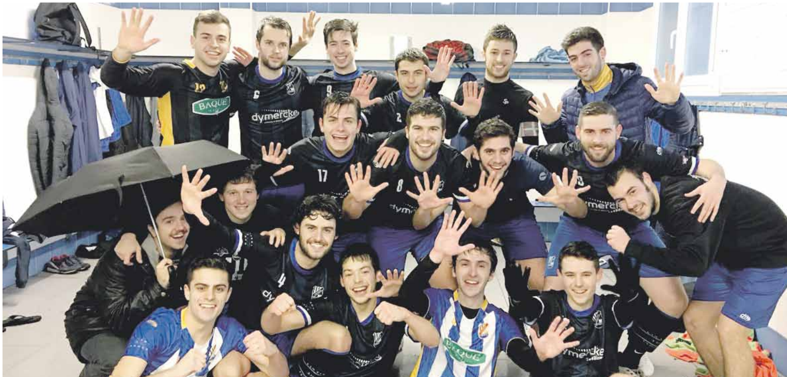
Hamar partidu falta dira liga amaitzeko eta asteburu honetan Etxebarrin jokatuko dute, San Antonio taldearen aurka.

Iaz sortu zuten taldea gazteei aukerak emateko eta jokalaria erantzuten ari dira; bigarren urtez jarraian igo daitezke