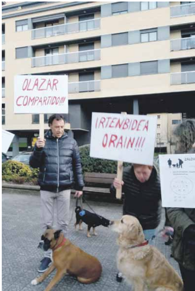
Astelehenean, Zaldibarko txakurren jabeek kontzentrazioa egin zuten udaletxe aurrean.

Arazoari irtenbideren bat aurkitu arte, txakurrak Olazarrera eraman ahal izatea eskatzen diote jabeek Zaldibarko Udalari