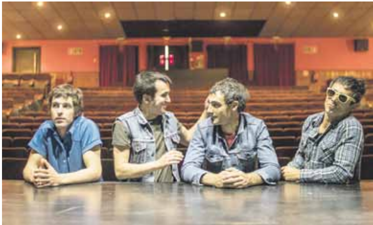
Sermond's-en kontzertua 14:50ean izango da.

Elkartasun jaialdirako sarrera guztiak aurrealmentan saldu dira. Landako Gunea jendez lepo egongo da, beraz