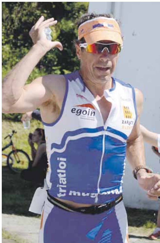
Azken 15 urteetan mundu mailako hainbat Iron Man egin ditu Txelak.