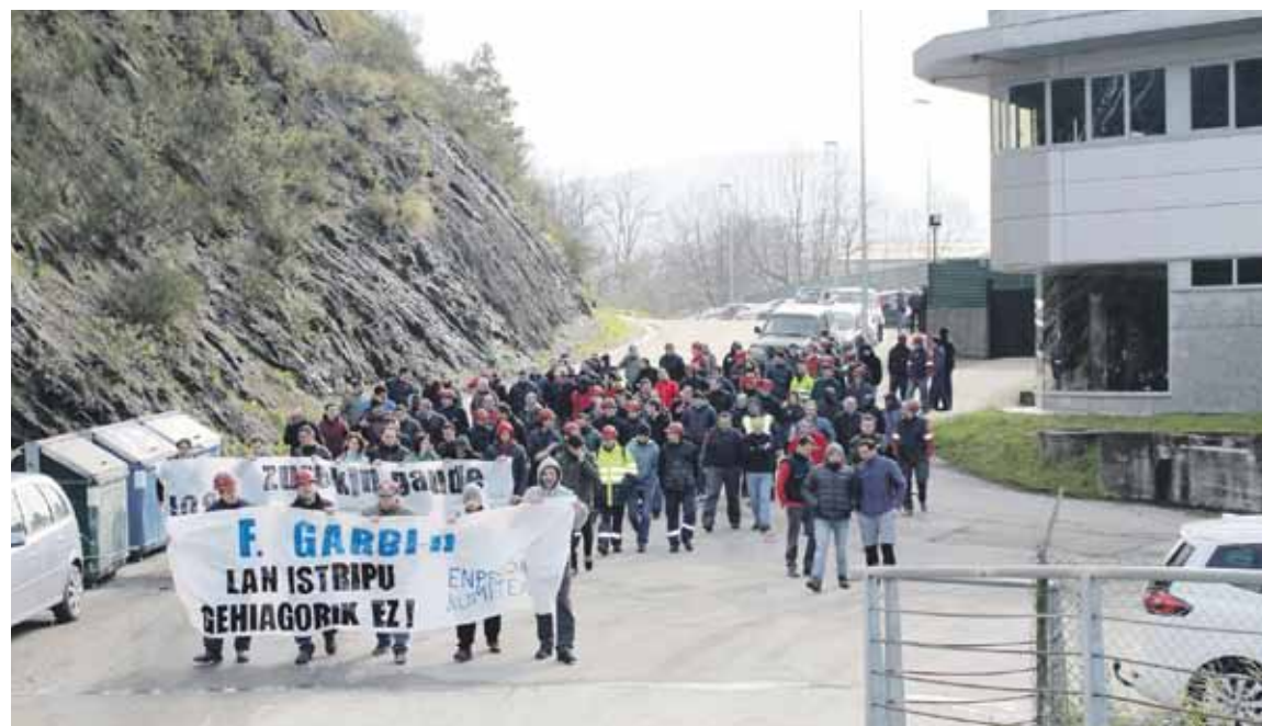
Lanuzteez gainera, langileek bi orduko elkarretaratzea egin zuten eguenean.

47 urteko langile batek besoa galdu du astelehenean martitzenerako goizaldean izandako istripuaren ondorioz