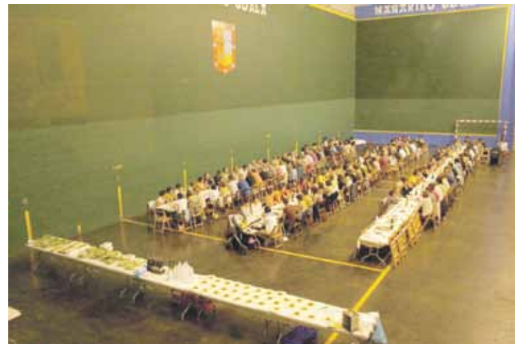
Andra Mari jaietako ekitaldietako bat herri bazkaria izaten da.

riak izango dira”, jasotzen du gutunak. Jai Batzordea orain sei urte sortu zuen herritar talde batek udalak egindako deialdi bati erantzun zionean.