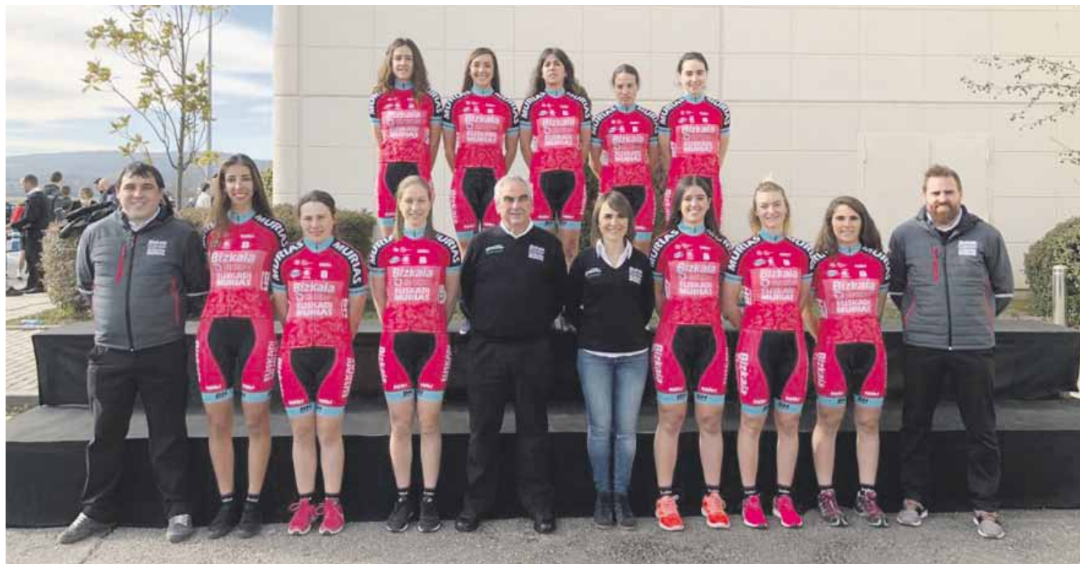
Urtarrilean aurkeztu zuten Bizkaia Durango-Euskadi Murias proiektua.

Durungaldeko taldea gonbidapenik barik geratu da maiatzaren 19an hasiko den lasterketan parte hartzeko