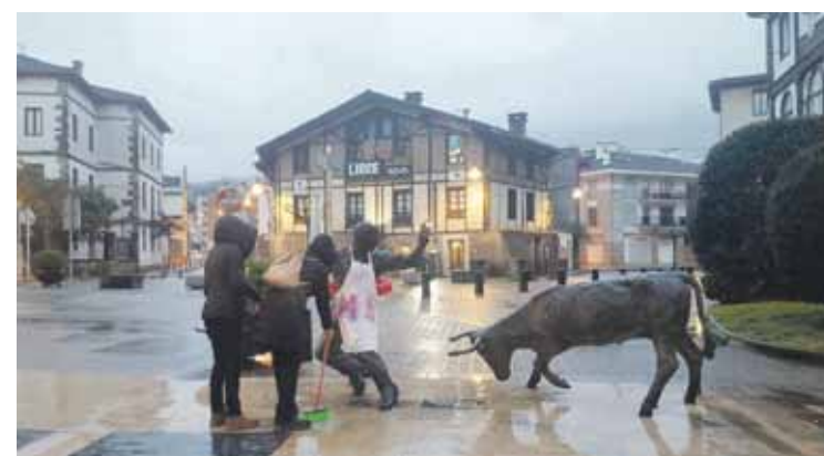
Feministak, Balbino Garitaonandia plazan dagoen monumentuan.

Hala ere, martitzenean bertan, amantalak eta erratzak kendu zituen udalak monumentuetatik. Mugimendu feministak kritika egin dio, eta datozen egunetako ekimenak babesteko eta errespetatzeko eskatu dio udalari.