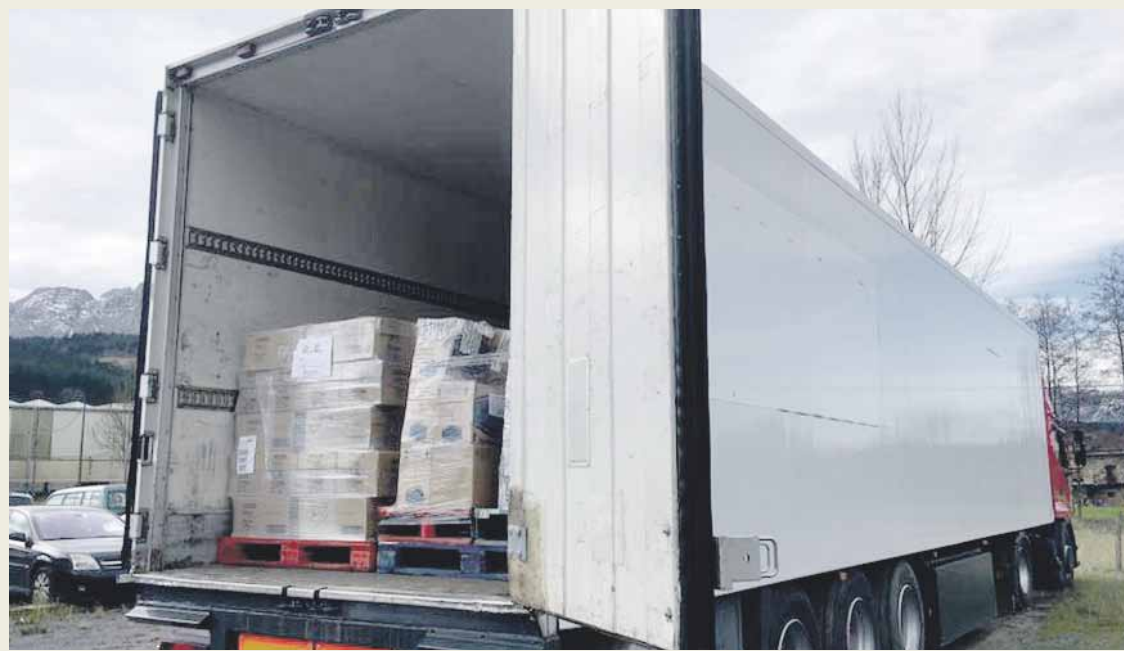
Kamioia prestatzen ibili dira azken egunotan, eta bihar irtengo da Tindufeko kanpamenduetarantz.

Kanpainan batutakoaz aparte, 12 tona elikagai erosi dituzte antolatzaileek, eta baita 1.300 konpresa pakete ere