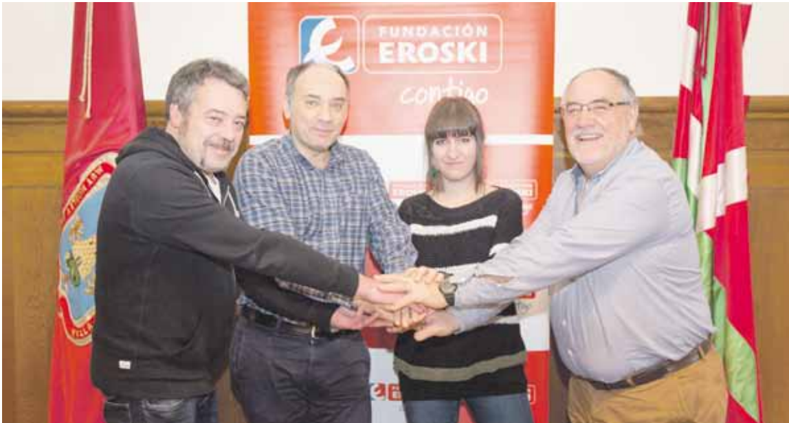
Joan zen astean sinatu zuten hitzarmena.

Hilero, beharrizana duten hamalau bat familiari ematen diete laguntza Elorrion