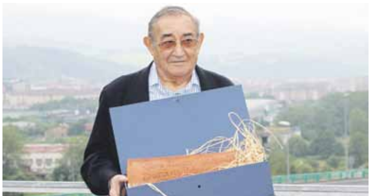
Pertika, Teila Saria jaso zuenean, 2017ko ekainean.

lazko ekainean omenaldi hunkigarria egin zioten, Durangaldeko dantzak ezagutarazten egindako lanagatik