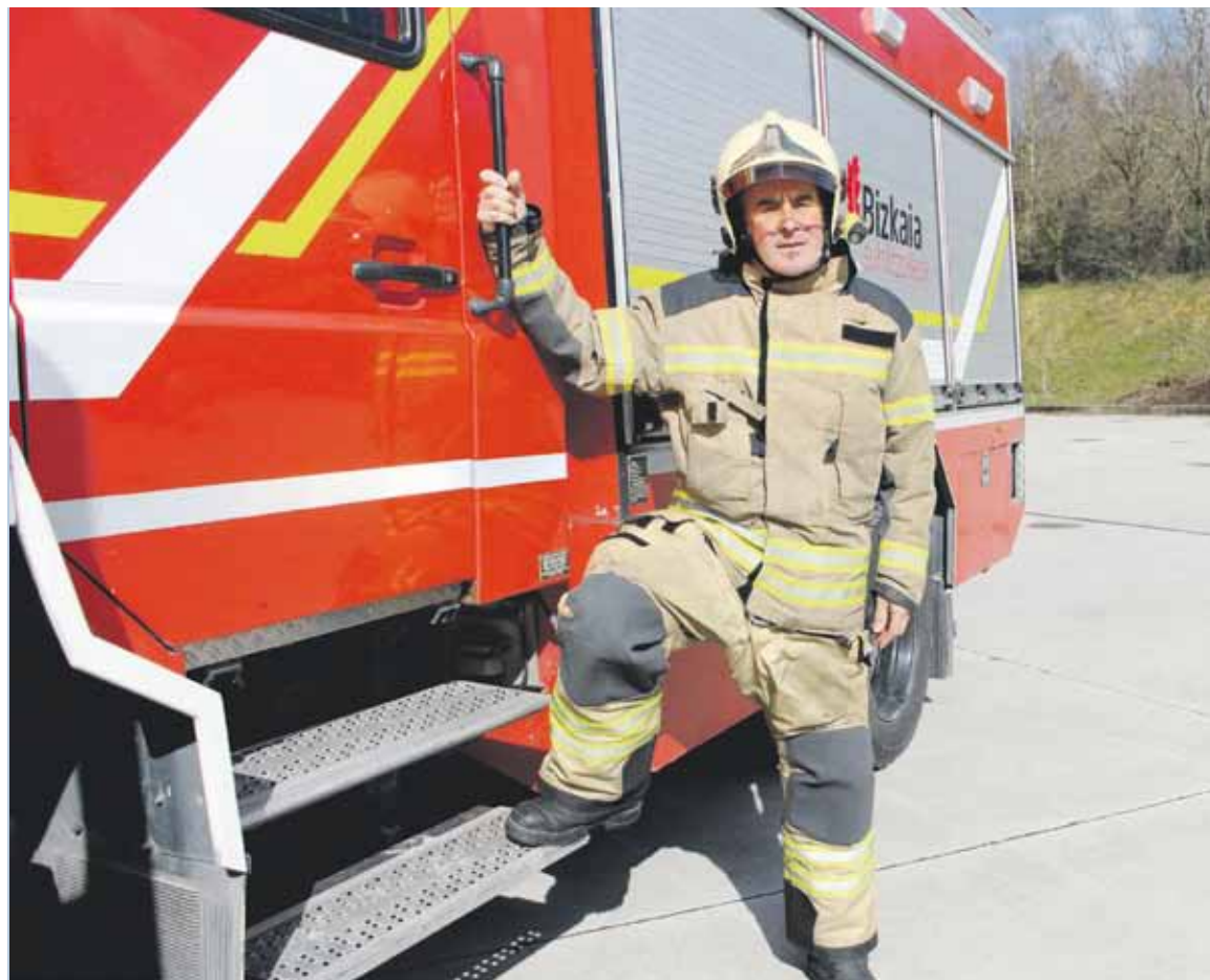
Etxaburuk 33 urte eman ditu Iurretako suhiltzaileen parkean. Duela urtebetetik hona, Uriosteko parkean dihardu kaboak.

Motoponpa batzuk eskuz igo genituen. Oizko errekatxo ba-