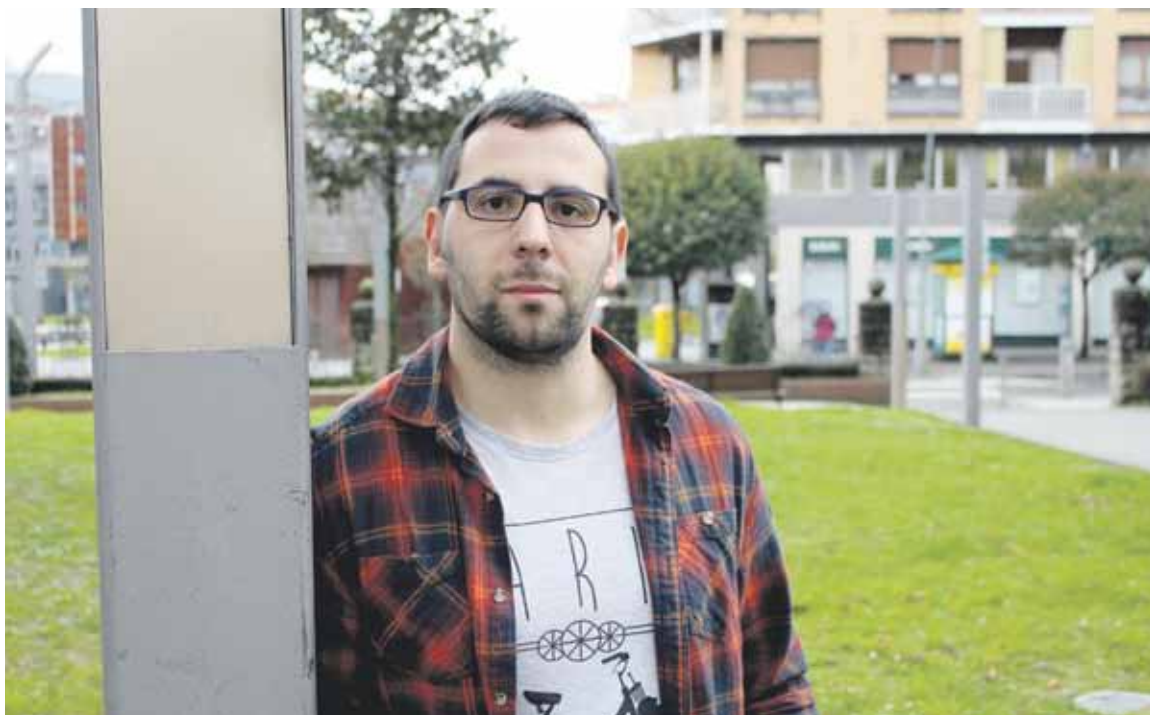
Antolinek korrika egitea gustuko du. Maratoi erdiak eta mendi lasterketak egiten ditu.