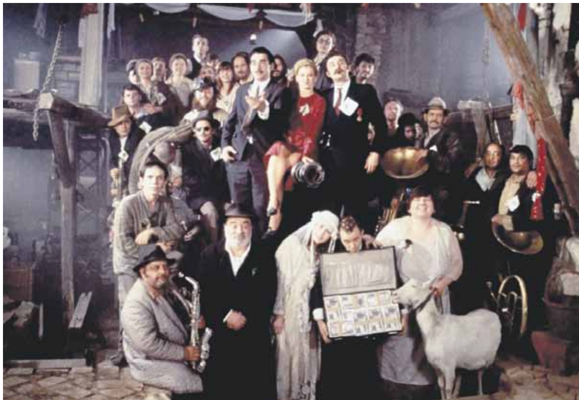
Emir Kusturicaren Underground pelikularen irudi bat.

Emir Kusturicaren 'Underground' pelikulan oinarrituko da otsailaren 28ko solasaldia