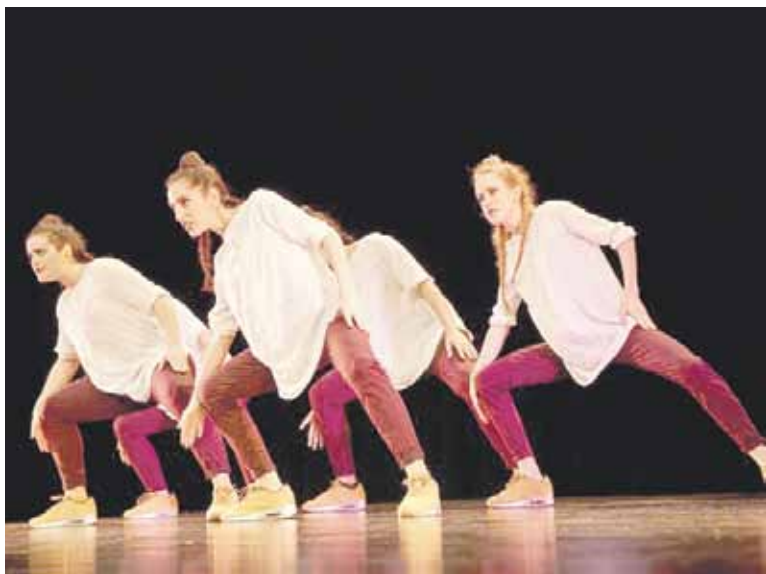
lazko lehiaketako irudia.

Hiru saioetarako txartelak agortuta daude; 54 talde borrokatuko dira Break On Stagerako txartela lortzeko