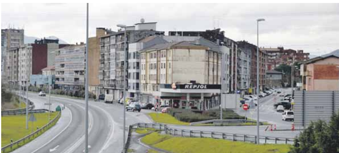
30.000 euro erabiliko dituzte Bidebarrietatik Maspe kalerako irisgarritasun trabak konpontzeko.

2018ko parte hartzeko aurrekontuetarako 40.000 euroko atala gorde du lurretako Udalak