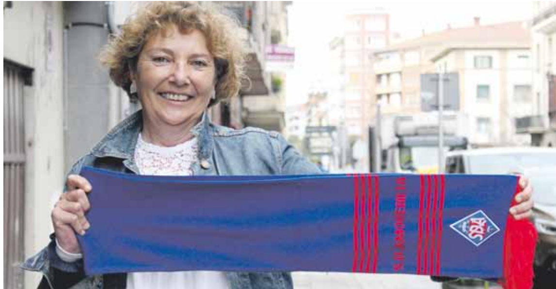
Amorebieta klubeko historian emakumezko presidente bakarra izan da eta Bigarren B Mailan ere ez dago beste adibiderik azken urteetan.

Buruko minak aipatzean, diru kontuak ditu buruan, xoxak zelan lortu. “Ziurgabetasun handiko mundua da. Enpresa bateko marketing arduradunak proiektu interesgarria dela esaten dizu, baina gero kontabilitate sailera pasatzen dute eta hauek sei hile barru deitzeke esaten dizute. Bide ofizialeko diruak ere berandu eta txarto heltzen dira. Esaterako, oraindik Kirol Kon-