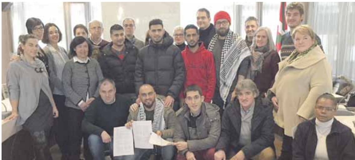
Udalbatzarreko alderdi denetako (EAJ, EH Bildu, Hiri Ekimena eta PSE) zinegotziak jatorri palestinarreko gazteekin.

Udal adierazpena adostu dute Tamimi palestinarra askatu dezaten eskatzeko