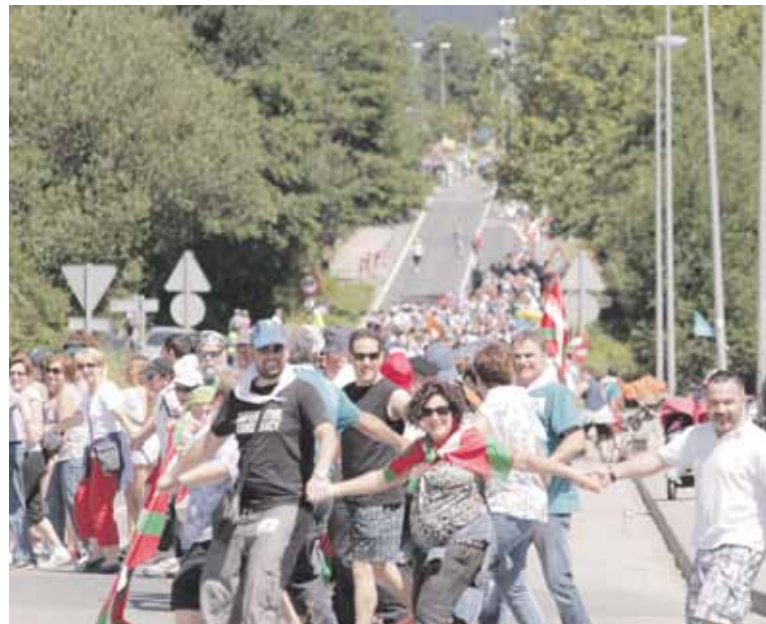
2014an Durango eta Iruñea lotu zituen giza kateko irudia, Abadiñon.

2019an erabakitze eskubidearen aldeko “ekaitz perfektua” sortzeko aukerak ikusten ditu Oiar-