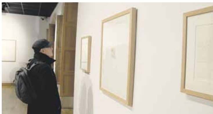
Urtarrilaren 25ean berrinauguratu zuten museoak

Bestalde, Arte eta Historia Museoak ordutegi berria du ostera zabaldu denetik. Martitzenetik barrikura goiz eta arratsalde egongo da zabalik (10:00-13:00/17:00-20:00); zapatuetan, berriz, 11:00-14:00 eta 17:00-20:00 izango da ordutegia. Domeketan ere zabalduko ditu atek museoak, goizez bakarrik.