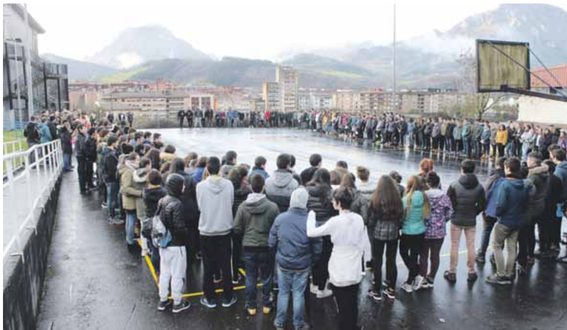
Lurretako Orobiogoitia institutuko ikaskideek azken agurra egin zioten atzo.

Atzo lurretako Orobiogoitia Institutuko ikaskideek azken agurra egin zioten gazteari. Ekitaldian, berriztarraren klasekideek hainbat mezu zituzten puxikak bidali zituzten zerura