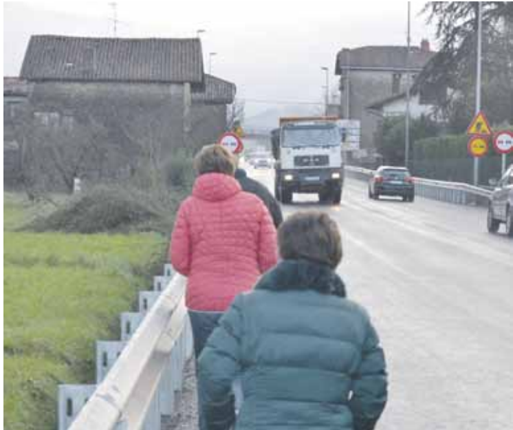
Fauste auzoko oinezkoek N-634 errepidearen bazterbide estua erabiltzen dute.

Fauste auzotik Arriandi industrialderaino, N-634 errepidearen albotik, bidegorri bat egokitzea eskatu diote bizilagunek lurretako Udalari, “oinezkoen segurtasuna bermatzeko”