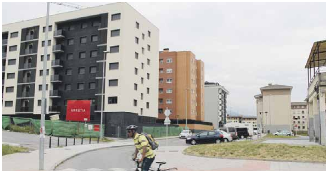
San Fausto auzoko babeseko etxeetan egongo dira alokairuko 6 etxeak. Urte amaitu aurretik beste 5 zabalduko dituzte.

18 eta 30 urte artekoek edukiko dute etxea eskatzeko eskubidea; urtean 7.500 eta 33.000 euro arteko diru sarreren jabe izatea da beste baldintza bat. Eta, diru sarreren arabera ezarriko dute errenta, 115 eta 300 euro artean egongo dena. Etxeetako egonaldia txandakakoa izango da, epemuga batez. Gutxienez, urtebeteko kontratua