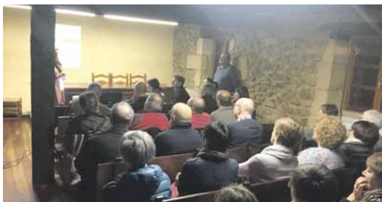
Jende ugari batu zen urtarrilaren 23an egindako batzarrean.

Plan orokorraren helburua datozen urteetan herrian egingo diren aldaketak zehaztea da