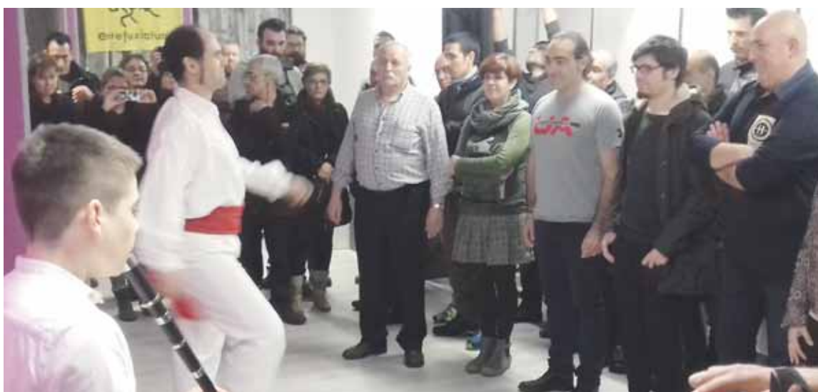
Dantzariagaz inauguratu zuten Goienkaleko egoitza.

Herritar ugariren babesagaz zabaldu zuten Durangoko egoitza joan zen barikuan