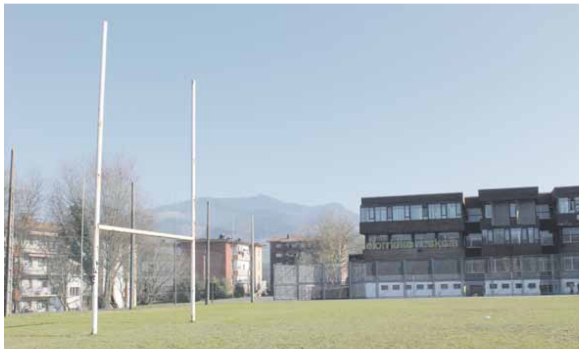
Errugbi-zelaian harmailak jarriko dituzte.

Maiatzean hasiko dira San Roke auzoan dagoen errugbi-zelaiko lanak egiten