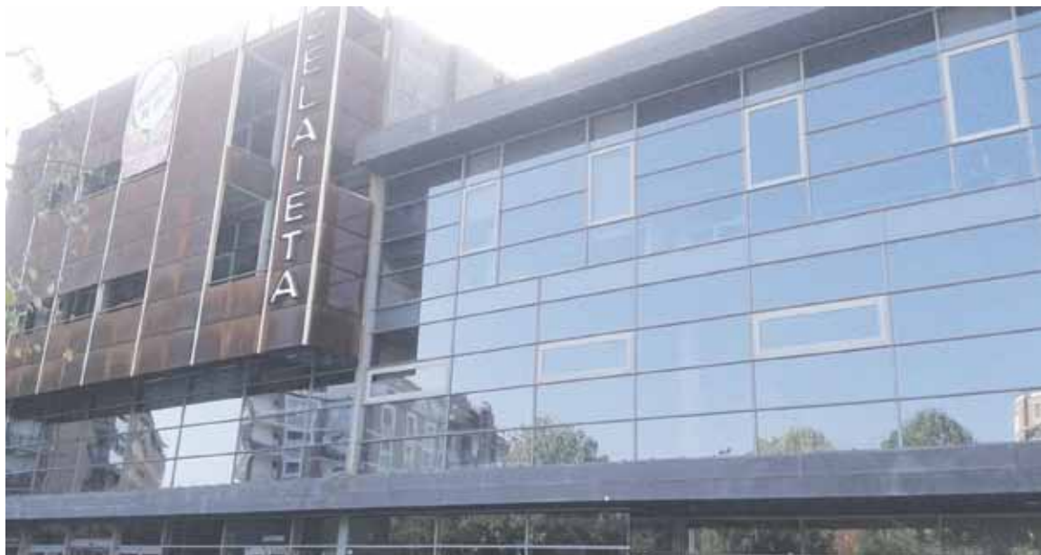
2018ari ekiteko prestatu dituzten aldizkako 14 ikastaroetatik erdiak euskaraz izango dira.

Udalak ez du oraindik bermatzen euskararen inguruko Planean jasotzen den eskubidea