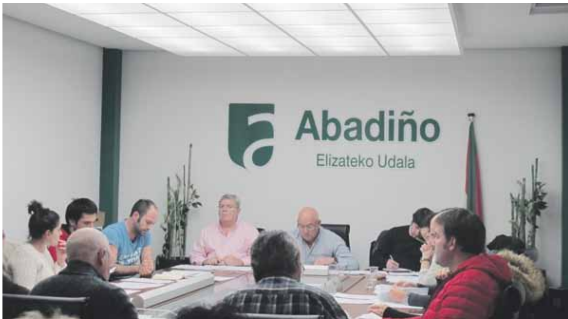
Zinegotziak eta alkatea udaleko osoko bilkura batean.

Udal gobernuak atzera bota du EH Bilduren mozioa, eta babesa erakutsi dio zinegotziari; tirabira, bestalde, San Blas eta Abadiño koalizio abertzalekoak ez dira joango.