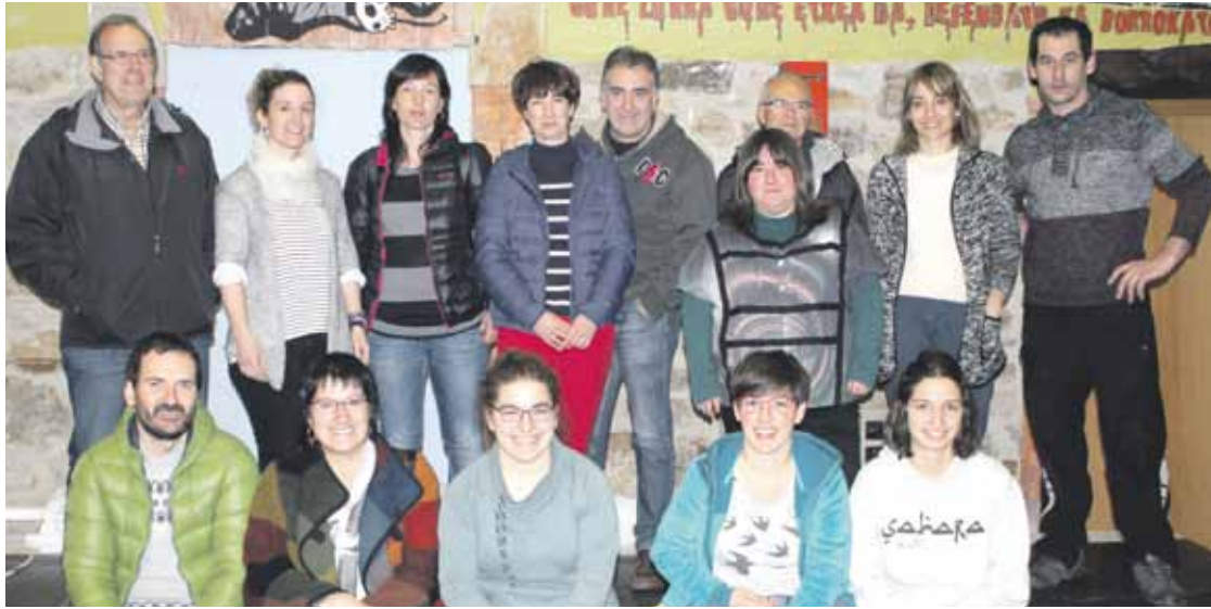
Atxondoko Gure Esku Dagoko kideak martitzenean egindako batzarrean.

Ez dakite Durangaldeko gainontzeko taldeekin batera egingo duten galdeketa