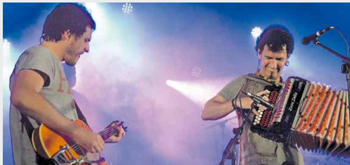
Sortu zeneko 25. urteurrena ospatzen dabil, aurten, Gozategi taldea.

Otxandiarrek egun osoko jaia prestatu dute Korrikari hasiera emateko