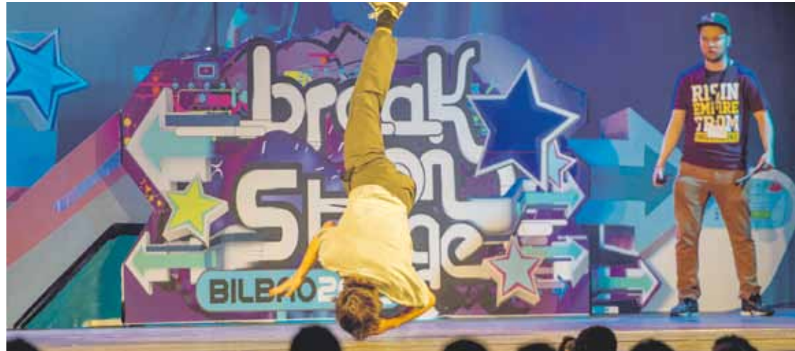
Break dance arloan ospe handikoak diren lau talde lehiatuko dira aurten, Break On Stage jaialdian.

Kale kulturen jaialdiaren 17. edizioa burutuko dute bihar, Bilbao Arenan