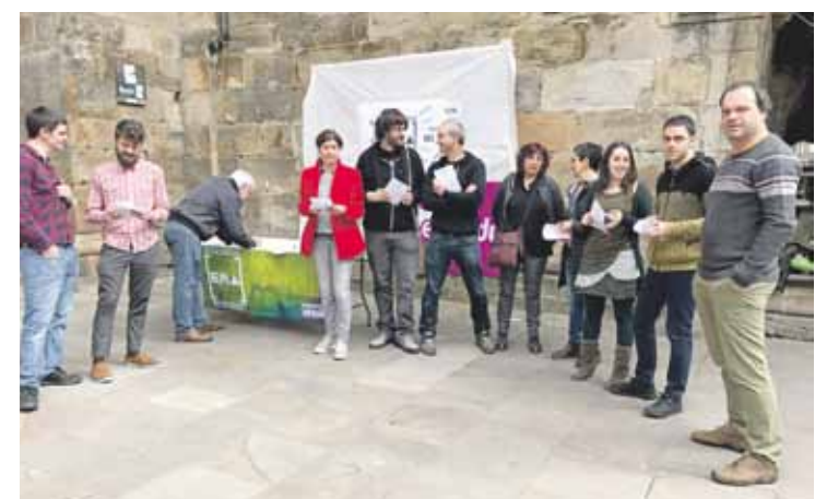
EH Bilduko hainbat kide, joan zen zapatuan egindako aurkezpenean.

“Herri-proiektu” bat landu gura du koalizioak