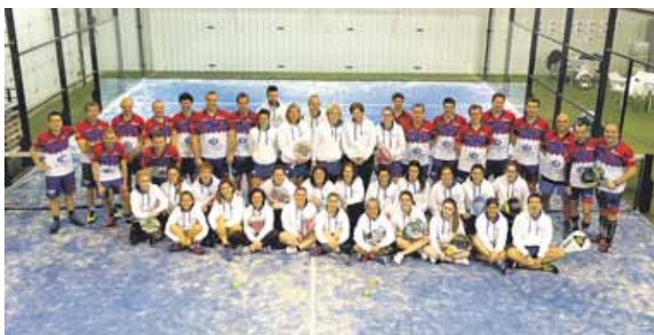
Joan zen asteburuan egin zuten aurkezpeneko argazkia.

Iaz baino hiru talde gehiago dituzte ligan