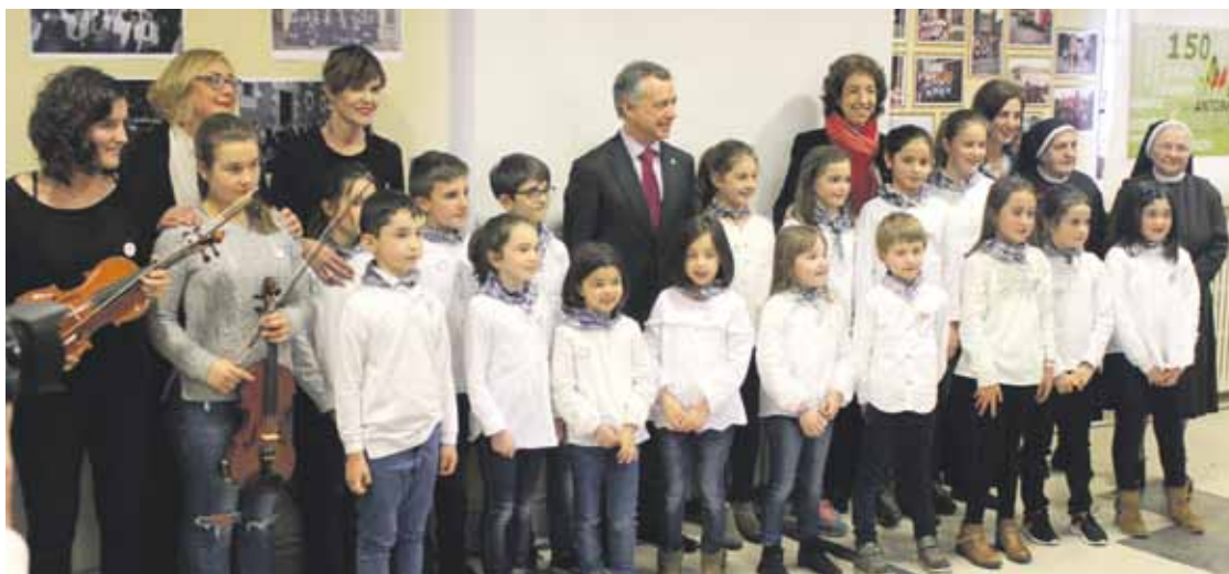
Lehendakaria eta alkatea, ikastetxeko ikasle eta arduradunekin batera.

Ekitaldiek ekainera arte iraungo dute. Ikasle ohien bazkaria egingo dute bihar, eta 30ean berbaldi bat, 18:00etan.