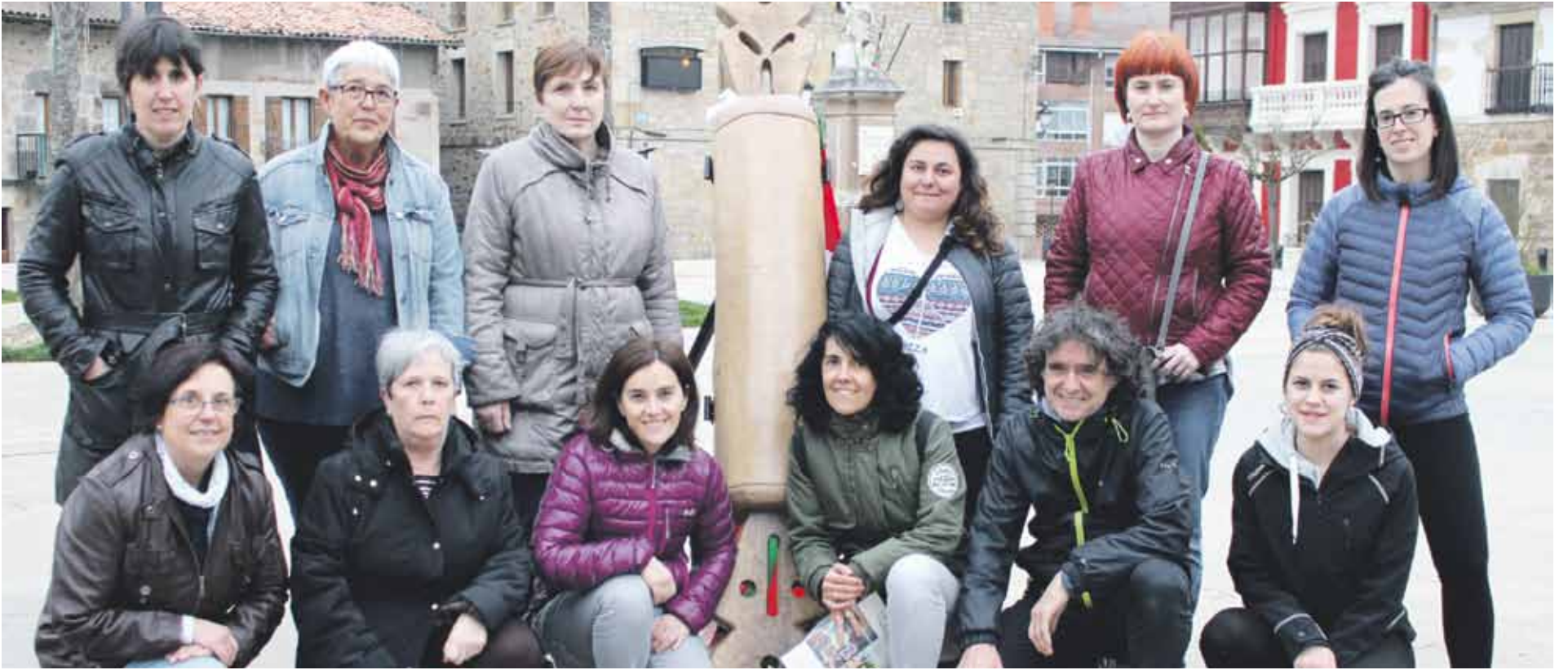
Korrika antolatzeke lanean dabiltzan lan taldeetako hainbat kide plazako testigu handiaren ondoan.