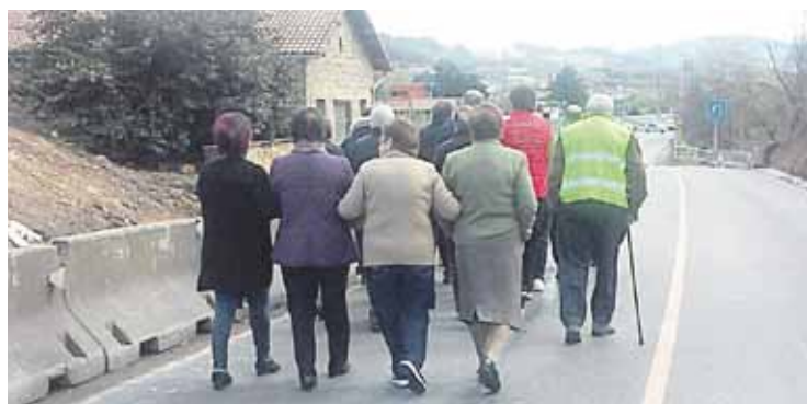
Atzoko protesta ekitaldiko une bat.

N-634 errepidea ordu erdiz moztu zuten atzo