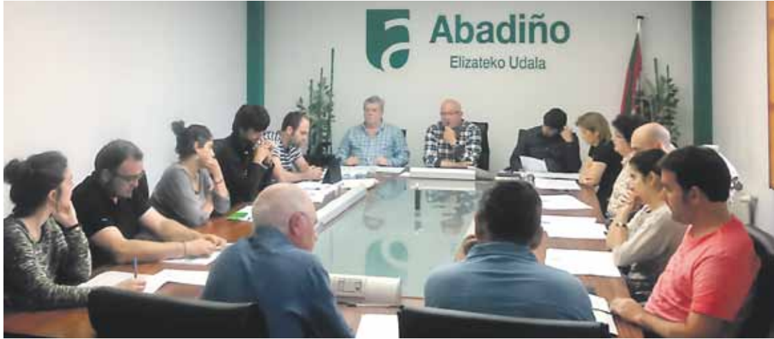
Independienteek eta EAJk plataformaren mozioa osoko bilkuran urgentziaz sartzearen kontra bozkatu dute, asteon.

Birkalifikazioari buruzko herri galdeketa eskatzen du plataforma horrek