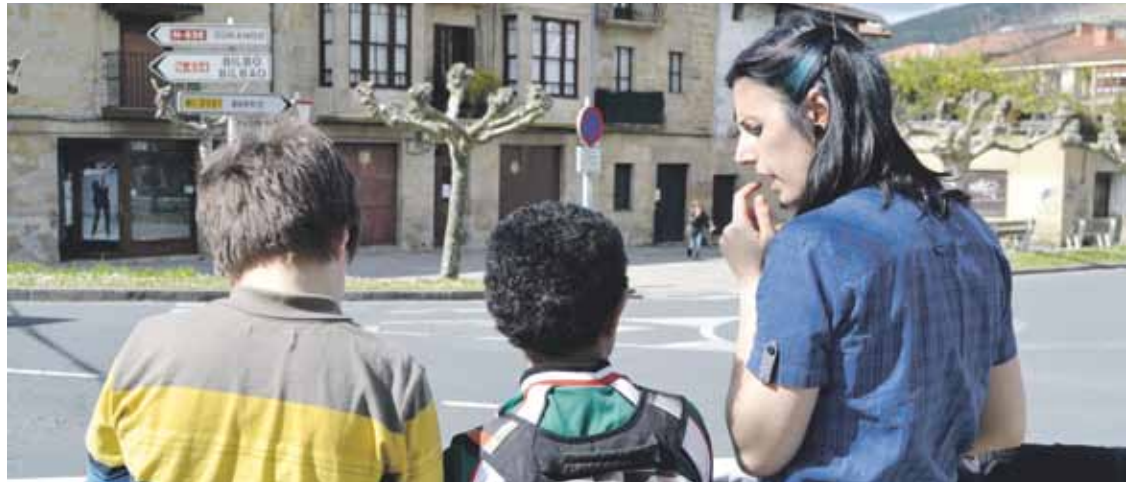
Elorrion, ikasle bi teknikariagaz behaketa lana egiten.