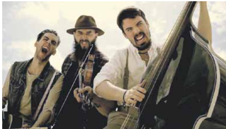
Moonshine Wagon gasteiztarrek zabalduko dute jaialdia, eguenean.

Doakoak edo hiru euroko sarrera duten emanaldiak izango dira guztiak. "Izan ere, gure helburua ez da etekin ekonomikoa ateratzea, ahalik eta musikazale gehien erakartzea baizik", Berasaluzek azaldu duenez.