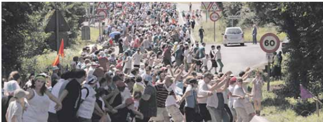
Erabakitze eskubidearen alde Durango eta Iruñea lotu zituen giza kateko irudia. G.Gaztelu-Urrutia

Bestalde, plataformak sinadurak batzen segitzen du, eta joan zen domekan Durangon ospatutako Ibilaldian ere ipini zuten mahaia. Dagoeneko 16.000 sinaduratik gora batu dituzte, Juan Carlos Poderoso kidearen esanetan.