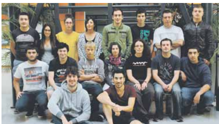
Aplikazioa garatu duen Zornotzako ikasleria.

Zornotza LHII-ko ikasleek landutako tresnari esker