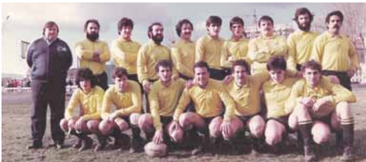
Aurtengo beteranoen taldea goian, eta orain 35 urteko lehen taldearena behean.