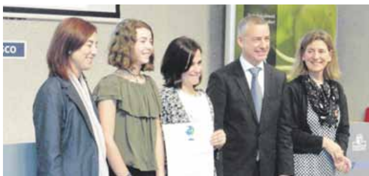
Txintxirri ikastolako ordezkariak agiria jasotzen.

Ikasturte honetan 22 ikastetxek jaso dute agiri hori