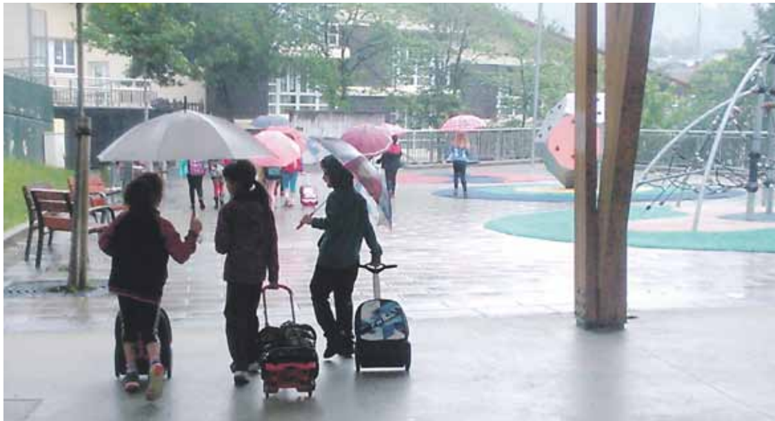
Olakueta bizi diren hainbat umeek pasealekutik egingo dute eskolarainoko bidea.

Hainbat gurasok eta boluntarioek lagunduta egingo dute umeek bidea