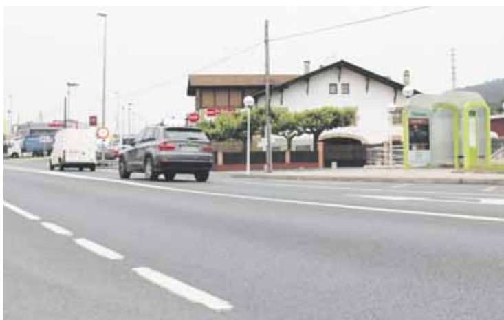
N-634 errepiderako sarbideak berrantolatu gura ditu Foru Aldundiak.

Autobus geltoki berri bat ere aurreikusi dute egitasmoan, Bernabeitiarako (Zornotza) sarbidearen alboan. Argiztapena, seinaleak, balizajea eta euspen-sistemak ere hobetuko dira.