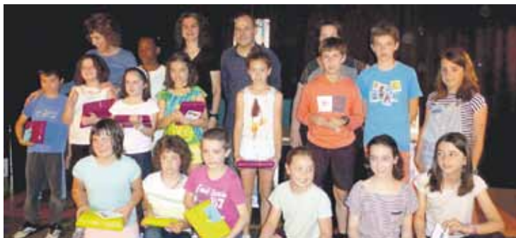
Umeek, gazteek eta helduek parte hartzen dute lehiaketan.

artean irakurzaletasuna eta sormena bultzatzeko antolatzen dute lehiaketa hori, eta 413 parte-hartzaile izan dituzte aurten (167 ume, 234 gazte eta 12 heldu).