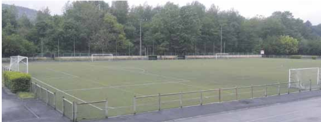
Larreko futbol zelaia eskolaren ondoan dago.

Belar artifiziala aldatu eta euri urak batzeko sistema ere jarriko dute