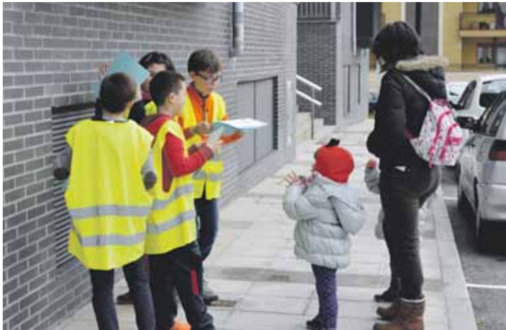
Ikasleak herritarren ohituren inguruko inkestak egiten.

Ekimen honegaz, prebentzioan oinarritutako mugikortasun autonomoa eta arduratsua bultzatu gura izan dute