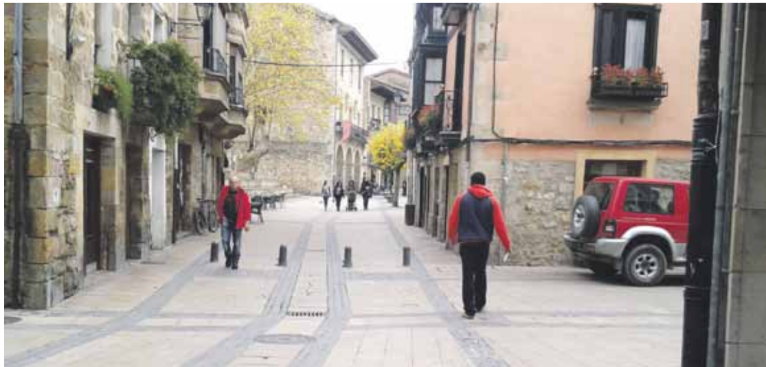
Ekainaren 1etik 11ra bitartean hainbat ekitaldi antolatuko dituzte Elorrioren, Aste Berdearen barruan.