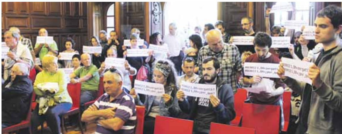
Berrizek 1,8 + zergatik? plataformako kideak ezohiko bilkuran

Ertzaintzak azaldu duenez, enpresara joaterakoan, auto bat aurkitu zuten inguruetan. Ertzainek kotxe barruan zeuden bi pertsonak identifikatu, eta enpresako materiala zeukatela baieztatu zuten. Ertzainek 32 urteko gizona atxilotuta eraman zuten. Autoan zegoen bigarren pertsona — 60 urteko emakumezkoa — atxilotuaren ama zen.