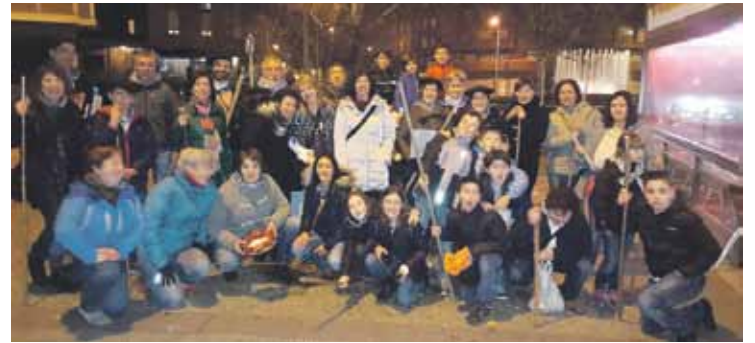
Herria auzo elkarteok Santa Ageda koplak abesteko ohiturari eusten diote.

ri emango diote, Herriakoe prentsa oharrean azaldu dutenez. Errefuxiatu siriarrekin elkartasuna agertu gura izan dute Matadero inguruko auzo elkarte kideek: “Erasoak amaitzeko deialdi orokorra egin dugun, eta inplikaturako alde guztiei tragedia honi amaiera emateko neurriak hartzea eskatzen diegu”.