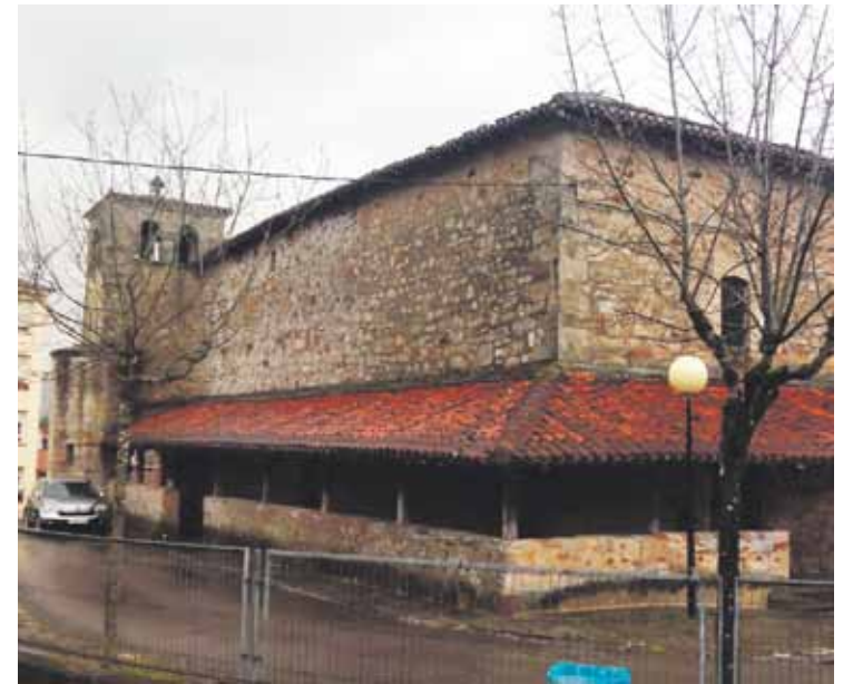
Atxondoko eliza eta abadetxea 1993an inskribatu zituen.