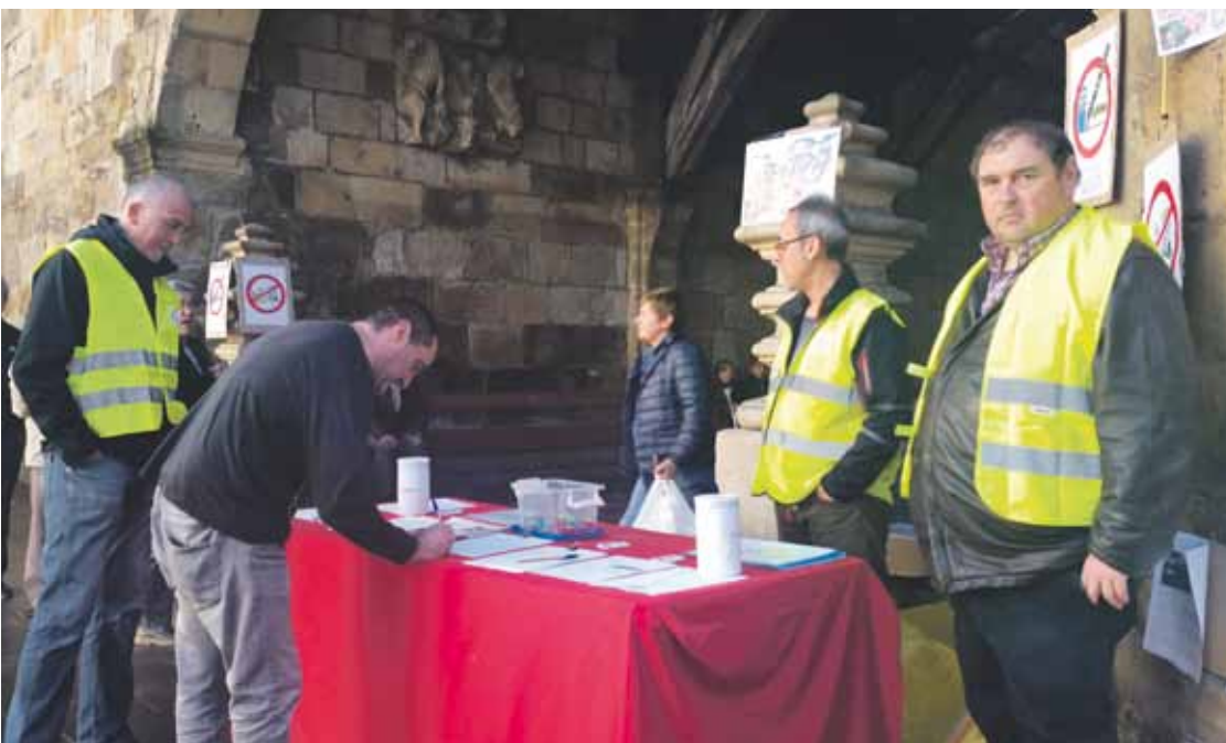
Joan zen zapatuan plataformako kideek sinadurak biltzeko postua jarri zuten Andra Marian.

Inguruko elkarte eta eragileekin ere bildu nahi dute plataformak