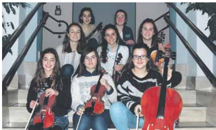
Hiru orkestra osatu dituzte hautaturiko EAEko 238 musika ikasleekin.

Euskadiko Ikasle Orkestrarako hautatu dituzte