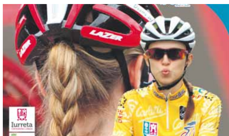
Erretiratzea erabaki zuten argazkia.