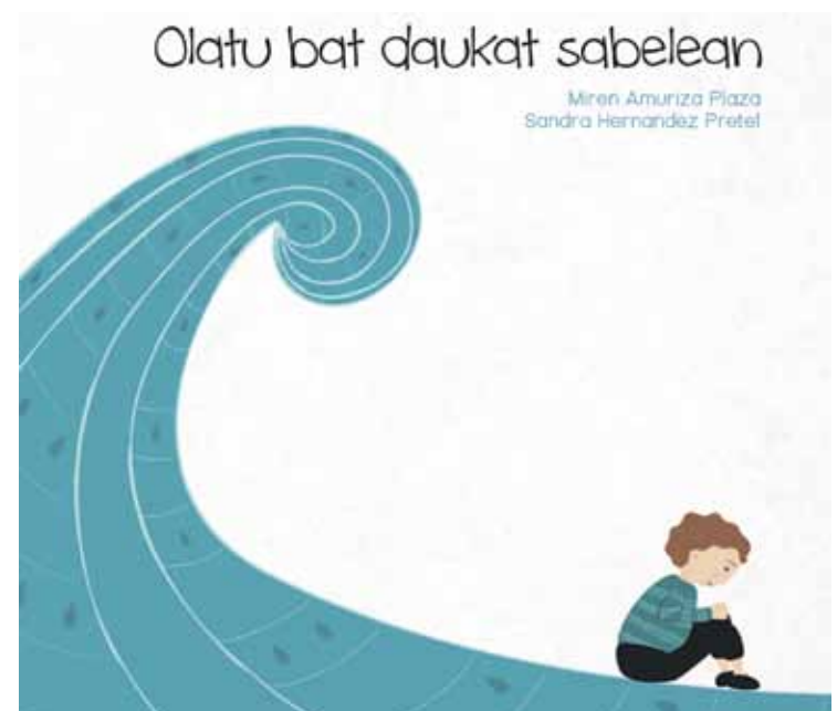
‘Olatu bat daukat sabelean’ liburuaren azala.