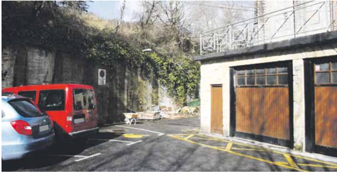
Udaletxearen atzeko aldean jarriko lukete biomasa galdara.

Udal eraikina energetikoki eraginkorrago zelan bihurtu aztertzen dabilta