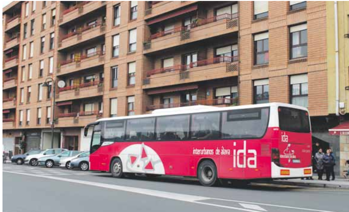
Joan zen astelehenetik, lurretako Maspe kalean gelditzen da Durango-Gasteiz linea egiten duen 15:00etako autobusa.

Urteetako arazoa konpondu dela-eta, pozik daude Juan Orobiogoitia institutuan