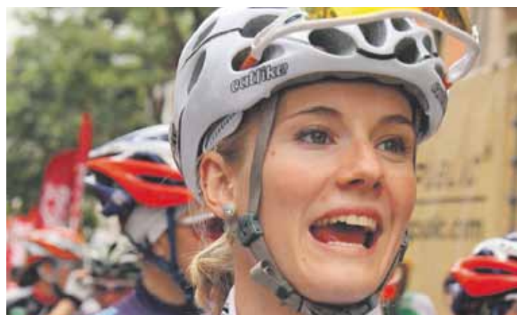
Emakumeen Bira iragarriko duen argazkia.