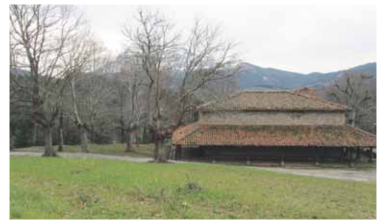
Argiñetako lursaila 2006an inmatriculatu zuen gotzaindegiak.

2009an, Nafarroan 1.000 inmatriculaziotik gora egin zirela argitaratu zen. Hari horri tiraka, EH Bilduk argitaratu du hiru probintzietako gaia, Eusko Legebiltzarrean landutako ekimen batez. Hurrengo pausoa, herrietan mozioak aurkeztea izango da, eta Legebiltzarrean ere proposamen bat aurkeztuko dute, Igor Lopez de Munain parlamentariak azaldu duenez: "Az-