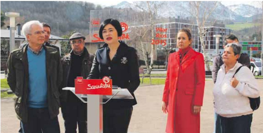
Ríos, alderdiaren iazko ekitaldi baten berbetan. Agorria atzean, eskumatik hasita hirugarrena.