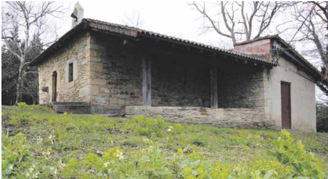
Iurretako San Andres auzoan, ermita ondoko txokoa 1993an erregistratu zuen elizak.