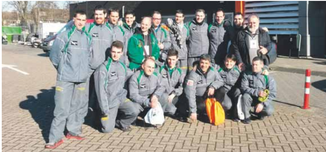
Abadiño Sokatira Taldeak 17 fitzolari eraman ditu Herbeheretara.

Abadiño Sokatira Taldea munduko onenekin lehiatzen dabil Herbehereetan