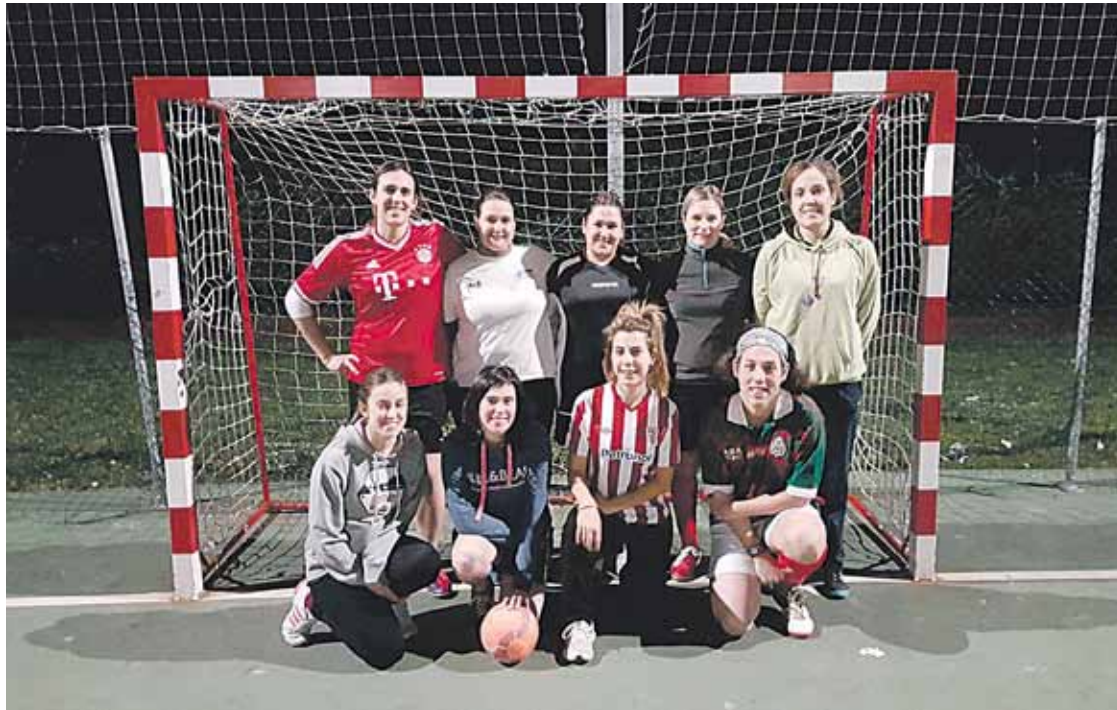
Gaur egun Betigol areto-futbol taldea osatzen duten kideetako batzuk.

Jokalari eta bazkide bila dabilta liga ofizialean parte hartzeko helburuz