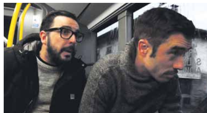
Aurkezle biak autobusean heldu ziren Atxondora.