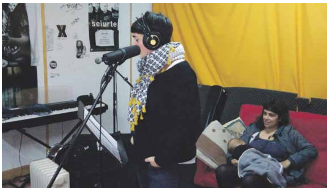
Ipuina hainbat berriztarren ahotsean entzuteko aukera ere ematen du liburuak.