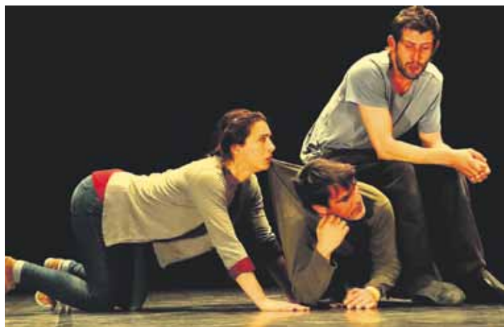
Tragedia greko klasikoari umoretik heltzen dio Chapito taldeak.

Asteburuan, Durangaldean eskainiko dute obra