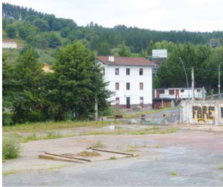
Asteleheneko udalbatzarrean irakurri zituzten auzotarren eskaerak.

Auzotarren eskaerak udaleko Hirigintza Batzordean aztertuko dituzte