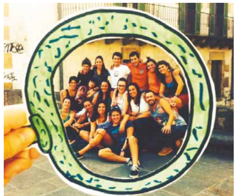
Berbarok eta aisialdian lan egiten duen hezitzaile talde batek sustatu dute.

M.B.: Elorrion edo Abadiñon. Parte-hartze prozesu antzerakoa zabaldu zuten Abadiñon ere, eta gazteekin adostutako ekintzak antolatzen dituzte hama-bostean behin, zapatu edo domeketan. Oso pozik ari dira. Posible da aisialdi eskaintza on bat.