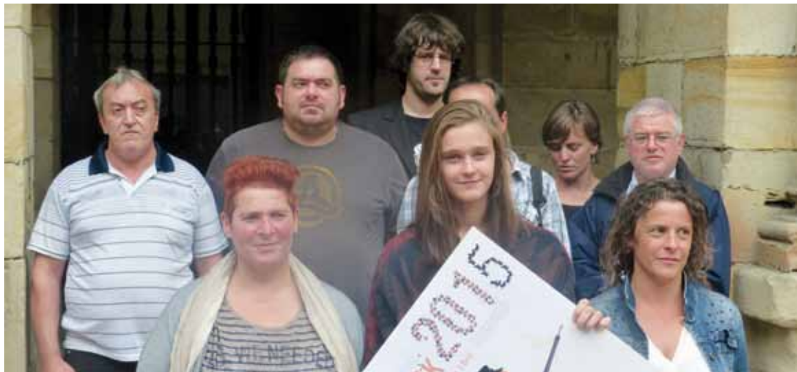
Martitzenean egin zuten jaien aurkezpena, udaletxean.