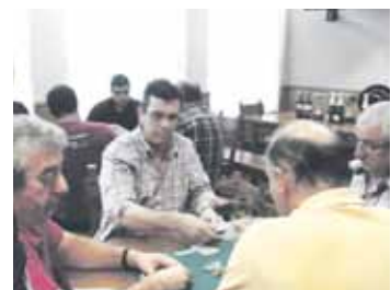
Mus txapelketa Argintxun.