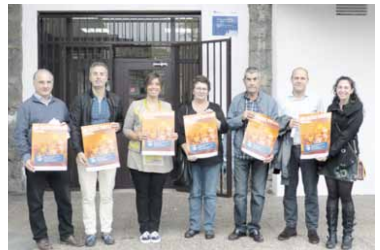
Programaren aurkezpena egin zuten, atzo, Behargintzaren egoitzan, Durangon.

Proiektuak 187.000 euroko aurrekontua dauka, eta Bizkaiko Foru Aldundiak %70 ordainduko du.