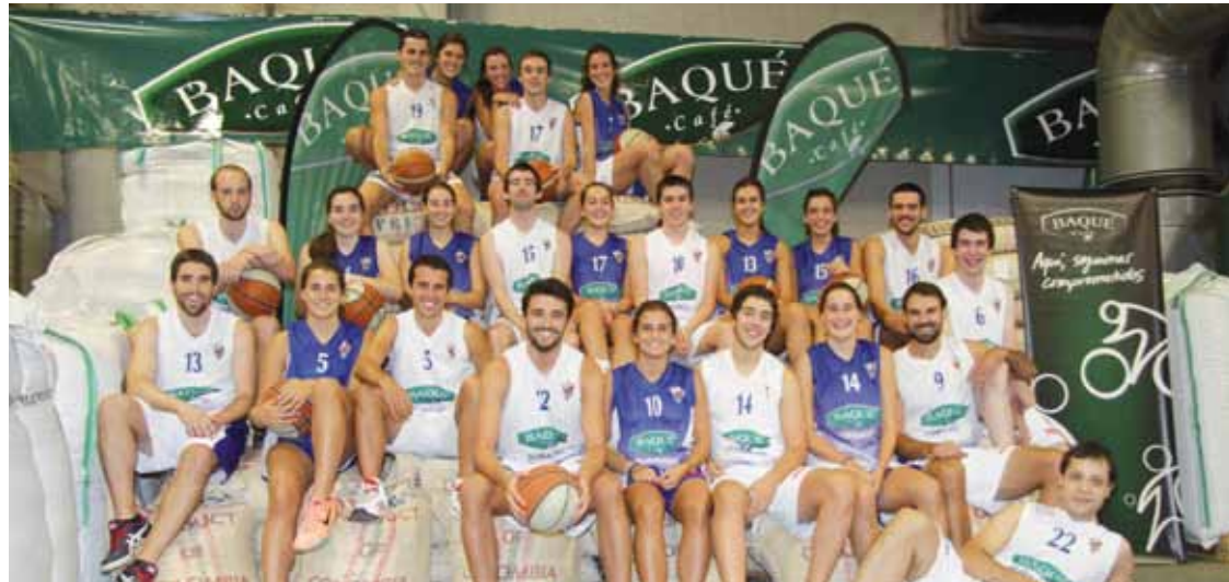
Tabirako Baqué gizonen eta emakumeen talde nagusiak. Tabirako Baqué

Aurtengo aurkezpena Baqueren egoitzan egin dute, Landakon beharrean