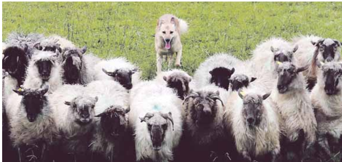
Azken urteetan, Axpen finkatu da ardi txakurren txapelketa. Gerediaga Elkarte-Txelu Angoitiia

Aurten, 49. aldia egingo du Gerediaga Elkarteak antolatutako lehiaketak. Guztira, hamaika txakur batuko dira Elizaburuko landetan, 17:00etatik