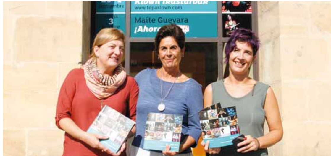
Programazioa aurkezteko prentsaurrekoa eskaini zuten, joan zen barikuan, kulturgunean bertan.

Umeentzako antzezlan baten emanaldi bikoitzagaz hasiko dute kurtso berria