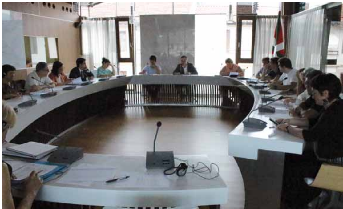
Zornotzan, astelehenean egin zuten ez ohiko bilkuran onartu zuten errefuxiatuen aldeko udal adierazpena.

Durangoko, Zornotzako eta Berrizko udalak errefuxiatuak hartzeko prest daude