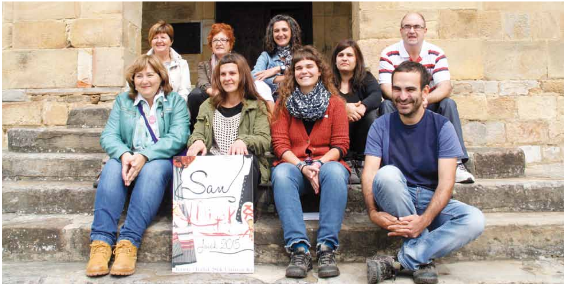
Ebentxe Madina elorriarrak egindako 'San Migel zain' izenburuko kartelak iragartzen ditu aurtengo jaiak.