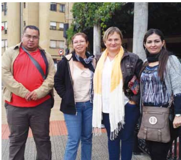
Goiuri Sopelana Las Vueltaseko udal ordezkariarekin Iurretan, astelehenean.