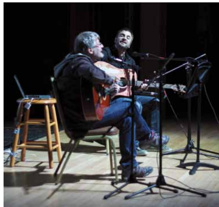
Bakoitzak bere erreperorioa eskainiko du, eta, gero, batera arituko dira. M. Markez