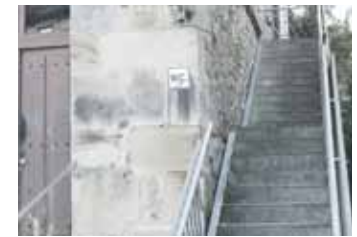
Arrazola, komunerako eskailerak.

Axpen eta Arrazolan komun publiko bana erabilgarri daude uztail amaieratik. Inguru haietan bisitari eta mendizale dezente ibiltzen da, eta horregatik ahalbidetu ditu udalak. Arrazolan, ludoteka dagoen eraikinekoa erabili daiteke, eta Axpen, pilotalekuko aldageletakoa. Komun biak 08:00etatik 22:00etara daude zabalik urteko egun denetan. Ateko sarrailak duen sistema bati esker, atek automatikoki irekitzen dira goizetan, eta itxi gauetan.