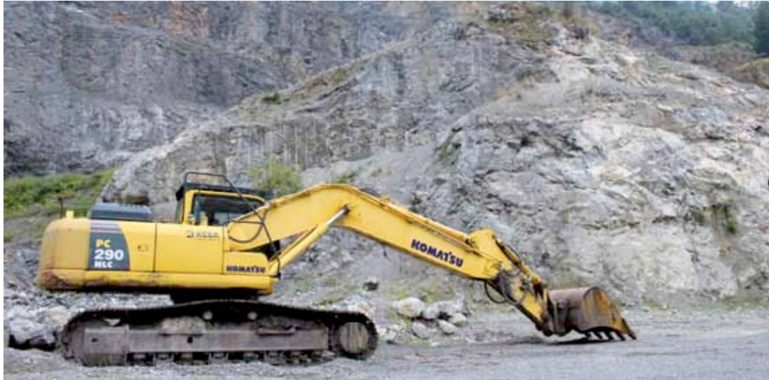
210.000 metro kubiko lur beharko dira Zalloventa harrobia betetzeko.

Zalloventa harrobia laster hasiko dira betetzen, Markomin Goikoako lurrekin