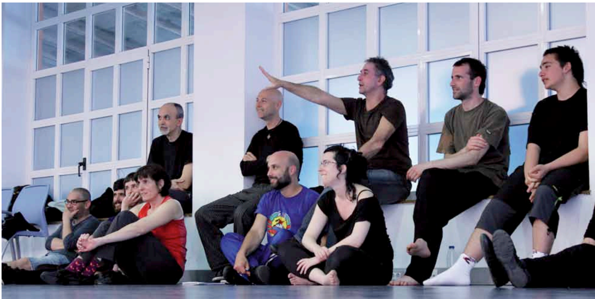
Katz (erdian, azalpenak ematen), eta iazko Topaklown jaialdiko ikastaro batean parte hartu zuten ikasleak, kide baten saioa ikusten.