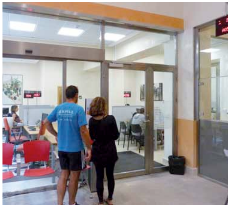
HAZeko obretan 22.000 euro erabili dituzte aurtan.