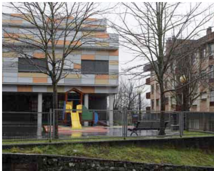
Atxondoko eskolako eraikin berria eztabaidagune izan da azken urteetan.

Udalak Bizkaiko Foru Aldundiaren erabakia hile biren barruan jasotzea itxaroten du. Atxondo 7.000 biztanletik beherako herria denez, Aldundiari dagokio behin betiko onarpena egitea.