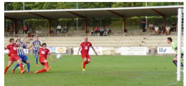
Talavera eta Amorebietaren arteko partiduko une bat.