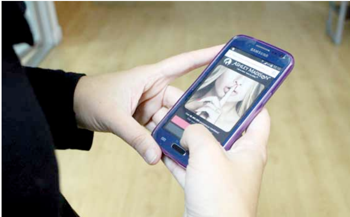
Ashley Madisonen erabiltzaileak dio "lelokeria" dela datuak herrika sailkatzea.

Ashley Madison ligatzeko plataformaren erabiltzaile batek bere esperientzia kontatu dio ANBOTOrri