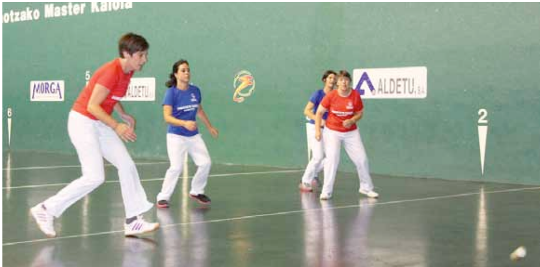
Emakume taldeko kideak joan zen denboraldian.

Pilota eskolako haurren ama batzuek esku pilota taldea sortu dute Zornotzan