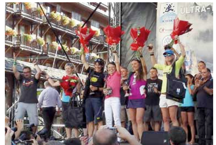
Trigueros ezkerrean Ultra Trailaren osteko sari banaketan. ultratrailmb.com

Oro har, gogoratzeko moduko denboraldia osatu du; esaterako, ekainean bigarren amaitu zuen Ultra Trailen Espainiako Txapelketa, eta uztailan Beasaingo Bi Haundiak (88 km) proba irabazi zuen. Azken garaipen horrek, Euskadiko Txapelketa eman zion.