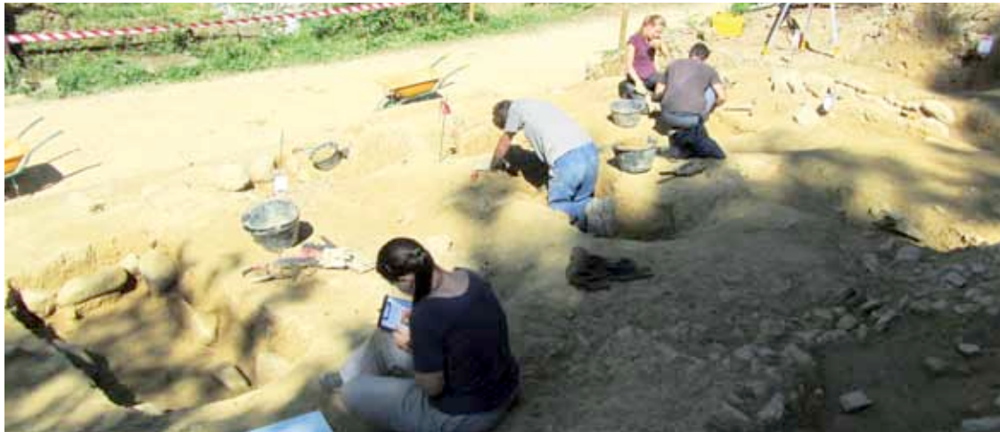
Arkeologoak Erdi Aroko hilerriko aztarnetan lanean, iazko abuztuan.

Erdi Aroko hilerriak datu berririk ez duela ekarriko uste dute arkeologoek