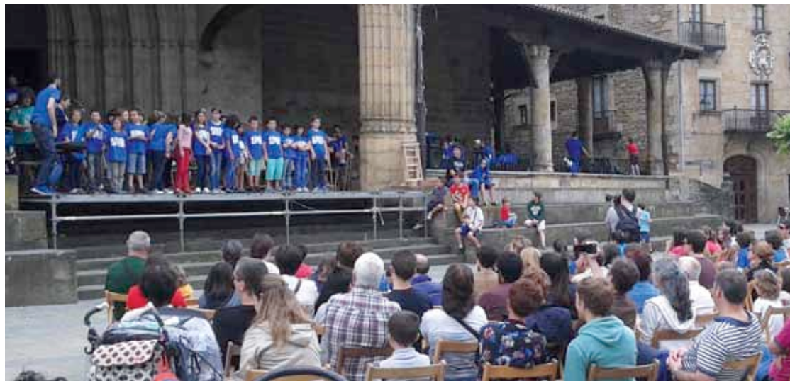
Musika eskolako ikasleek ekainean Elorrioko plazan eskainitako kontzertua.

Gaur gauean kontzertuak izango dira Sermond's eta Governors taldeekin txosnagunean