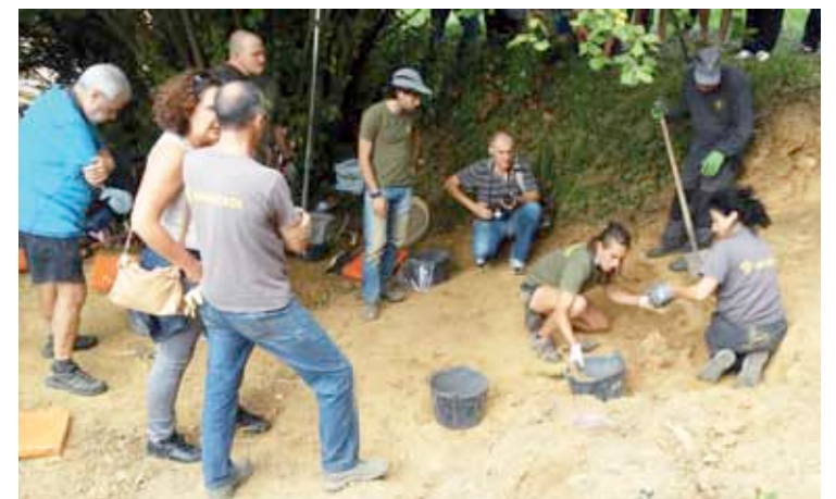
Joan zen eguenean atera zituzten Uriguenenak izan daitezkeen hezurak.

Zelan gogoratzen duzu osabaren hezurak lurpetik atera zenituzteneko momentu hori?