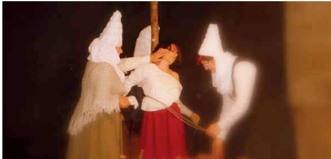
Inkiszioan kokaturiko antzezlana da 'Errautsetatik erne'.

Irailaren 11n, 20:00etan, ariko da Izurtzan Muxikako andren antzerki taldea