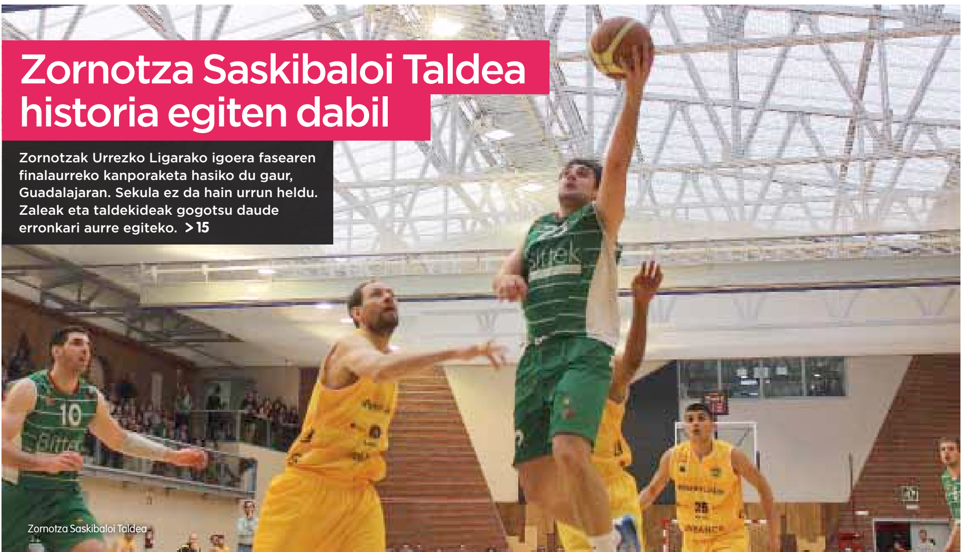
Zornotza Saskibaloia Taldea

Zornotzak Urrezko Ligarako igoera fasearen finalaurreko kanporaketa hasiko du gaur, Guadalajaran. Sekula ez da hain urrun heldu. Zaleak eta taldekideak gogotsu daude erronkari aurre egiteko. > 15