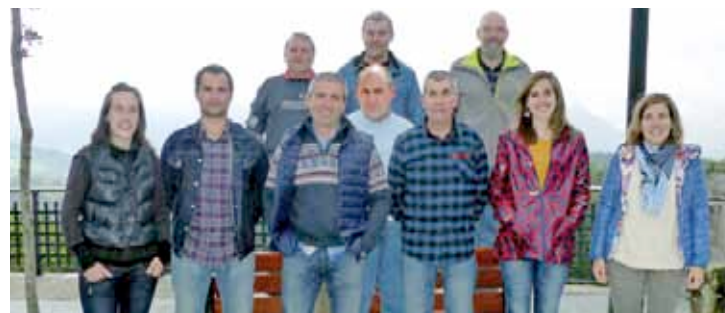
Garaiko Herriko Taldeko zerrenda osatu dutenak, talde argazkian.