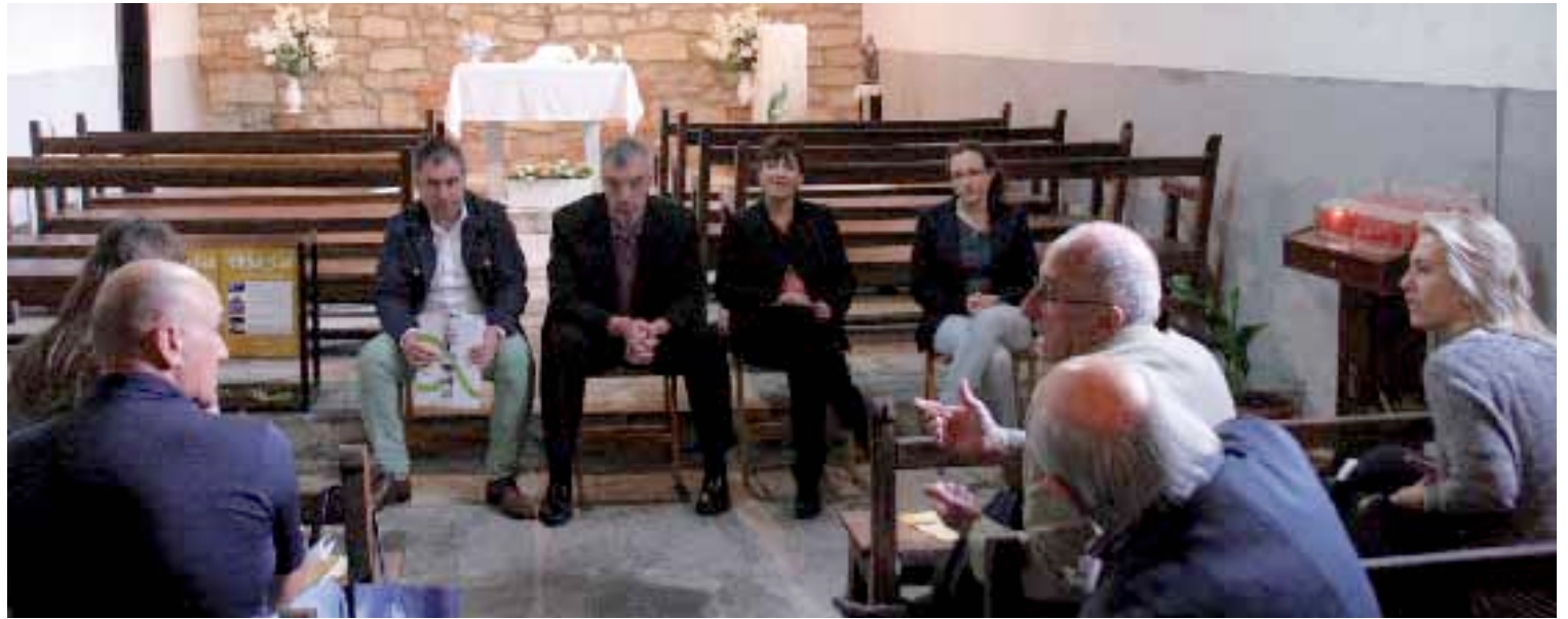
San Antonio Elgezabal basilikan egin zuten, martitzenean, zikloaren aurkezpena.

Amurizaren emanaldia eta zuzeneko beste lau musika emanaldi dakartzen Eleizetan programa aurkeztu dute