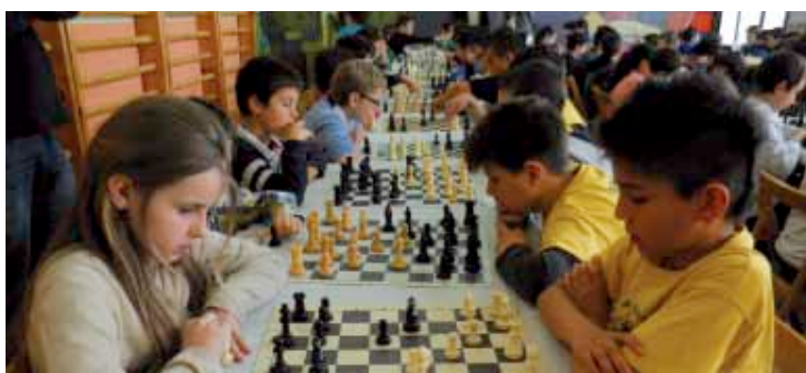
Jesuitak eta Zaldi Baltza taldeen arteko partida, benjaminetan. Zaldi Baltza

tak taldea geratu zen txapeladun. Elorrioko Zaldi Baltza hirugarren geratu zen. Kimu mailan, hirugarren tokia lortu zuen Abadiñok.