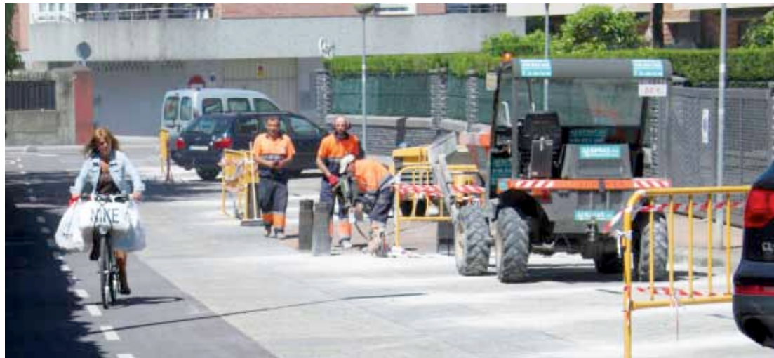
Hizkuntza Eskola alboko bidegorri zatian, aparkalekuak aldatzen hasi dira.

Zeintzuk dira oinezkoen eta zikloturisten arteko elkarbizitzarako gakoak?