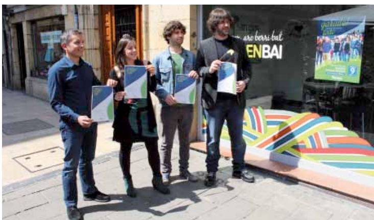
Durangoko EH Bilduko kideak, Andra Marian duten lokalaren alboan.