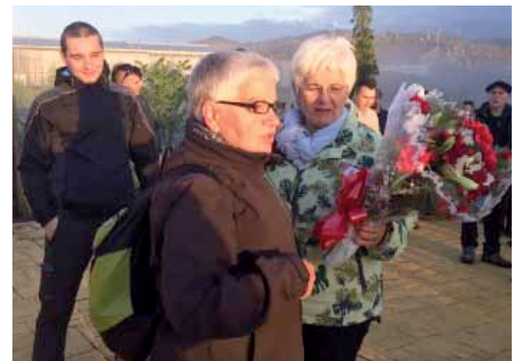
Berriozabal, eguaztenean, kartzelatik irten berri. @EtXeratElkartea

lukeela eskatu izan dute bere senideek eta hainbat herritarrek.