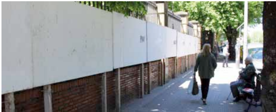
Taulak gertu daude hauteskundeetako kartelak jartzeko.

Dena gertu dago maiatzaren 24ko udal eta foru hauteskunde kanpainerako