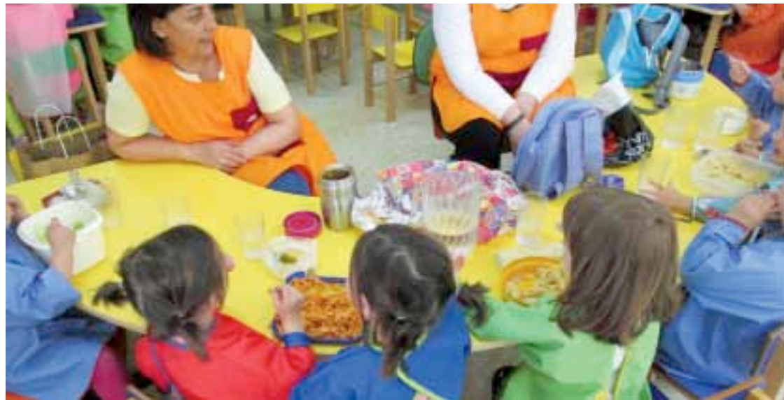
Eguaztenean, etxetik eramandako janaria bazkaldu zuten umeek jantokian.

Eguaztenean ez zen jantoki zerbitzurik izan, eta bakoitzak bere etxetik eramandakoa jan zuten; Hezkuntza Sailari zuzendutako protesta ekitaldia izan zen