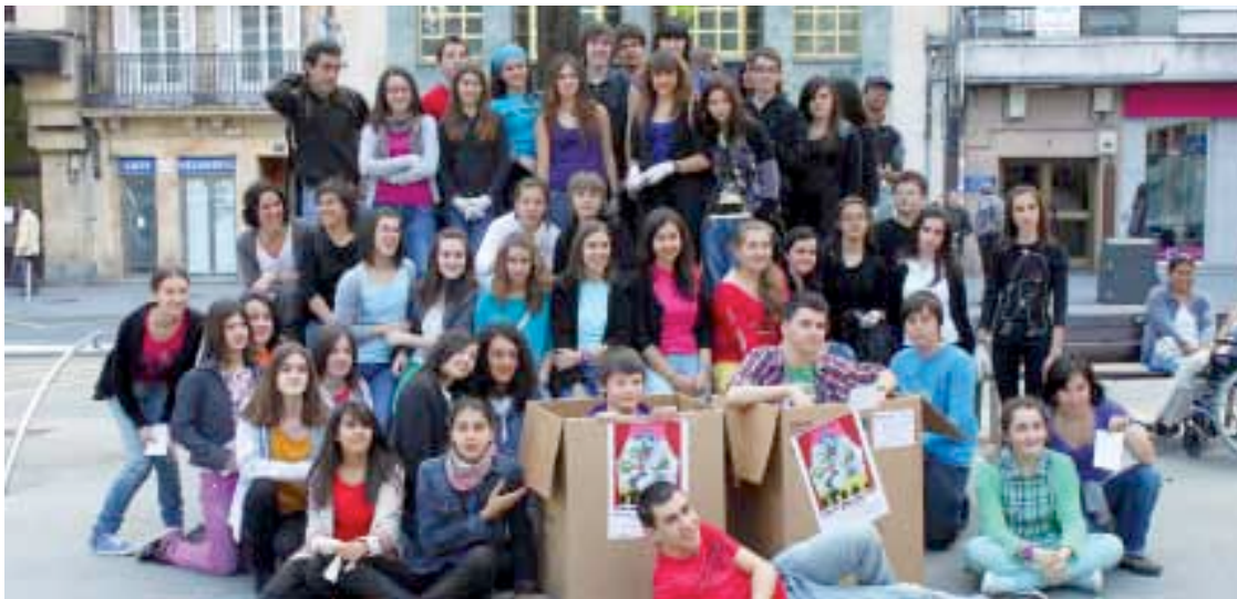
13 eta 18 urte arteko gazteek hartu dute parte ekimenean.

ko dute jaialdia, eta, maiatzaren 17an, Zornotza Aretoan, esaterako. Bihar, 20:00etan hasiko den Durangoko doako emanaldian