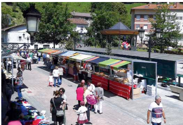
Iazko Kultur Astean ere ekitaldi ugari eskaini zituzten.

ahuntz azpigorrien monografi-koa ere bai.