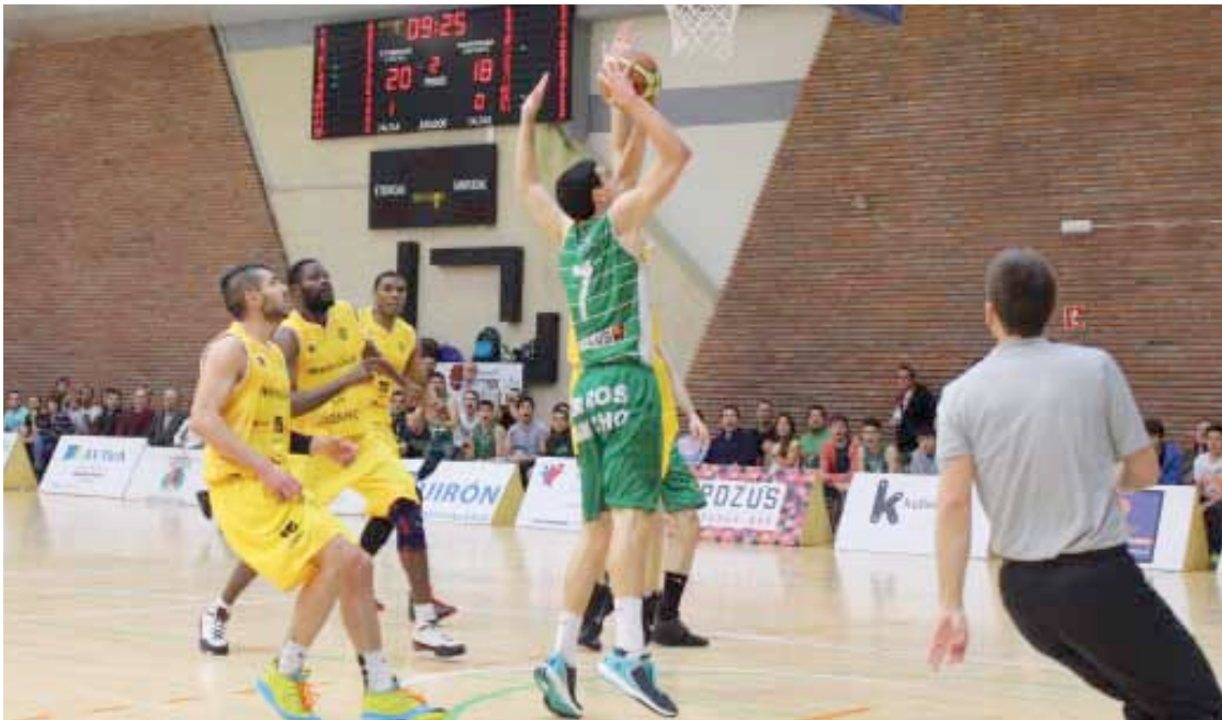
Zornotzak eta Cambadosek Larrean jokatu zuten lehen partiduko irudia. Zornotza Saskibaloia Taldea