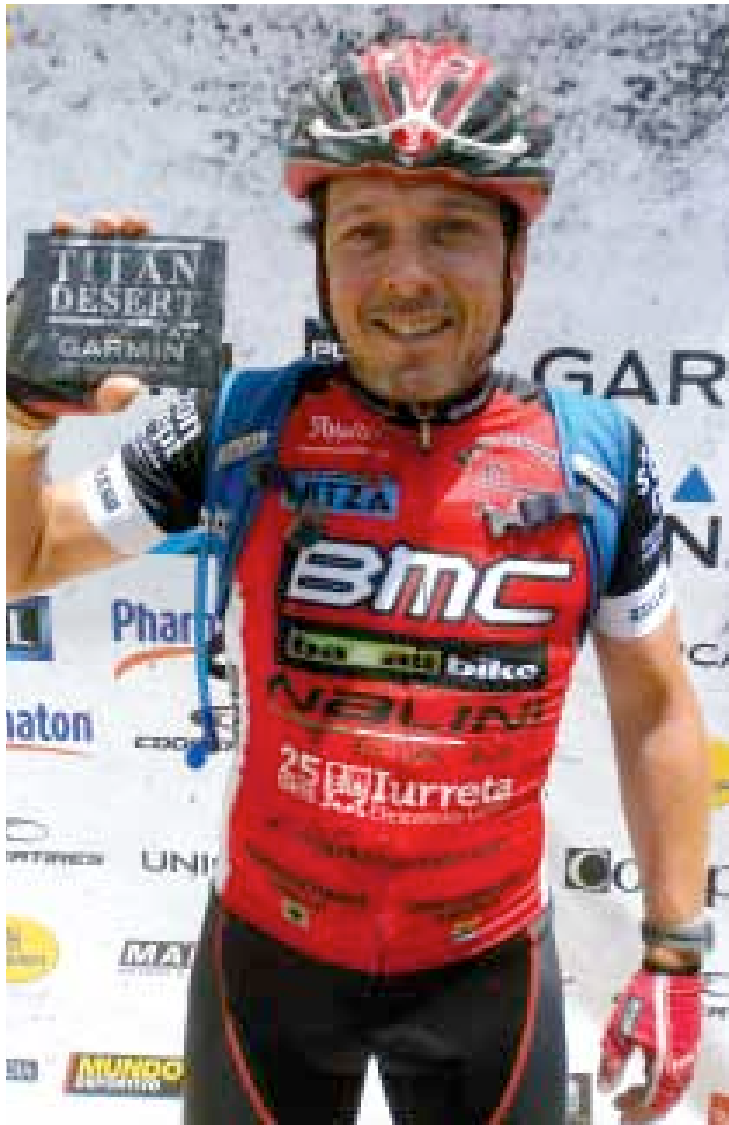
Titan Desert by Garmin lasterketan 614 lagunek parte hartu dute.