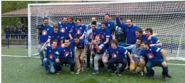
Amorebieta B bigarren urtez segidan igo da.