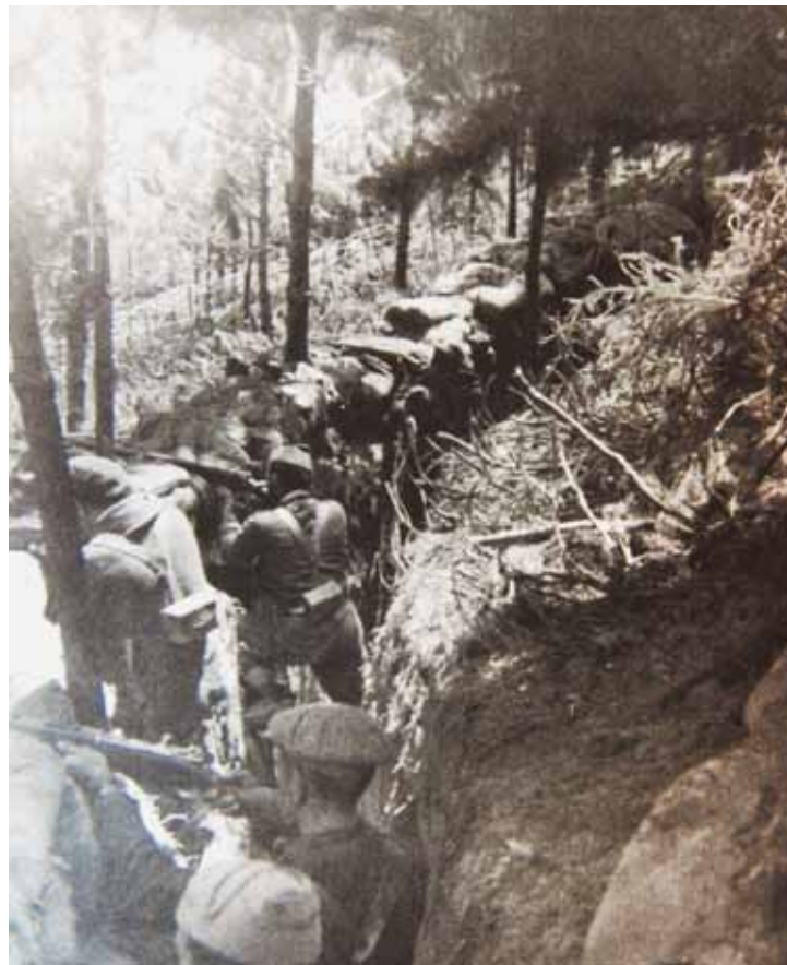
36ko gerran hainbat borroka izan ziren Bizkargin.