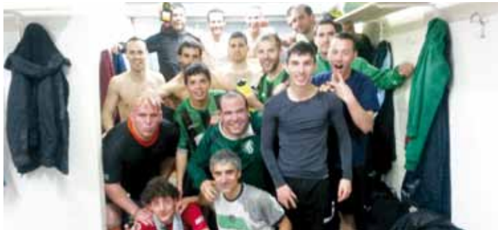
Otxandioko Vulcano Maila Gorenera itzuli da.