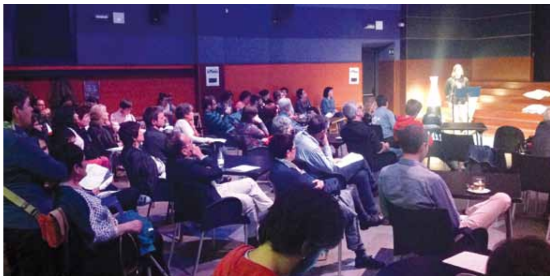
Ekitaldi horretarako sortutako hainbat olerki irakurri zituzten.

Joan den barikuko Durangoko Platerueneko irakurraldiagaz eman dute aurtengo ekitaldia amaitutzat