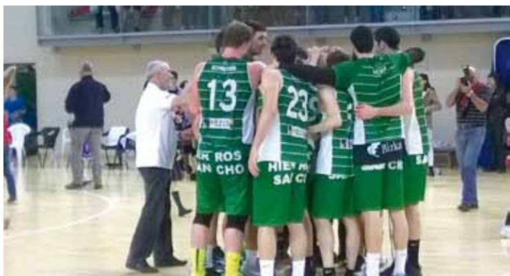
Martitzeneko partidua amaieran, jokalariek elkarrekin garaipena ospatzen.

91-70. Bigarren zatian, batez ere, gehiago izan zen. Bihar, bigarren partidua jokatu du Galizian. Irabaziz gero, playoffetako finalerdietarako sailkatuko da. Galtzen badu, Larrean jokatu dute hirugarren partidua erabakigarria.