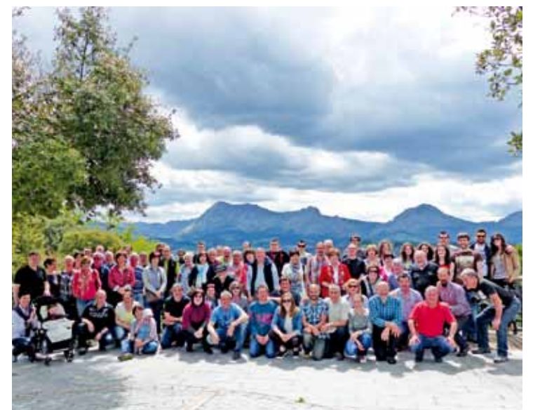
Garaitarrak eta lantziegarrek, joan zen zapatuan ateratako familia argazkian.

Garaiko eta Lantziegoko herritarren arteko hartu-eman dantzari eskerrak sortu zen, eta duela urte bi senide bihurtzea erabaki zuten udalek. Ondorioz, urtero bisitak trukatzeko dituzte.