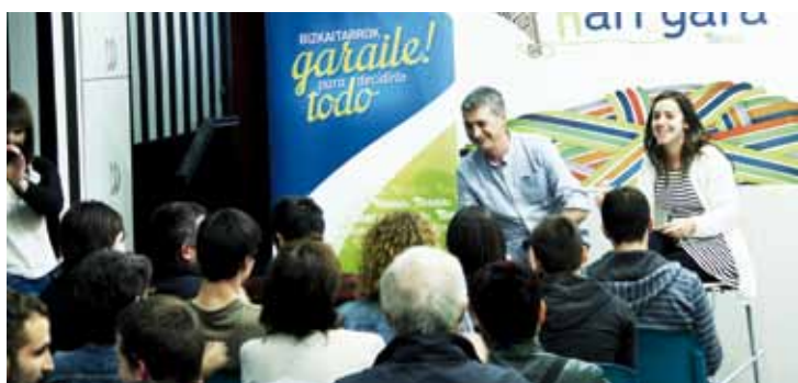
Duangoko EH Bilduk Andra Marian zabaldu du lokala.