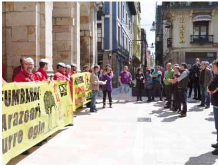
Martitzenean, Durangon eginiko manifestazioa.

Ernainen ekimenak Maiatzaren Lehena dela-eta, Borroka Astea garatzen dabil Ernai gazte erakundea, eta hainbat jarduera eraman ditu aurrera Durangon eta Elorrion, besteak beste. Durangarrek etxebizitza eskubideagaz lotu dute egitaraua, eta elorriarrek emakumearen ikuspuntutik jorratu dute.