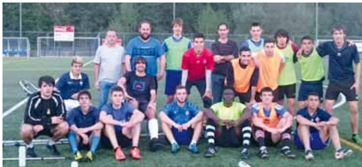
Amorebieta klubeko gazte mailako taldea.