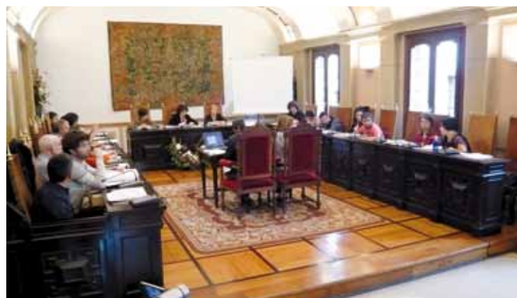
Martitzeneko osoko bilkuran, zinegotziak eztabaidan.

Udaleko alderdiek aho batez onartu dute ekimena