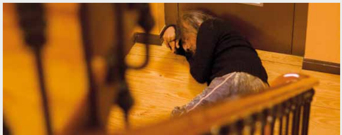
Arazo sozialez dihardu asteburuan, Elorrioko Arriolan, emango duten filmak.

film gehiago ikusi gura luke Toledo: “Zinema eta antzerkia ezin dira kaletik aldentuta bizi: gogoetarako gaia eman beharko ligukete”.