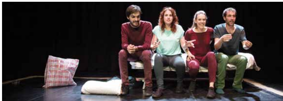
Ekainaren 12an, Lauka Teatroa taldearen 'Amodioaren ziega' izango da lurretako kultur etxean ikusgai.

Hilero umeentzako eta helduentzako antzezlan bana eskainiko dute Ibarretxen