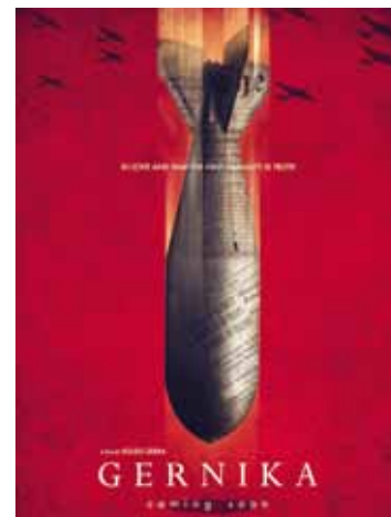
Filma iragartzen duen kartela.