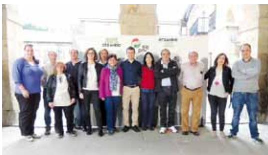
Otxandioko EAJren hautagaiak.