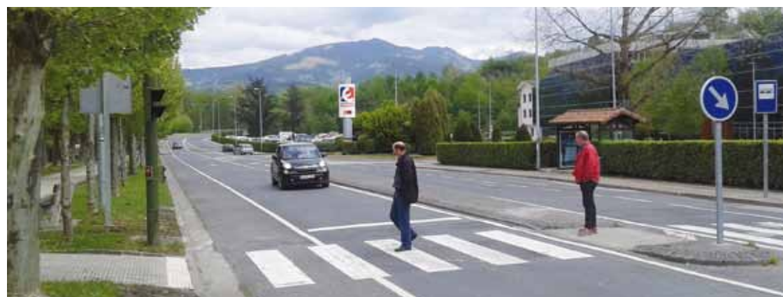
Semaforoa dagoen lekuan ipiniko dute jasotako pasaguneetako bat.