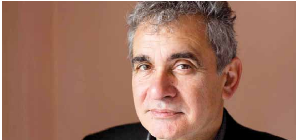
Maiatzaren 6an, Durangoko Arte eta Historia Museoa eskainiko du Atxagak hitzaldia.

‘Gogoeta harri baten inguruan’ berbaldia eskainiko du Atxagak, Durangon