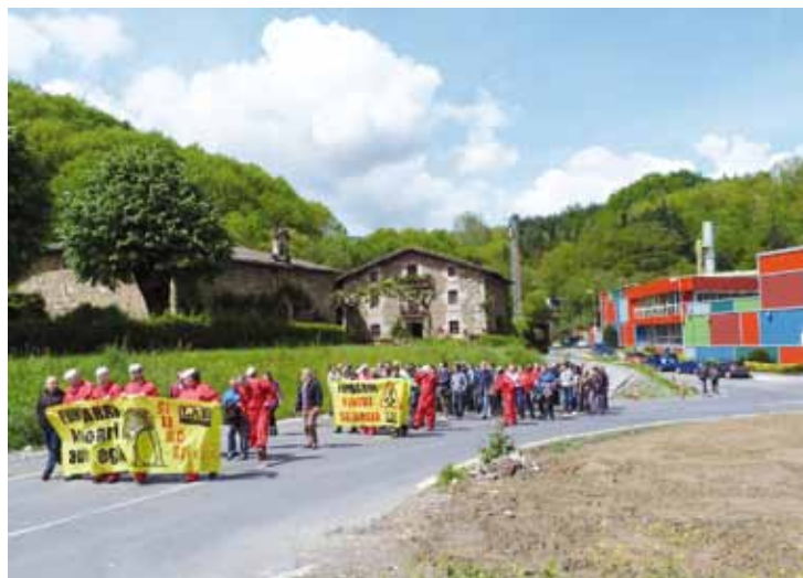
Fumbarriatik irten zen protesta.