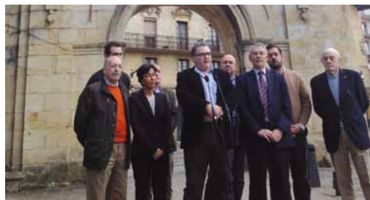
Durangaldeko PPko ordezkariak parte hartu zuten ekitaldian.

López kokatu dute. PPko zerrendaburuak esan du krisi saioan lana sustatzea izan behar dela lehentasuna, eta enpresei zein komertzioei laguntza ematea. Gizarte laguntza zabaldu nahi du, eta herriko kirol zein kultur elkartei lagundu gura die. Gainera, tren geltoki zaharreko lurra urbanizatzea beharrezko ikusten du.