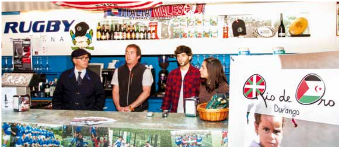
Durango Rugby Taldeko eta Río de Oro elkartearen ordezkariak, eguaztenez, Rugby tabernan. Lehiar Elorriaga

Rugby Tag jardunaldien bosgarren urtean, kirola eta elkartasuna uztartuko dituen bidea hasi dute