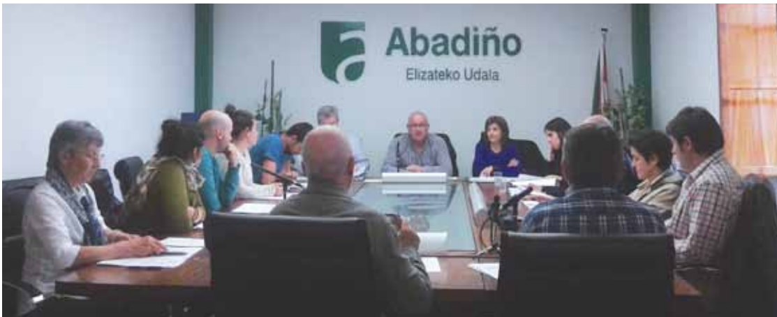
Udalean ordezkariak daukaten hiru alderdietako ordezkariak azpimarratu dute ordenantza beharrezkoa zela.

Berdintasunaren arloa arautzeko udal ordenantza onartu dute aho batez