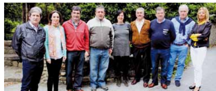
Uribelarrea buru duen EAJren hautagaizta, Mañarian.