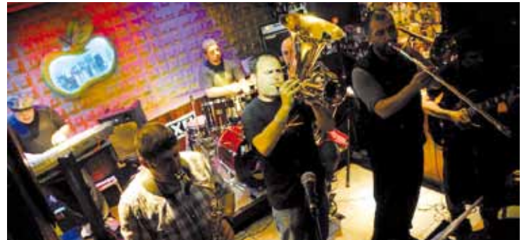
Potato taldean ibilitako musikariek sorturiko proiektua da Siroko.

askotako zein hemendik kanpoko skazaleak etorriko direla. Nahi genuke primeran joatea, eta datorren urtean jaialdiaren bigarren edizioa antolatzea.