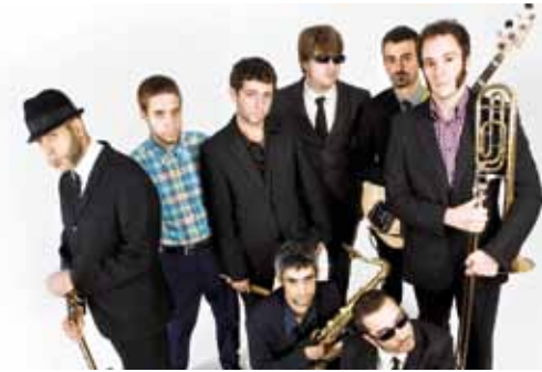
1998an, Bartzelonako Gracia auzoan sortu zuten Soweto taldea.