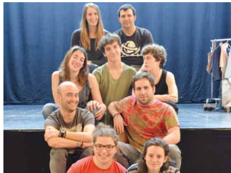
Antzezlanaren sortu duen taldea, entsegu baten ostean.