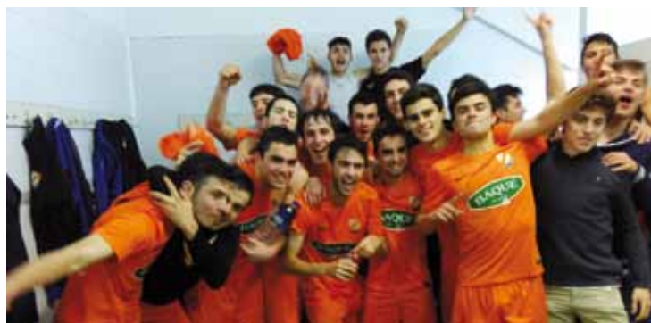
Durangoko Kulturaleko jokalariek igoera ospatzen.

artean. Jokalari berri askogaz, apurka-apurka berriro talde sendo bat egituratzea zen urte honetarako helburu nagusia. Baina oso denboraldi ona osatu du, eta Zarautz 0-2 menderatu ostean lortu du igoera.