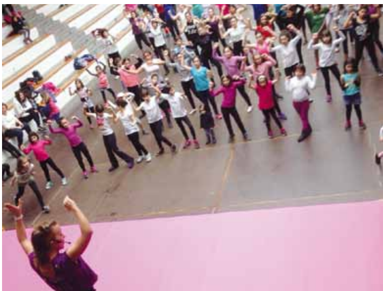
Abadiñon, aurtengo otsailean egin duten zumba maratoko une bat.

Apirilaren 28an, arratsaldean egongo dira ume eta gaztetxoei zuzendutako ekitaldiak. 16:00etan hasita, ginkana egingo dute Galizia plazan 5 urtetik gorako umeek; bizikleta gainean ibilbide bat egin beharko dute parte-hartzaileek. Plaza horretan bertan, umeentzako puzgariak egongo dira arratsalde horretan. Eurria bada, bizikleta ginkana eskolako aterpera lekualdatuko dute, eta umeentzako jolastokia, berriz, pilotalekura.