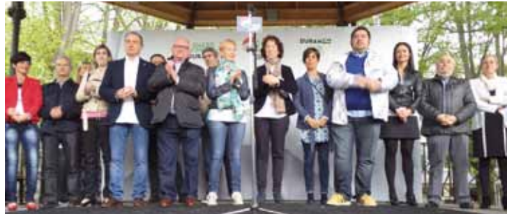
Durangoko zerrenda osatuko duten EAJko kideak, aurkezpenean.