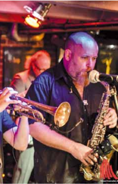
g Ding Skavaganza talde alemaniarak.

Soweto taldea, oster, 1998. urtean sortu zen, Bartzelonako (Herrialde Katalanak) Gracia auzoan, eta egiten duen musikak entzulea 1960ko hamarkadako Jamaikako girora eramateko gaitasuna du. Sowetoko musikariek ere leku eta sasoi hartako The Skatalites taldea dute kuttunen. Zaletasun hori partekatzen dute, besteak beste, Siroko taldekoekin. Zortzikotea da Soweto, eta South West Town da kaleratu duen azken lana; 2011. urtean argitaratua. Aurten du hirugarren diskoa kaleratzeko asmoa.