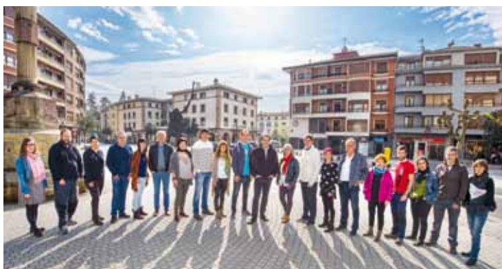
Zornotzako EH Bilduko hautetsien zerrenda.