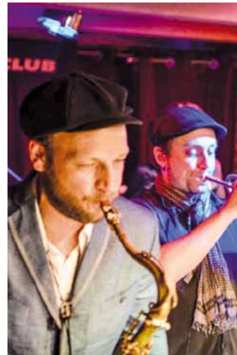
Hamabost kantuko diskoa kaleratu berri du Dr. Ring Ding taldeak.

Entzuleak 1960ko hamarkadako Jamaikako girora eramango ditu Soweto taldeak