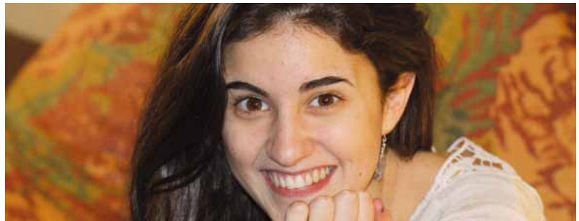
Izaro Andres mallabitarren koruak dauzkan Indigoren ‘Steps’ kanta ere aukeratu dute finalerako.