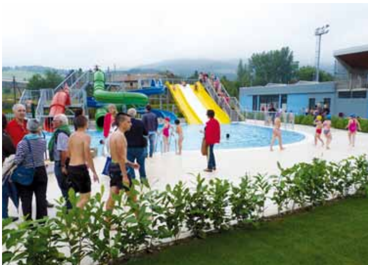
Elorrioko igerilekuaren inaugurazioa, 2014ko uztailean.

Bestalde, atsedean hartzeko eremua 1.000 metro karratutan handitzen dabilta, eta instalazioetara joateko bidea ere badiabilta zabalitzen.