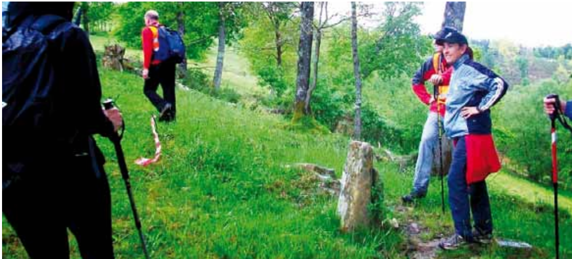
luz antolatutako Mugarri Eguneako partaide batzuk, mugarri baten inguruan.