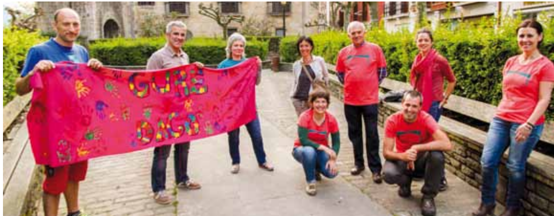
Elorrioko Gure Esku Dago dinamikako kideak atxikimenduak adierazteko oihalagaz. Lehior Elorriaga

Gure Esku Dago dinamika martxan dagoen herrietan, erabakitze eskubidearen aldeko mezuekin betetako oihalak josiko dituzte bihar