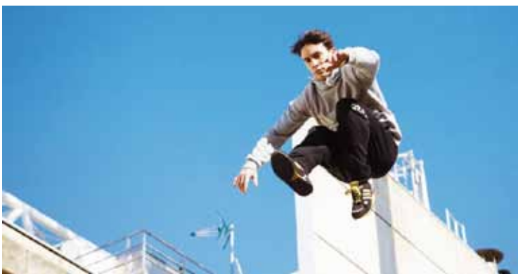
‘Parkour’ erakustaldi bat ere hartuko du Bilbao Arenak.