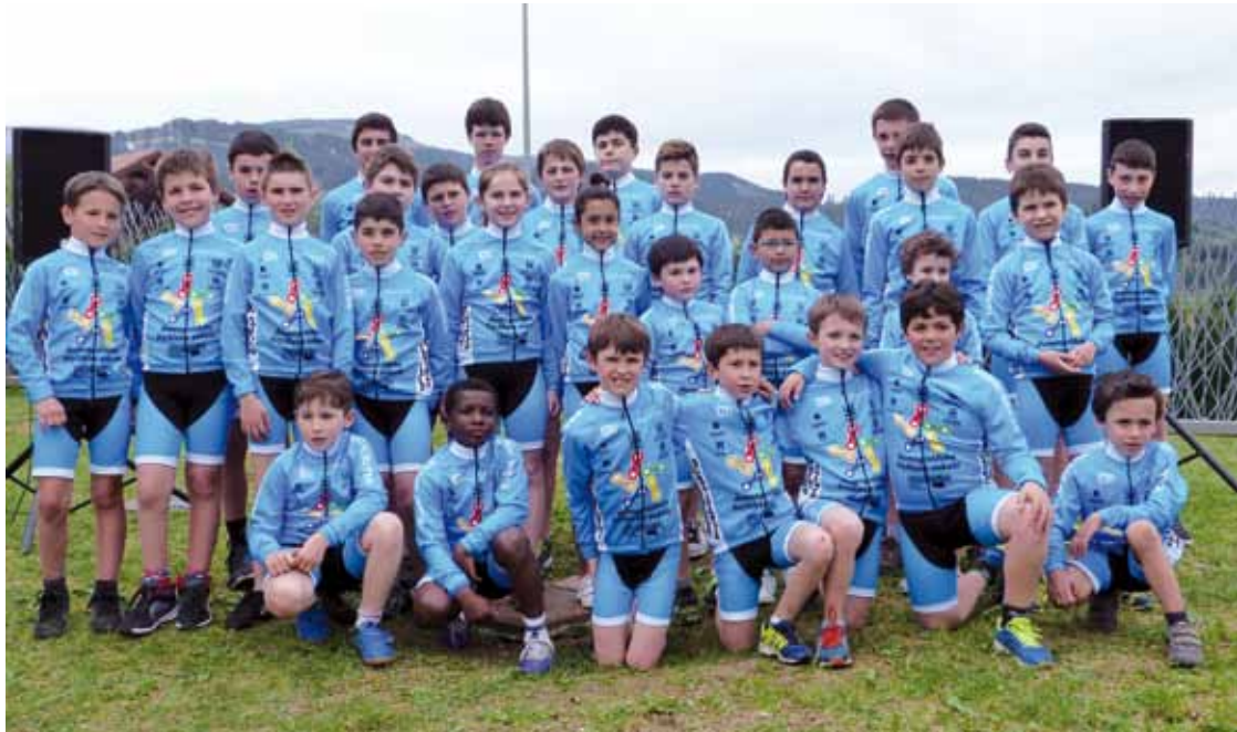
Bizikleta eskolako gazteak Gerediaga auzoko ermitaren ondoan egindako aurkezpen ekitaldian.

Lau txirrindularitza elkarteren artean sortu dute; 7-14 urte arteko 35 gaztetxogaz hasi dute bidea