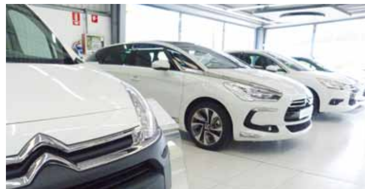
Lurretako Padureta, 3 zenbakian dago Zaer Motor.

go nuke. Ezagutzen ez duzun leku batera joatea zailagoa da.