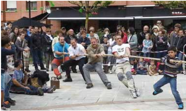
laz ere antolatu zituzten herri kirol probak.

Jai solidarioraren bitartez, elikagai iraunkorrek batu, eta Gurutze Gorriari ematea da asmoa