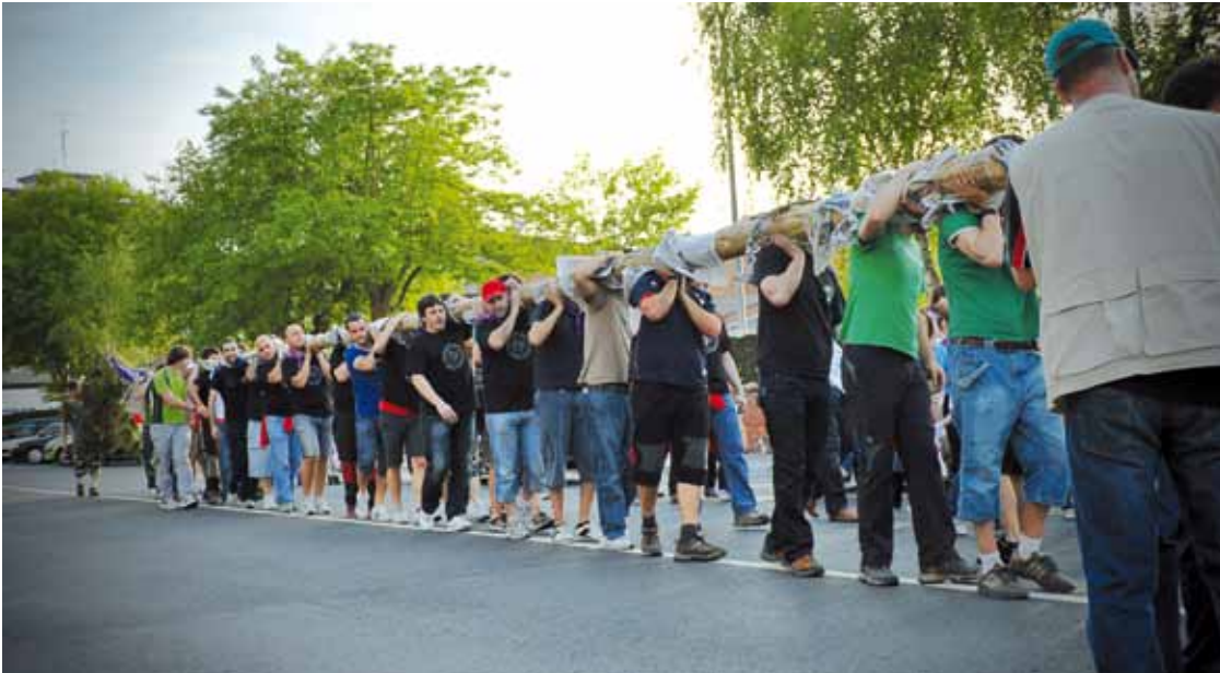
Astelehen arratsaldean batuko dira kuadrilla guztiak Trañako zubian. Ignacio Conde Martin