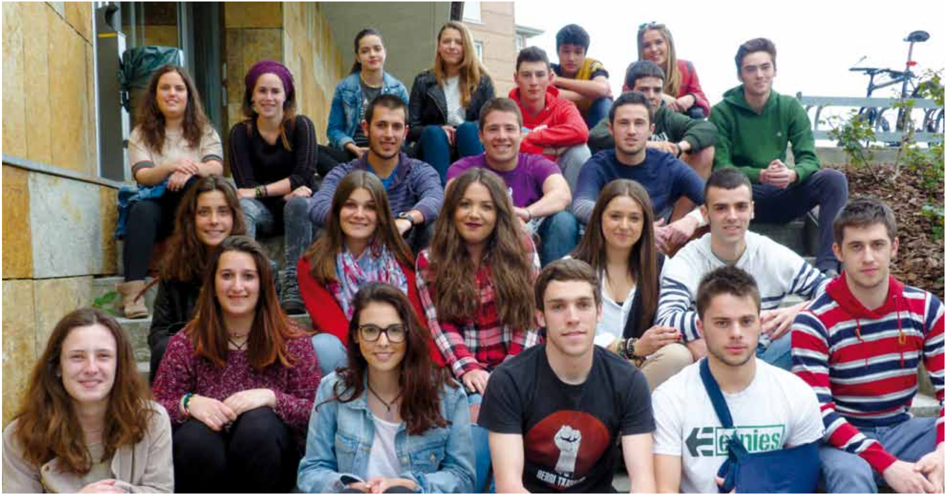
Joan zen asteko barikuan, Errota kultur etxean batzartu ziren Gazte Eguneko prestaketa lanak egiteko.