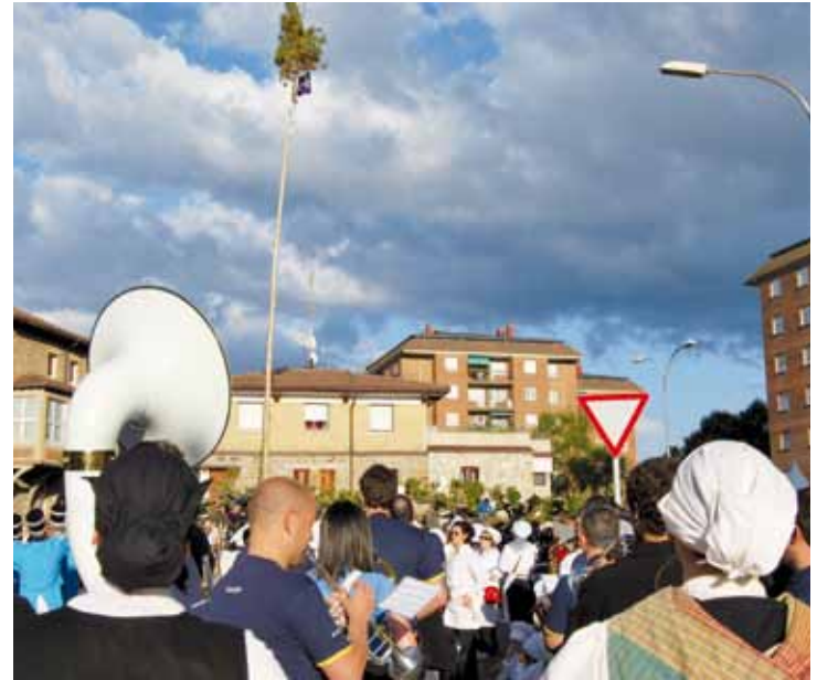
Apirilaren 25etik maiatzaren 3ra ospatuko dituzte jaiak Traña-Matienan. I.C.M.