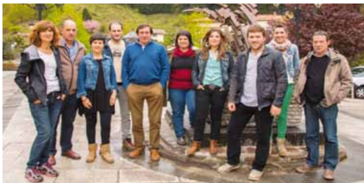
Mañariko zerrenda osatu dutenak, plazan ateratako argazkian.