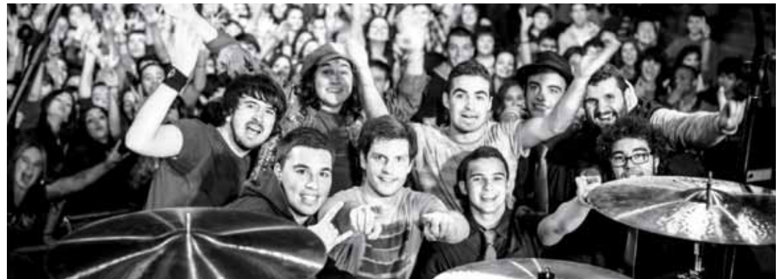
Stai Zitto taldekoek eskualdeko jendeari dei egin diote apirilaren 30eko Bilboko emanaldian taldea animatzera joateko.

Finalean parte hartzeko aukera eta 2.000 euro irabazi dituzte taldekideek