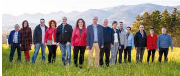
Berrizko hautagaien ateratako argazkia.