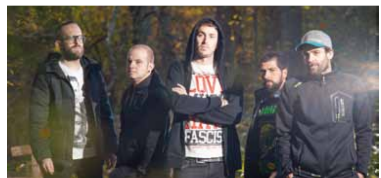
‘Seguimos creyendo’ diskoa kaleratu berri du Alertak.

Durungaldeko taldeen kontzertua izango da bihar