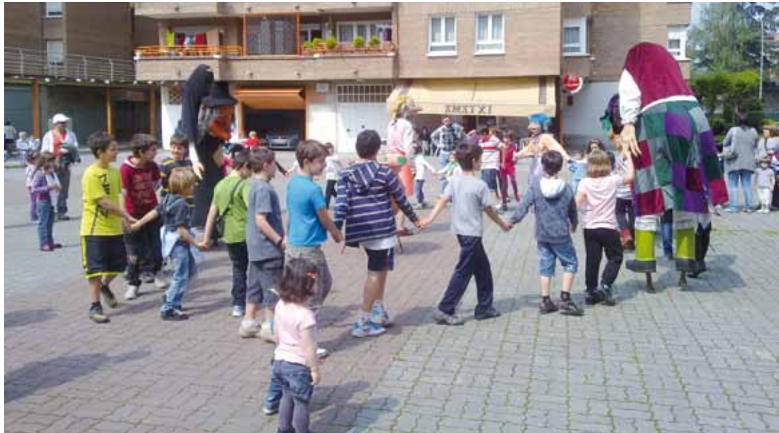
Umeentzako antzerkia, 2011ko San Prudentzio jaietan.

Goizean, tailerrak eta ludoteka egongo dira pilotalekuan; arratsaldean, Grand Prix jokoa gaztetxoentzat