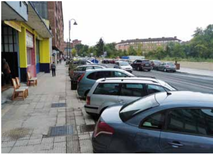
Maspe kalean 50 aparkaleku egokituko dituzte iurretarrantzat.