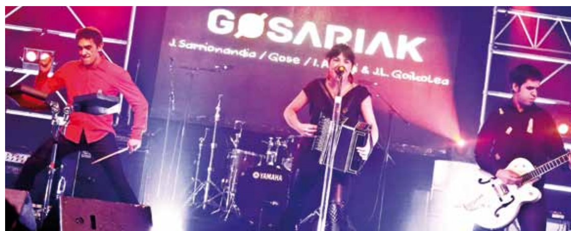
Musika, arte plastikoak eta poesia uztartzen dituen ‘Gosariak’ ikuskizuna eskainiko dute Elorrion. Saioa ‘Gauilunak’