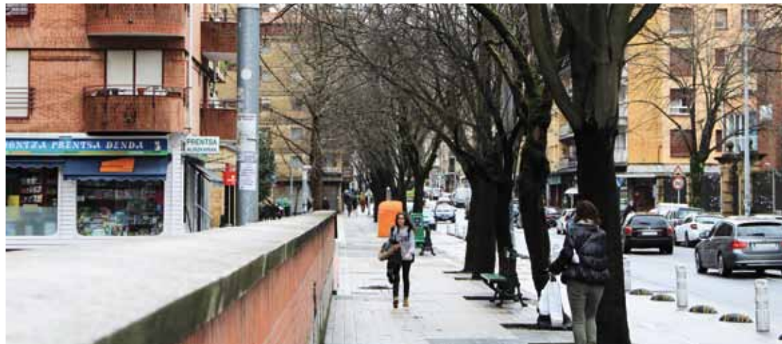
Frai Juan Zumarraga, gizon izena duen Durangoko kaleetako bat.

Durangon ez dago emakume izena duen kalerik, Santa Ana eta Andra Maria salbu