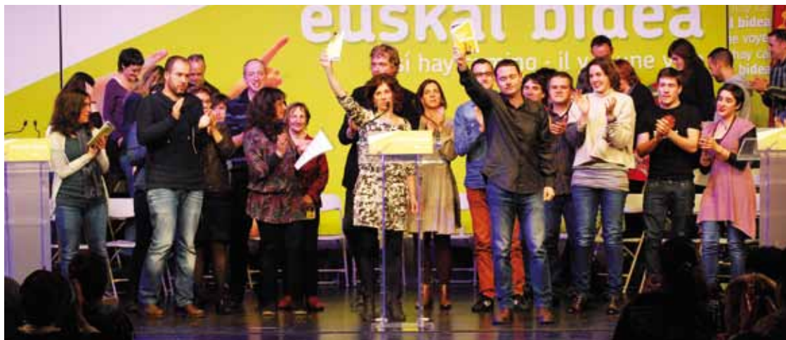
EH Bilduk Euskal Bidea aurkezteko eginiko ekitaldi nazionala.

samen horretan, abiapuntutzat gaur egungo banaketa administratiboa hartu du kontuan koalizioak, eta hiru fase zehaztu ditu. Lehenengoan, eremu bakoitzeko herritarrek erabakitze