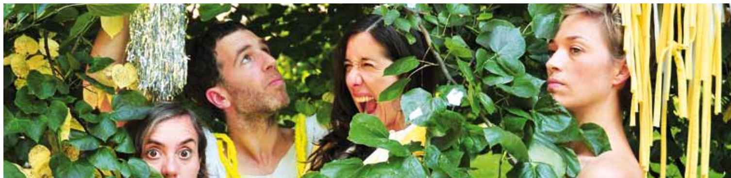
Abadiñoko Isaak Erdoiza da ‘El cielo ahora’ ikuskizuneko dantzarietako bat.

Hiru: “Autobusean isiltasuna / lurrina kristalean”, baina oraingoan Durangora bidean. Askatasun doinuak, askatasunari beharrean, askatasunean izan daitezten hurrengoan. Eta ezin bada horrela izan, zuek lasai, pazientzia osoz itxarongo zaituztegu. 40 minutuz zein 40 urtez.