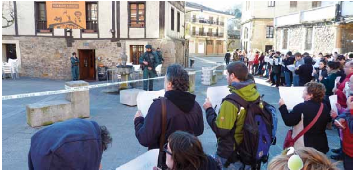
Intxaurren aldekoak, Guardia Zibilaren parean protesta egiten.

Eguerdian sartu ziren guardia zibilak Intxaurren, eta ordu pare batez ibili ziren miazten. Kanpoan dozenaka lagun batu ziren operazioa salatzeke, eta Konponbide garaia da, errepro-siorik ez lelodun kartelak hartu zituzten eskuetan. Miaketa amaitu ostean, poliziek ez zuten gauza askorik eraman tabernatik. Gero, Durangoko Azokan elkartasun denda legez erabiltzen den lokal batera ere joan ziren, baina ez ziren sartu. Zulo bate-