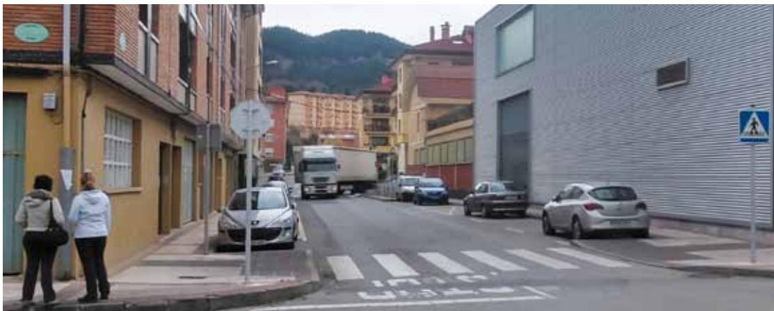
Kamioiek bira egitea ahalbidetzeko bidea zabalduko dute, besteak beste.

bira egin dezaten ahalbidetzeko bidea zabaldu, eta espaloia estutuko dute. Gainera, oinezkoentzako guneak eta aparkalekuak ere berrantolatu egingo dituzte.