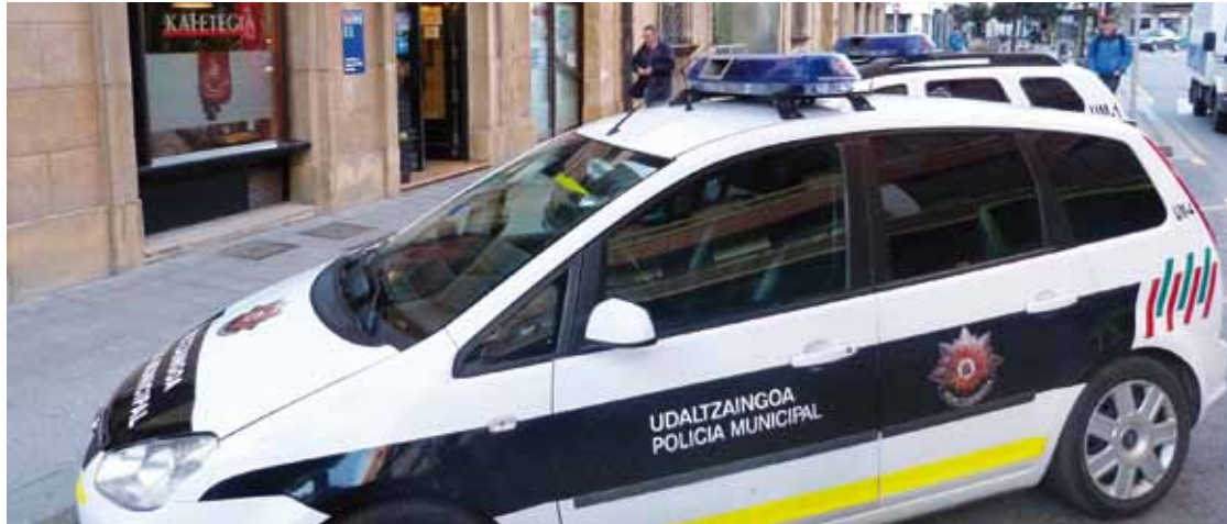
Gaur egun 21 udaltzain daude Zornotzan.

Arazoa konpontzeko “proposamen zehatzak” eta “konpromiso garbia” gura du