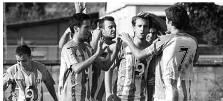
Abadiñoako jokalariek guztien kromoak atera dituzte.