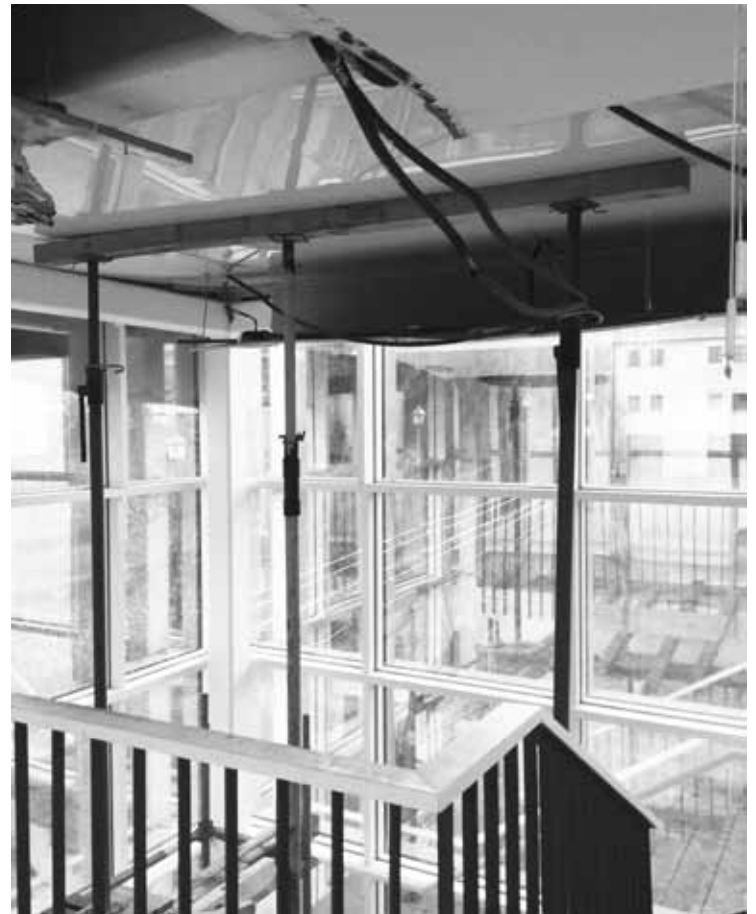
Iturriko larrialdietako irteeraren egoera erakusten duen argazkia.