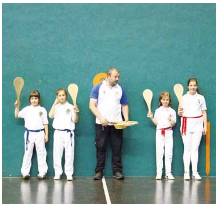
Palistak, partidu bat hasi aurretik.