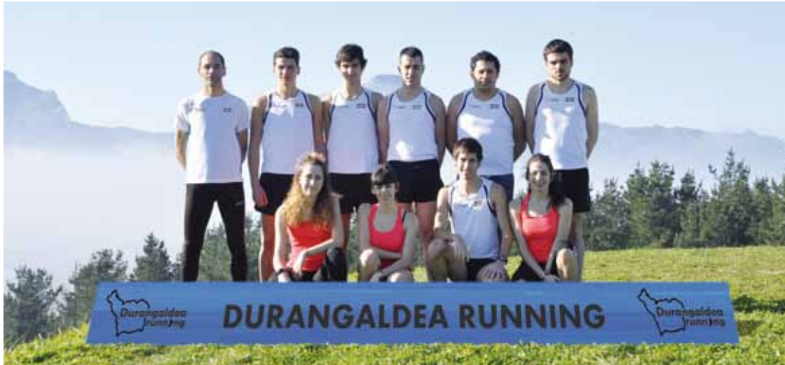
Durangaldea Running taldeko familia argazkia.