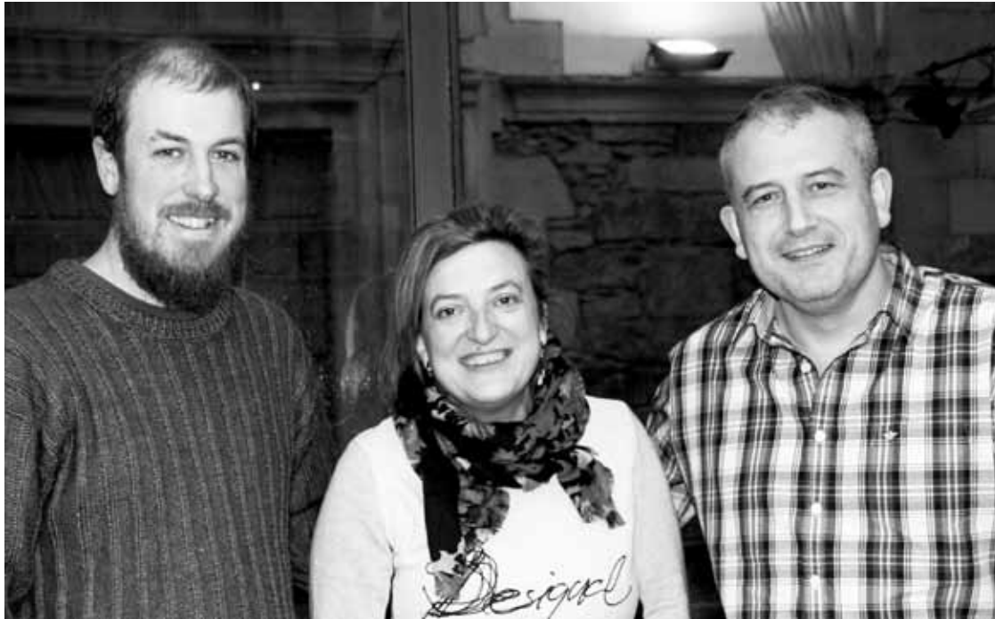
Sorkuntza bekaren sariduna eta San Agustingo datozen hilabeteetarako programazioa aurkeztu dituzte.