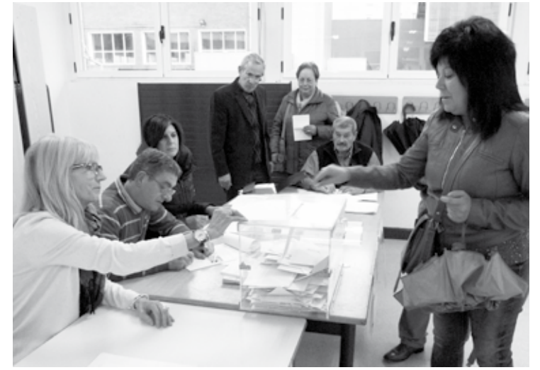
Maiatzean, botoa emateko beste aukera bat edukiko dute herritarrek.

bar- lortu zituen koalizioak. EAJk 51 aulki bete zituen, eta bost alkatetzera ere bai: Berriz, Durango, Elorrio -bozkatuena ez izan arren-, Iurreta eta Zornotza. Abadiñon independenteak irten ziren garaile, eta, Amankomunazgoan lortutako aulkiak EAJri lagata, Bildu gainditu zuten jeltzaleek.