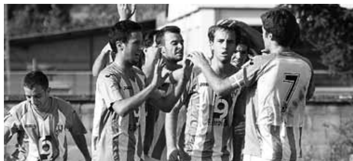
Abadiñoako jokalariek guztien kromoak atera dituzte.