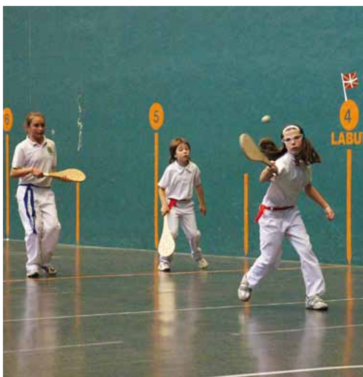
Pala esku pilotaren alternatiba da neska askorentzat.