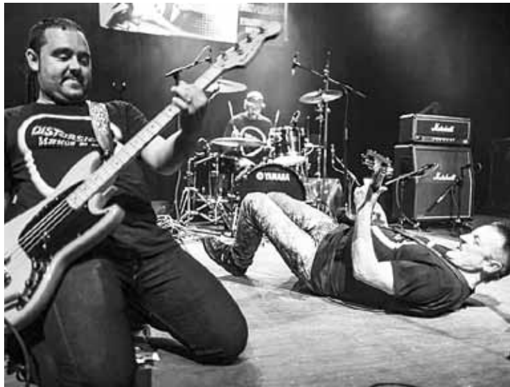
Distorsion taldeak kontzertua eskainiko du, gaur gauean, gaztetxean.

Bihar Luhartz eta Kubako musika izango dituzte