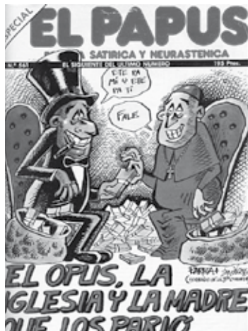
Astekariaren azaletako bat.