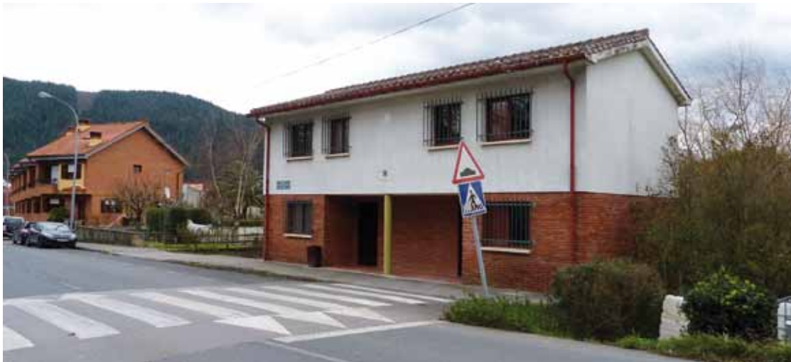
Apatako Maisuen etxearen gainetik igaroko litzateke AHTaren biaduktua.

Atxondoko Udalak herriko tartea zein egoeratan dagoen jakin gura du