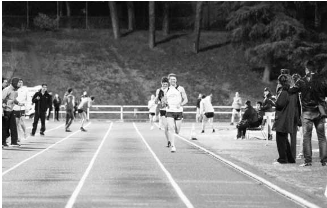
Iazko Denbora Hartze proba bateko irudia. Espainiako Triatloi Federazioa

Lizentziarik ez dutenek ere parte hartu dezakete 3 euroan eguneko aseguruia aterata