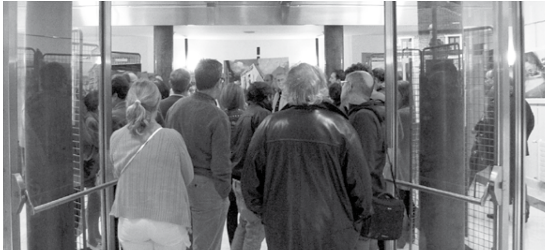
Kultur Etxeko ikusle fidelak saritu gura dituzte bazkide egiteko aukeragaz.

Besteak beste, %25eko beherapena izango dute bazkideek emanaldietan