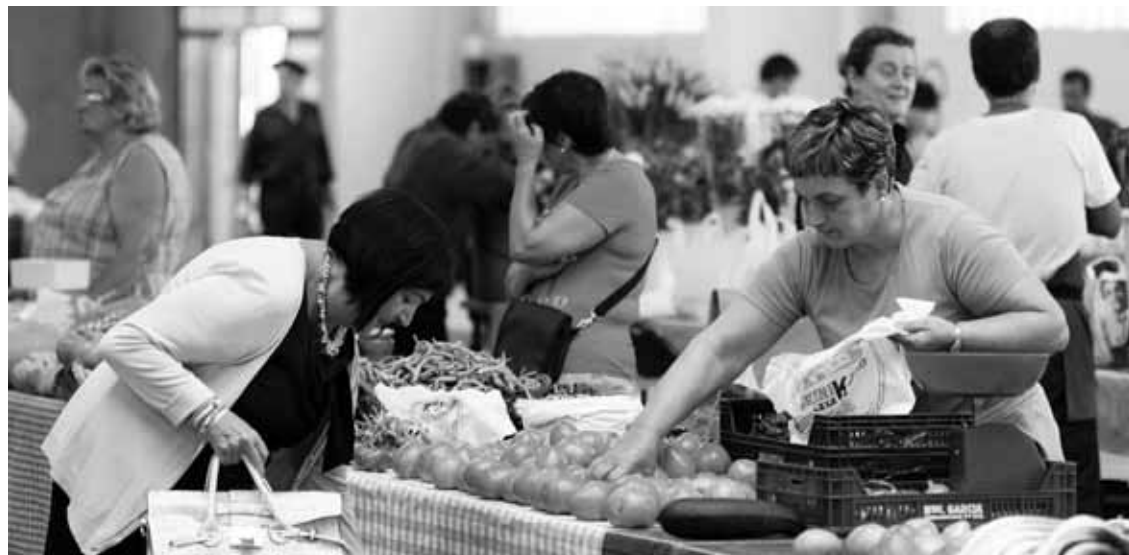
Merkatu plazan 30 bat saltzailek ipintzen dute postua.

Agorriaren esanetan, araudia oposiziotik bultzatu zuten,