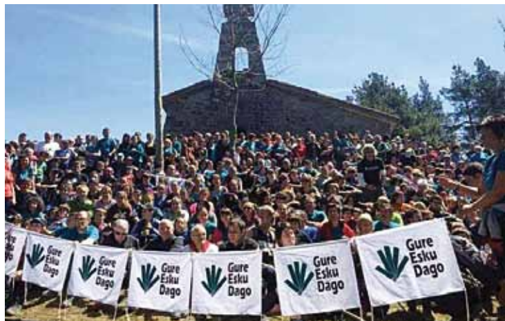
Zornotzako Gure Esku Dago kideek iaz Bizkargin aterako argazkia.