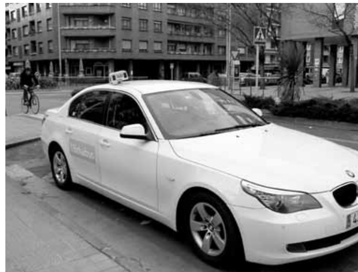
Durangotik Garairako taxiak Bizkaibusen ikurra ere badauka.

Lau erabiltzailetik gora egonez gero, baten bat kanpoan geratuko da, zerbitzu barik