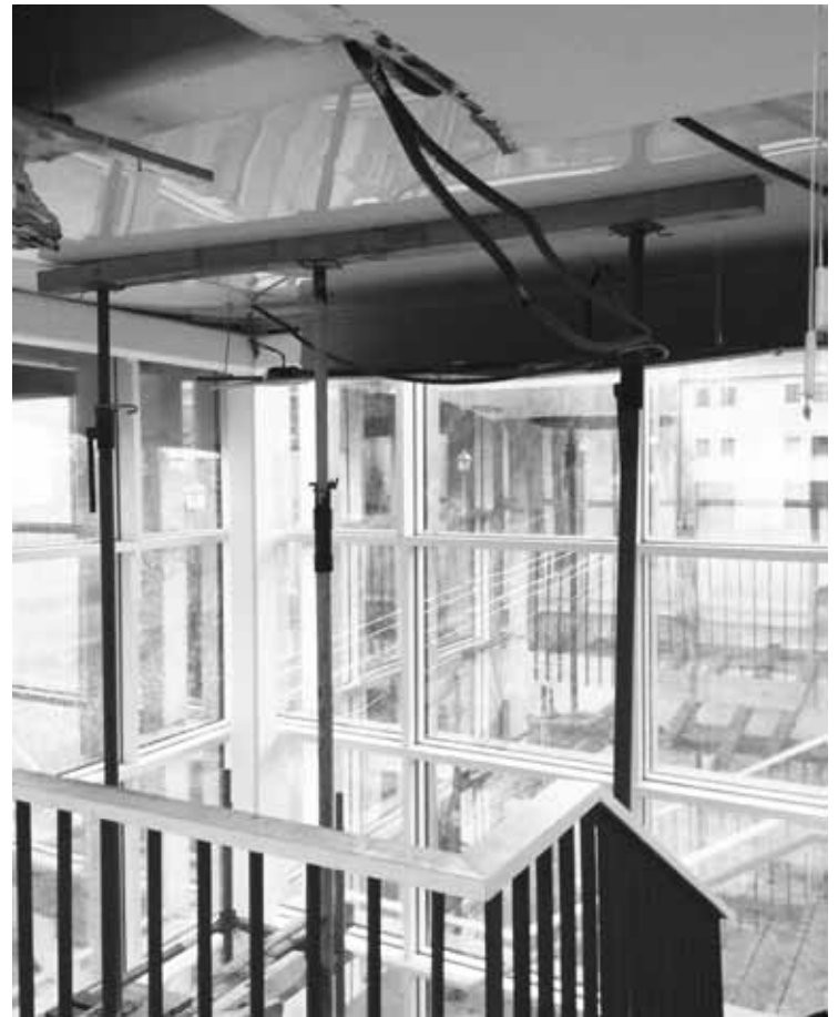
Iturriko larrialdietako irteeraren egoera erakusten duen argazkia.