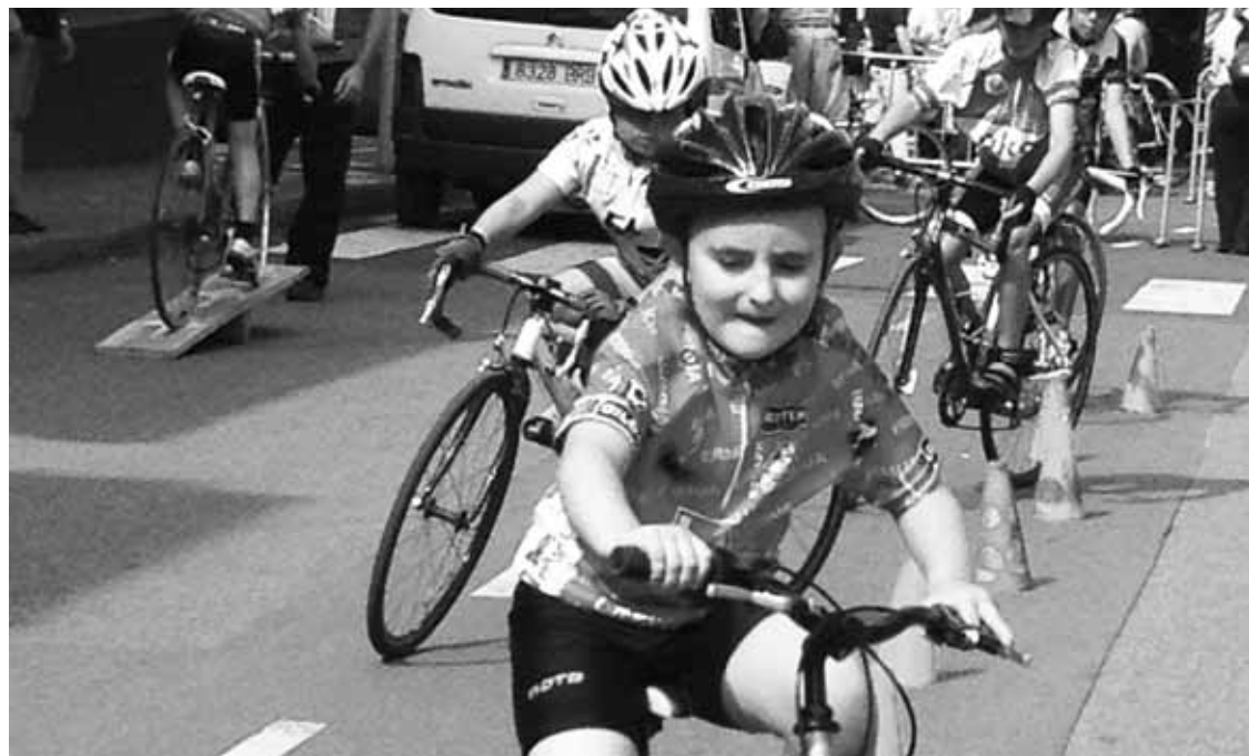
Durangoko txirrindulari elkarteak gazteei zuzenduta antolatutako ginkana bateko irudia.

Durango, Elorrio, Abadiño eta Iurretako txirrindulari elkarteek sortu dute