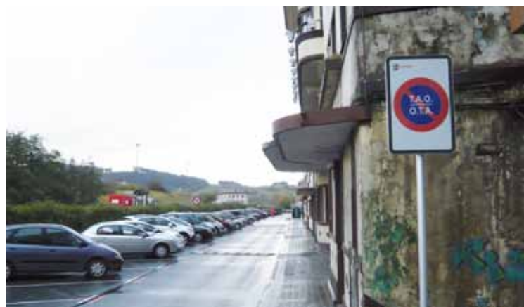
Aparkaleku batzuk iurretarentzat gordeta daude Bidebarrieta kalean.

Eremu laranja ordainpekoa izateak eztabaida piztu du