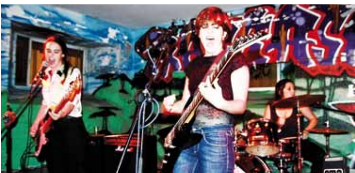
Endemaño taldeak eta Humusek kontzertua eskainiko dute zapatuan. Emarock.

Jaialdia, tailerrak eta kontzertuak izango dituzte