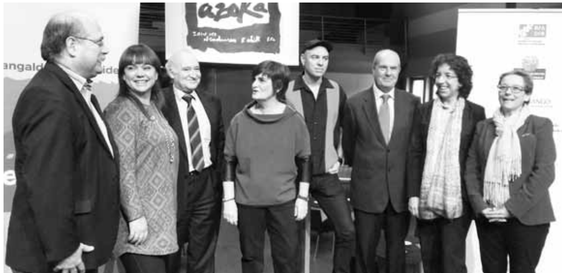
Azoka babesten duten erakundeen eta Gerediaga Elkartearen ordezkariak elkartu ziren prentsaurrekoan.

Aste bi barru hasiko da Durangoko Azoka, eta, eguaztenean, Plateruenean egin zuten aurkezpen ofiziala