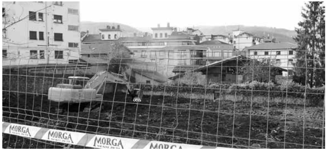
Hondeatzailea aparkalekua egingo duten orubean lanean.

El Carmelo ikastetxearen eta Konbenio hotelaren artean dagoen orubean dabiltaza aparkalekua egiten