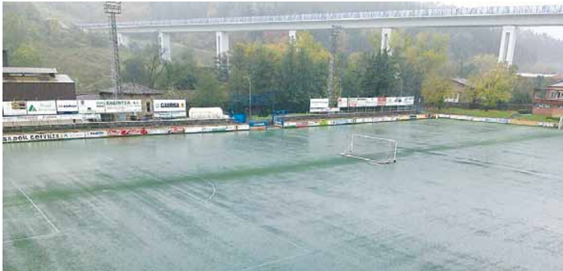
Orain hamabost egun izandako zaparrada baten ostean, futbol zelaia ura iragazi ezinda geratu zen. Kulturala.

Belar artifizialeko zelaia gastatuta dago, eta ez du ura behar moduan iragazten