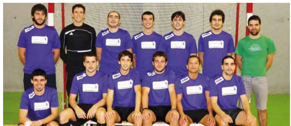
Gu Lagunak gaur egun osatzen duten gazteak.