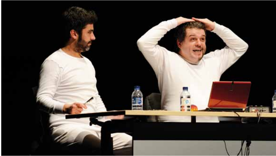
‘Macho Maris’ antzezlaneko aktoreak.

Ermuko Zipriztintzen gizon taldekoek hausnarketarako eskaintza egingo dute antzezlanagaz