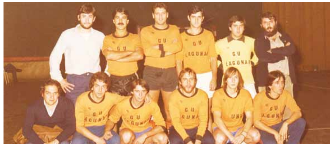
Gu Lagunak taldeko lehenengo belaunaldia.