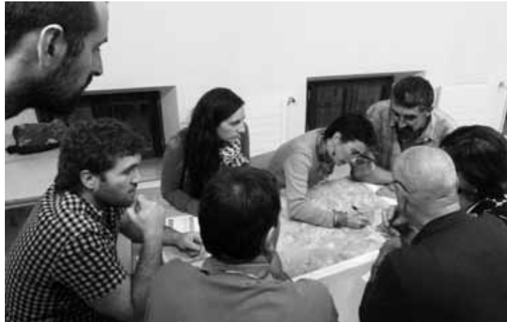
Herritarrek botoa emateko aukera edukiko dute Mañarian.

Gaur hasiko da Plan Orokorren inguruko galdeketa; sei eredu daude aukeran