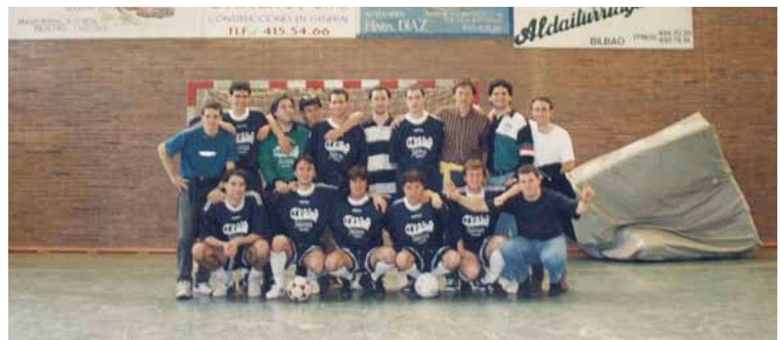
Bigarren belaunaldikoak, neurketa baten aurretik.