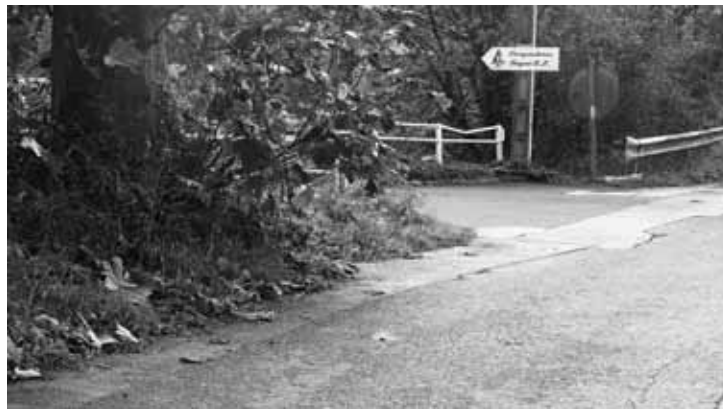
Arbizolean errekararen aldetik egingo dute bidegorria.

zubitik aurrera Arbere enpresa ingururaino jarraituko du bidegorriak, baina bidearen eskuma aldetik joango da. Inguru horretan, lur-jausi bat gertatu da, eta, gainera, metro batzuetan bidea estutu egiten da. Beraz, alde batetik, eroritako lurra kendu eta gune hori egitura bategaz indartuko dute, etorkizunean berriro horrelakorik gertatu ez dadin. Bestetik, bidea asko estutzen den inguruan, piboteekin banatuko