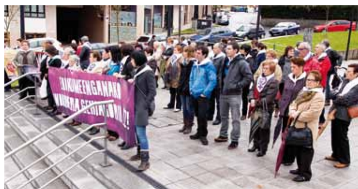
laz egindako mobilizazioan hartutako irudi bat.

Genero indarkeriaren kontrako ibilbidea egingo dute Zaldibarren