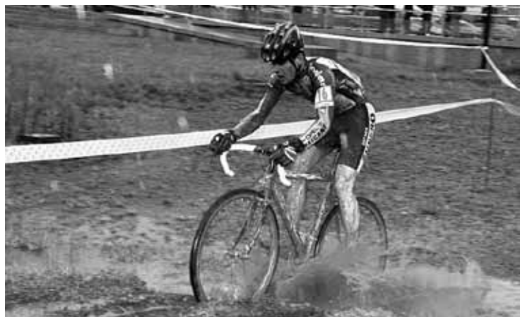
Iazko Berrizko probako une bat. Berriz Bizikletari Elkarteak.

junior mailako txanda izango da, eta emakumeen elite eta 23 urtez azpikoena ere bai. 12:00etan Master 30, 40, 50 eta 60 mailakoak irtengo dira belodromotik; azkenik, 13:00etan, gizonen elite eta 23 urtez azpikoen txanda izango da.