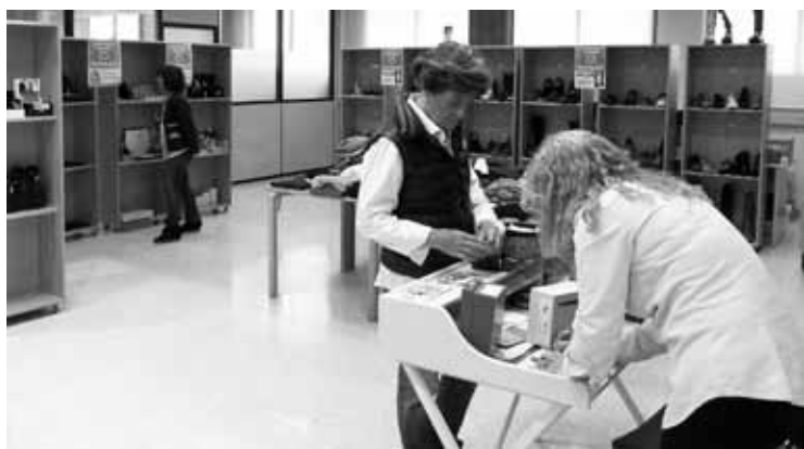
Hiru dendetako gaiak daude salgai Durango Shopping saltokian.

Saibigain kalean dago saltokia, Maristak ikastetxearen ondoan, eta hilaren 29ra arte hiru dendak erabiliko dute: Bilma Boutique, Katy Oinetakoak eta Mancisidor bitxi dendak. Gero, urtean barrena aldizka zabalduko dute, saltokiak txandakatzeko joateko.