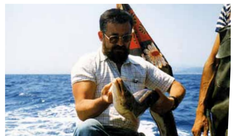
Blanesen (Herrialde Katalanak), itsasontzian. www.hontzamusoa.com .