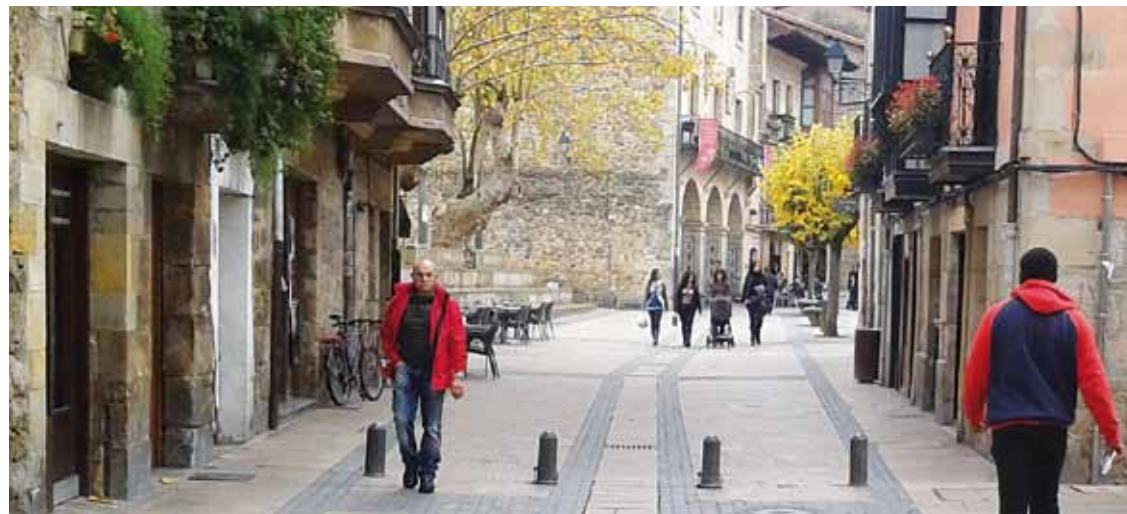
Elorriko udalbatzak ez du tasen igoerarik onartu.

EAJ eta Bildu ez dira ados jarri, bien nahia tasak mantentzea izan arren