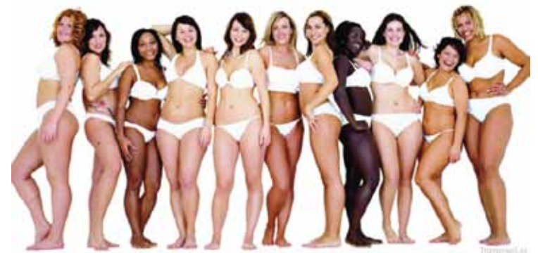
Victoria's Secreten eta Doven kanpainak.

ro-egunero indarkeria sinbolikoa sufritzen dugu". Indarkeria mota horrek emakumeen osasun fisiko eta mentalean zuzenean eragiten du. "Estereotipo bat dago, eta denok izan behar dugu horrelakoak: argalak, ile luzedunak, titi handiekin... Hori lortzen ez duen jendearen artean arazo asko sortzen dira. Anorexia, bigorexia, depresioa eta norberaren gorputzagaz gustura ez egotea".