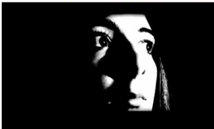
Iurretako eta Durangoko kideen bideo banaren fotogramak.

> DURANGALDEA A. Ugalde Durangoko San Agustin kultur-gunean jaialdi berezia egingo dute datorren egunean, azaroak 27. Iluntzeko 19:00etan hasita, Durango, Abadiño, Berriz eta Iurretako zortzi taldek Beldur Barik jarrera lehiaketara aurkeztutako bideoak ikusi, eta sari banaketa egingo dute.