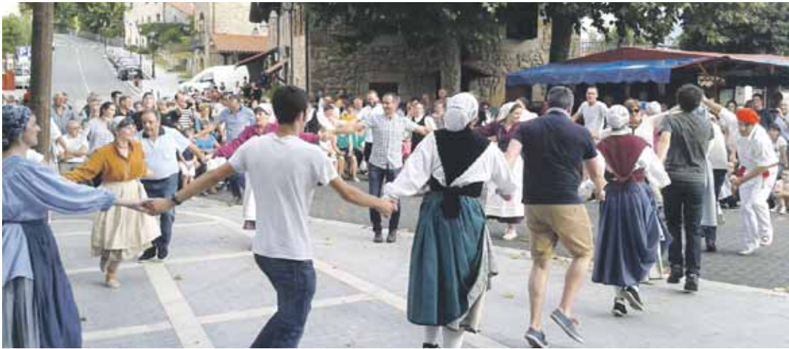
Uztailearen 24an Donien Atxa ipini eta gero, dantzan hasiko dituzte Garaiko jaiak.