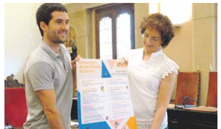
Tazebaez taldeak antolatu du egitaraua.

Irigorasek adierazi du Durango “erreferentea” dela mugikortasun eta jasagarritasun politketan, eta konpromiso horren baitan kokatu du Mugikortasun Astea.