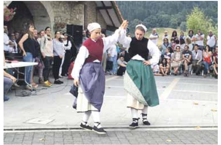
Iaz emakumeek bakarrik parte hartu zuten erregelen erakustaldian.