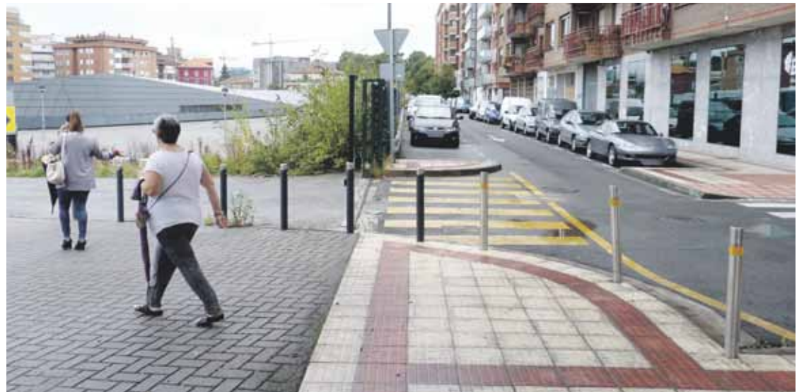
Askatasun etorbidearen atzealdean egingo dute argiztapena hobetzeko lanetako bat.

Domekan, trikitilariak alaituko dute giroa. Mezaren ondoren, auzo bazkarian batuko dira.