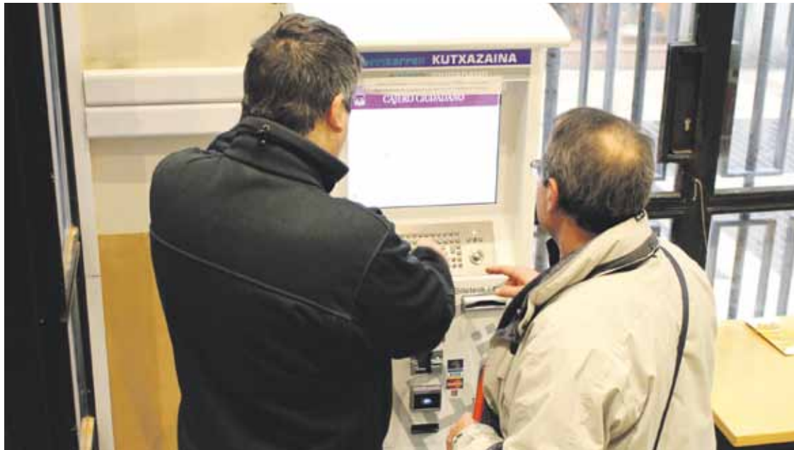
Herritarren eskaera eta kexei 7 egunen buruan eman beharko diete hasierako erantzuna.

Parte-hartzearen inguruko ordenantza onartu dute osoko bilkuran; orain, garatu egin beharko dute