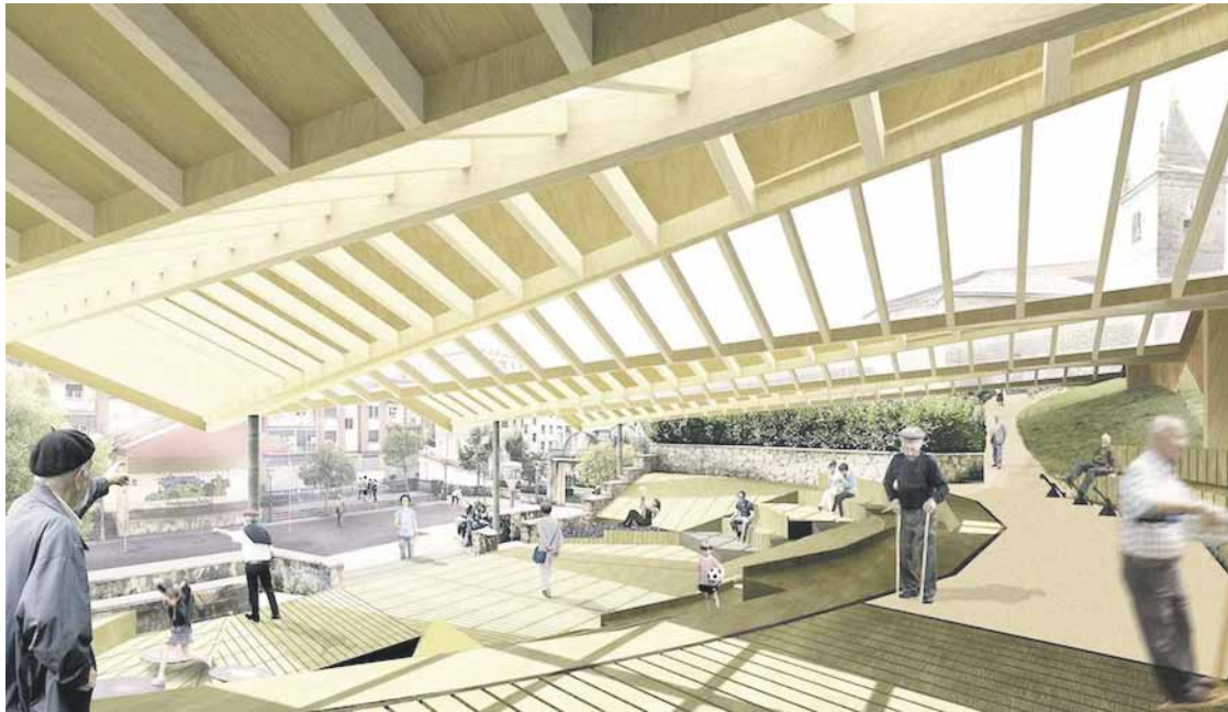
Anfiteatroa zureko egitura batez estaliko dute.