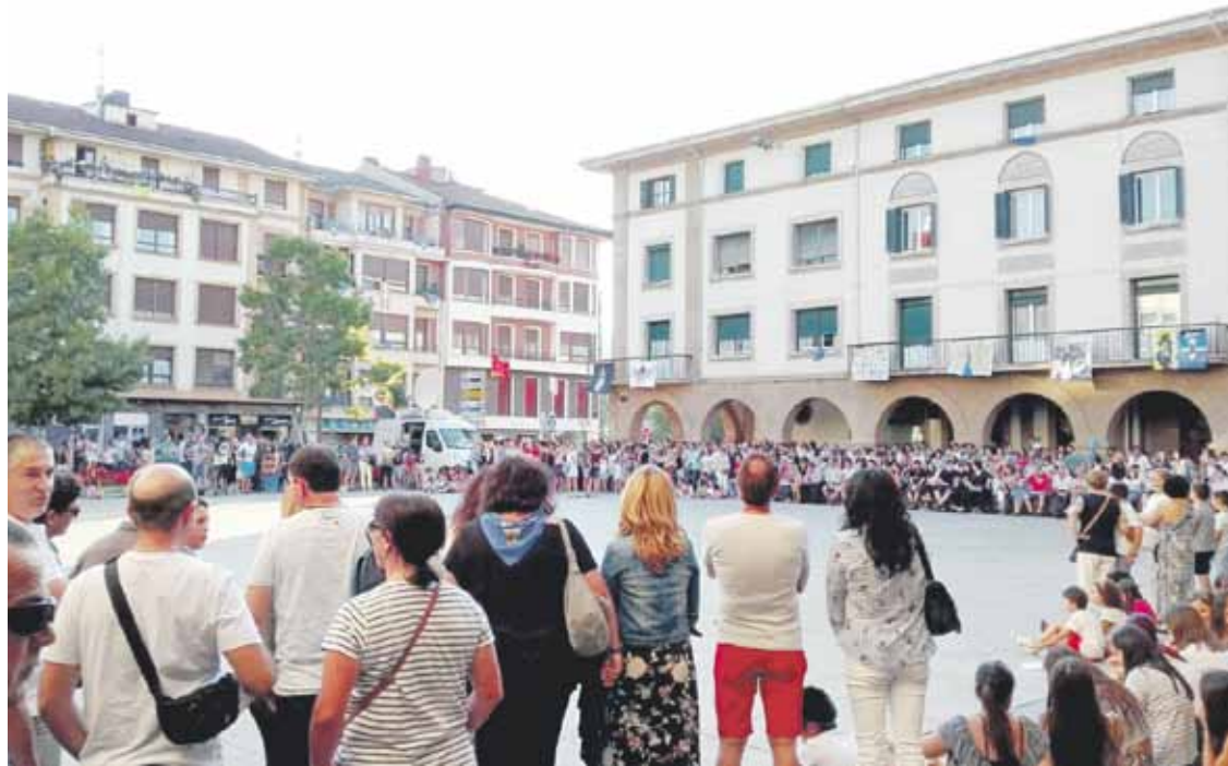
Zornotzan kontzentrazio jendetsua egin zuten erasoak gaitzesteko.

Zornotzan eta Durangon emakumeenganako eraso bana gertatu dira