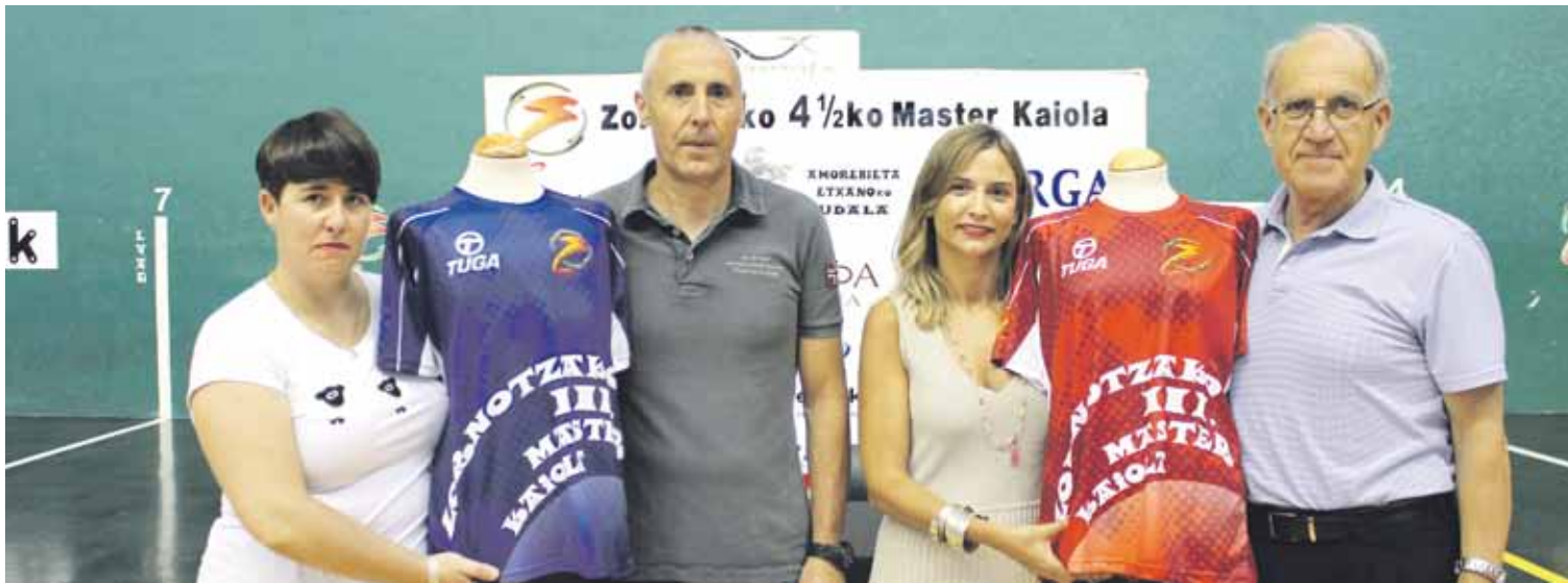
Lagun Onak pilota elkarteko eta Ametx erakundeko arduradunak, eguaztenean finalak aurkezteko eskaini zuten prentsurrekoan.