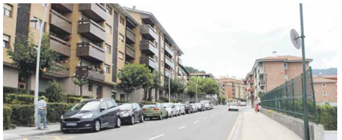
Iturritza kalea urbanizatuko dute.

Udalak jakitera eman duenez, orain arte pribatua izan den Iturritza kalea udalari utzi diote urbanizazio jabeek.