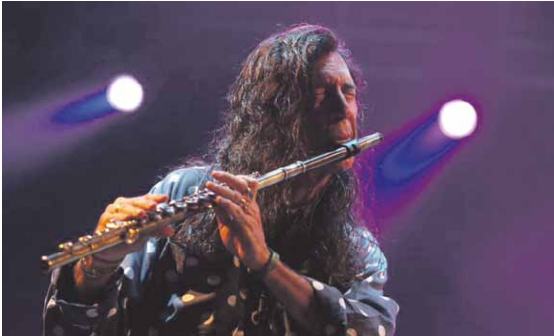
Flamenkoa eta jazz uztartzen aitzindaria izan zen Jorge Pardok joko du gaur Elorrion.

Jaialdiaren erdia baino gehiago bete du Musikairek, baina uztaileko bi asteburutarako plana eskainiko du, oraindik. Asteburu honetan, Lariz jauregian dira zitak. Jorge Pardo (Madril,