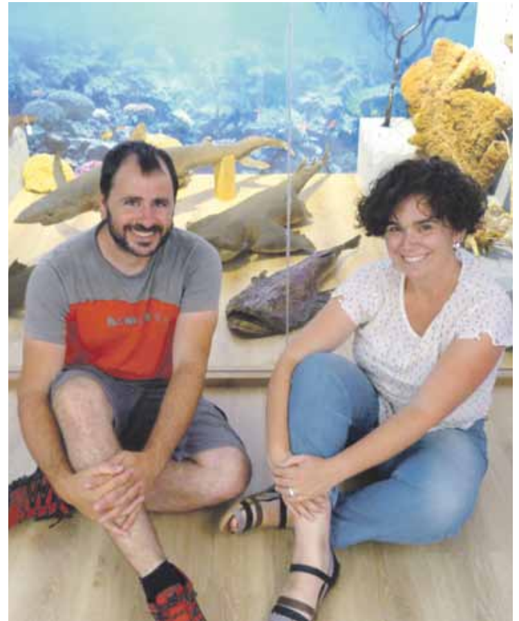
Notario eta Huerta, museoko areto berrian.

I.G.: Museoko areto bakoitzera sartzen direnean hartzen duten emozioa ikustea polita da. Bestalde, herriko parkea berri-