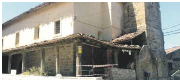
Arrazolako elizako ataria.

Atxondoko Udalak jakitera eman duenez, eraikina apezpikutzaren eskumenekoa da. Beraz, konponketa lanak egitea beraien esku dago.