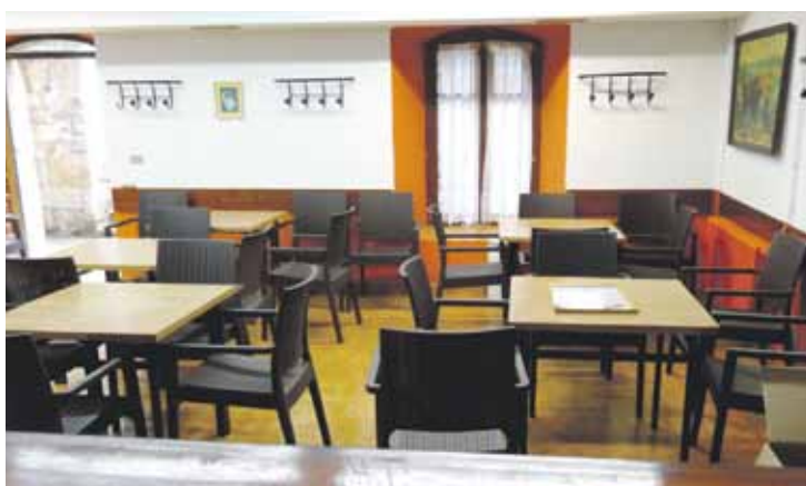
Aldatsekuan dago Jubilatuen Etxeko taberna.

Bestalde, EH Bilduk ohartarazi du udalak ez duela eskatu ikastetxe publikoetan obrak egiteko diru-laguntza. Beraz, Jaurlaritzak ipintzen duen %60 udalak ipiniko beharko du, obrarik egin behar bada.