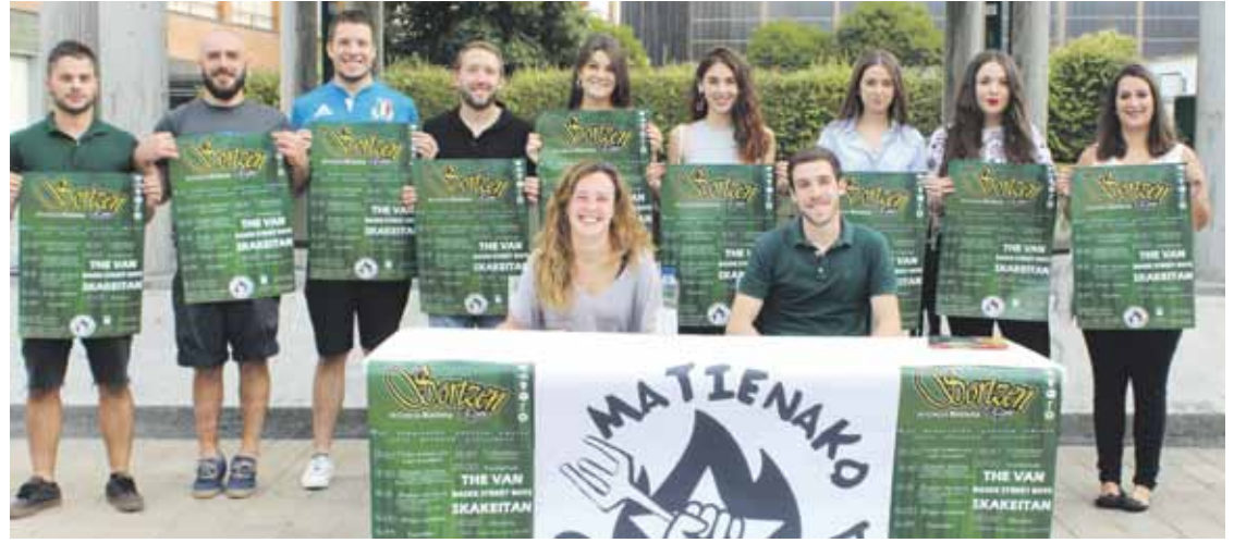
Joan zen barikuan prentsaurrekoan aurkeztu zuten irailaren 23rako prestatu duten egitaraua.

2010ean Traña-Matienako jubilatuen egoitza berria zabaldu zutenetik, eskolako zuzendaritzak eta tabernako esleipendunak elkarren artean sinatutako hitzarmen baten bidez kudeatu izan da lokala.