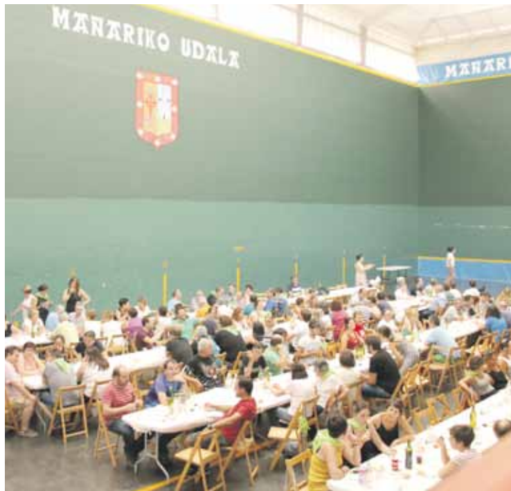
Gastronomiak ere lekua edukiko du, pintxo txapelketagaz.

gu; mendien eta saien kabien inguruko azalpenak ematen ditugu, besteak beste.