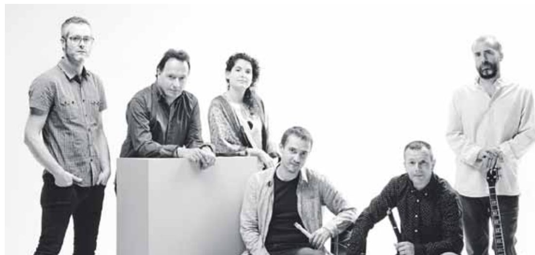
Euskal Herriko jazz musikariek osaturiko Khami taldeak itxiko du uztailearen 30ean jaialdia.

Zeuk erabaki oporrak zerekin bete. Bueltan kontatuko dizkiogu elkarri gozatutakoak: aurki ezazu irakur nazazu diotsun hori, eta Fibonacci ren sekuentzia eder batean bezala batu eta gehitu plazerak!