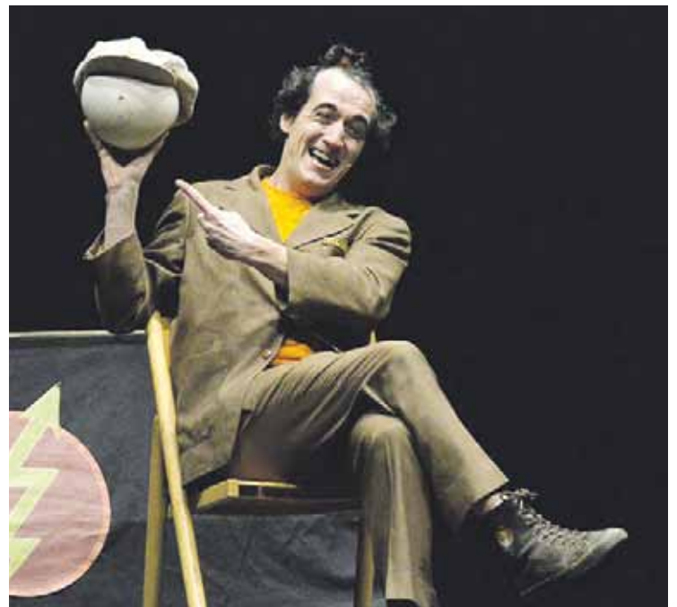
2008an estreinatu zuten 'Filamento farolaria' antzezlanak.

Urterokoak eta garaitar eta bisitarien harrera ona duten beste hainbat ekitaldi ere ez di- ra faltako aurtengo jaietan: asto probak eta karta joko txapelke- tak, kasurako.