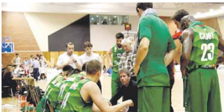
Zornotzak Urrezko Ligarako igoera fasea jokatuko du aurten.

Saskibaloia taldeak helegitea jarri dio erabakiari