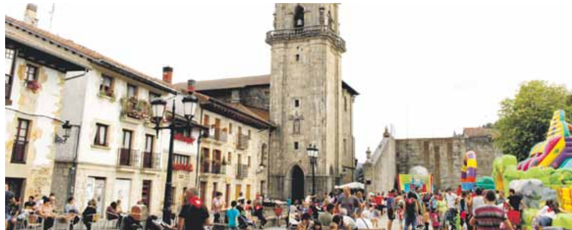
Lehenengo fasean atartea berriztu gura dute, barrualdeko polikromiak aurreragorako utziz.

Interneten diru ekarpenak jasotzeko atari bat ireki dute egunotan