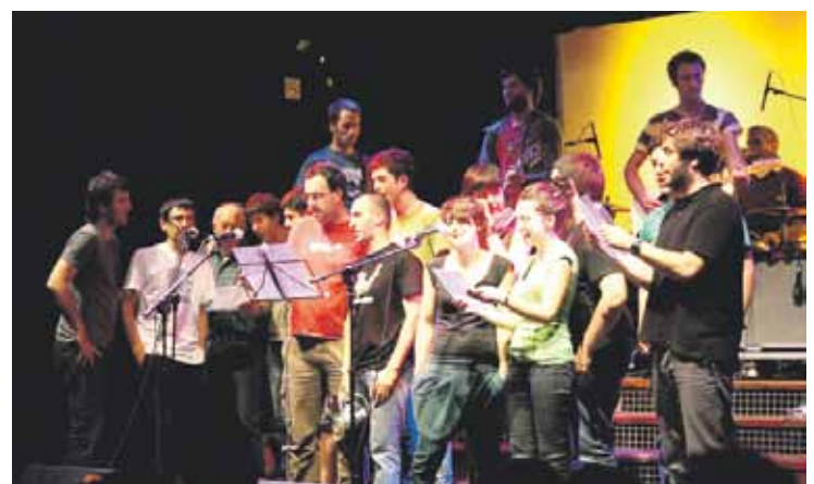
Hamabi bertsolarik hartuko dute parte biharko koplak txapelketan.