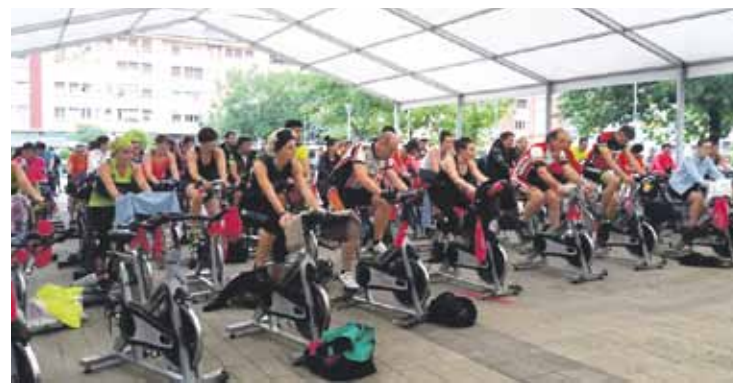
Jendeak "itzelezko erantzuna" eman zuela diote antolatzaileek.