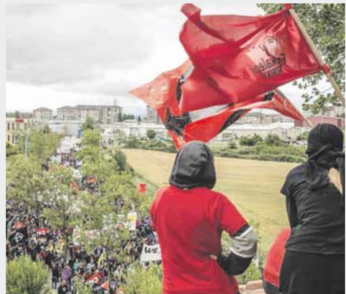
Milaka lagun batu ziren zapatuan Errekaleorren alde.