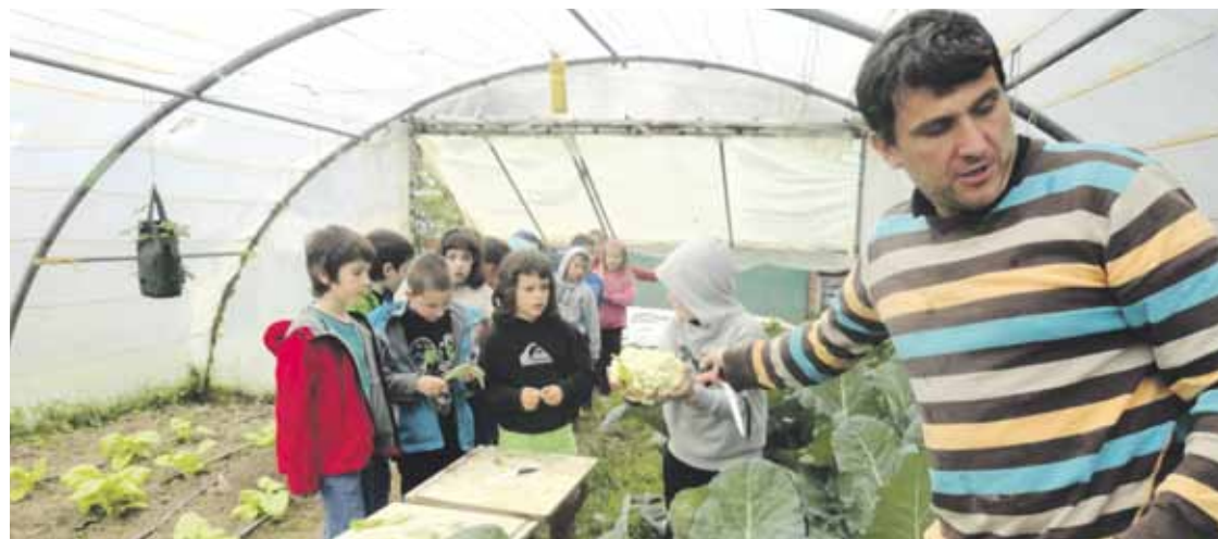
Ikasleak Larrabetzuko negutegian, esperimentatzen.