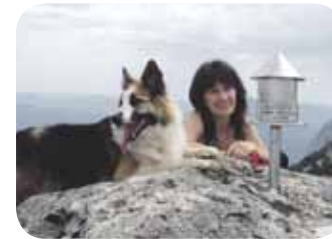
> Etxe azpian kafetegia daukazu, beraz, ez zaitez igo hainbeste kafea hartzera. Zorionak familia guztiaren partez.