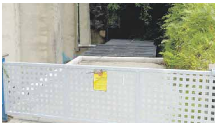
Berokuntza sistema plazaren beste aldeko geletara zabaltzeko aukera dago.

Termostatoa jartzea baino ez da falta urrian hasitako lanak amaitzeko