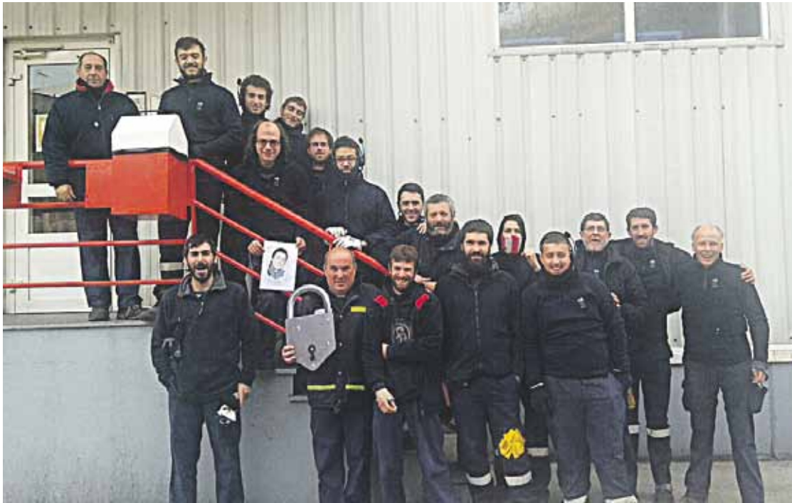
Zornotzako Bertako Logistika enpresan dinamikagaz bat egin duten beharginetako batzuk, talde argazkian.

Ekainaren 17an manifestazioa egingo dute Gasteizen, 'Ireki' izeneko kanpainari amaiera emateko