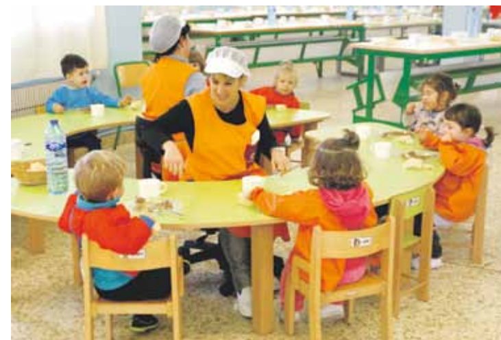
Markinako Bekobenta eskolako jantokia.