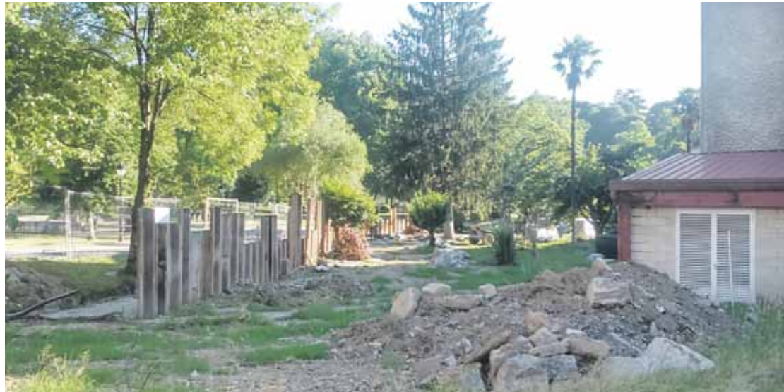
Altxatu duten altzairuzko hesiari azken ukituak eman eta berdegune zati bat uztailean zabaltzea gura du udal gobernuak.

Obraren lehenengo fasea herriko jaietarako amaitzea espero du udalak