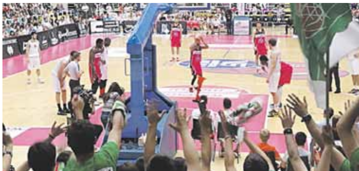
Valladoliden kontrako partiduan zaleak Ametx Zornotza animatzen.