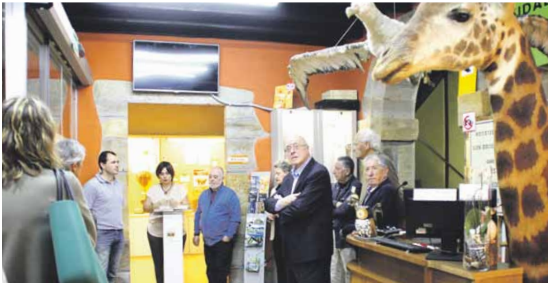
Hainbat herritako alkateak batu zituen ekitaldiak, beste ordezkari batzuen artean.