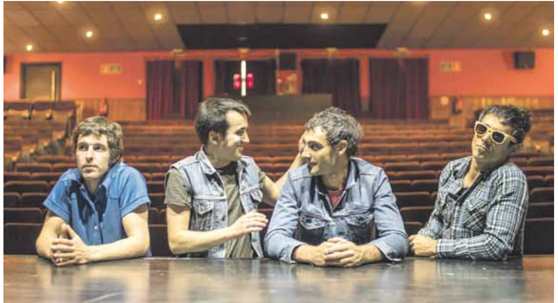
Laukote moduan dihardu, azken urteetan, Sermond's Elorrioko taldeak.

Hasiak dira Elorriokoaren ostean etorriko diren diskoaren aurkezpenerako hitzorduekin agenda betetzen. Musikazaleek kanta berriei harrera beroa egitea espero dute, eta zuzenean