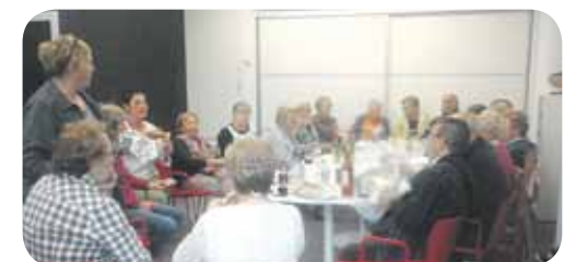
> Eubako jubilatuek eta laguntzaileak beti umore onez. Mosu handi bana