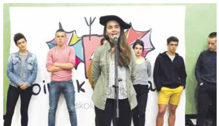
Iruri Altzerrekak jantzi zuen Bizkaiko eskolarteko txapela, Markinan.