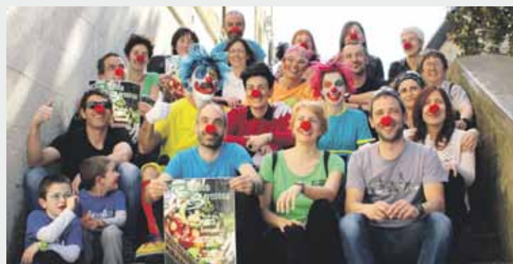
Bederatzi guraso elkartek osatzen dute Bertoneko dinamika.

Pirritx, Porrotx eta Marimotots pailazoak, artzain-txakurren erakustaldia, puzgarriak, herri bazkaria... Egitarau oparoa antolatu dute Bertoneko dinamikako kideek biharko, Abadiñon. Nabarmenezkoa da, euren filosofiari jarraituta, bertako ekoizleen azoka egongo dela.