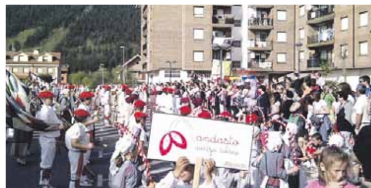
Egurdian egingo dute dantzariak alardea.

Goizean egingo dute alardea dantzariak, frontoian