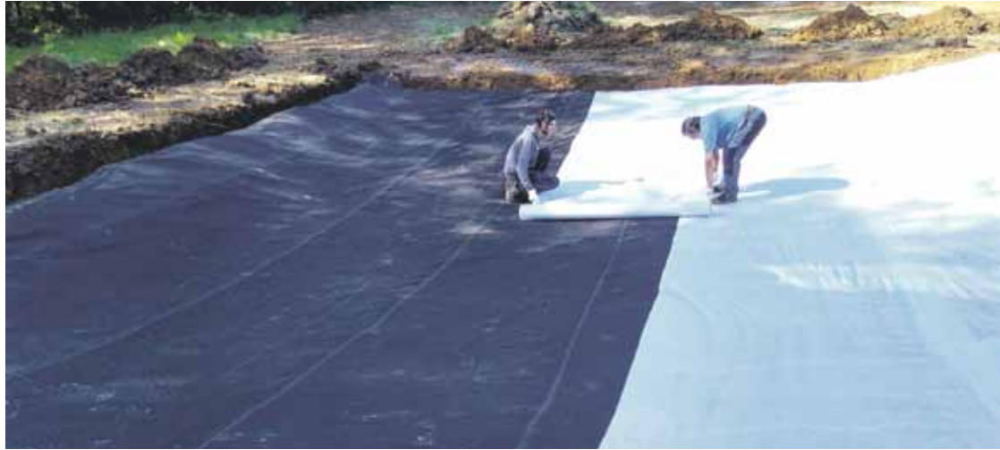
Mekoletan egin duten urmael bat; guztira, hiru daude, eta handienak 120 metro karratu ditu.

Ezaugarri desberdinetakoak egin dituzte, ahalik eta espezie gehien hartzeko