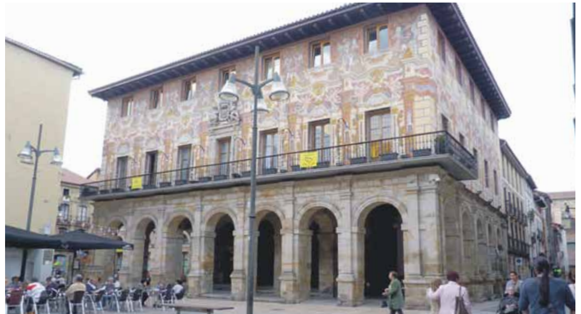
Herritarren iritzia ezagutzen jarraituko dutela azaldu du Irigoras alkateak.

Hauteskundeak orain eginez gero, emaitzak “orain bi urteko berdinak” izango liriteke. Irigo-