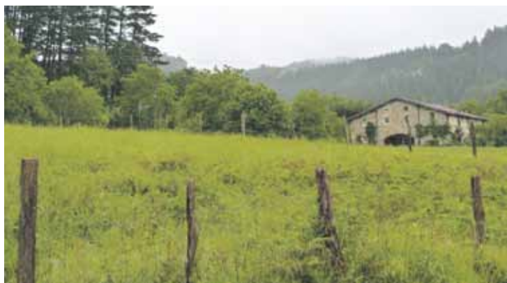
Kontsumo txikiko farolak ipiniko dituzte baserri inguruetan.

EH Bilduk emakume langileak eta tokiko komertzioak ere omendu gura ditu ekimenagaz. Martxantera familiekin berba egin du moziarako, eta oroigarria ipintzeko ere hala egitea eskatuko du.