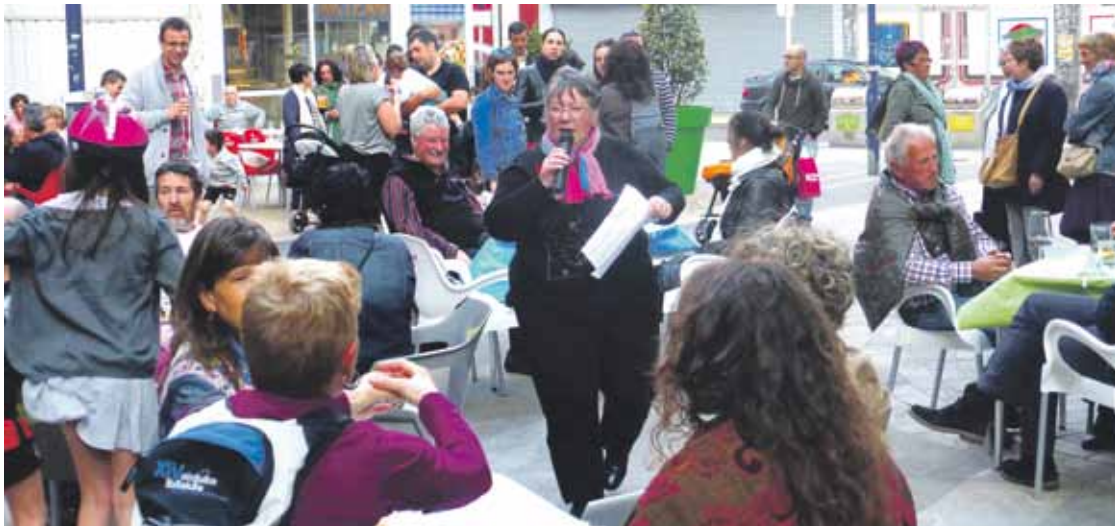
Iazko Mintzopotean euskaragaz duten harremanaren inguruan egin zuten gogoeta ekimeneko parte-hartzaileak. Elhuyar.