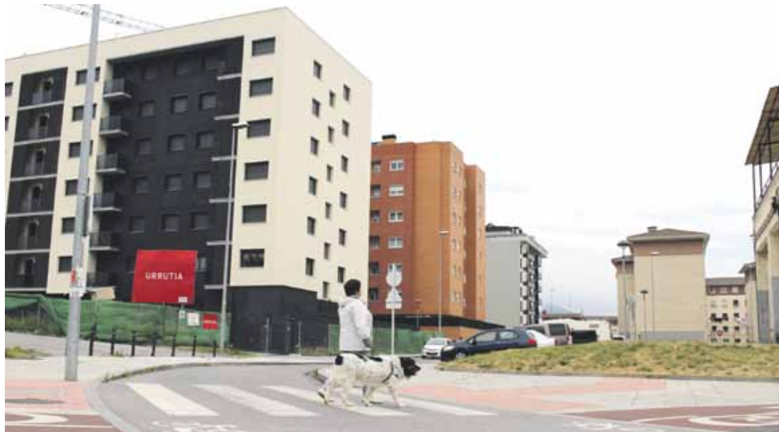
Etxe eta urbanizazio berriekin, itxura berria du San Faustok.

Faustegoienako babeseko 48 etxeetatik 7 gazte alokairurako izango dira