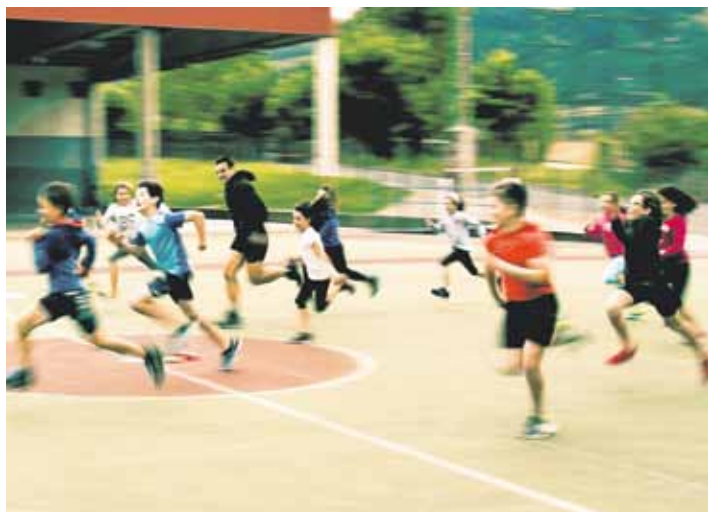
Maiztegi Herri Eskolako gazteak.

6-7 urtekoen fitxaketak egiten dabilta. Bakoitzak bere ikus-pegia eta bere lana dauka, baina eskola kirola da, ala en-presa funtzionamendua? Hori ezin da eskola kirol lez sal-du. Beste gauza bat da klubek gugaz harremana edukitzea, ikasleek etorkizunean ere kirola egiteko aukera izan dezaten.