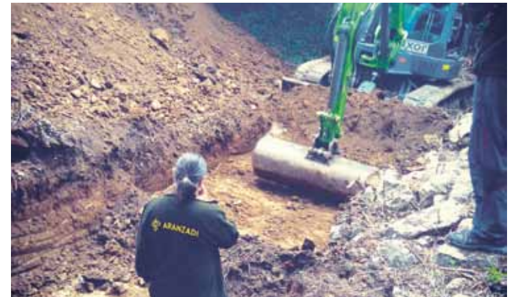
Aranzadiko kideak lanean.