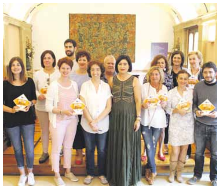
Agiriak banatzeko ekitaldia, martitzenean, udaletxean.

Hamaika dendatako arduradunek programa batean parte hartu dute