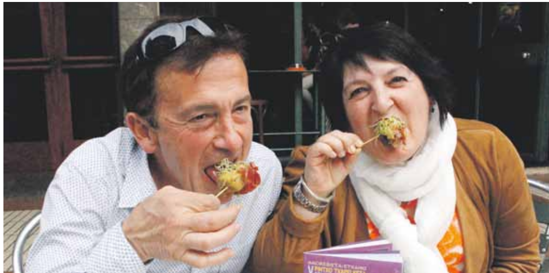
Domeka eguerdira arte egongo da pintxoak dastatzeko aukera; iluntzean sari banaketa egingo dute.

Herritarrek emandako botoekin aukeratuko dute irabazleetako bat