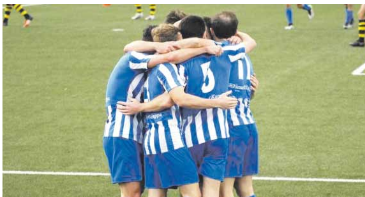
Sodupen 0-2 irabazi zuten joan zen asteburuan. www.culturaldurango.org