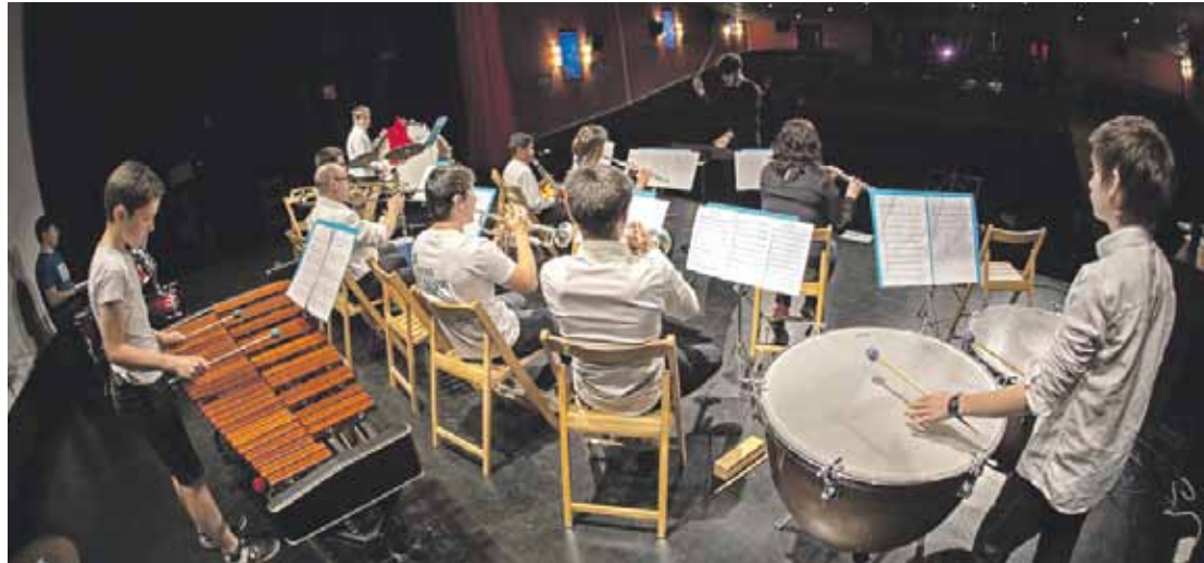
Marrazki bizidunetako, telesailtako eta filmetako soinu bandak joko dituzte bost urtetik aurrerako musikariek.

Elorrioko musika eskolako 150 ikasle Arriola antzokian arituko dira, bihar