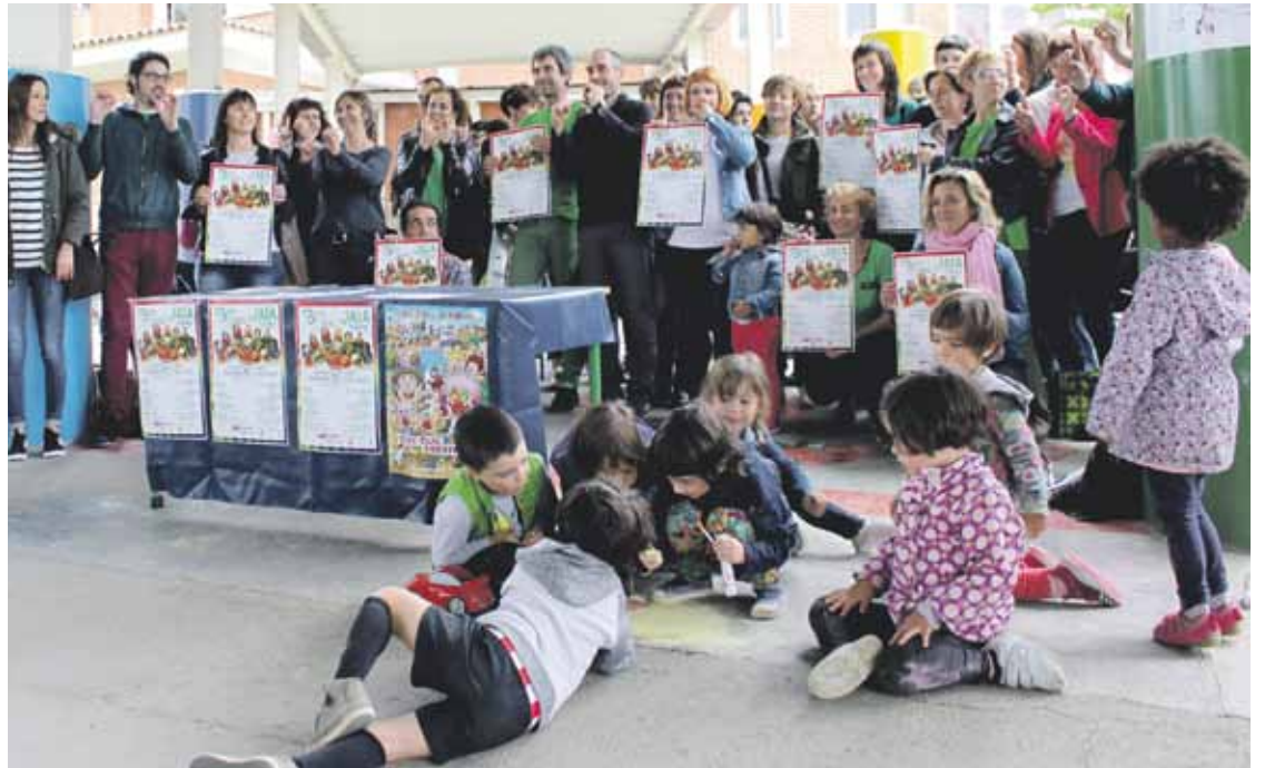
Sindikatueta ordezkariekin eta ikastetxeetako zuzendareekin egin zuten agerraldia, Abadiñon.

Kontua da Eusko Legebiltzarrrak 2000. urtean onartutako legeak ezartzen duela zelan gestonatu behar den jantokietako zerbitzua. Catering enpresen esku dago, eta ikastetxeek ez dute eskumenik erabakiak hartzeko. Zerbait desberdina egin gura izanez gero, laguntza publikoa galduko lukete zentroek. Duela 17 urtera arte ikastetxe bakoitzak zeukan bere jantokiaren ardura, eta Bertón Bertokoako kideek horixe gura dute, eurek