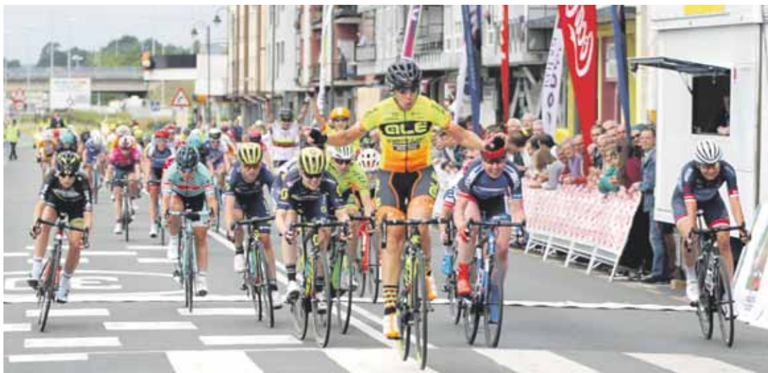
Iurretan hasi eta amaitu zen Emakumeen Birako lehen etapako irudia. M.Zuazubiskar