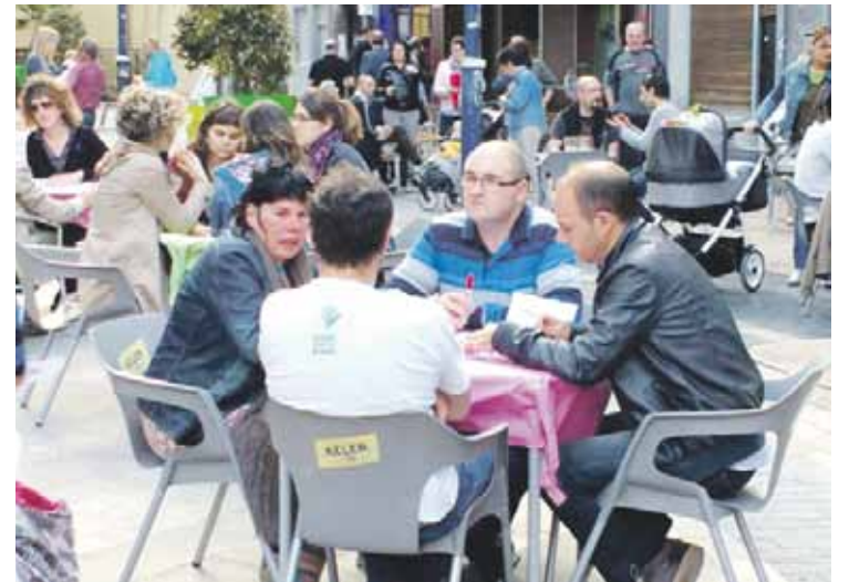
Euskara herriko kaleetara ateratzeko helburuagaz 30 bat herritar batu ziren iaz.