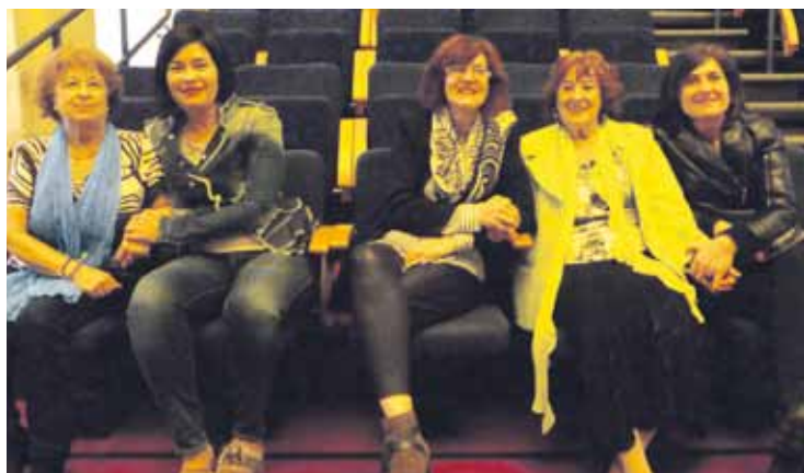
Atzo aurkeztu zuten adinekoek antzezturiko jaialdia.

Doakoa da emanaldi guztietarako sarrera, baina Gora Ta Gora antzerki taldeko durangarren emanaldirako gonbidapenak aurrez eskuratu beharra dago. Durangoko Museoko leihatilan egin daitezke emanaldi horretarako erreserbak.