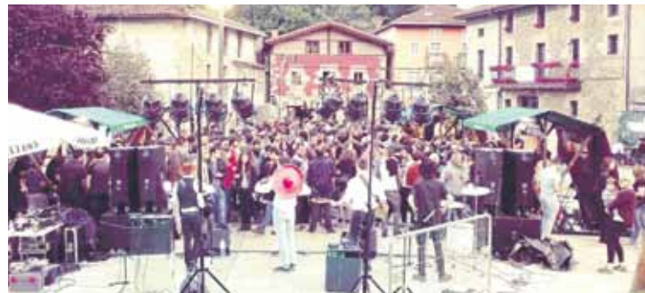
Joan zen asteburuan artisau-garagardoen azoka egin zuten Mañarian.