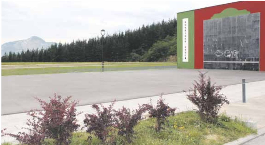
Berrizburun egingo dute jolasgunea.

Herritarrek tirolinak, sareak... izango dituen jolasgunea gura dute