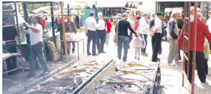
Eguerdian antxumeak erre eta pintxotan salduko dituzte.