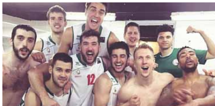
Ametx Zornotzako jokalariek Granadako garaipena ospatzen aldagelan.

Zornotzaren azken urteetako ibilbidea azpimarratzeko da. Zilarrezko Mailan jokatzeko ari diren lau urte hauetan hiru play off jokatu dituzte.