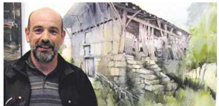
Kultur Etxean dago lehiaketara aurkezturiko lanen erakusketa.