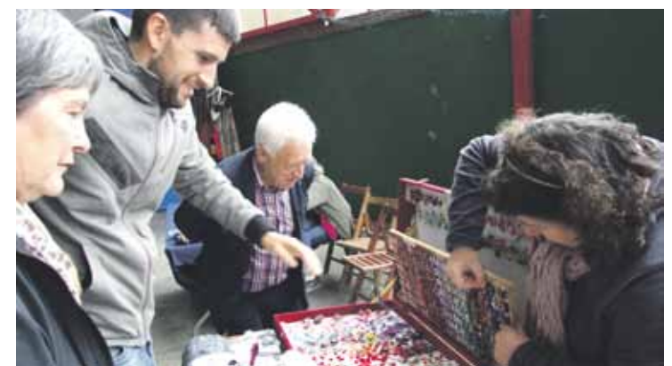
Aurretik ere egin izan dute bigarren eskuko azoka Izurtzan.

Arratsaldean antzerki saioa izango da elizan