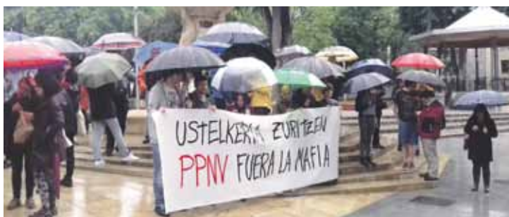
EH Bilduk, Herriaren Eskubideak eta Ernaik deitu zuten mobilizaziora.

PPgaz akordioak garatzea “mafia neoliberal eta ustelaren alde egitea da”, protestaren deitzaileen ustez. “Ustelkeriaren alderdia salbatzea” egotzi diete jeltzalei.