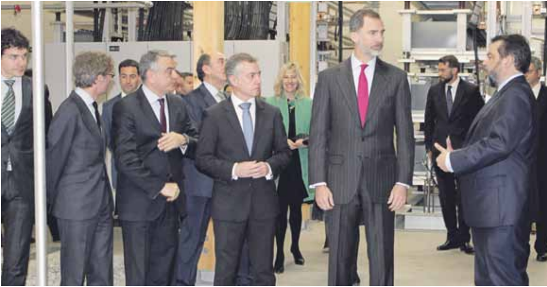
Felipe VI.a erregea eta Iñigo Urkullu lehendakaria Ormaetxeako azpiegiturak bisitatzen.