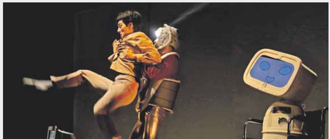
Proba modura, Elorrioko ikasle eta irakasle talde baten aurrean eskaini zuten ikuskizun berria.

Elorrioko Arriolako hitzordua ipinita dago: urriaren 22an arituko dira han