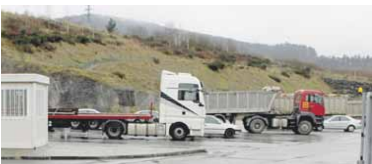
Arriaganeko industrialdean dago kamioien aparkalekua.