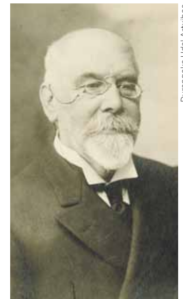
Ampuero alkate izan zen Durangoan.

Aparte, nekazarien elkarrekin ere bultzatu zituen, baita Nezazariyen cartilachua Bizcaico Eusqueran liburua argitaratu ere.