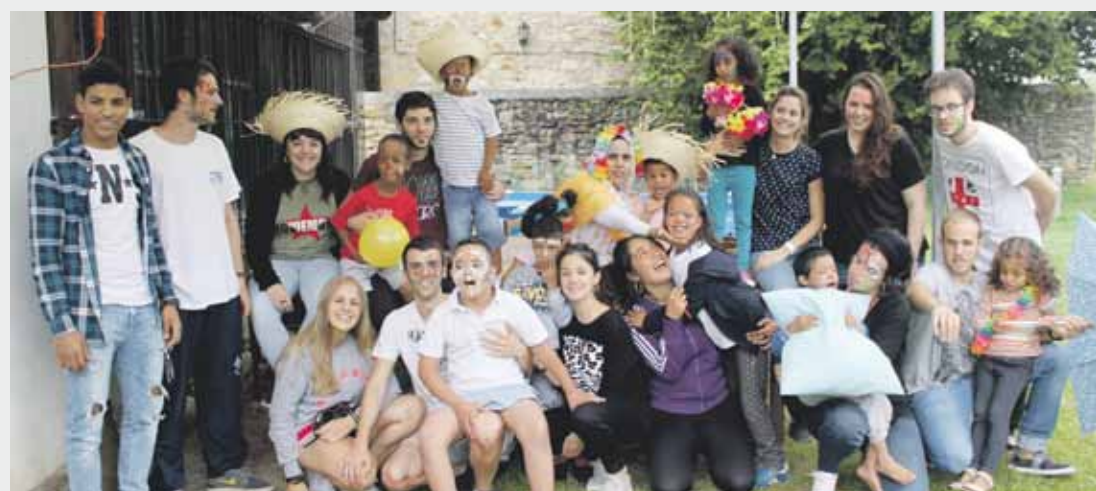
Aurten Rio de Orokoek hartu dute Oporrak Bakean programaren ardura, Lajwadegaz batera.

Oporrak Bakean programan parte hartzeko deia egin dute elkarteek