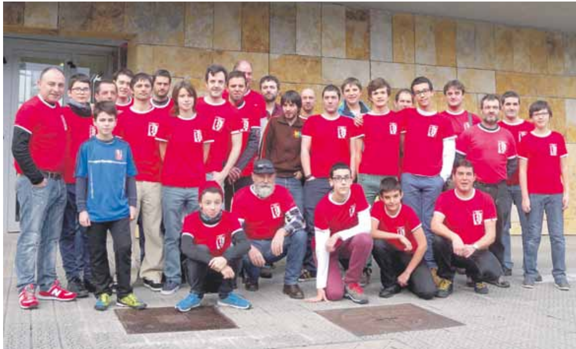
Abadiño xake taldeak Euskadiko Ohorezko Mailan jarraituko du, estatuko talderik indartsuenetako askogaz.

Abadiñok mailari eutsi dio eta Euskadiko onenekin jarraituko du