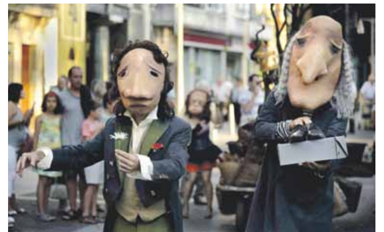
2015ean Leioako Umore Azokan sariu zuten ‘Andante’.