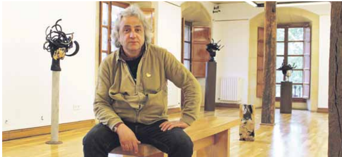
Azken hiru urteetan eskulturen arloan egin duen lana bildu du artista bilbotarrak ‘Marmoka’ erakusketan.

Artistak eskainitako bisita gidatuagaz inauguratu zuten, martxoaren 10ean, ‘Marmoka’ erakusketa; apirilaren 2ra arte egongo da Durangon