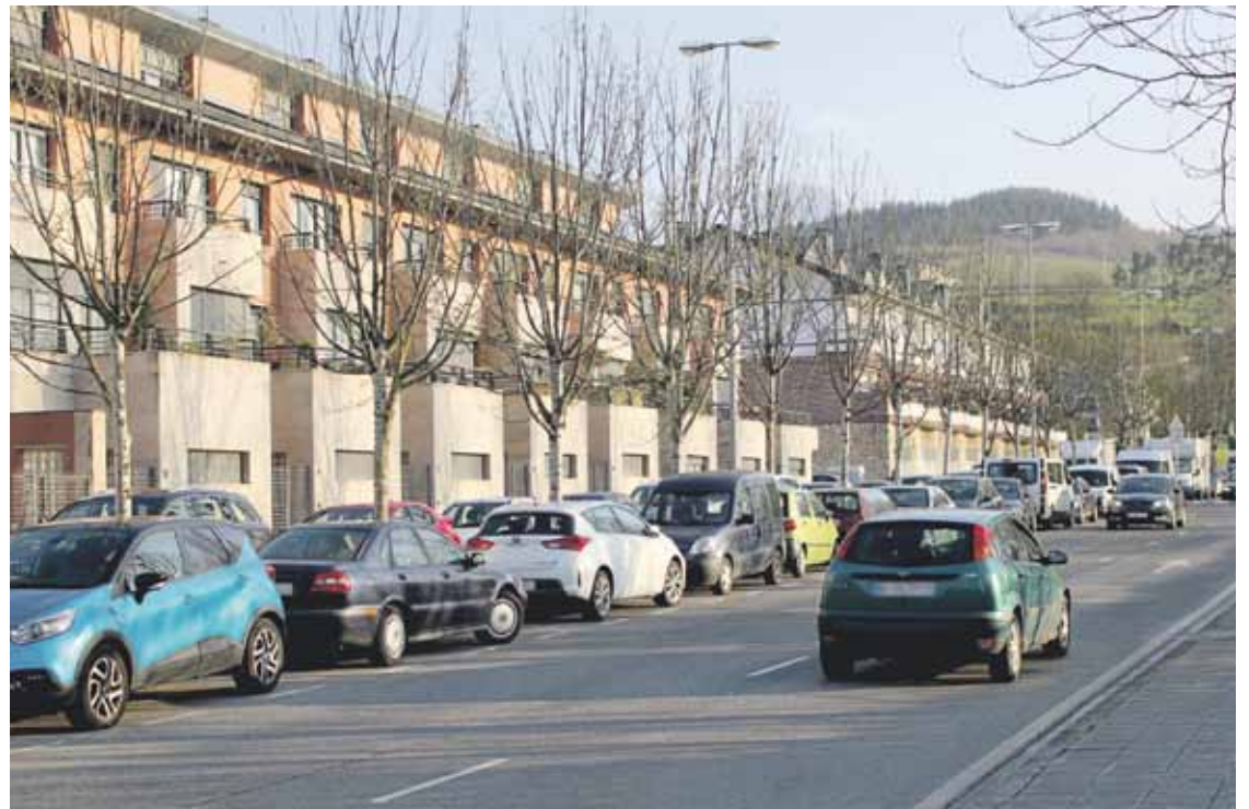
Tabira inguruko etxe ugari daude indizeak kaltetutakoaren artean.

Indizea, hirutan aldatuta Udalak hirutan eztabaidatu zuten indizearen inguruan. Ekai-