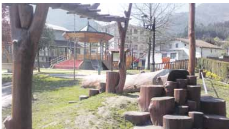
Umeekin egindako partaidetza prozesutik irten zen jolasgunearen ideia.

Gune berriko jolas asko egurrez egindakoak dira