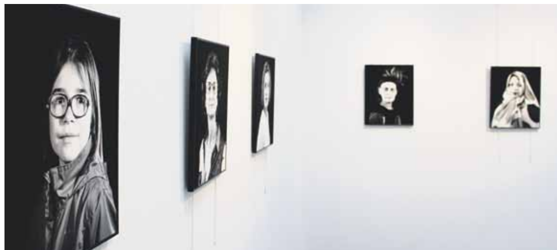
Herriko emakumeen aniztasuna islatzen duten 34 erretratuak osatzen dute ‘Ezberdinak’ erakusketa.

2014ko irailean Tárregako (Kataluniako) antzerki jaialdian aurkeztu zuen Markeliñe Andante obra, eta 2015ean Euskadiko kaleko ikuskizunik onenaren saria jaso zuen Leioako Umore Azokan. Berbarik barik, era poetikoan eta umoretik, gerrei eta memoriari buruz dihardu antzezlanak.