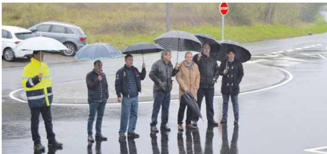
Astelehenean zabaldu zuten Santa Apolonia auzoa Orozketarako bideagaz lotzen duen errepidea.

Lanek sei aste iraun dute eta 161.469 euroko aurrekontua izan dute