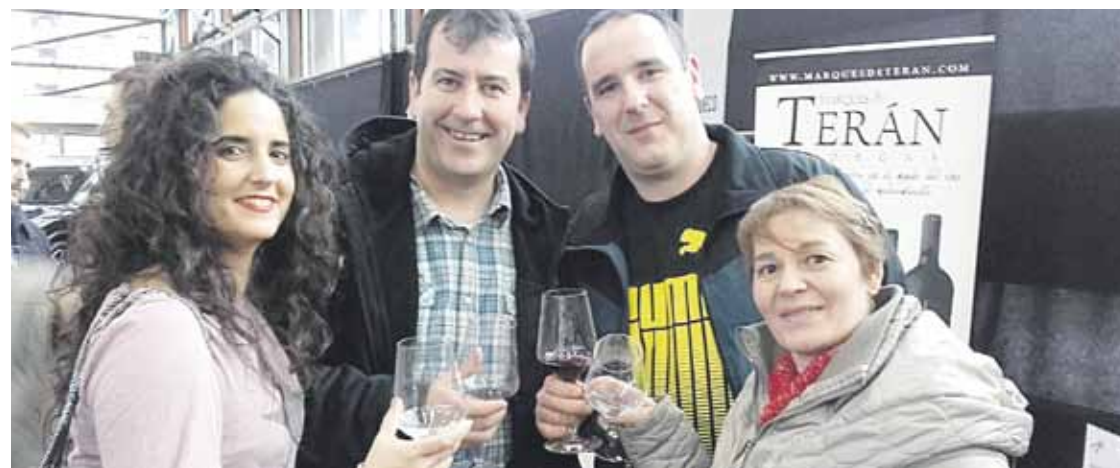
60 upategitako ardoa dastatu ahalko dute bisitariak Ardosaltsan azokan. Irudian, iazko bisitari batzuk.

nez dator. Orain arte, etxeei ezin zitzaion indize alturik ezarri, guztientzat berbera zen, baina Aldundiak hori aldatu du, eta udalei indizeak aldatzeko aukera eman die. Bizkaia osoan 13 herritan ipini dute indize altua. Baina, Berangon adibidez, 2 milioi eurotan dago indizearen langa, ez 180.000 eurotan. Gainera, Escotaren arabera, Espainiako legedian debekatuta dago indize desberdina ezartzea.