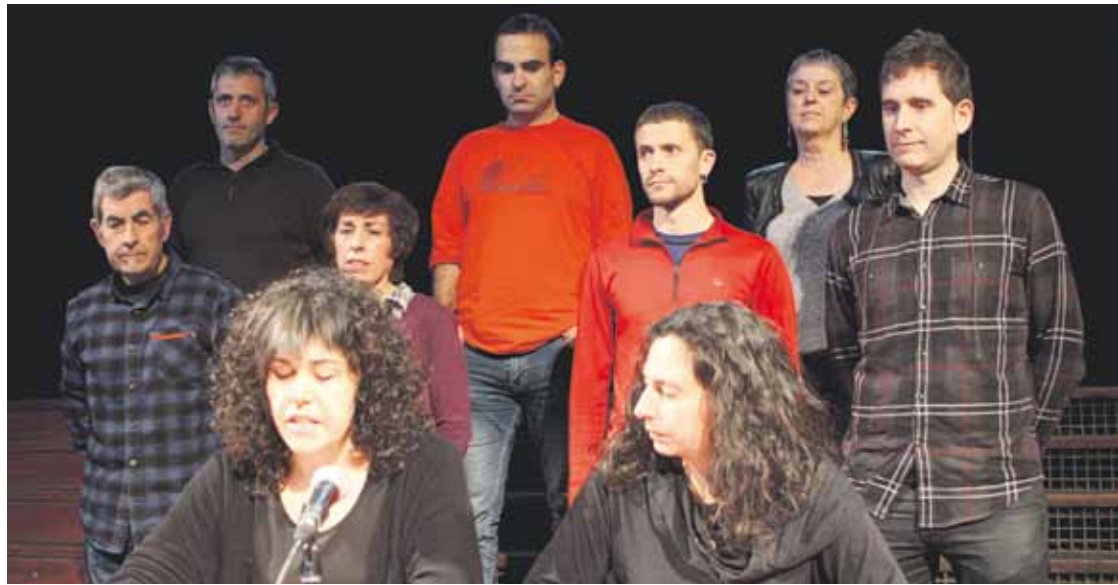
EHNE eta Eguzkikoak, Zaldibar, Garai, Igorre, Antzuola eta Elgetako alkateak, eta Berriz, Zornotza eta Iurretako zinegotziak.

Osasunerako eta ingurumenerako kaltegarria dela uste dute aurkariek