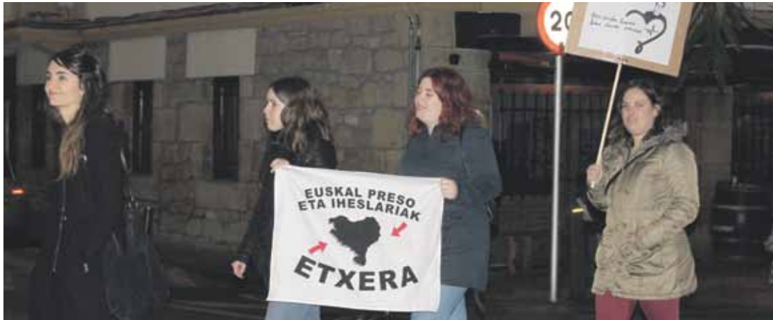
Fraileren alde giza-sarea burutu zuten abenduan, Abadiñon.

Hurrengo pausoa Estrasburgo da. “Ezin dugu 5 urtez itxaron” diote senideek