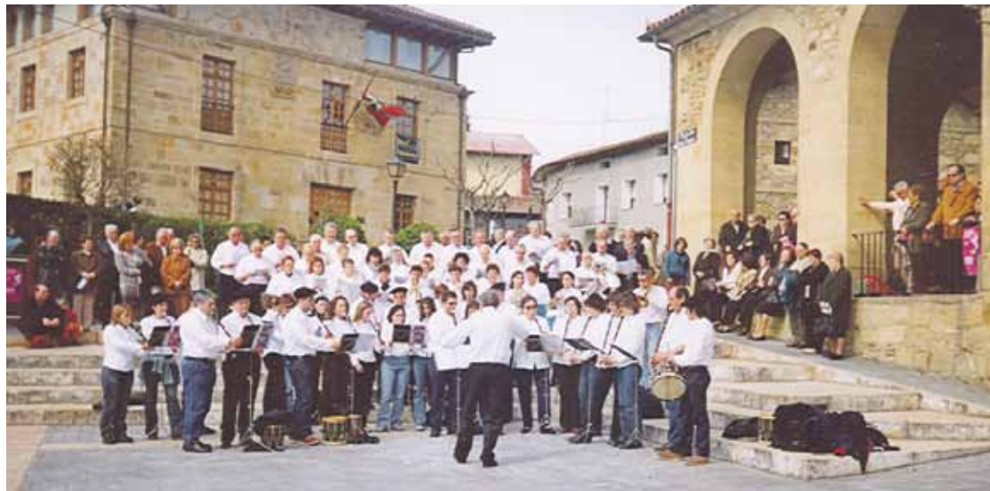
Hirugarren aldia da Durangaldeko txistulari eguna Iurretan ospatzen dutena. Irudian, 2003koa.

Kontzertu horren ostean, Erregelak eskainiko dituzte Iurretako dantzariak, plazan.