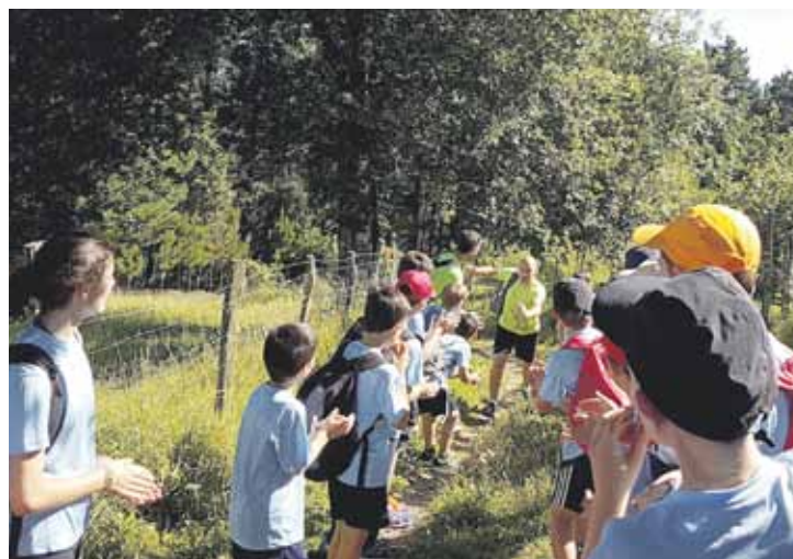
Mendi irteerak dira udalekuetako eskaintza bat.

Udalekuak antolatzeko, Durangoko eta Abadiñoko udalen eta Amankomunazgoaren laguntza jaso dute.