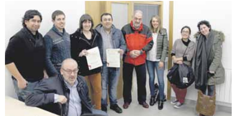
Uztaile arte, Bizkaiko Gurutze Gorriak Elorrion izango du lokala.

Etorrin zein errefuxiatuentzako programari dagokionez, hizkuntza bikoteen bitartez hizkuntza boluntariotza programa bultzatzea dute helburu. Gaineratu dutenez, “aisialdiko ekin-tzekin eta hitzaldiekin kultur aniztasuna sustatu eta harrera erraztea da helburua”. Horrez gain, Gurutze Gorriko lokalean aholkularitza juridikoa ere eskainiko diete premia hori duten herritarrei.