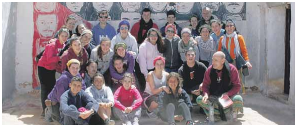
Elorriotik hainbatetan joan dira errefuxiatuen kanpementuetara.