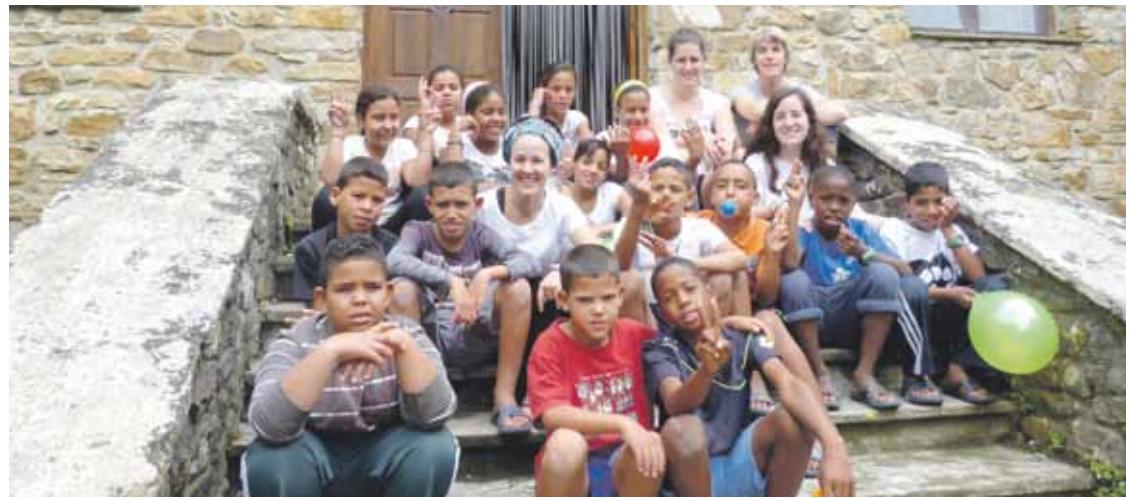
Atxondon dute aterpetxea Hamadako Izarrak elkarteok.

Errefuxiatuen desertua elkartasunez ureztatzen jarraituko dute Durangaldean.