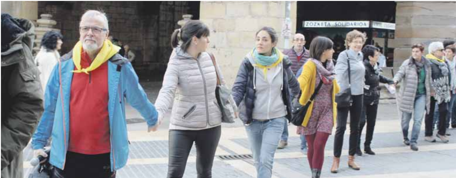
Herritarren babes berezitasunak errefuxiatuek elkarretaratzeetan.