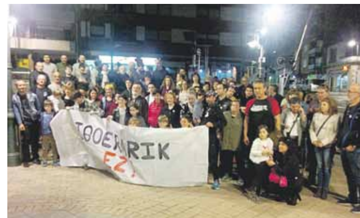
Berrizen, joan zen barikuan lez, gaur ere aterako dira kalera.

Protestak egin dituzte Berrizen eta Zaldibarren