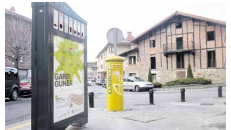
Mainerrotan buzoia-aren ondoan dago Garbigune txiki berria.

Bestalde, beste datu bat ere jakitera eman dute. Gaur egun 170 familiak —otxandiarren herenak gutxi gorabehera— auzokopostean parte hartzen dute edo norik bere konposta egiten du etxean. Datu horregaz eta Aldundiak emandakoeekin (pertsonako hondakin organiko kopurua egunean...) kalkulatu dutenez, 2017an 49.900 kilo zabor gutxiago bidaliko dute zaborte-gira. 2016ko lehen esperientzian 30 familia hasi ziren auzokoposta egiten, eta 8.800 kilo zabor aurreztu zituzten. Aurten iaz baino 41.1000 kilo gehiago aurreztea itxaroten dute.