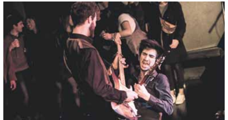
Berriz, Elorrio eta Durangoko gazteek osatzen dute The Van. Sara Estebez

Joan zen zapatuan jokatu zuten Zornotzako maketa lehiaketako finala, Zornotzako Zelaieta zentroan, eta 1.500 euroko sari nagusia jaso zuen The Van-ez gain, beste bi talde ere saritu zituzten: Suaren lurraldea kantagatik Incrused taldeari eman zioten euskarazko abestirik onenaren saria, eta 71 talde madrildarrak irabazi zuen Zornotzako jaietan jotzeko aukera dakarren hirugarren saria.