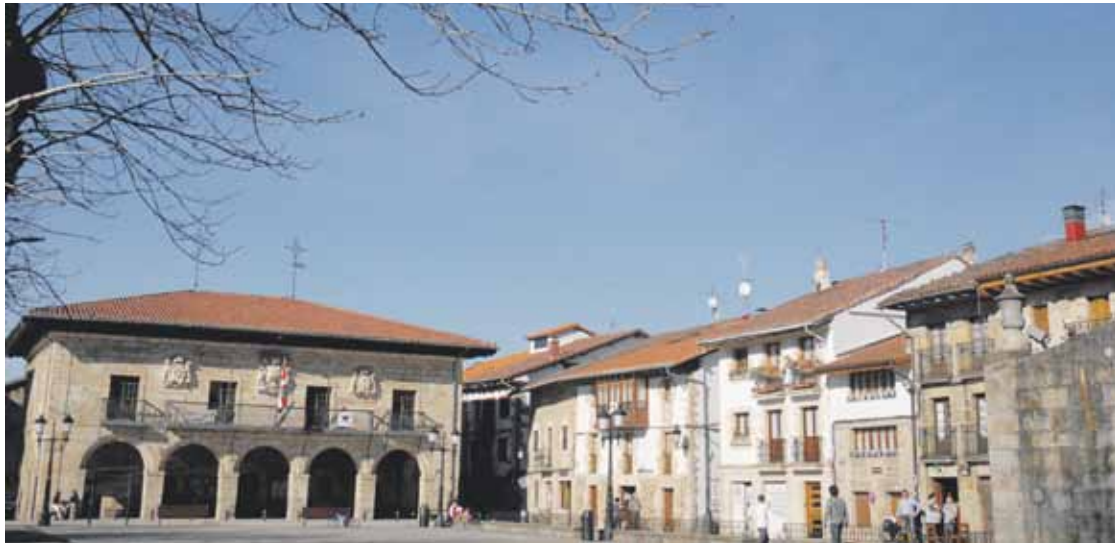
Aho batez hartu zuten erabakia azken udalbatzarrean.