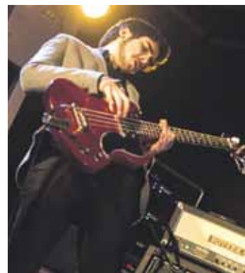
60ko eta 70eko hamarkadetako musika dute gustuko The Van taldekoek. S.E.