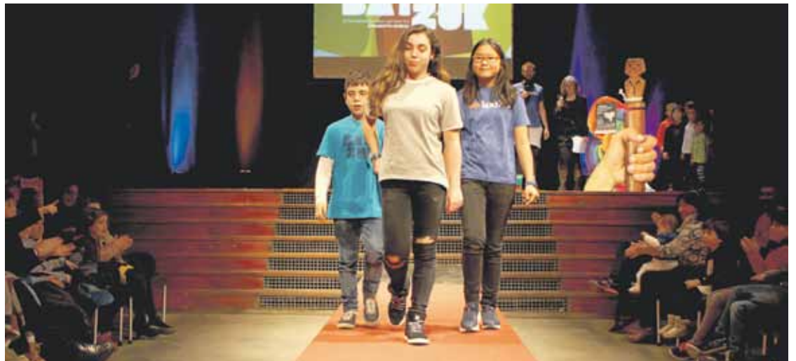
Ume zein heldu, giro alaian ibili ziren Platerueneko pasarelan.