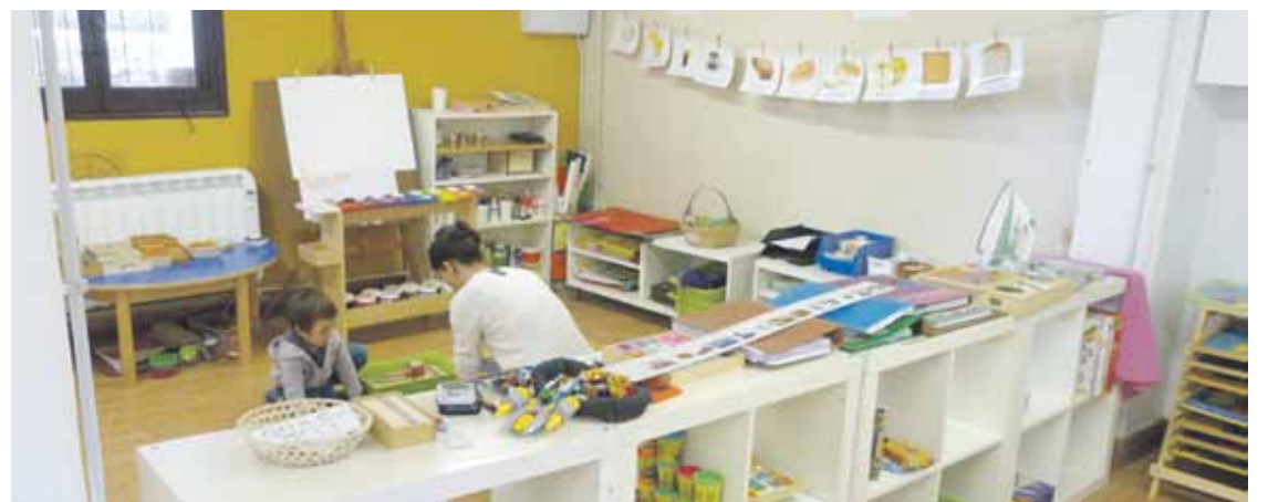
San Migel eliza osteko etxean dago Umerri hezkuntza proiektua.

batera, Gamiz-Fika, Peruri eta Iurretako taldeek jardungo dute harriari tiraka. Azkenik, domekan, Aldapez gainera, Etxebarria eta Gamiz-Fikako talde banak parte hartuko dute. Irabazleak 410 euro irabaziko ditu, eta bigarrenak 350 euro. Aurreneko hamar sailkatuentzat sariak egongo dira.