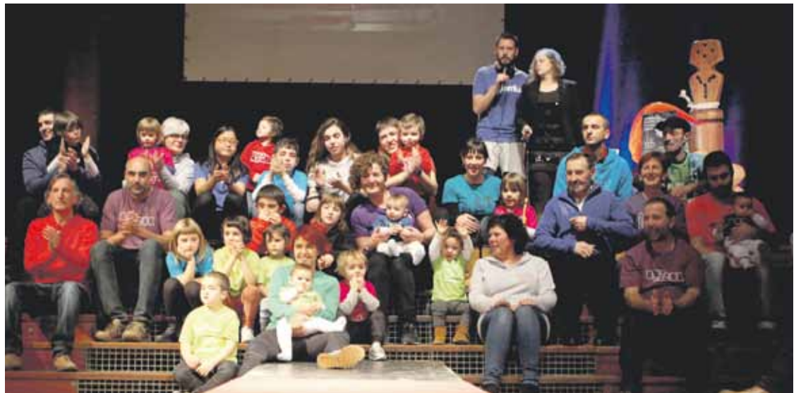
Hainbat euskaltzalek parte hartu zuten desfilean.

Otxandioko kasua kenduta, Durangaldetik apirilaren 7an pasatuko da Korrika; Zornotzan 17:00 inguruan sartuko da, eta 22:00etan Mallabitik irtengo da. Korrikak beste hainbat ekitaldi ere ekartzen ditu beragaz; esaterako, afari herrikoia egingo da Durangoko Plateruenean.