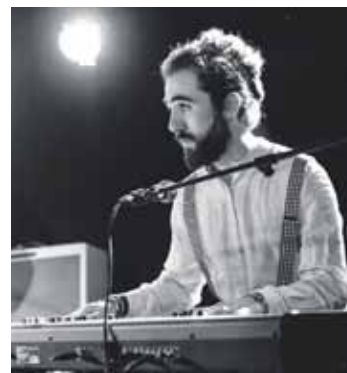
Aurretik, Monkday izenagaz, bertsioak jotzen zituzten batez ere. S.E.