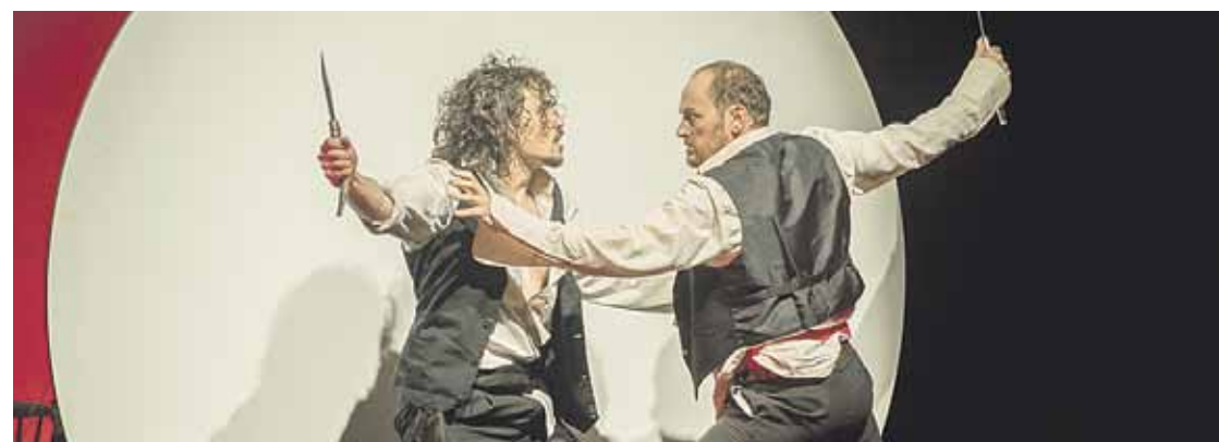
Familien arteko liskarrak, boterea eta sinesmena jorratzen ditu, besteak beste, antzeztan.

San Agustinen antzeztuko dute Federico García Lorcaren ‘Bodas de sangre’