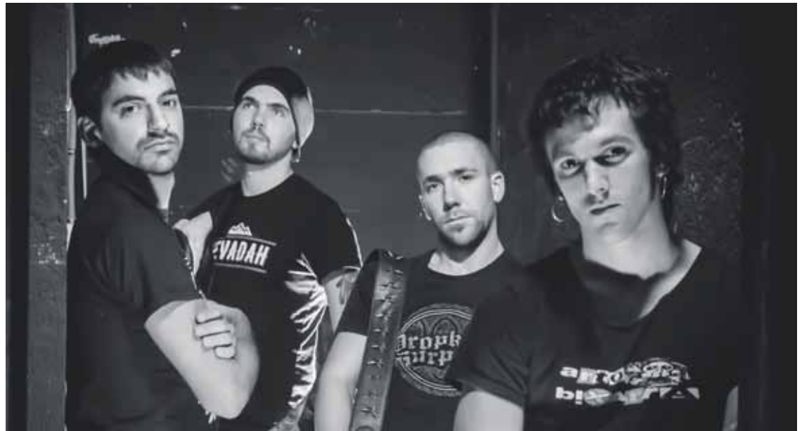
Lehenengo kontzertua eskainiko du Abadiñoko laukoteak, Durangoko musika jaialdian.

Jendeak taldeari hasiera-hasieratik egindako harreragaz eta finantziario kolektiborako deiak jaso zuen erantzunagaz oso pozik daude taldeko lau musikariak. “Izugarria izan da