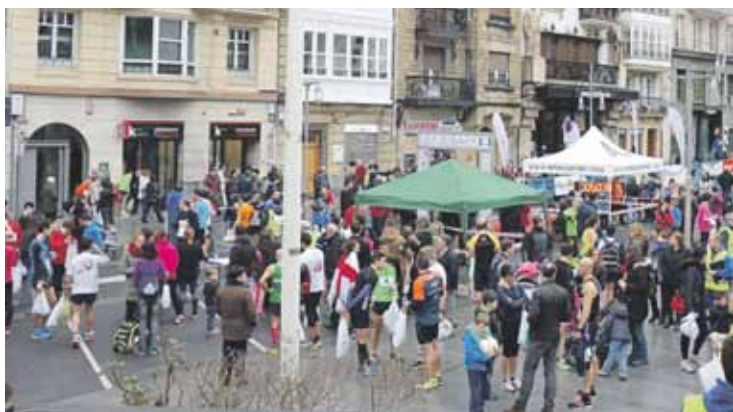
Iaz 400 bat parte-hartzaile batu zituen ekimenak.

10 eta 5 kilometroko ibilbide bana daude aukeran