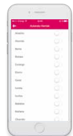
Herriko informazioa jaso