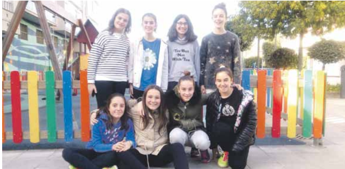
Sinadurak batzen ibili diren gazteak.

12-13 urteko gazteen talde batek abiatu du Gaztelekuaren aldeko sinadura bilketa