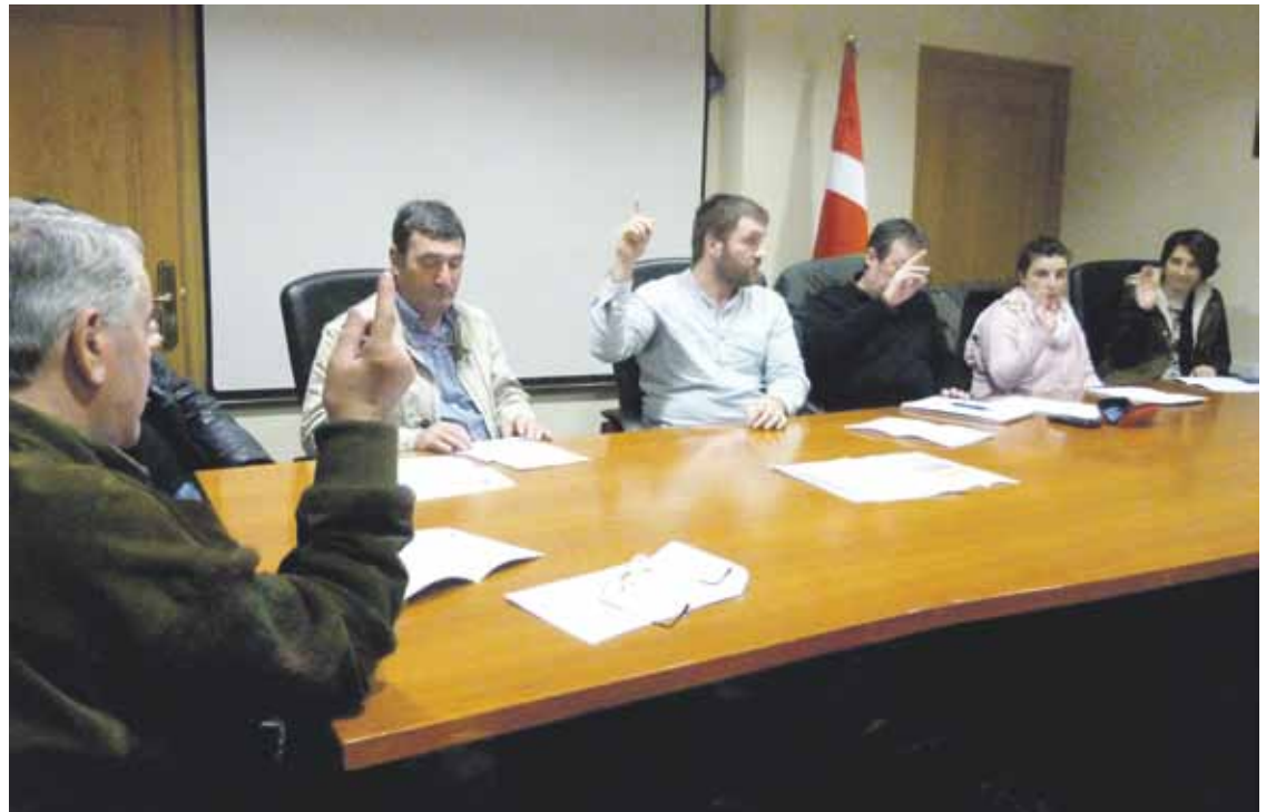
Eguaztenean egin zuten 2017ko aurrekontua onartzeko osoko bilkura.

Inbertsio ahalmena, gora Gazteei begirakoak ez dira, hala