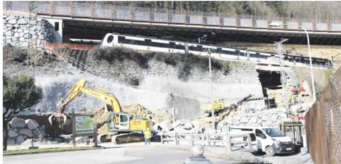
Kilometro eta erdiko tunela zulatzen hasi orduko, eremua prestatzen dihardu ETSk.

Azken urteetan saihebidetako obraren eraginez jasan behar izan dutenaren ostean, beste hiru urtez horrelako obra baten albo kalteak jasatea ezinezkoa dutela adierazi diote Eitzagako