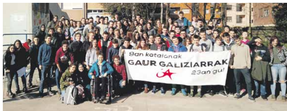
Hilaren 23rako deialdia egin zuten ikasleek.

Horregatik, atzoko ekintza galiziarrei elkartasuna erakusteko erabili zuen IAK, eta 9an ere katalanen aldeko informazioa zabaldu zuen.