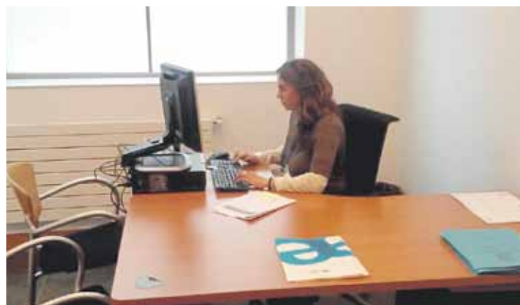
Enplegu bulegoa iaz ireki zuten San Migel kaleko 3. zenbakian.