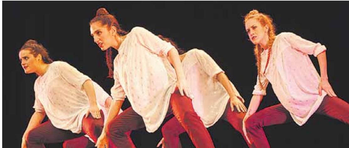
Dantza modalitateotako Euskal Herriko talde erreferenteak arituko dira, aurten ere, Arriolan.

40 taldek parte hartuko dute bihar 16:30ean hasiko den Akadantz lehiaketan