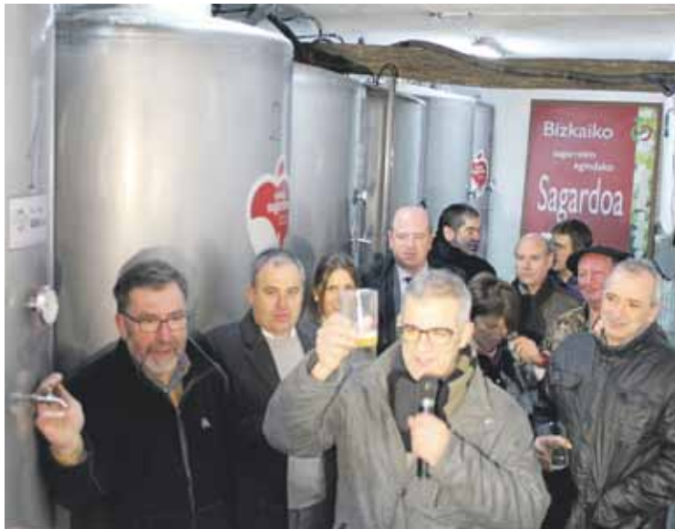
Aizpuru, sagardoagaz topa egiten.