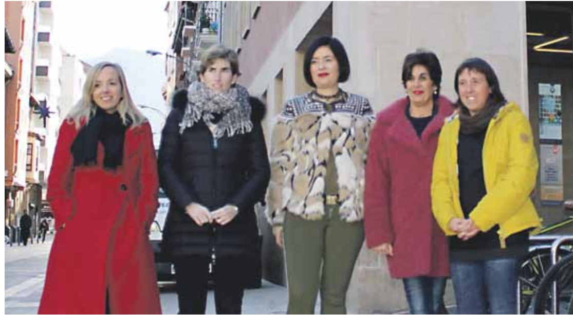
Udaleko kultura eta immigrazio sailek eta liburutegiak antolatu dute lehiaketa, elkarlanean.

12 eta 20 urte arteko gazteei zuzendurikoa da Durangoko Udalaren deialdia