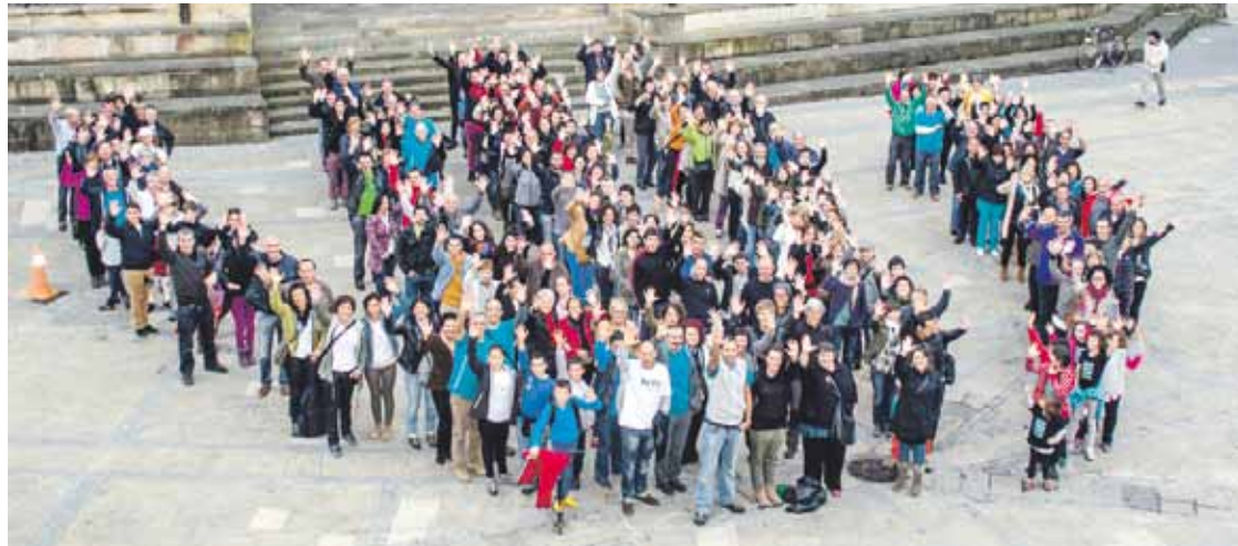
Gure Esku Dagok deituta, giza katea burutu zen Durangotik Iruñera, 2014an.

Biharko ekitaldia sinadurak batzen hasteko lehen mugarrria izango da