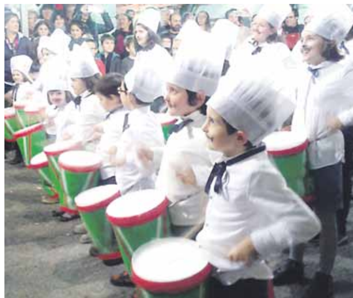
Danborrada ere egingo dute Bakixa auzoan, zapatu gaurdian.

Etzi goizean, Iurretako abesbatzak mezan abestu, eta Mikel Deuna taldeko dantzariak saioa egingo dute. Arratsaldean, briska txapelketa, Maiztegiko dantzariak eta jolasak egongo dira.