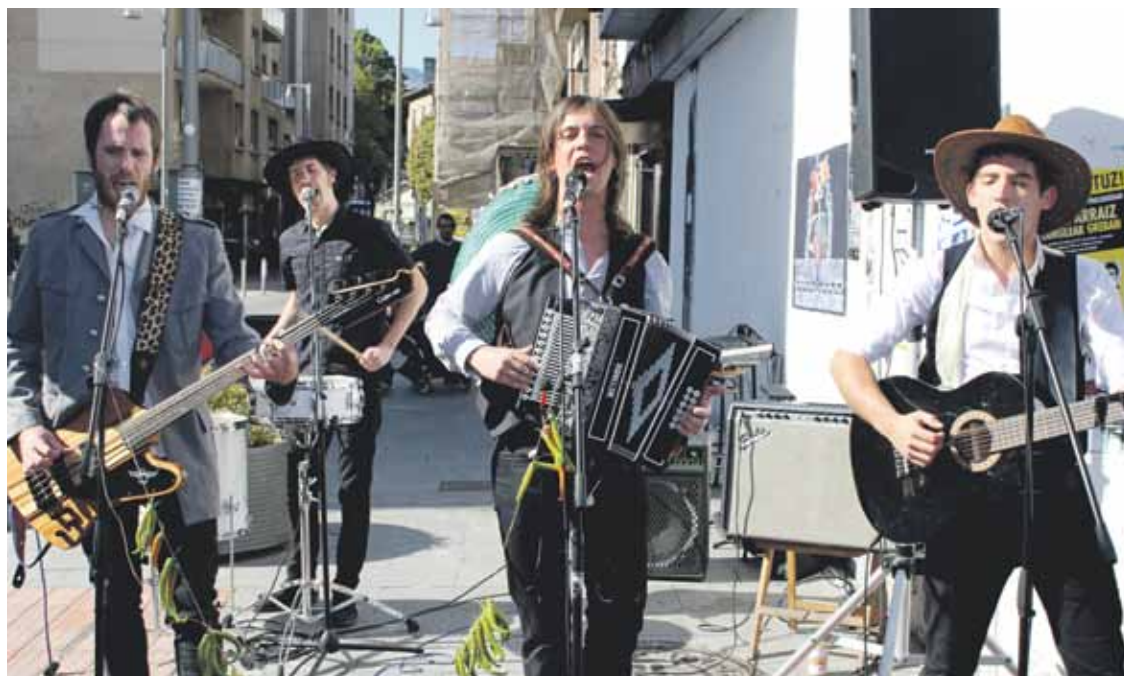
Abesti propioak sortu eta hauek CD batean biltzeko asmoa dauka Durangaldek lauokoteak.

G.B.: Gure abestiak ateratzen ditugunean, bideoren bat ere egiteko asmoa daukagu.