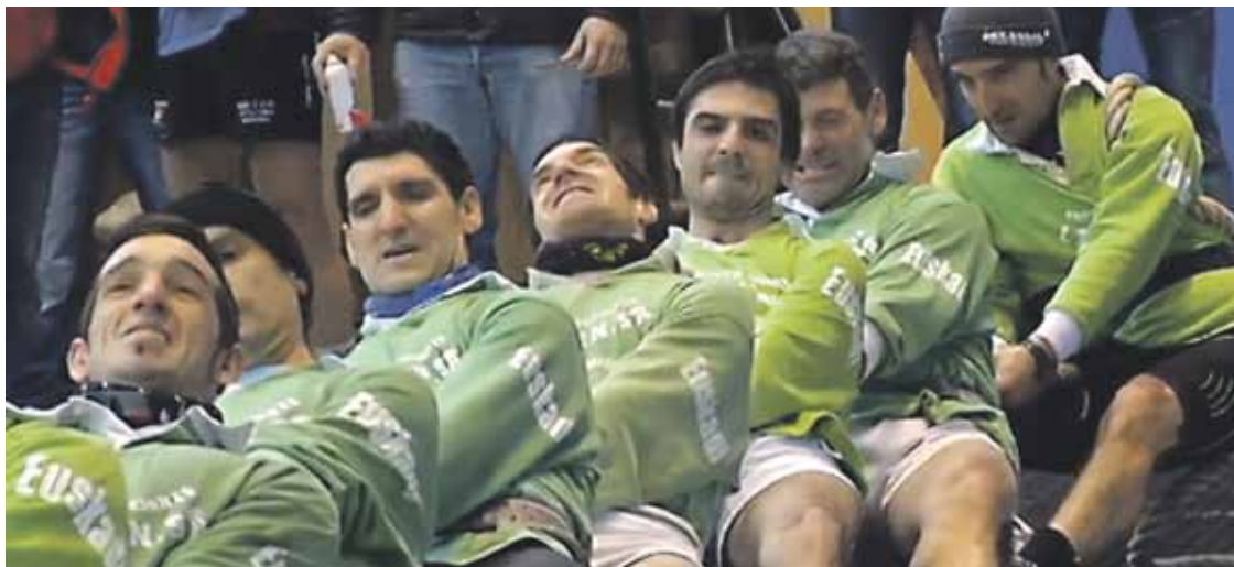
Abadiño Sokatira Taldea goma gaineko erreferentia izan da urte askoan.

Horrela, "pazientzia" da aurrera begirako jarrera. Gazte berriak batzea eta urterik urtera zailtzen joatea gura dute, emaitzak lortzeko urte batzuetako lana beharrezkoa dela jakinda. Zapatuan 640 kilora arteko txapelketa jokatu dute Mungian.