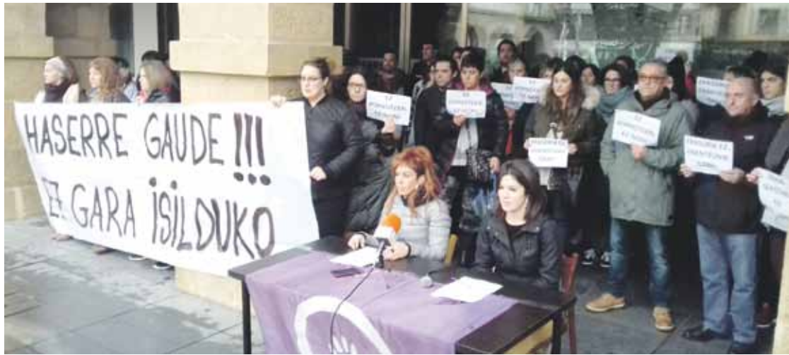
Zornotzako Emakume Taldekoak, zapatuan, hainbat herritarren babesagaz.

Azken kasua martitzenean eman zuen jakitera Durangoko Udalak