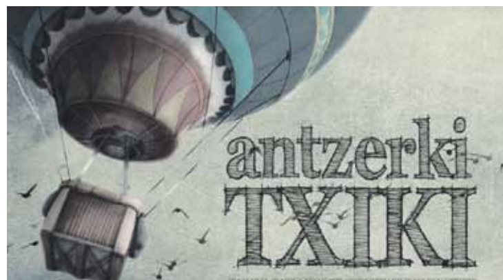
Ikasleek haurrentzako ikuskizun bat prestatzearen benetako ardura dute.