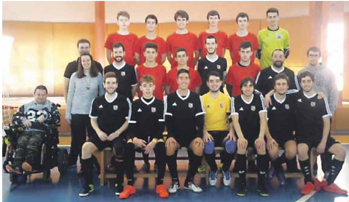
Durango Mendibeltz taldearen aurtengo argazki ofiziala. Mendibeltz

Abadiñoko Txopoa, Mendibeltz eta Racing Tolosto aurreneko postuetan daude