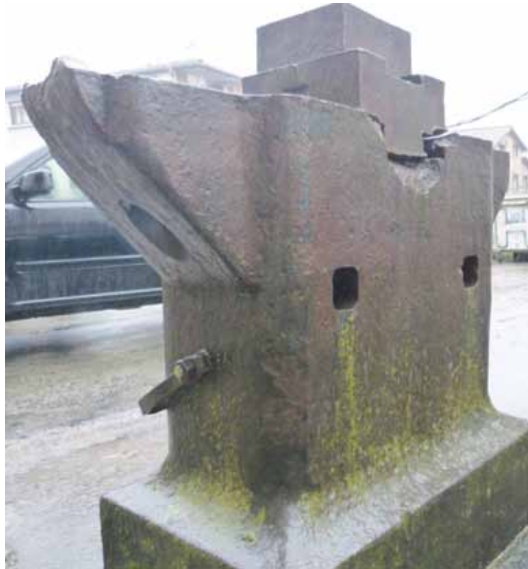
Gaztetxe parean dagoen burdinazko ingudea izango da eskulturako osagai bat.

Burdinazkoa izango da eta egitura osoak 14 bat tona pisatu ditzake