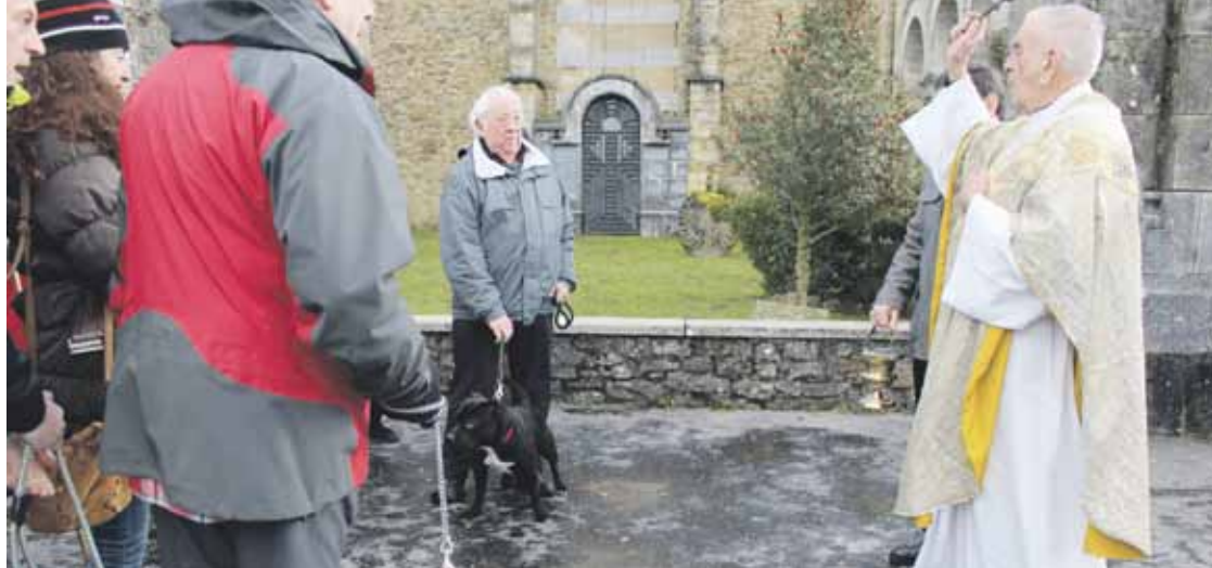
Meza nagusiaren amaieran, hainbat txakur bedeinkatzera irten zen abadea eliza atarira.

San Anton Abad animalien zaindariaren eguna ospatu zuten martitzenean