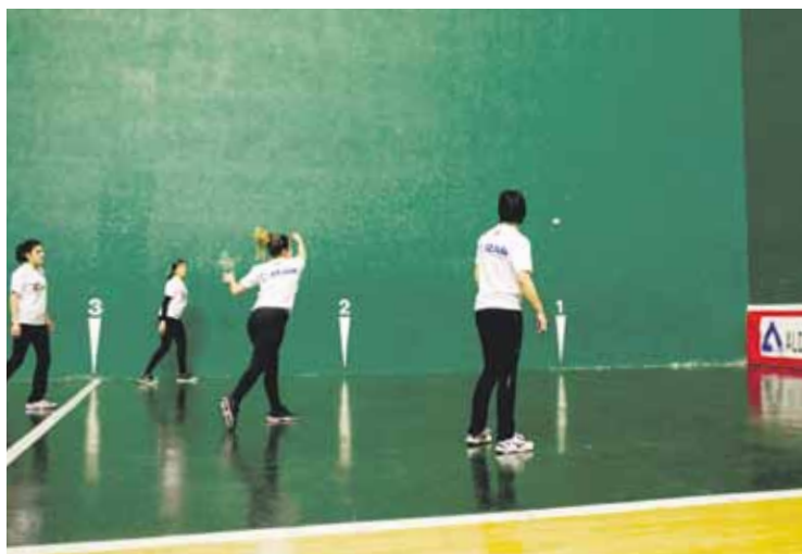
Eguaztenetan txapelketari begirako entrenamenduak egiten dituzte. L.E.

batean, berbetan aritu ginen. Zergatik gure herrian antzerako zerbait egin ez?” gogoratu du.