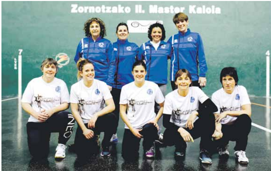
Erdu Pilotan klubeko emakumeen taldea entrenamendu saio batean. Lehiar Elorriaga

Seme pilotarien amak ziren; orain pilota klub berri bat sortu eta bertan dabilzan pilotariak dira