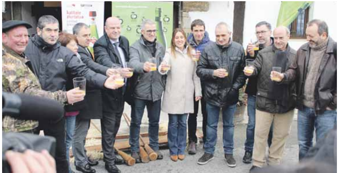
Sagardo ekoizleak eta instituzioetako ordezkariak batu ziren ekitaldian, besteak beste.