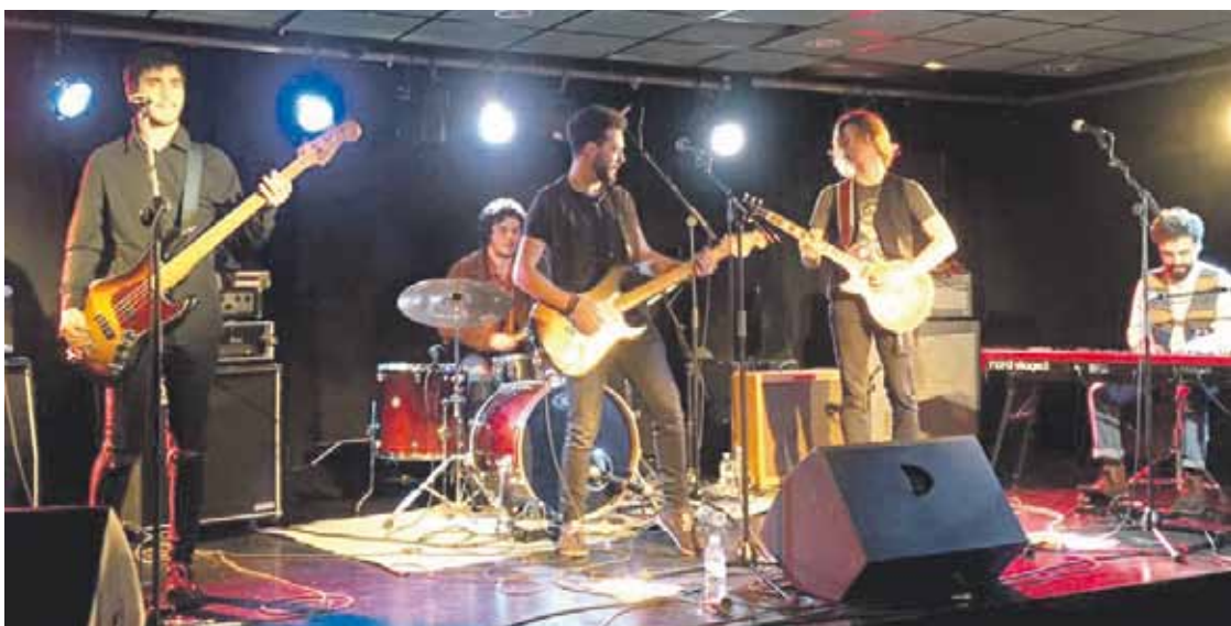
The Van berriztarren rock klasiko eta blues uztarketa izan da finalerako hautatu dutenatariko bat.

Otsailaren 10ean, 23:00etan, Zornotzako Zelaieta zentroan jokatu dute finala