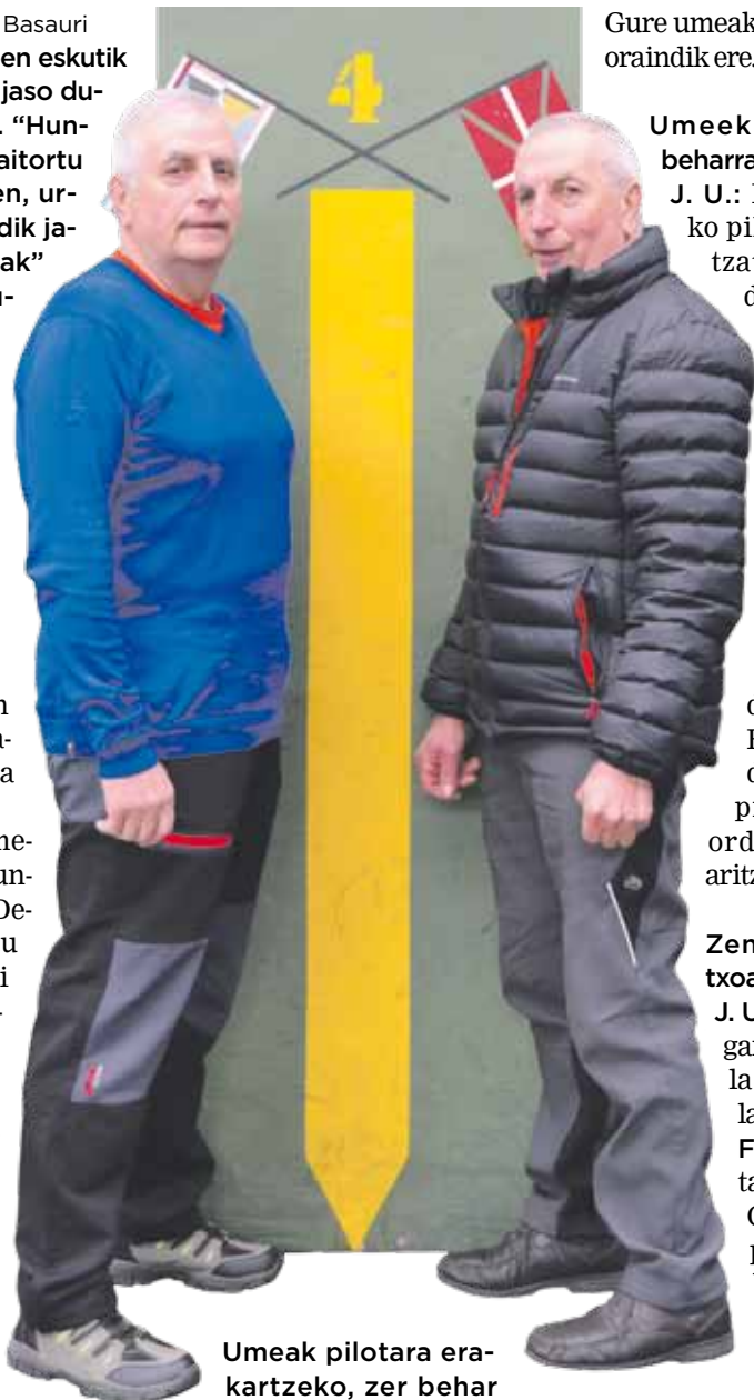
Umeak pilotara erakartzeko, zer behar da?

Herrian oso maitatuak zarete. F. U.: Bai, dudarik gabe. Gureine profesional dauz Berrizen, baina, nahi gabe izan da. Batzuek maila ona izan dute, eta aurrera egin dezaten ahalegindu gara. Baina, umeak egunero pilotan jokatzeko eta disfrutatzen ikustea da politena.