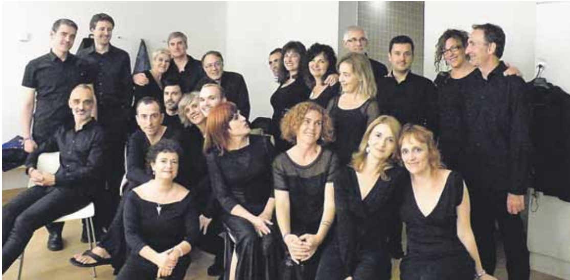
Bogoroditsie abesbatzako kideak gogoz daude musika egiten jarraitzeko.