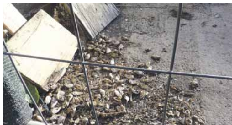
Arandoño Torre kalean ehunka sardina buru bota dituzte.

Kale Irekiak prozesuak Apatako herrigunean hirigintza arloan dauden arazoak aztertu zituen. Eragile eta sektore desberdinetako jendeagaz batu ziren beharrianak jakiteko. Ondoren, herritarrek lehentasunak markatzeko aukera izan zuten. Datorren martitzenean 19:00etan hasiko den batzordean, aukeratutako proiektuak eta lehentasunak zeintzuk diren jakinaraziko dute. Urtea amaitu orduko proiektu batzuk martxan jarri gura dituzte, udal ordezkarien esanetan.