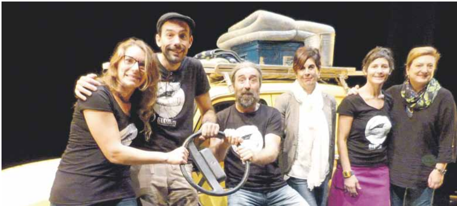
Protagonistak eta antolatzaileak, eguaztenean, antzezlanerako prestatutako autoaren alboan.

Ganso&Cia konpainiak familientzako antzezlan berria estreinatuko du asteburu honetan, San Agustinen