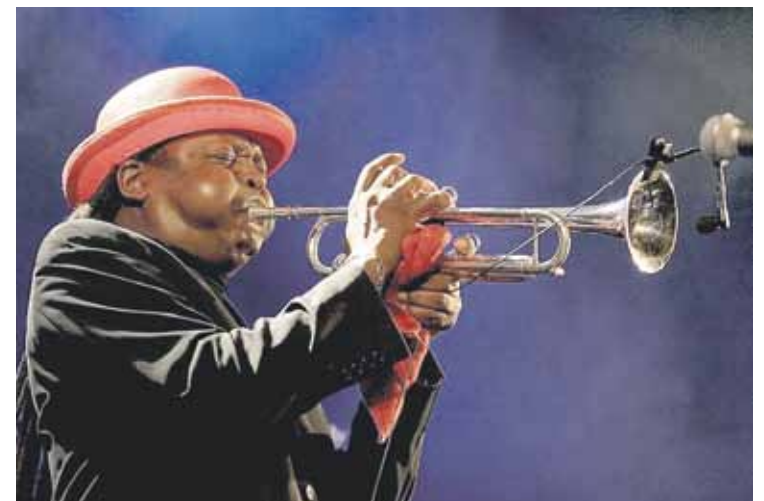
Bluesa, funka eta rocka uztartuko ditu Boney Fieldsenek bere emanaldian.