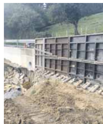
Euriteek Berrizen eragindako kalteak.

302.350 euroko kostua duten lan hauek lau hilabete burutzea aurreikusi dute, eta kostuaren %90 Bizkaiko Foru Aldundiaren diru-laguntzagaz egingo dutela jakinarazi dute.