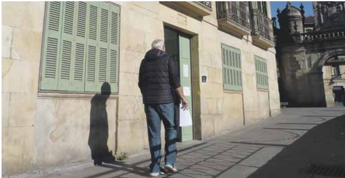
Aldundiak Durangoko Plnondon ipini du informazioa emateko bulegoa.