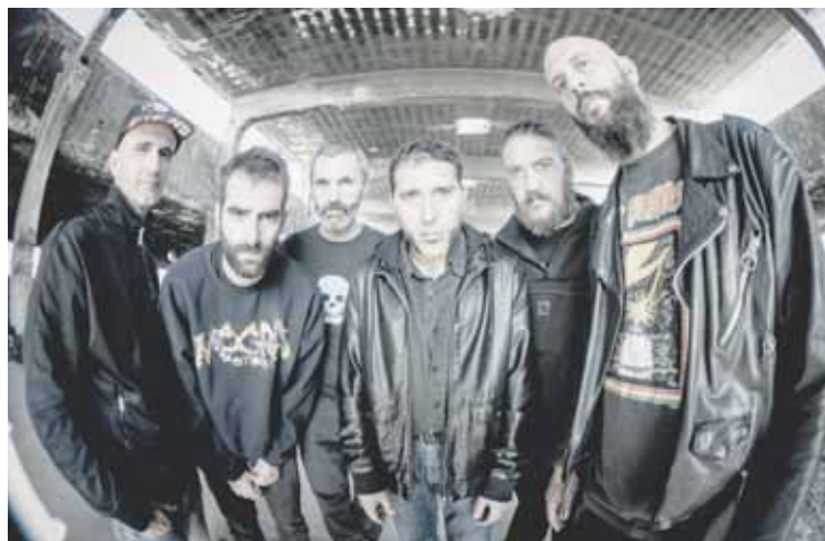
Narko taldeak zuzenekoak eskainiko du.

dute. Mahaian intsigniak, zapiak... banatuko dituzte ‘Ongi Etorri Errefuxiatuak’ leloagaz. Herriarrei bertaratzeko deia egin diete, eta politikariei ere gonbita egin diete norbanako moduan bertaratu eta plataforma ezagutu dezaten.