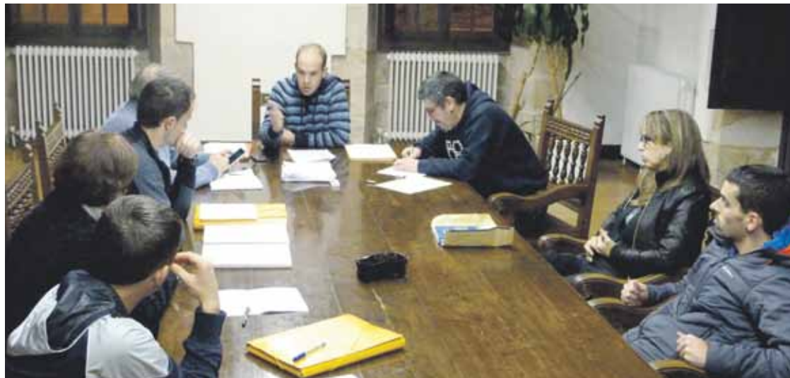
Joan zen egueneko udalbatzarrean eman zuten Otxandioko herriari egindako gonbidapenaren berri.

Madrilgo Memoria Historikoaren koordinakundeak gonbidatuta doa