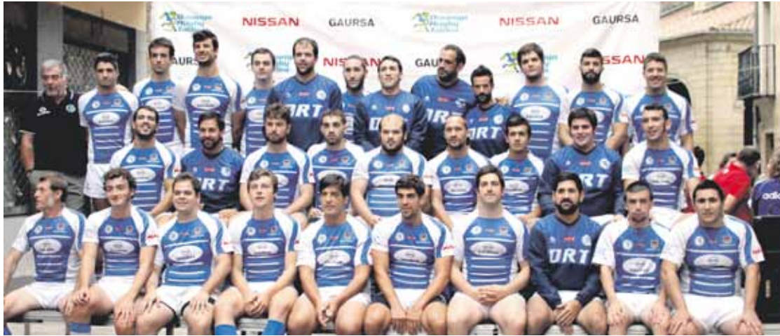
Durango Nissan-Gaursa gizonen talde nagusia, Durangon egin zuten aurkezpenean.