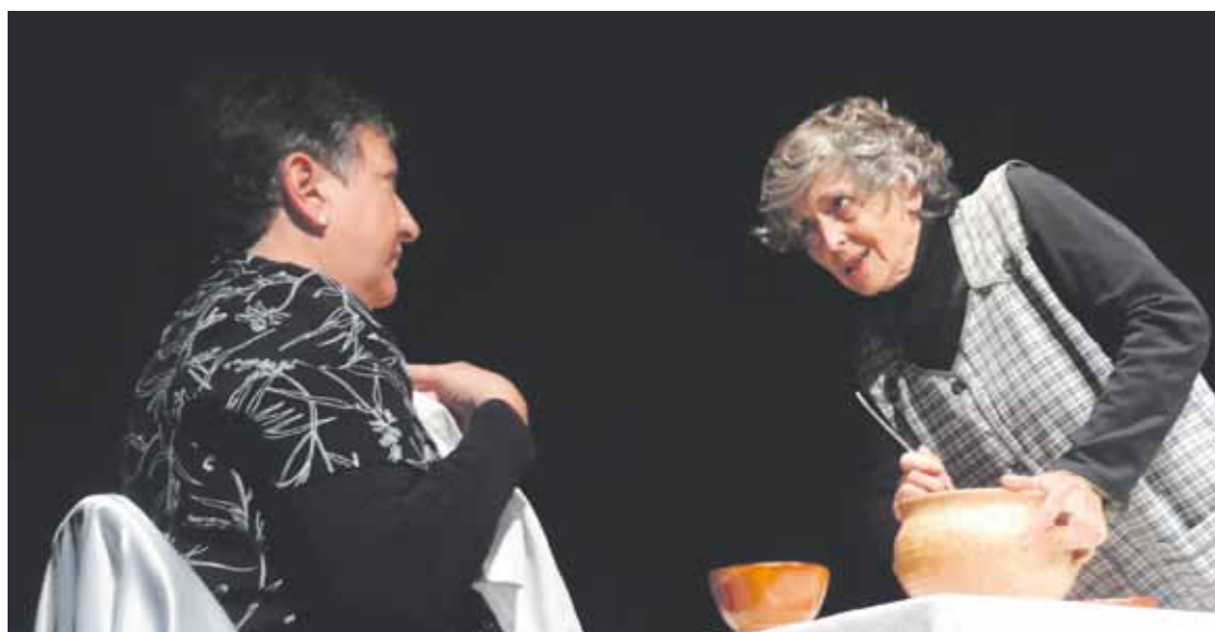
Arrasateko Doke antzerki taldearen 'Aingeru ala kurriloi?' obragaz amaituko da, azaroaren 26an, II. Antzerkiño.

Errota kultur etxean izango dira lau emanaldiak, 20:00etan, eta 5 eurokoa izango da sarrera.