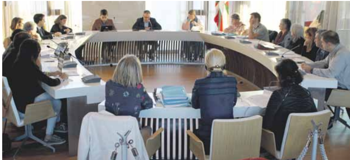
Joan zen asteko udalbatzarreko irudia bozketaren aurretik.

EAJ eta PSE-EEren aldeko botoekin atera da aurrera; EH Bilduk eta HiriEkimenak kontra bozkatu zuten