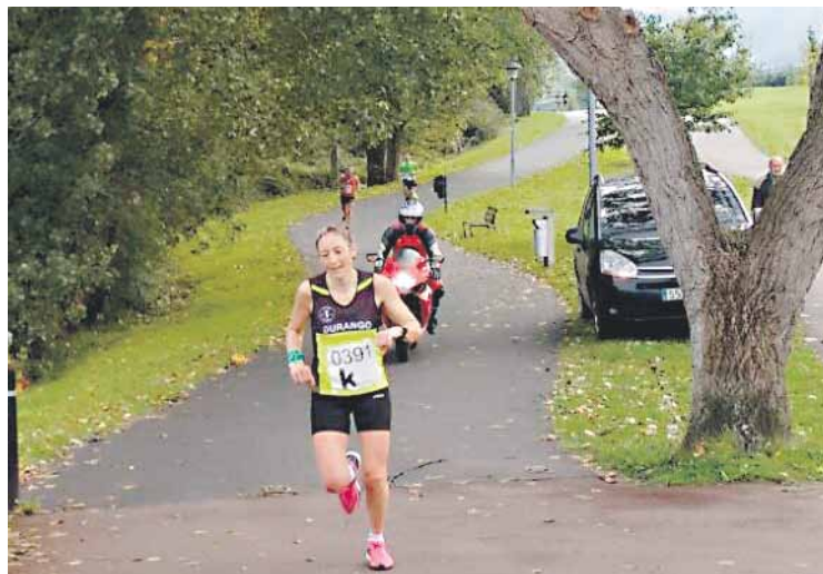
Emakumeek bakarrik parte hartu dezakete lasterketan.

Hirugarren Mailan indartsu dabilena Elorrioko Buskanta da. Lider daude orain arteko denak irabazita, eta 42 gol sartu dituzte sei partidutan.