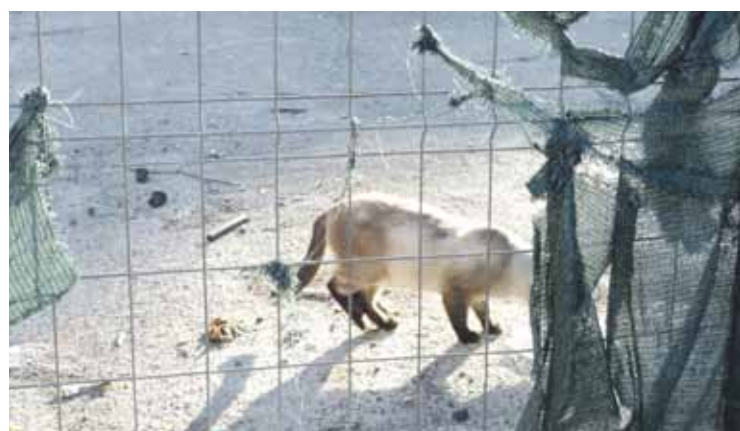
Hainbat katu dabilta orube horretan, janari bila.

Kaleko katuei jaten emateak beste herri batzuetan ere hainbat arazo sorrarazi ditu. Abadiñoko Traña-Matienan auzoan, esaterako, Errota kultur etxetik gertu, jendeak katuei jaten ematen ziela-eta, udalak bandoak atera zituen. Inguru horretan etxeak eraikitzen hasi zirenean, katuek tren geltoki ingurura joaten hasi ziren. "Bizilagun batek kexa helarazi zigun, pertsona batek edo hainbatek katuei jaten ematen diela esanez. Isunik ez da jarri, baina ohartarazi diegu ezin dela kalean katuei jaten eman. Hesituta dagoen ingurua da, gune hori berreskuratzen dugunean arazoa konpondu egingo da".