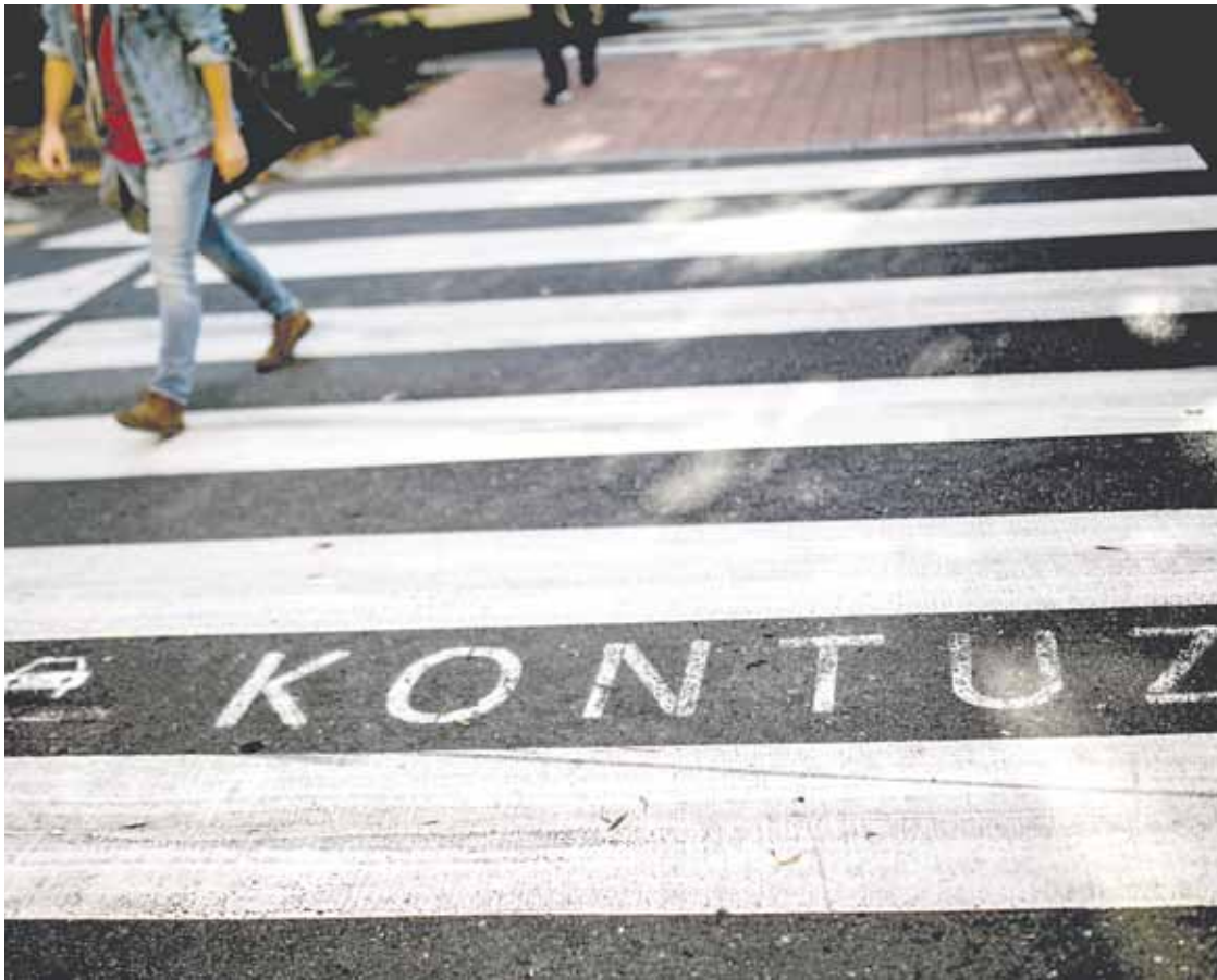
Zebra-bideetan 'kontuz' berba dago idatzita. Lehiur Elorriaga

Aurten 13 istripu jazo dira Durangon, azkena barikuan; udaltzaingoak esan du ez dagoela puntu beltzik