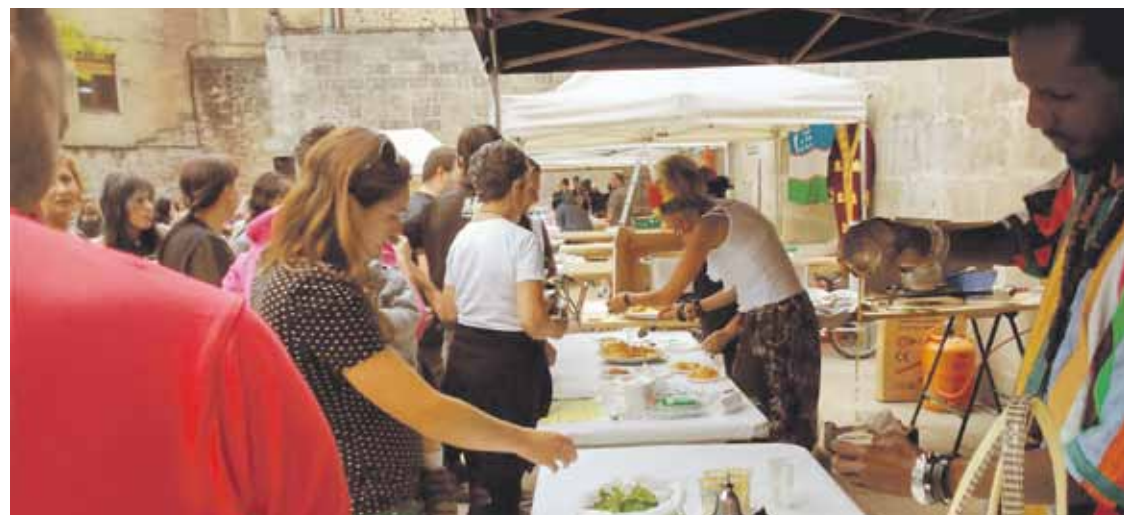
Domekan Elorrioko Kulturarteko Jaia etorriko dira Zaporeak taldeko kideak.

Bihar Sukalki Eguna ospatuko dute Elorrioren. Joan zen asteburuan hasitako jaia amaitzeko asteburu bete dator, beraz.