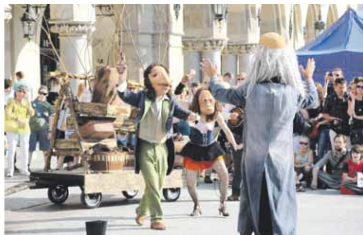
Euskadiko kaleko ikuskizunik onenaren saria jaso zuen 'Andante'-k, Leioan, iaz.

Iaz, Euskadiko kaleko ikuskizunik onenaren saria jaso zuen Markeliñeren Andante -k, Leioako Umore azokan. Gerretako istorioak kontatzen ditu obrak, zapata anonimoen metaforagaz gogoeta, salaketa eta omenaldia bultzatuz.