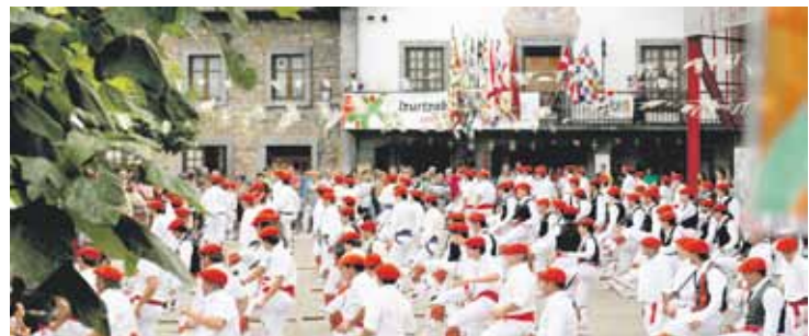
2009an Izurtzan egindako Ezpadantzari Eguna. Gerediaga Elkarte

Durangaldean mendeetan zehar iraun ondoren, Dantzari Dantza eskualde honetatik Bizkaiko beste lurraldeetara zabaldu zen XX. mende hasieran.