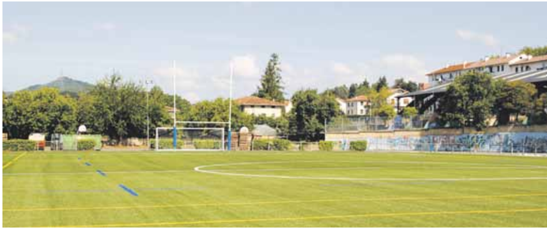
Bi hilabete eta erdi iraun dute Larreako kirol instalazioetako obrek.

Larreako kirol instalazioen hobekuntzara 400.000 euro bideratu dituzte