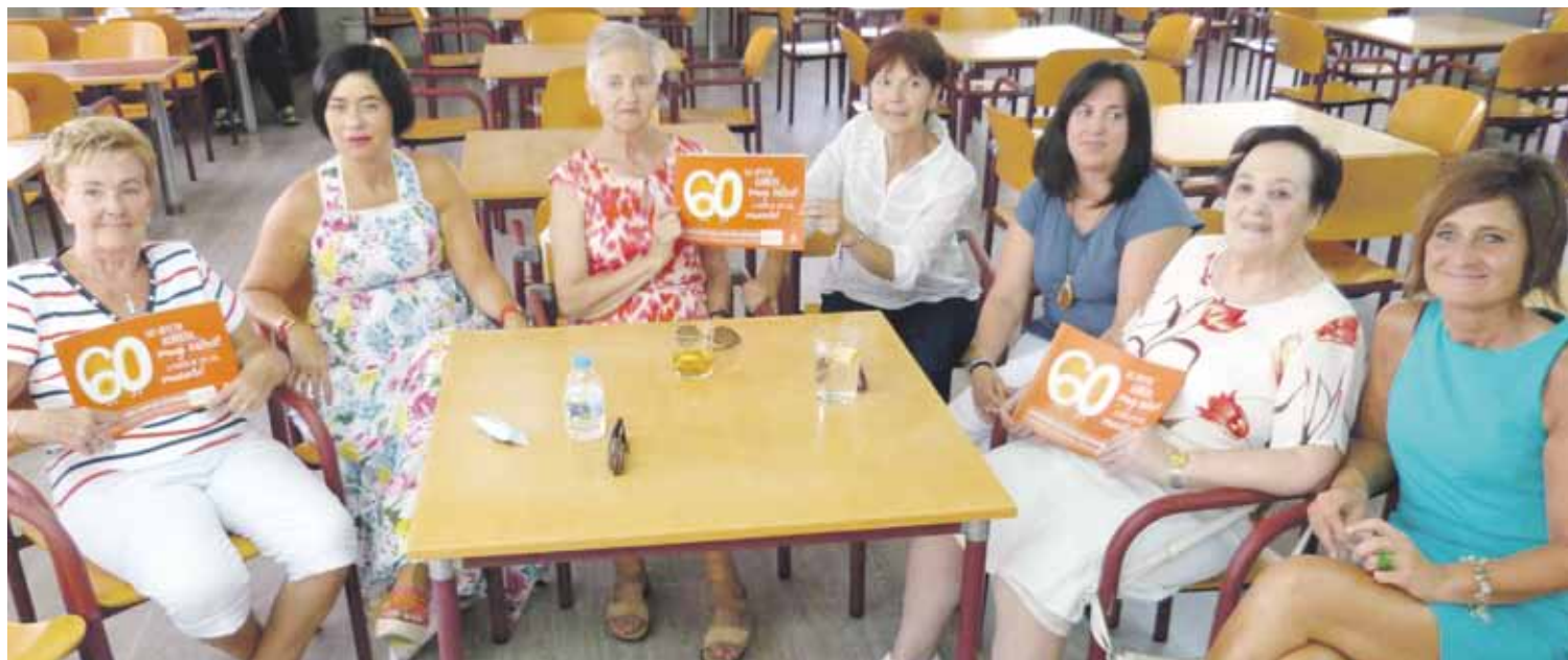
Durangoko ikastaroen aurkezpena, joan zen barikuan.

Durangoko Udalak 22 ikastaro antolatu ditu zahartzaro aktiboa sustatzeko