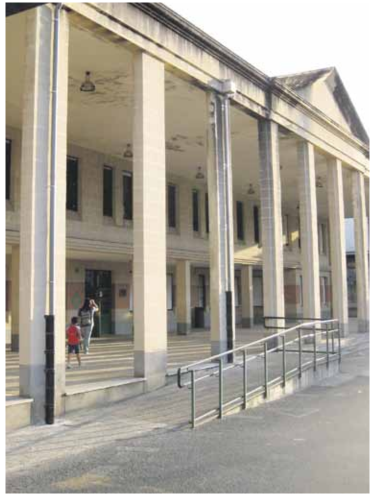
Uztailean eta abuztuan egin dute lanen parterik handiena.