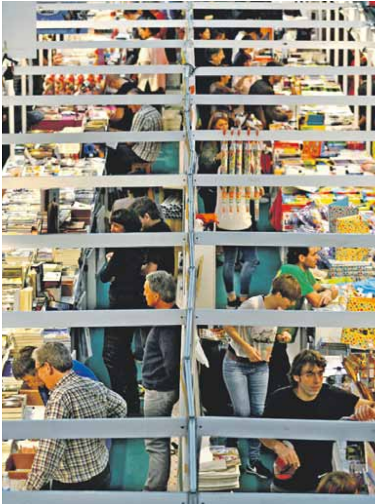
Urrian zabalduko dute boluntario izan gura dutenentzako izen-ematea.