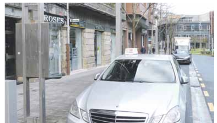
Zelaieta parkearen ondoan dagoen auzo-taxi gunea.

Zerbitzu hori astelehenetik ostiralera ematen da, 07:30etik 19:00etara, urte osoan, abuztuaren izan ezik. Bidaiak erreserbatzeko, taxi telefonogunera (94 673 11 77) deitu behar da.