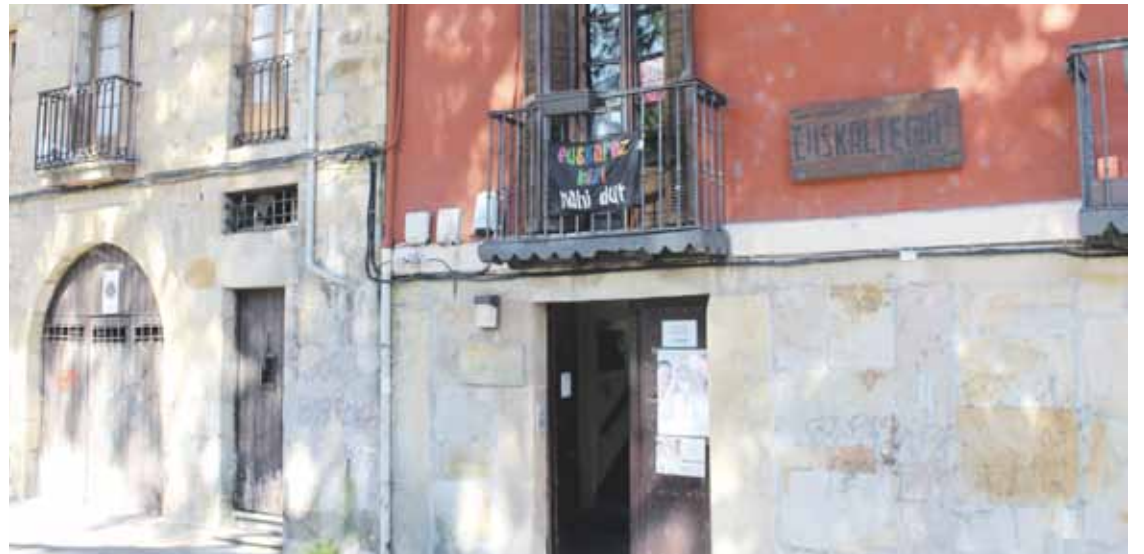
Pinondon, Andragunearen aldamenean egon da Abarrak.

Irailaren 22an izango da inaugurazioa, arratsaldean, 18:30ean. Ekitaldira irakasle, ikasle eta erakundeak gonbidatuko dituzte. Aukera ezin hobea izan daiteke AEK-k euskara ikasteko eskaintzen dituen aukerak ezagutzeko. “Euskara ikasi gura duten guztiak gonbidatuta daude”.