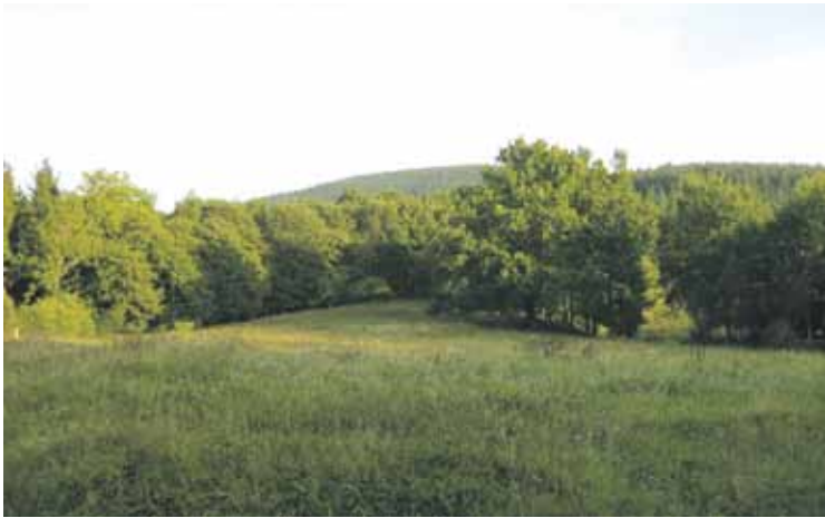
Atxondo eta Elorrio artean dago Solatxo lez ezagutzen den eremua.

AHTaren eraikuntza lanetako hondakinak Solatxon botatzeko baimena eman zuen Jaurlaritzak