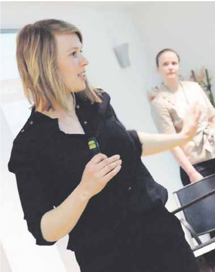
Urtea amaitu bitartean metodologian barneratzeko lan saioak izango dira.