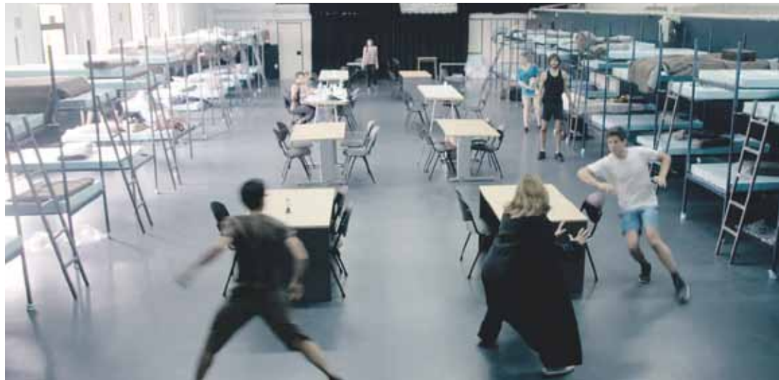
Donostiako Larratxo kulturgunea 1942ko ume juduentzako umezurztegi bihurtu du Vaivén taldeak.