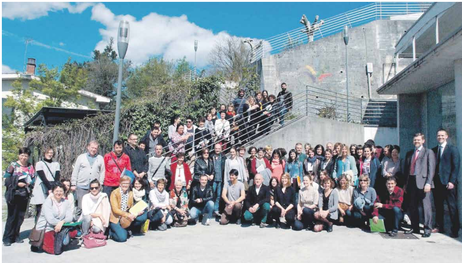
Guztira, 52 ikastolek txertatuko dute bullyng-ari aurre egiteko KiVa metodologia 2017ko urtarriletik aurrera.

KiVa metodoa 2017ko urtarrilean abiatuko dute Kurutziaga, Txintxirri eta Andra Mari ikastoletan