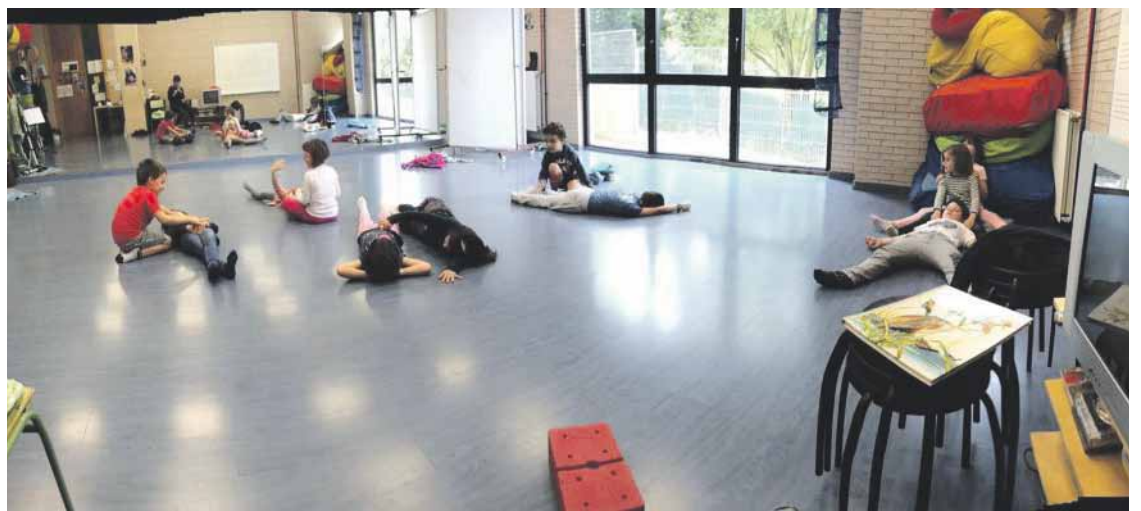
Ikasleak antzerki eskolan.

Gainera, antzerki eskolaren proiektuari forma eman eta inguruan hau zabaltzea gura dute la baieztatu du.