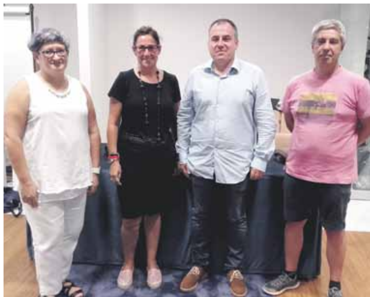
Joan zen astean matrikulazio kanpaina aurkeztu zuten Zornotzan.