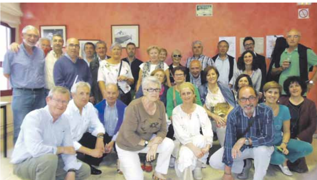
Bizidun elkarteko berbaldi baten ostean ateratako argazkia.