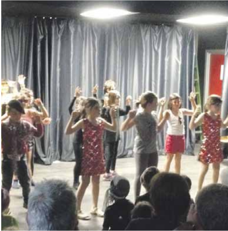
Antzerki eskolako ikasleak beraien lana antzezen.

laztik, Karrikak antzerki eskola eskaintzen du Kurutziaga Ikastolan