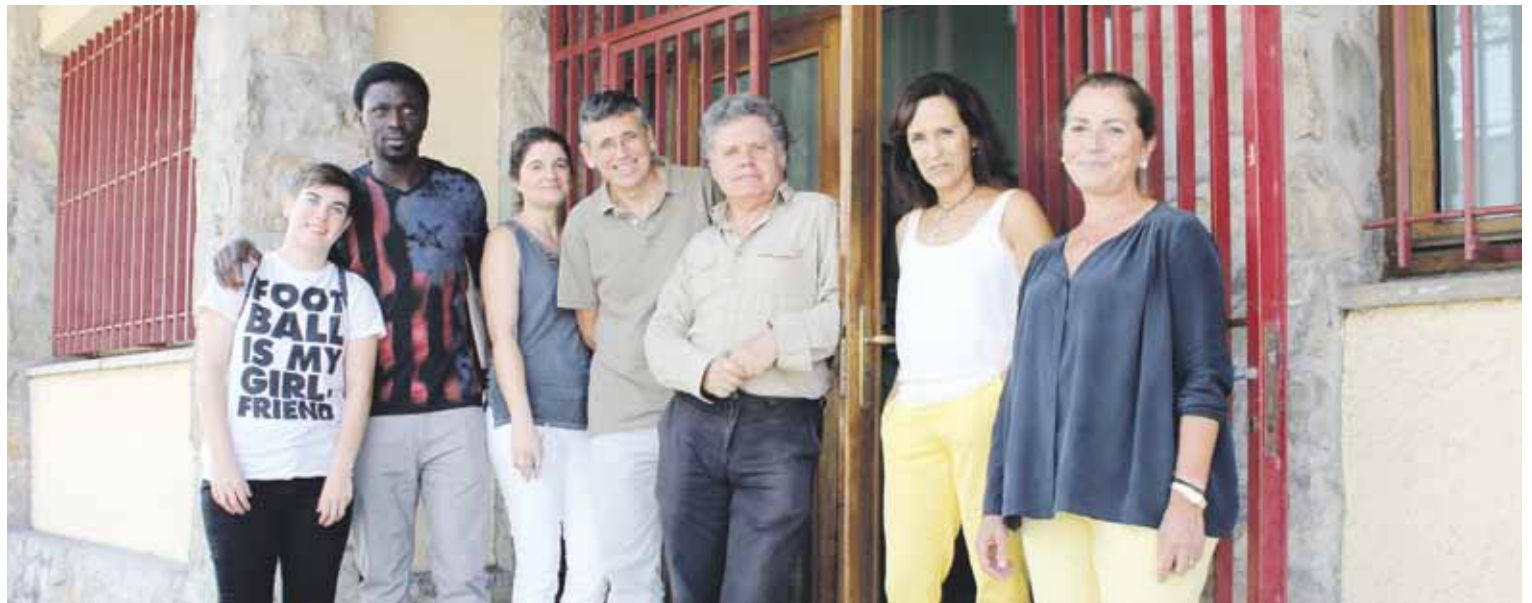
Irailaren 16ra arte dago aukera Helduentzako Hezkuntzako Ikastetxean matrikulatzeko.

du Helduen Hezkuntzako Ikastetxeak: atzerritarrentzat gaztelania, ingelesa, informatika eta goi mailako zikloetarako zein unibertsitatearako sarbiderako ikastaroak ematen dituzte.