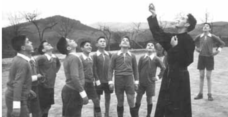
Beratarzen direnek antzinako argazkien erakusketa ikusi ahalko dute.