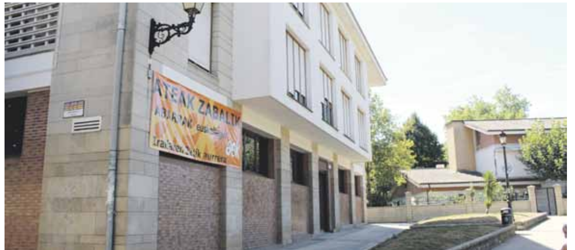
Ikasturte berria Santanosten abiatuko dute, Mañaria erreka beste aldean.