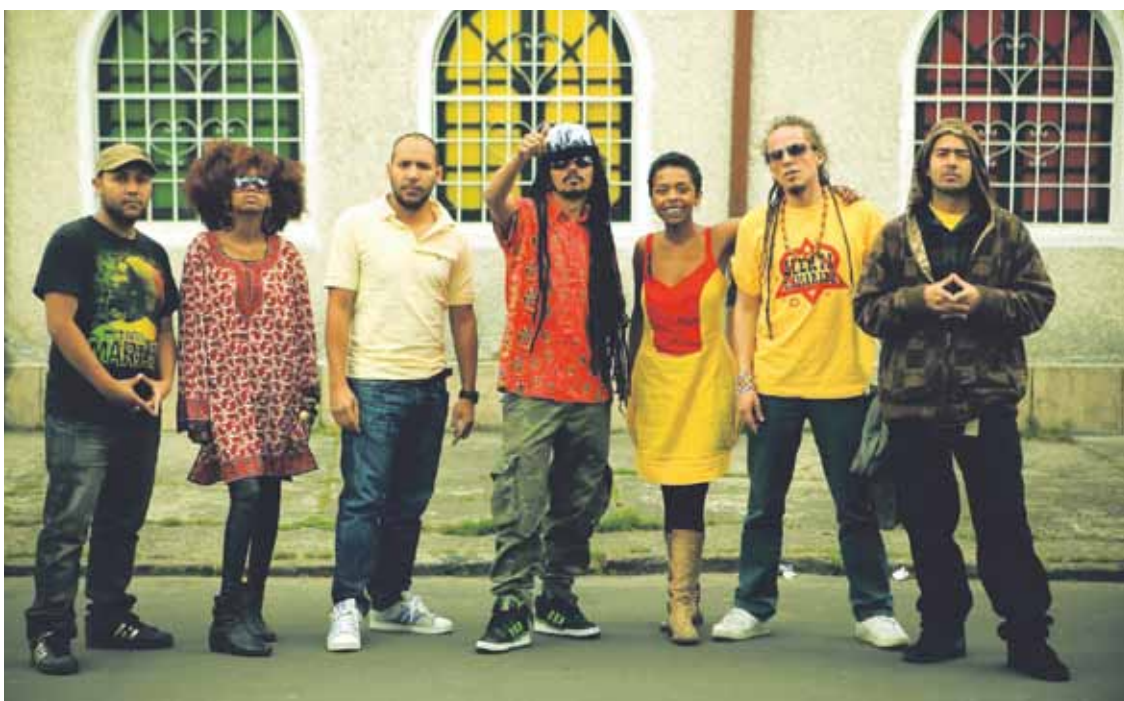
Duela ia bi hamarkada sortu zuten Alerta Kamarada taldea, Kolonbiako Bogota hirian.

Alerta Kamarada eta Kultura Roots Band taldeek joko dute reggae jaialdian