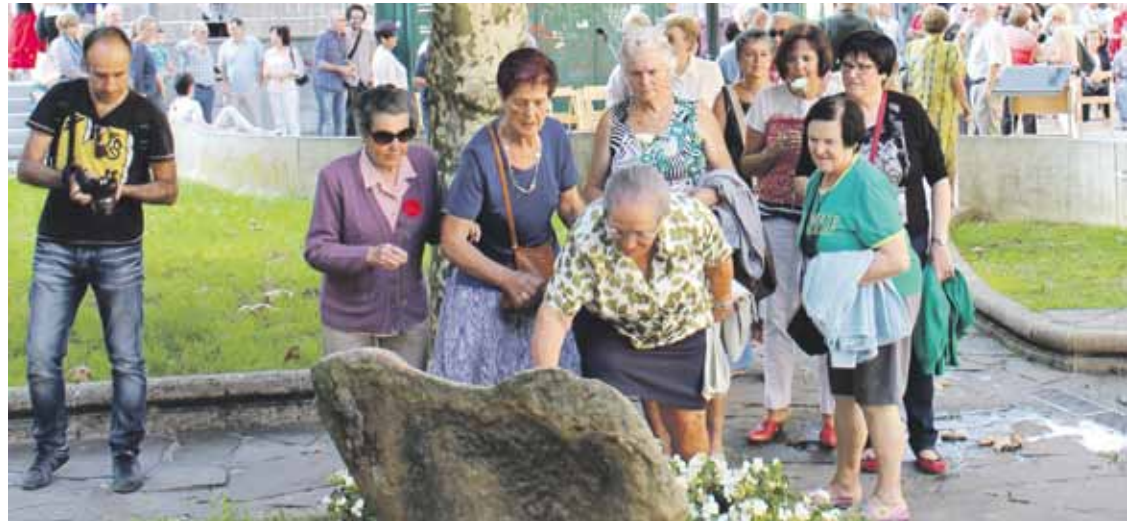
Irailaren 11ko iazko ekitaldia.

11:00etan hasiko dira ekitaldiak, Oroimenaren Bidean oroigarrian