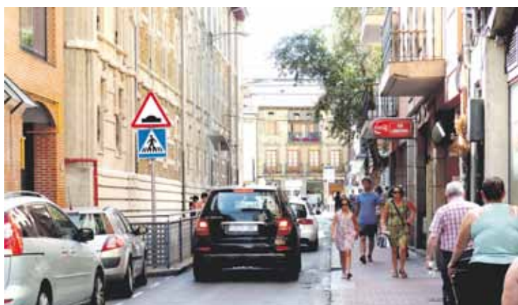
Goizeko orduetan 5.000 oinezko pasatzen dira bertatik.

Udalak auzokideekin eta merkatariekin berba egin du. Kanean, aulkiak eta jardinerak ipiniko dituzte. Autoz Kurutzia-gara joan gura dutenak Arandono Torretik sartu ahal dira.