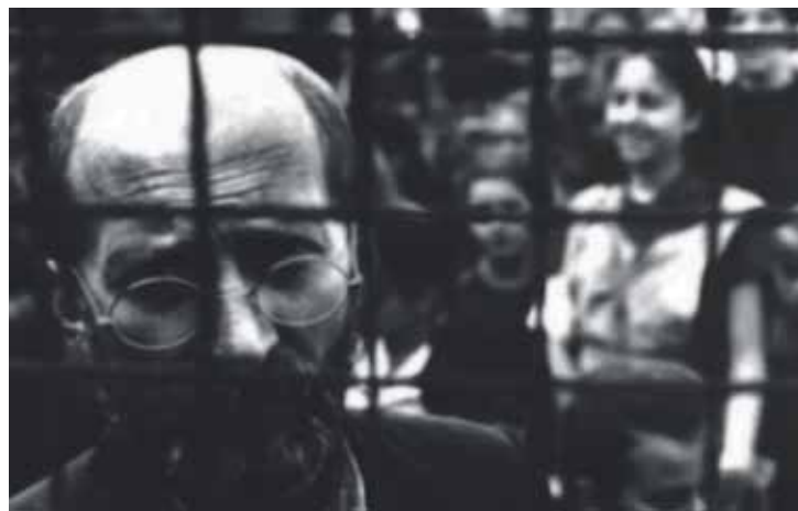
Korczak pedagogoak zuzendu zuen umezurztegiaren istorioa da obrakoa.