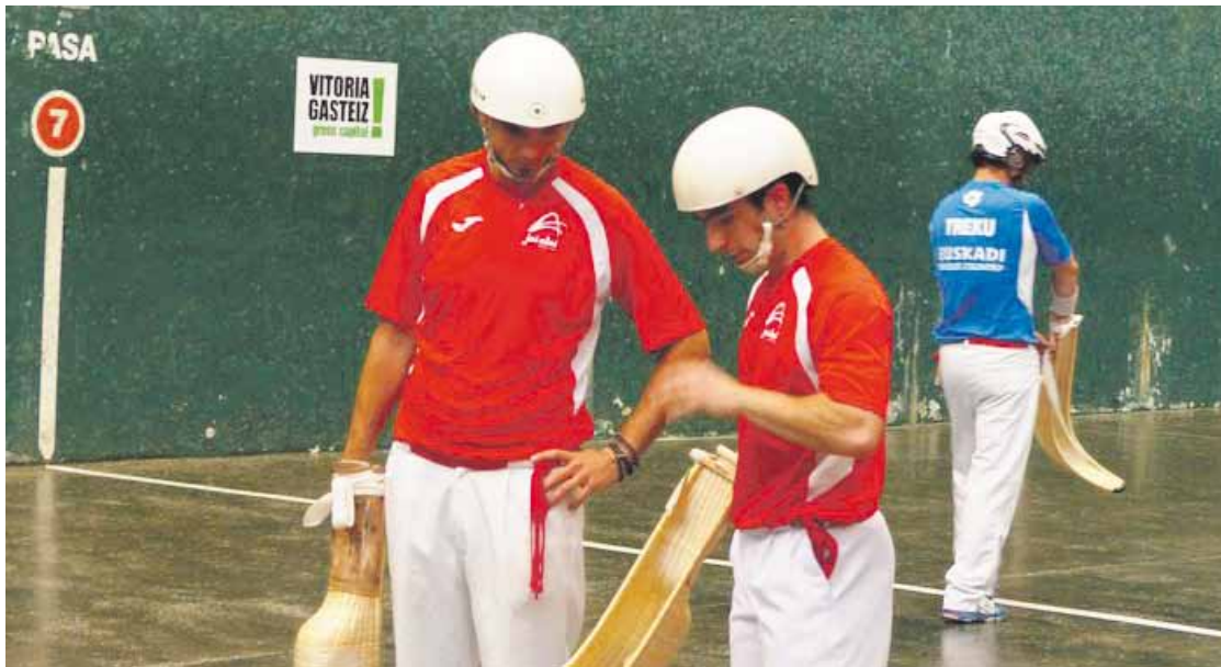
Zapatu arratsaldero eta domeka goizero jokatuko dituzte partiduak Ezkurdi Jai Alai pilotalekuan.

San Fausto Zesta Txapelketaren 33. aldia asteburuan hasi eta jaietan amaituko dute