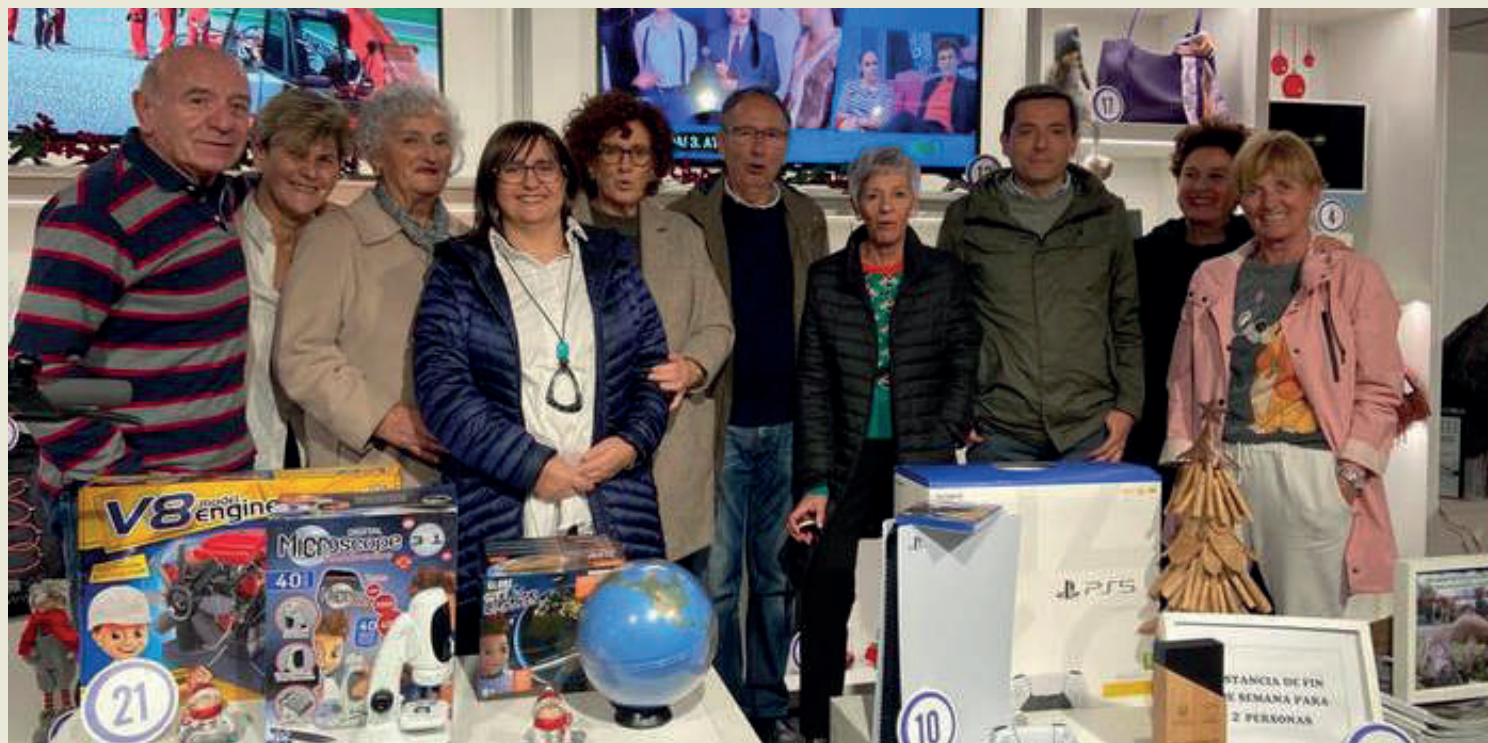
JAEDeko kideak, stand solidarioaren aurkezpenean.

JAEDek Durangoko Andra Mariko elizpean ipini du aurten ere stand solidarioa; urtero legez, 1,50 eurotan eskuratu daiteke txartel bakoitza