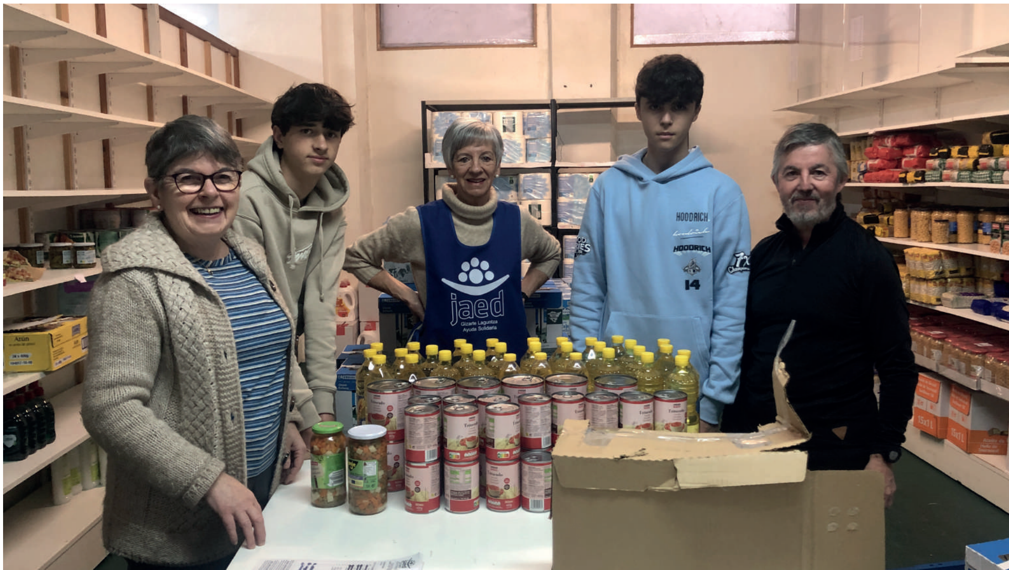
JAEDeko kideak Orobiogoitia Institututuko ikasleekin.