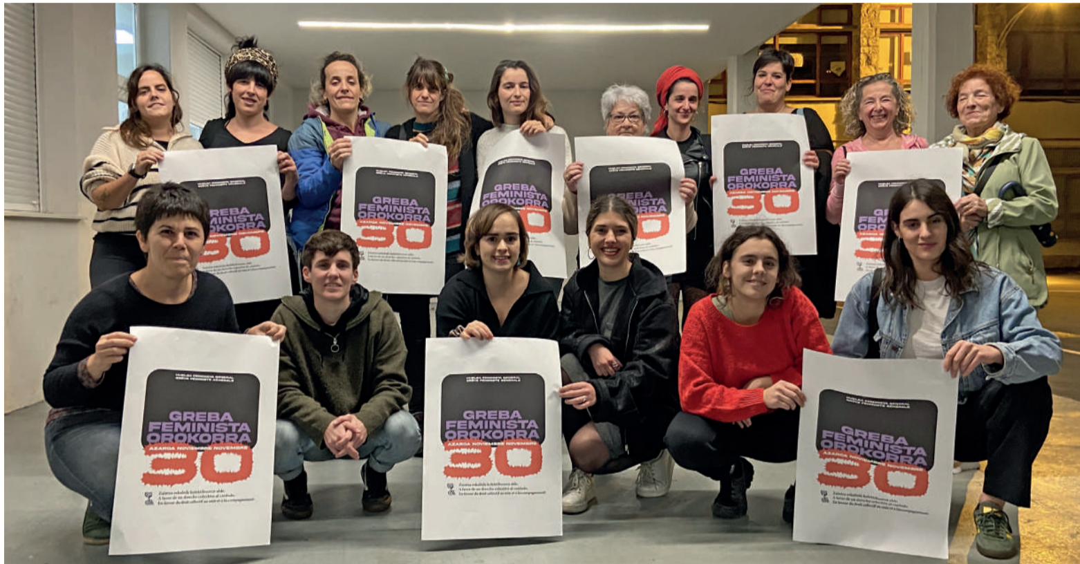
Durangaldeko Mugimendu Feministako kideak.

Etxeko langileek ez dute lan esku-biderik. Oso baldintza prekarioetan bizi dira. Era berean, familia askotan, emakumeen eskuetan