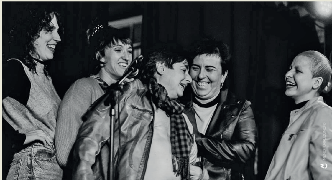
'Tabuaren kutxatik oholtzara'.