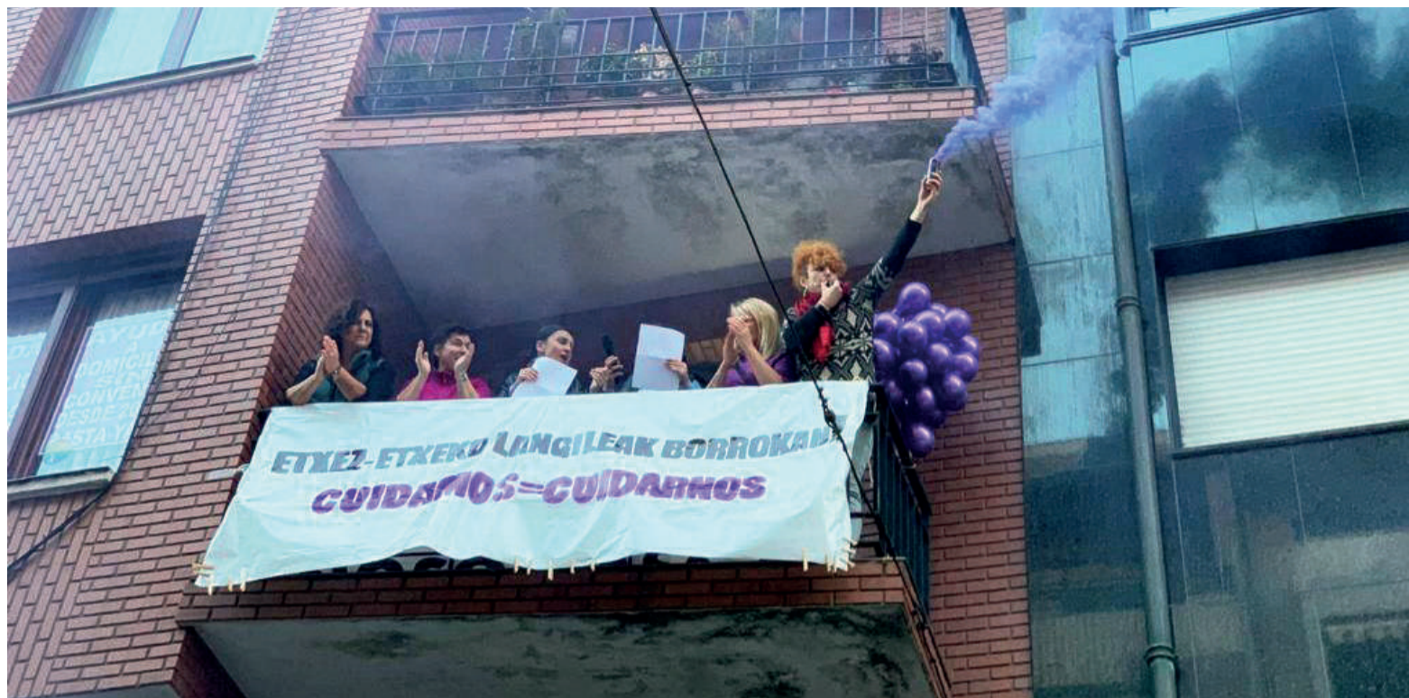
Etterik etxeko langile batzuek zaintza eskubideak aldarrikatzeko protesta egin zuten Zornotzan, joan zen martxoaren 8an.

geratzen da. Ulertzen dugu zaintza ez dela pardelak aldatzea, gure bizitzako arlo guztiak zeharkatzen dituen zerbaite baino. Denean dago, eta denean baldintza txarretan eta aitortu barik; ikusezin bihurtuta, arrazializatuta, prekarizatuta... Langileen baldintzak txarrak dira, eta, beraz, zaintza hori jasotzen duen pertsonaren egoera ere ez da duina, ezin delako bermatu. Zaharren egoitzetako egoeraren berri jasotzen gabiltza eta zaintzaileek oso denbora gutxi izaten dute egoiliar bakoitzagaz egoteko. Esaten digutenez, Durangoko erresidentzian orain ez dago igogailurik, eta beharginak behartuta daude materiala alde batetik bestera oinez eramatera. Oso baldintza eskasak daude eta, pribatizatu den momentuan, ez da horretan inbertitzen. Justizia eta duintasuna bermatu beharrean, etekinaren alde egiten da, enpresa pribatuen mesedetan. Gorabide ere greban egon da.