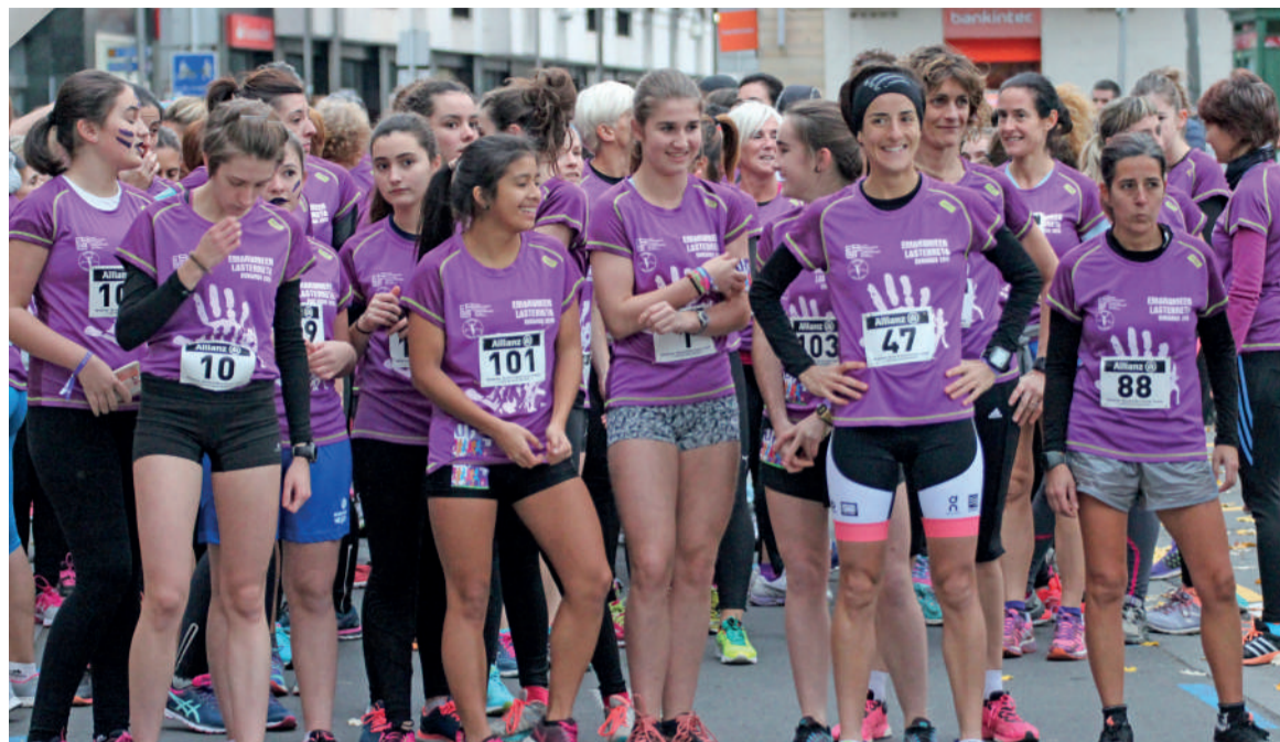
Aurreko edizio bateko argazkia.

ume asko dugu. Horiek krosek lasterketetan dabilta parte hartzen. Eta mendiko taldeak ere baditugu, bai neskena eta baita mutilena ere. Hauek ere Lehenengo Mailan daude estatuko lasterketetan. Horiez gainera, master edo beteranoon taldea ere badugu. Hemen, emakumeok Lehenengo Mailan gaude, eta gizonezkoak ‘floyotxoago’ ditugu. Orokorrean, Durangoren moduko herri batentzat maila itzela dugu.