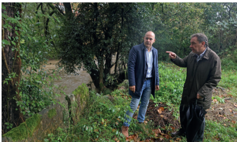
Udalak eta URA agentziak modu koordinatuan garatuko dituzte lanak.

Iurretako Udalak eta URA agentziak jarduera protokoloa landu dute Ibaizabal ibaian izan daitezkeen uhaldeetatik babesteko. Batetik, Paduretako ibarrean (Ibaizabalen eskuinaldean) ibai-parke bat egokituko dute eta, bestetik, defentsarako hormatxoak egingo dituzte. Iurreta eta Durango lotzen dituen zubiaren azpiko presa txikia ere kenduko dute. Modu horretan, "ur-goraldi errepikakor eta naturaletatik babestuko dute herrigunea", udalak jakinarazi duenez.