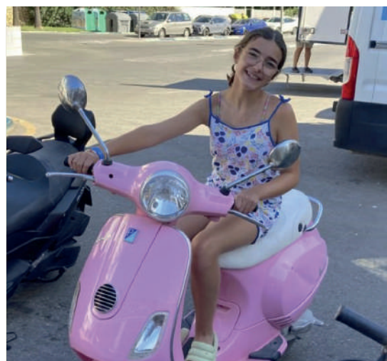
Sofiak beste urte bat egin du. Oso handia zara, maitia. Zorionak bihotz-bihotzez zure familiaren partez, asko maite zaitugu. Ondo pasa, nire bihotza. Musu handi bat.