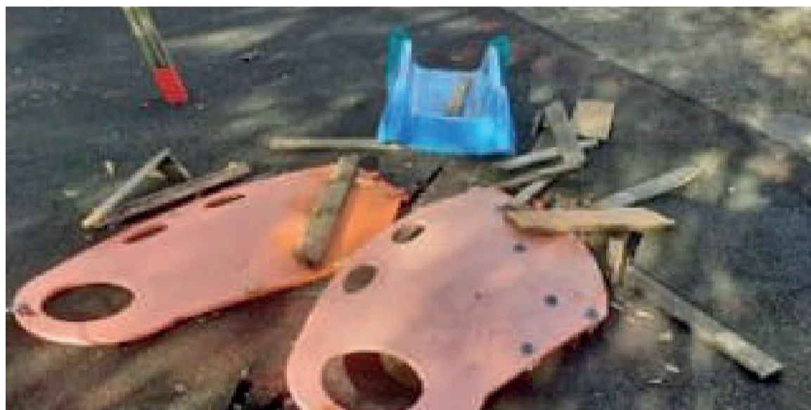
Kalteak, parkeetako batean.

Bandoagaz batera, erasoaren kronologia eta kostua aletzen dituen txostena webgunean ipini du udalak. Erasoak eskola eremuaren inguruetan izan dira, batez ere. Birritan apurtu dituzte Haur Hezkuntzako eraikineko kristalak, eta txirrin berriak ere ipini behar izan dituzte. Ondoko jolas parkeko txirrista apurtu eta erre egin zuten, eta berria ipini beharko dute.