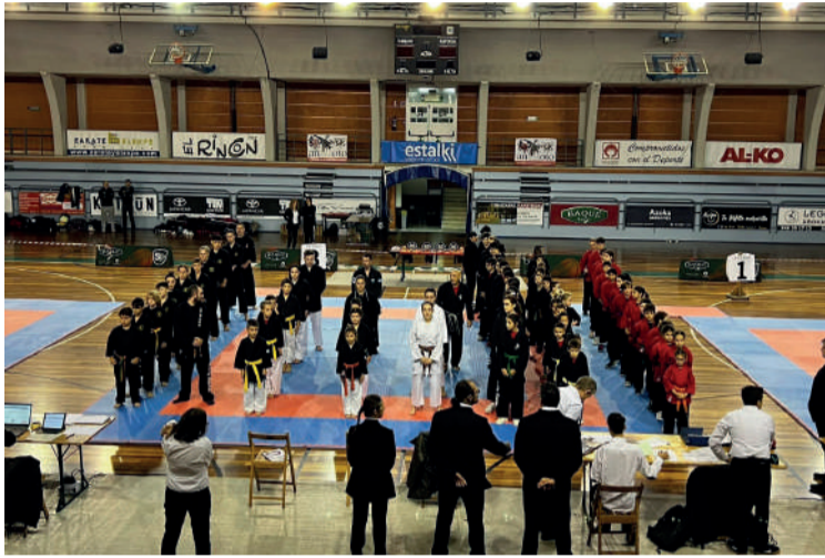
lazko lehenengo edizioako openeko argazkia.

lazko saioagaz gustura geratu ziren eta aurten berriro egitea erabaki dute. Ekimena Landako Kiroldegian izango da