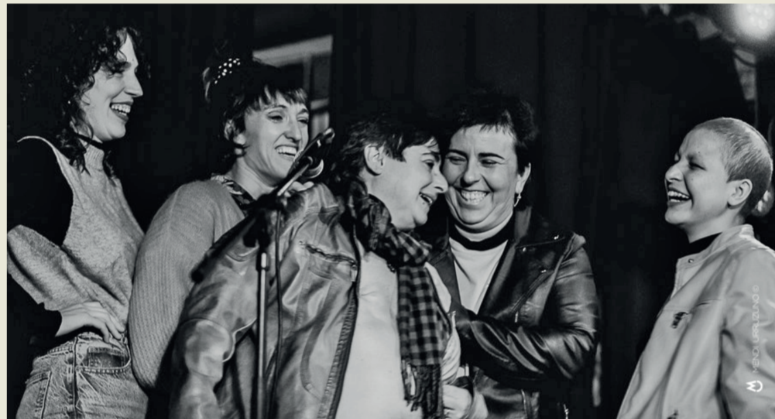
'Tabuaren kutxatik oholtzara'.

Berrizko saioan lau emakume izatea ez da kasualitatea. "Minbiziak inposatzen duen isiltasun eta estigmari emakume izateari loturikoa gainjartzen zaio. Euskal kulturaren eremuak, tamalez, emakume ahotsaren espazio eta prestigio falta nabarmena izan da historikoki, eta gure proiektuak egoera horretan ere eragile izan gura du", azaldu du Inurritik.