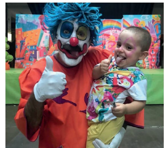
Azaroaren 20an Unaik urteak egiten ditu. Matienako terremotoak 3 urte egiten ditu. Zorionak.