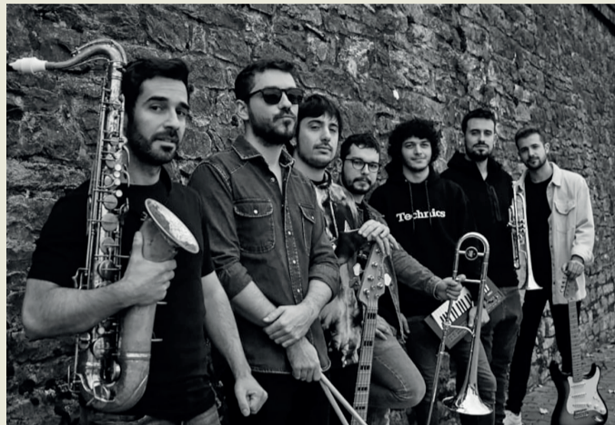
Arriolako XXXIV. Jazz Blues Jaialdia.

ANBOTOko agendan ezer iragarri gura baduzu, idatzi agenda@anboto.org helbidera edo deitu 946 232 523 telefonora, eguazten eguerdia baino lehen.