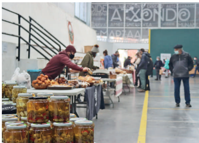
Aurreko edizio bateko azokako argazkia.

Nekazari eta artisau azoka abenduaren 3an egingo dute