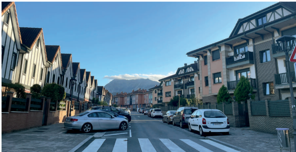
Abadiñoko kale bateko argazkia.