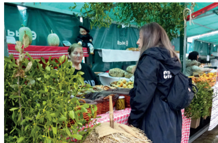
60 postu ipini zituzten Ermuko kaleetan.