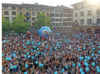
lazio txupinazoko argazkia.