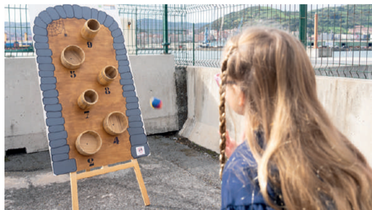
Mañarian egongo den egur jolasetariko bat. ALAIKI ZURESKU JOLASA