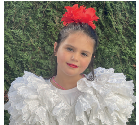
Zorionak, potxola. Egun eder bat pasa. Mosu handi bat zure familiaren partez.

Ermodo, 11. DURANGO Tel.: 946 201 663 661 40 14 00 gozatudurango@gmail.com Gozatu Gozategia gozaturgozategia