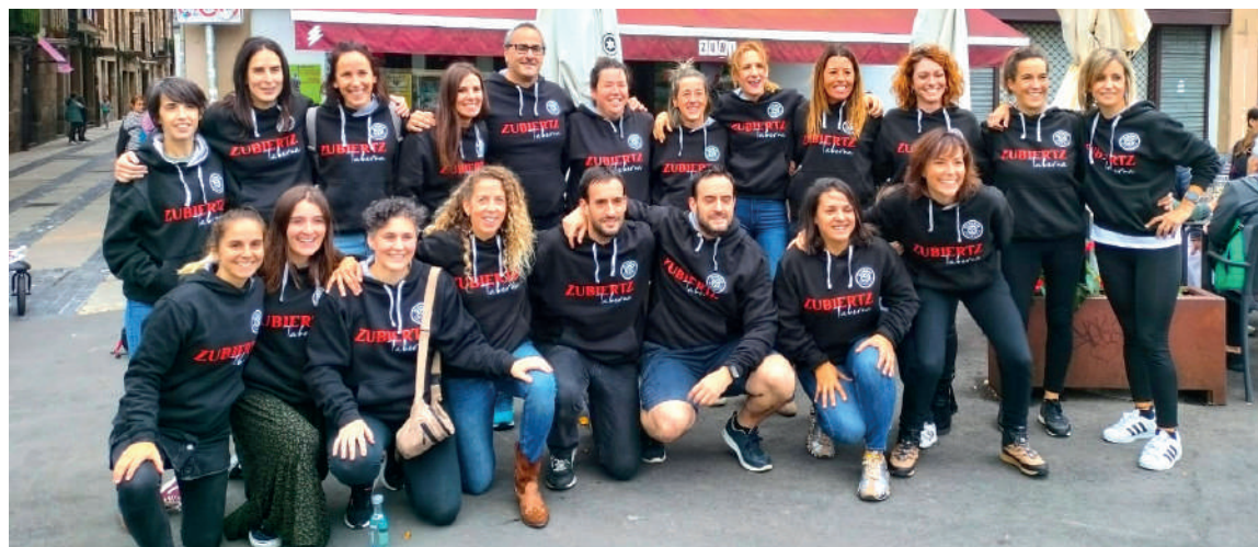
Elorrio Txantxibiri Eskubaloi Klubeko jokalarien familia argazkiak.