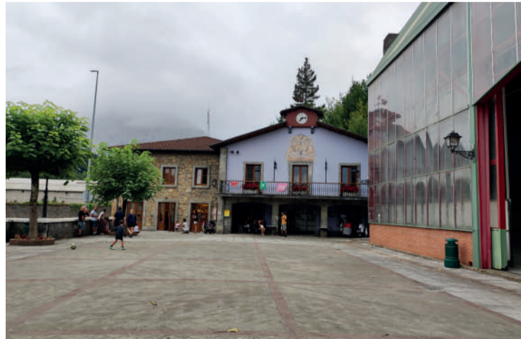
Batzarra Izurtzako udaletxean izango da.

dute berbegai. Herriaren egoera zein den aztertzeko eta etorkizunera begira herria hobetzeko egin daitezkeen proiektuen gainean berba egiteko aukera egongo da. Izurtzako Udaletik dei egin diete izurtzarrei bileran parte hartzeko eta euren proposamenak adierazteko.