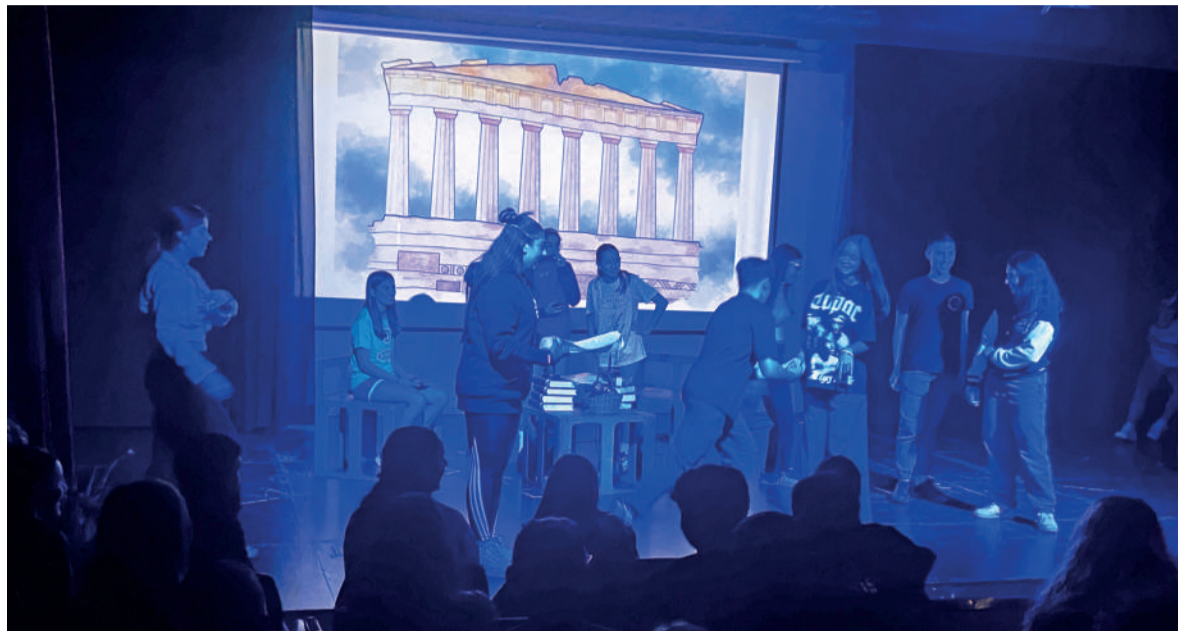
Ikasleek asteleheneretik eguaztenera egin zituzten entseguak. Obra egunean taularatu zuten.

Durangoko Institutuak lau herrialde horietatik etorririko 24 ikasle eta 20 irakasle hartu ditu Erasmus programaren barruan. Jasangarritasuna oinarritzat hartuta, obra bat osatu dute. Nazioarteko ikasleak domekara arte egongo dira Durangon