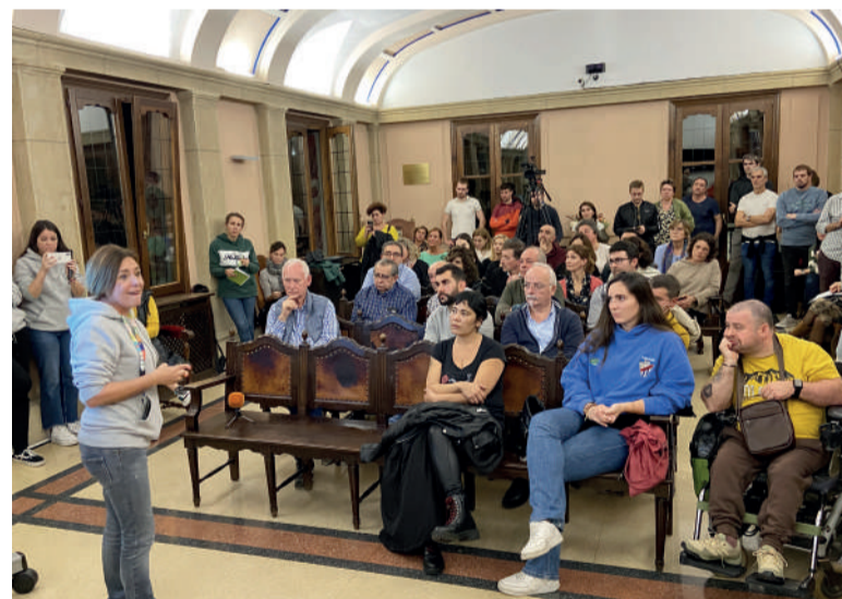
Eguazten iluntzean jaialdi benefikoa aurkeztu zuten Durangoko udaletxean.

du oinarri. Ikastetxeetako ikasleekin eginiko 5 kilometroko martxa, ile-mozketa solidarioak, jokoak eta eskulanak, tonbola, errifak, hezur-muina emateko postua, kontzertuak eta txosnak. Antolatzaileek "egundoko ekitaldia" egitea gura dute. Baturiko dirua elkarteak martxan dituen proiektuak diruz hornitzeko eta ume onkologikoen bizi kalitatea hobetzeko izango da