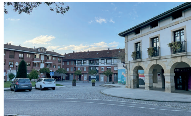
Abadiño kale bateko argazkia.

Abadiñoko Udalean jaso dituzten 509 proposamen horiek 252 lagunek egin dituztela azaldu dute