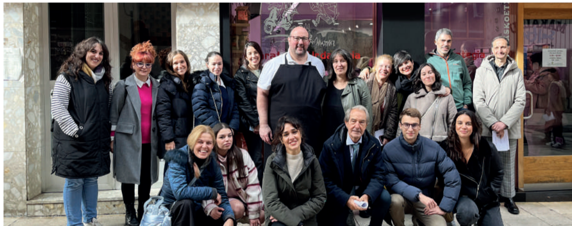
Bisitako geldialdiari buruz, Olabegojeaskoetxea harategian.

Arabatik, Bizkaitik eta Gipuzkoatik etorritako hamar saltokitako ordezkariak egon ziren