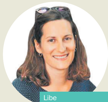
Libe Mimenza Castillo Kazetaria

Beste peaje bat, bidesariz betetako eguneroko digitalean. Ezinezkoa da honezkero sarera konektatzen garen aldiro norbere datuekin negozioa egin nahi duen bilauren bat parean ez aurkitzea. Ezinezkoa da, kontrakoa posible bihurtzeko ariketa diseinatzen eta esperimenduak praktikan jartzen hasi arte behinik behin.