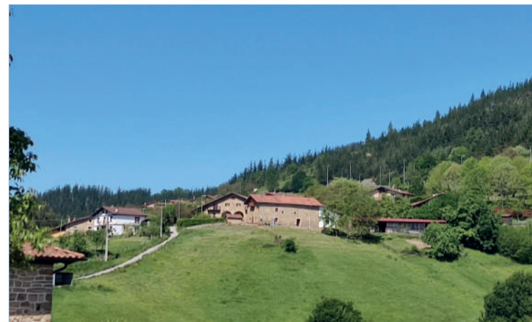
Guztira, hamar auzotako bizilagunekin batu dira, lau batzarretan banatuta.

Aurreko egunetan, Goita, Geera, Arandoño, Beranonagusia, Beranotxikia, Areitio, Aitx, Osma, Zengotita eta Hiriguneko auzoetako bizilagunek euren kezkek eta iradokizunak helarazteko aukera izan dute.