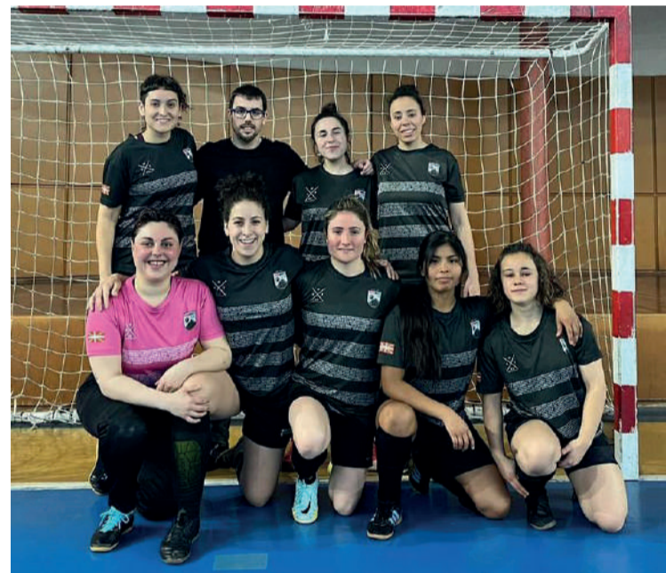
Mendibeltz areto futbol taldea.

Interesa dutenek bide bi dituzte klubagaz hartu-emanetan ipintzeko: Instagram kontua (@mendibeltz KT) eta helbide elektronikoa: mendibeltz05@gmail.com .