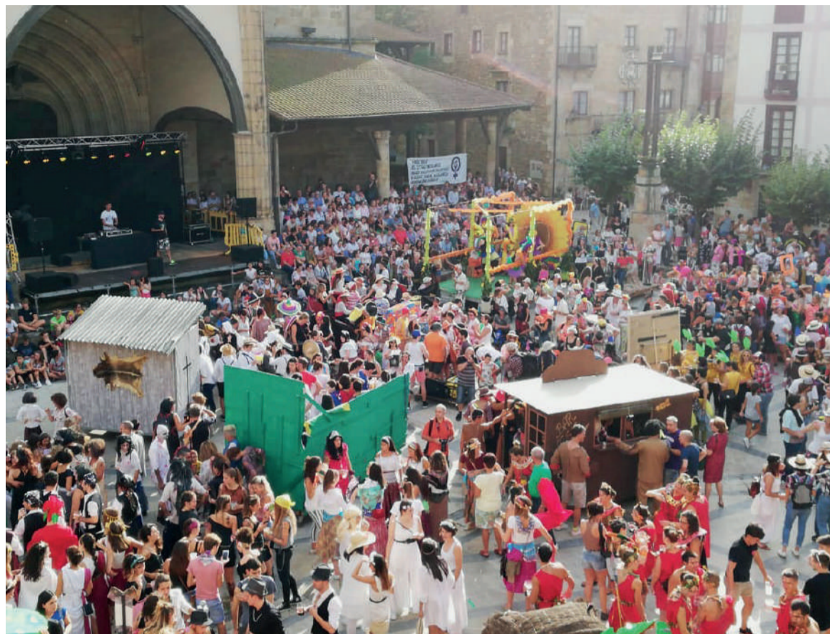
Mozorro Eguneko irudia.

Jai parekideak lortzeko bidean, informazio gune bat ipiniko dute gaur (irailak 1), Elorrioko plazan, 18:00etatik 21:00etara. Elorrioko Udaletik jakinarazi dutenez, erasoen kontra egiteko materiala eta informazioa egongo dira herriarren eskura. Gainera, udaleko