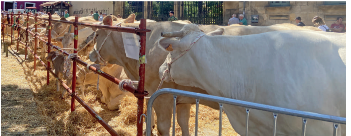
Iazko abelburuen postua Elorrioko azokan.