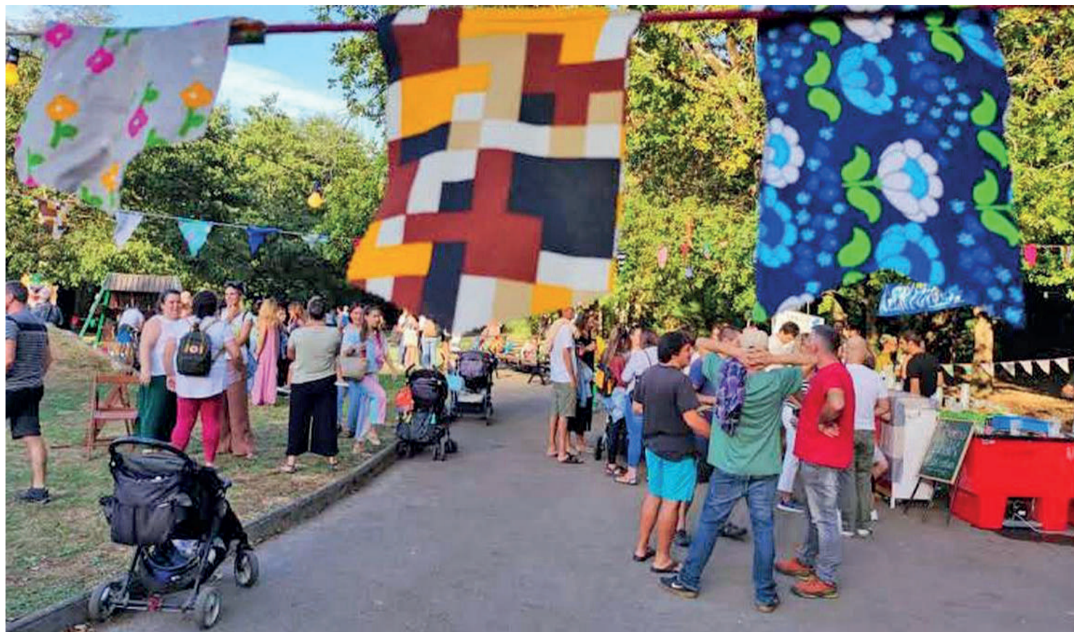
Iazko Gertufest jaialdiko irudia.

Gertufest jaialdiaren bigarren aldia egingo dute Santo Tomas parkean, eta iaz baino egitarau zabalagoagaz dator