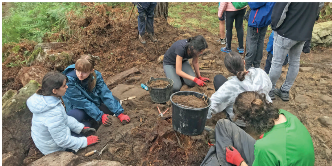
Maumeko Auzolandegietako argazkia.