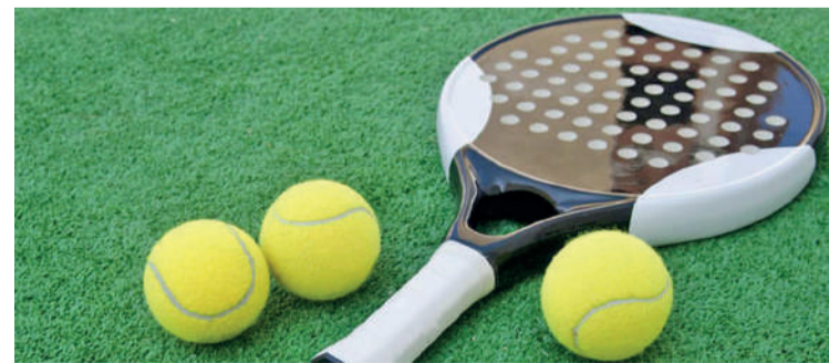
Txapelketan erabiltzen diren padel batzuk eta txapelketaren egoera.

ruan haur eta gazteenak, irailaren 22koan gizonenak eta irailaren 29koan emakumeenak. Azken fasea urriaren 20ko asteburuan da. Izen ematea inforpadelzaleak@gmail.com helbidean egin daiteke.