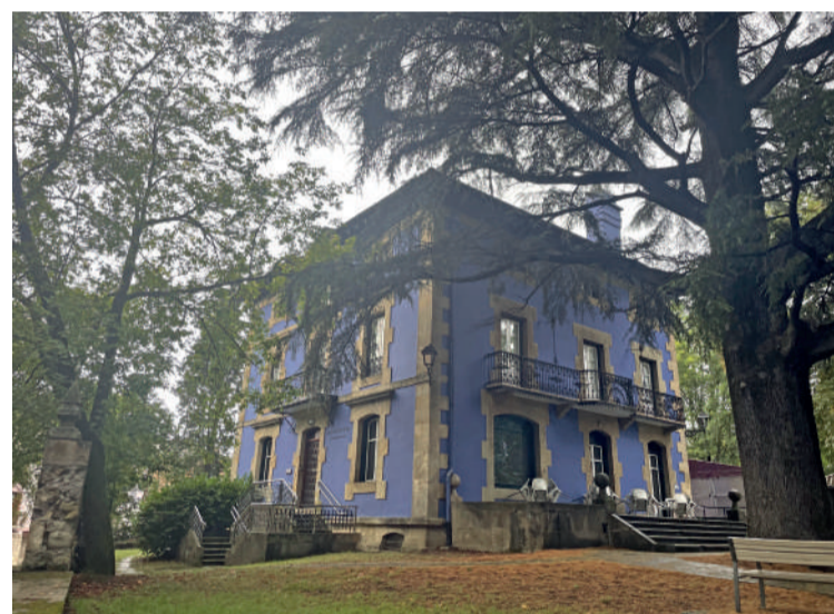
Gizakatea Aldatsekuan hasiko da.