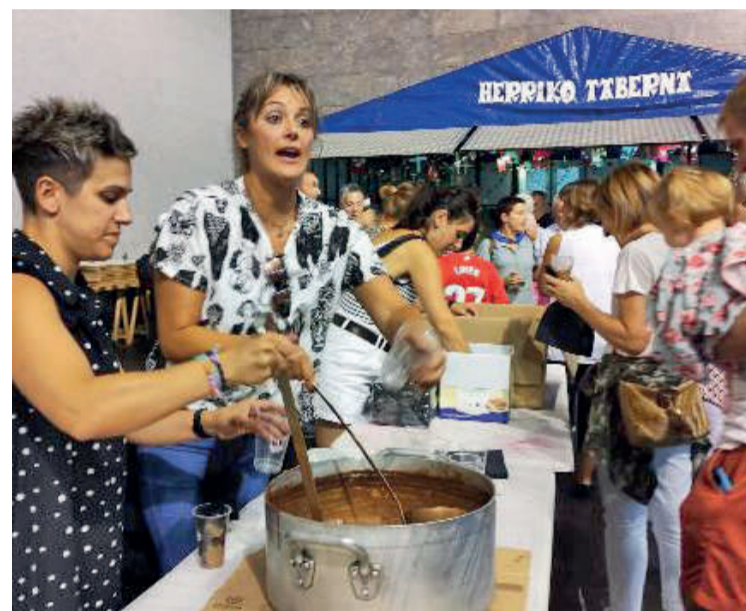
Eubako jaietan egindako ekitaldi bat.