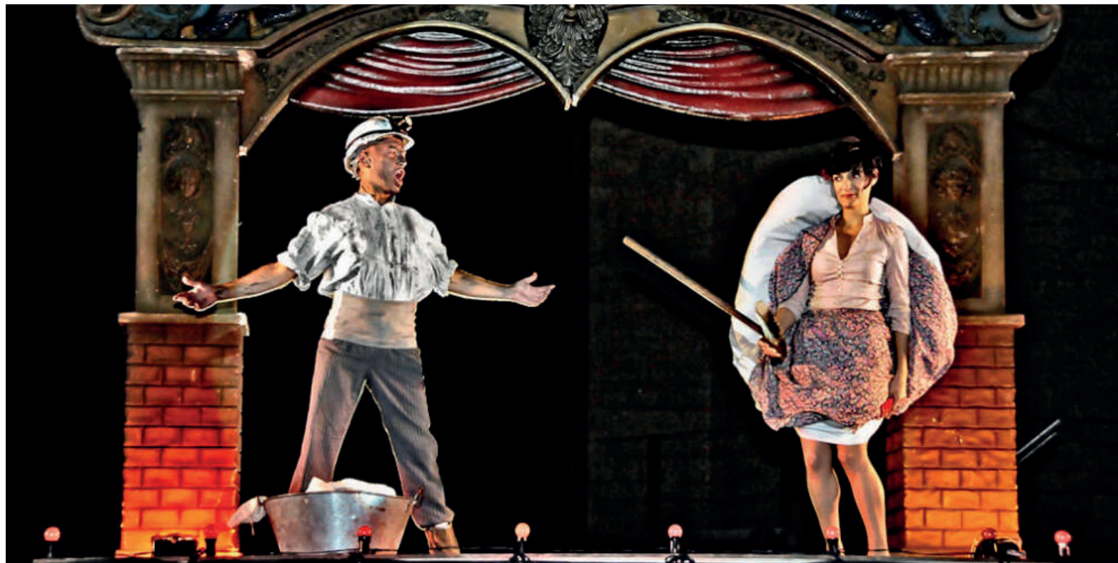
Markeliñeren 'Carbon club'.

Durangoko San Agustin kulturgunea 25 urteko ibilbidea ospatzen ari da aurten. Mende laurdeneko jarduna gogoratu eta indarrak hartzeko, ekitaldi sorta berezia antolatu dute urte osorako. Oraintsu, urtea amaitu bitarteko egitaraua