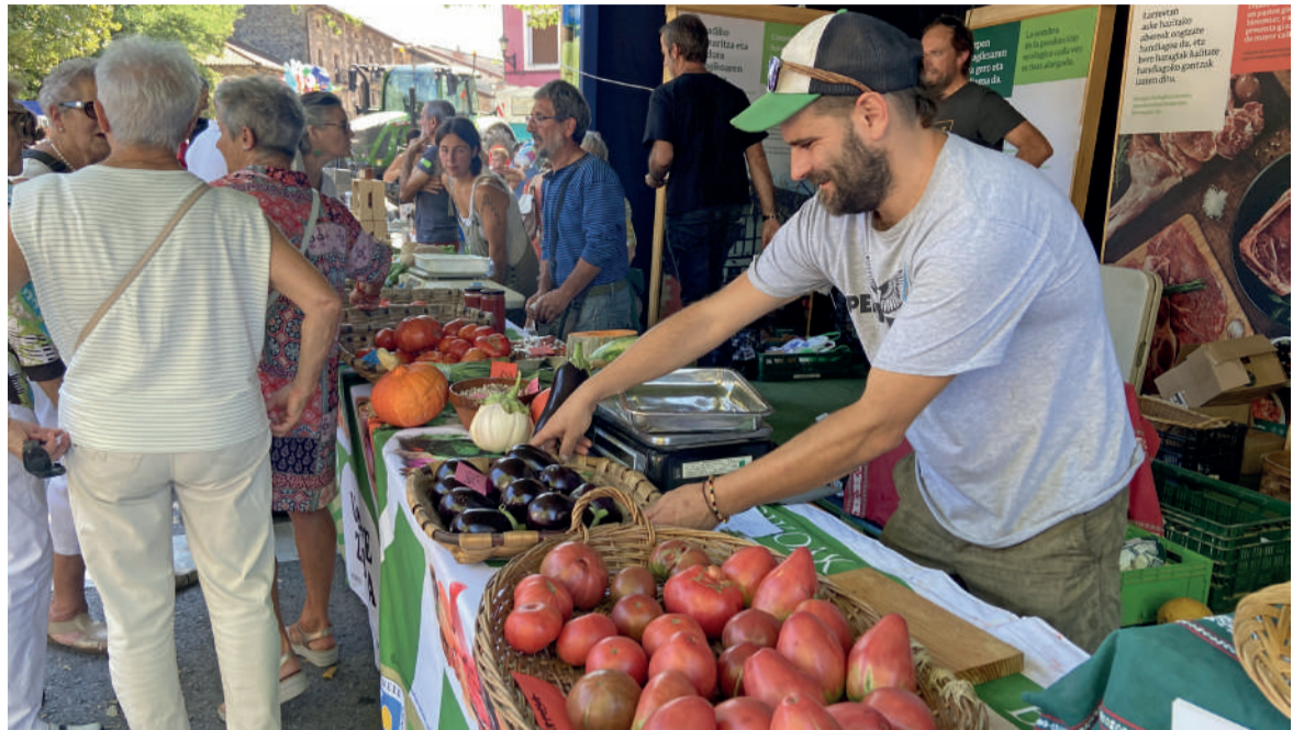
Berrizko baserritarren postua iazko Ferixa Nausikoetan.

Azoka eguna behar den moduan amaitzeko, Correfoc Drakonia ibiltaria arituko da Elorrioko kaleetan, 22:30ean hasita.