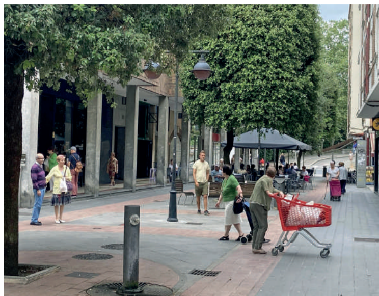
Jardunaldiak hile bakoitzeko lehenengo egunean egingo dituzte.

Sariketara hautagaitzak aurkezteko epea irailaren 18n amaituko da. Horretarako, eskaera erregistratu beharko da Herritarrentzako Arreta Zerbitzuaren bitartez edo Durangoko Udalen egoitza elektronikoaren bitartez. Ondoren, bozketa fasea helduko da. Irailaren 21etik aurrera aktibatuko da. Durango Sarien gala azaroan egitea aurreikusiko dute.