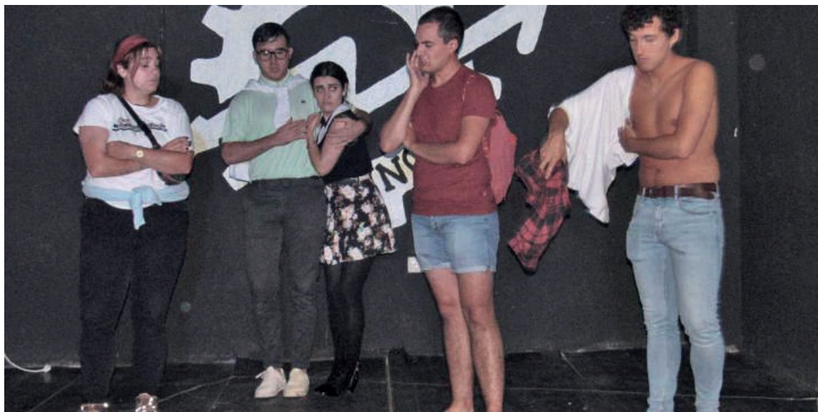
Atara Zarata taldeko kideak, artxiboko irudi batean.