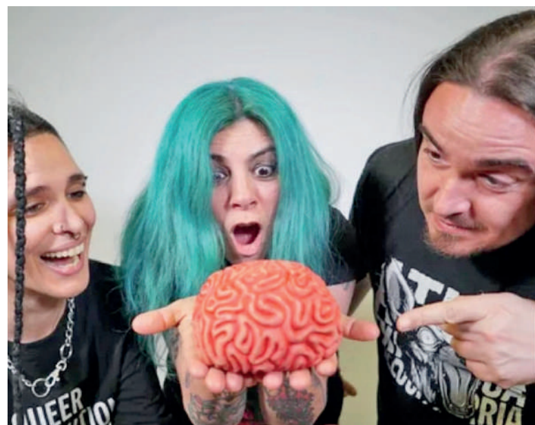
Penadas por la ley taldea.