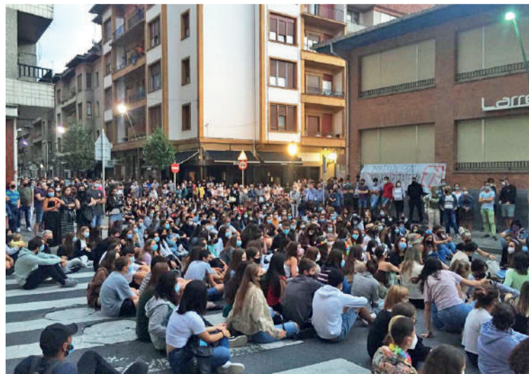
2021eko uztailean, zornotzarrek kalera irten zuten Ionitaren kontrako eraso salatzera.

Baturiko dirua gaztearen errehabilitaziorako erabiliko dute