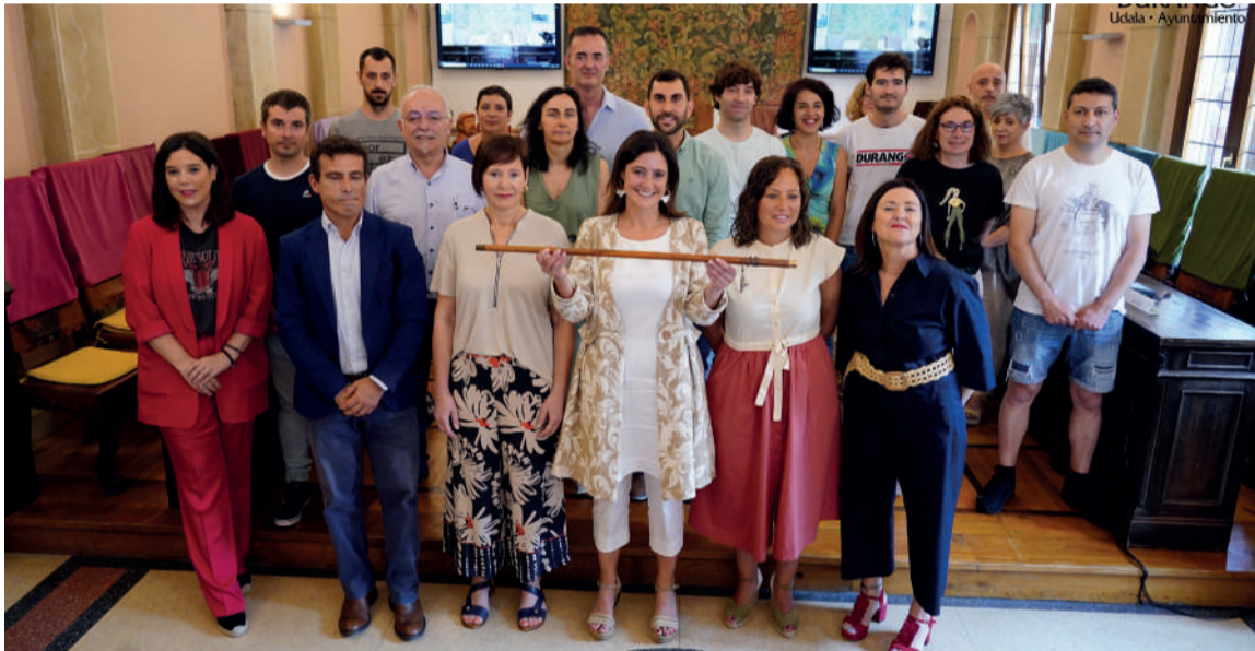
Durangoko udalbatza osatzen duten kideak kargua hartzeko egunean.

Koalizio subiranistak egindako beste kritika bat zinegotzien liberazioetan oinarrituta dago. EH Bilduk dioenez, "gastu publikoa 300.000 euroan handituko da". Gobernu taldeak, baina, gezurtatu egin du hori. Liberazioetarako diru publikoa "27.897 euro baino ez da handituko", euren esanetan. Gobernu taldeak zazpi ordezkari ipini gura ditu soldatapean lanean. Gobernu taldeko lau eta oposizio alderdi bakoitzeko bat.