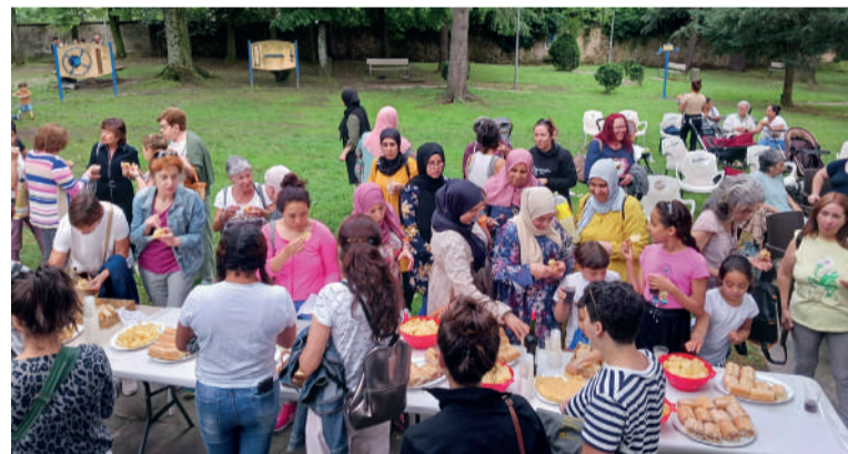
Joan zen egunean egindako jaiko argazkia.

Emakumeen arteko sareak ehuntzea izan da helburua