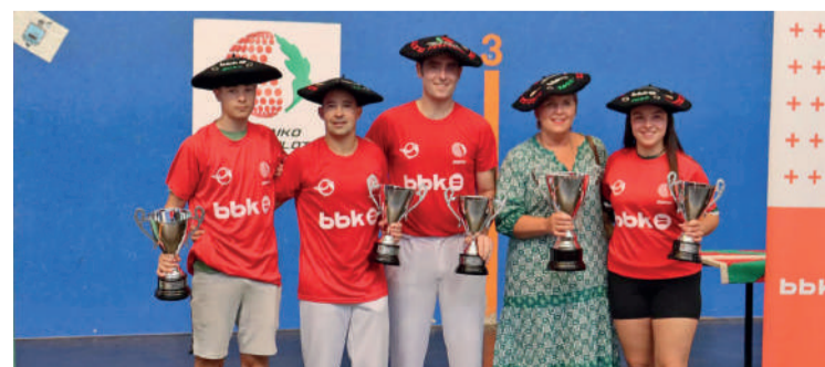
Elorrioko pilotariak Bizkaiko herri arteko txapelketako txapelak jantzita.