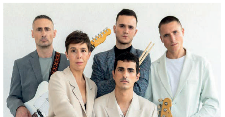
Zea Mays eta Bulego taldeak.