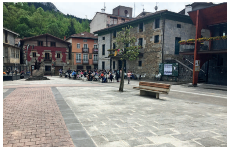
Lehiaketa mota bi daude, irekia eta soziala.

Arrateko Tiro Pichon jatetxean lagun birentzako bazkaria eta Gold serial kutxa bat jasoko ditu. Bigarren eta hirugarren sailkatuek 80 eta 70 euro jasoko dituzte hurrenez hurren, beste hainbat sarigaz batera. Laugarrenetik hogeita bigarreneira geratzen direnentzat ere egongo dira sariak. Lehiaketa sozialean lehenengo lauren artean geratzen direnek jasoko dute saria.