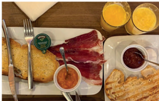
Xiberu tabernan bi pertsonentzako gosaria. Zornotza.

*Zozketa hauetan parte hartzeko eman izena gure webgunean.