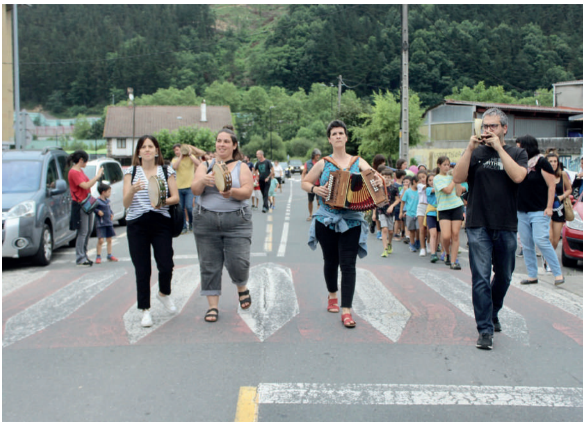
Eguaztenean eman zieten hasiera Apatako jaiak.

Domekan emango diete amaiera jaiak. Goizean, 11:00etatik 14:00ak arte artisau eta nekazari azoka egongo da. Eta iluntzean txopoa bota eta txokolata da egingo dute.