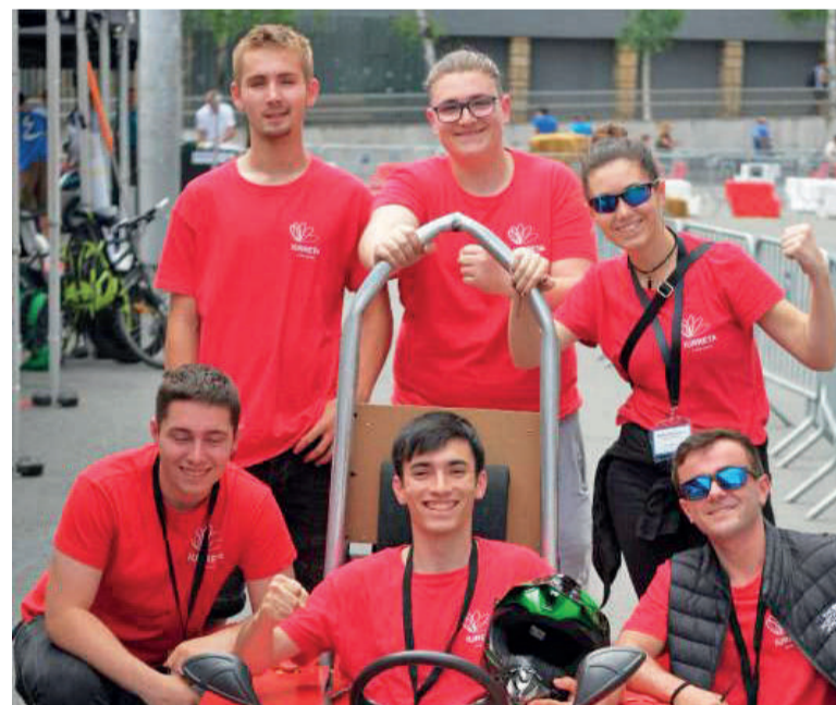
Erresistentzia proban seigarren geratu ziren.

ekimeneko esatariak, kolorean duen antzekotasunagaitik. Baina errendimenduarengaitik ere izan zitezkeen, proba batean baino