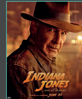
Zugaza zinemaren, ekainaren 30etik uztailaren 5era bitartean.