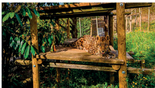
BBK Karpin Faunarako bi sarrera bikoitz.