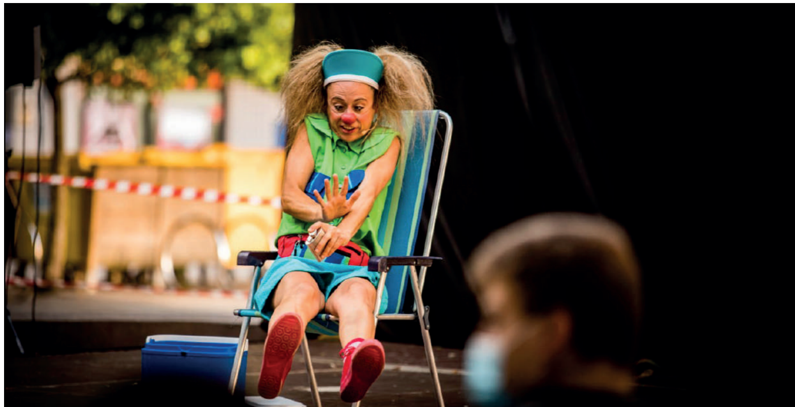
Festa Clown 2021.