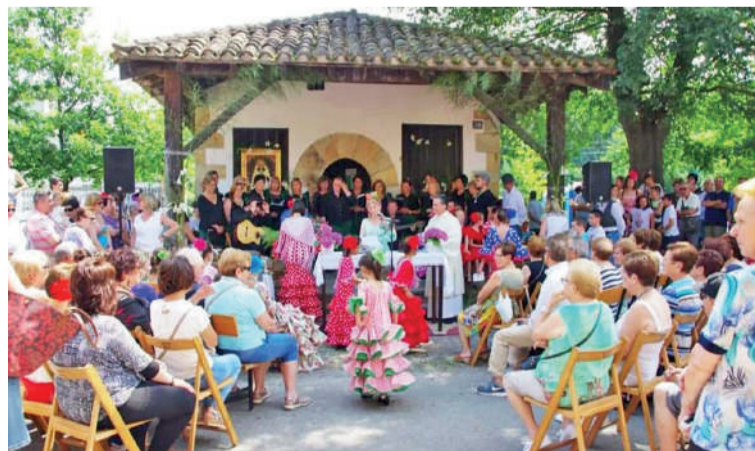
'El Rocío' jaiko arxiboko irudia.

Uztailaren 1ean 'Rocío' jaiak ospatuko dute Abadiño, Astolan. De Norte a Sur taldeak egun osoko egitaraua antolatu du zapatarako. Txupinazoagaz emango diote hasiera egunari, 12:15ean, eta, horren ondoren, pregoia, rocio meza, ohorezko rebujittoa, 'Azahar' kontzertua, herri bazkaria eta De Norte a Sur dantza taldearen saioa egongo dira, besteak beste. 20:00etan disko-festa egongo da, Onda Futuraren eskutik.