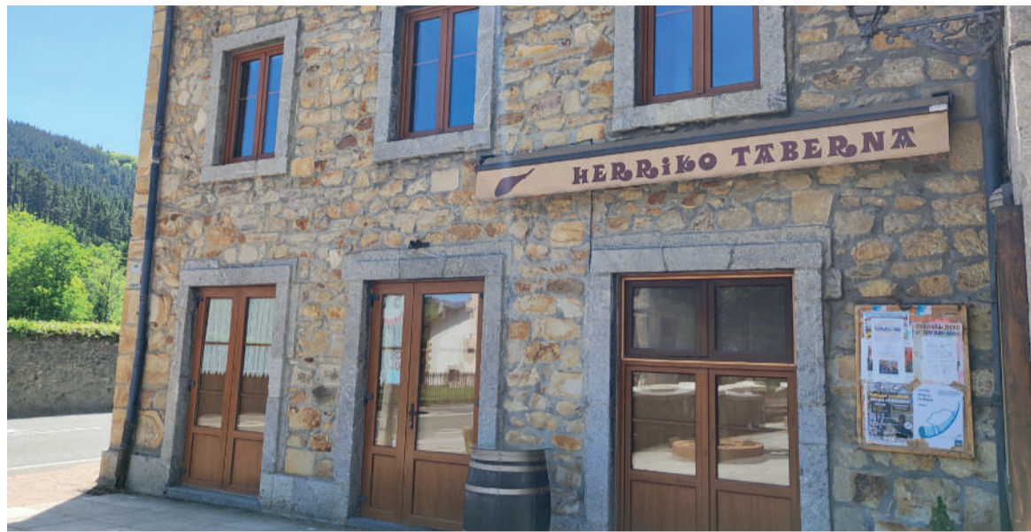
Izurtzako Herriko taberna.

"Oraindino sinestu ezinda nago. Gerente moduan lan egindakoa naiz, baina sekula ez dut izan nirea zen negozioirik. Pozik,