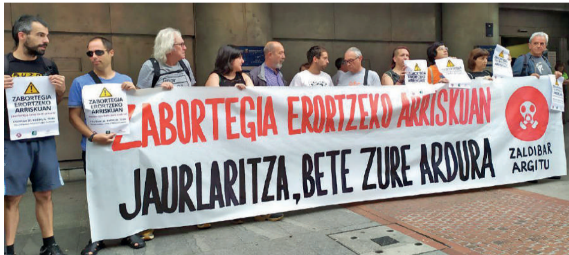
Zaldibar Argituk astelehenean Bilbon egindako elkarretaratzea.