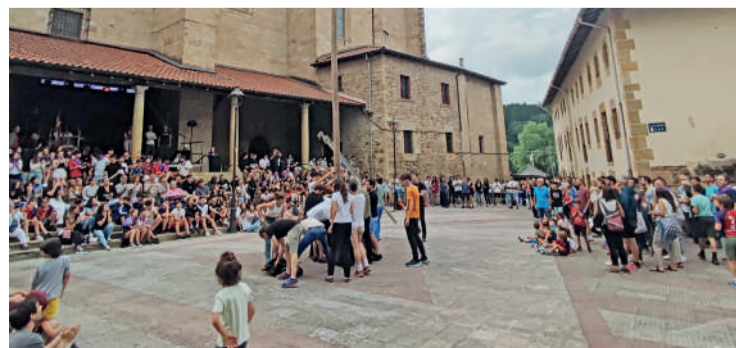
Donien Atxa jasota hasi zituzten jaiak, eguaztenean.

ekitaldirik jendetsuenetarikoa izango da: paella txapelketa. Eta arratsalderako kuadrillen mozerro jaitsiera antolatu dute. Zapatu gauean kontzertua egongo da, Feline eta Flash musika taldeekin. Ondoren, DJ Pary & Tizak girotuko du gaua.