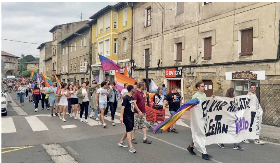
Eguazten arratsaldean manifestazioa egin zuten Abadiñon.