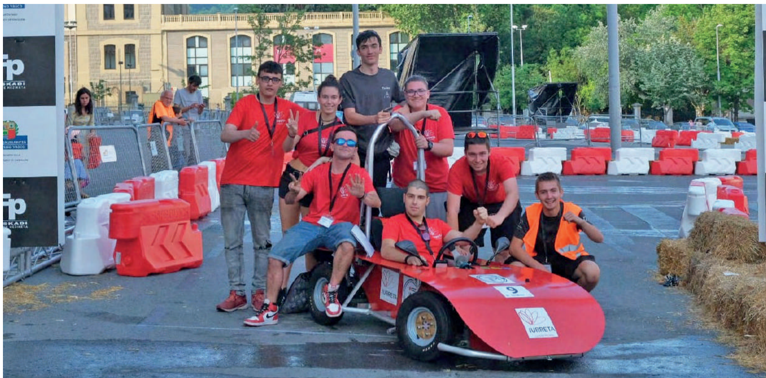
Iurretako Lanbide Heziketako gazteak Bilbon egindako proba dinamikoetan, euren egindako auto elektrikoagaz.