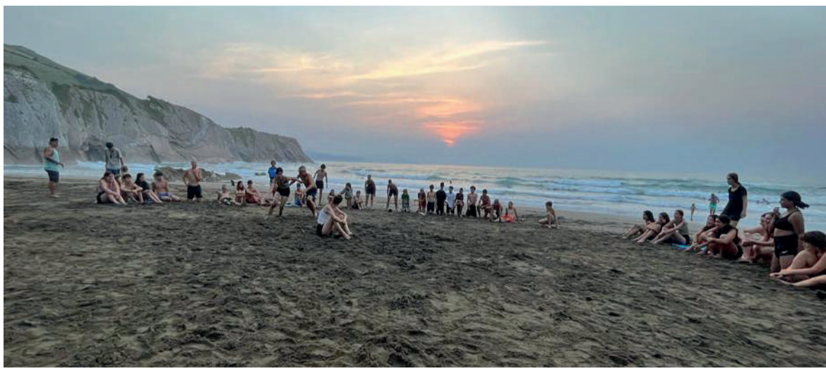
Udaleku ibiltarien ibilbidea aldatu egiten da urtero.