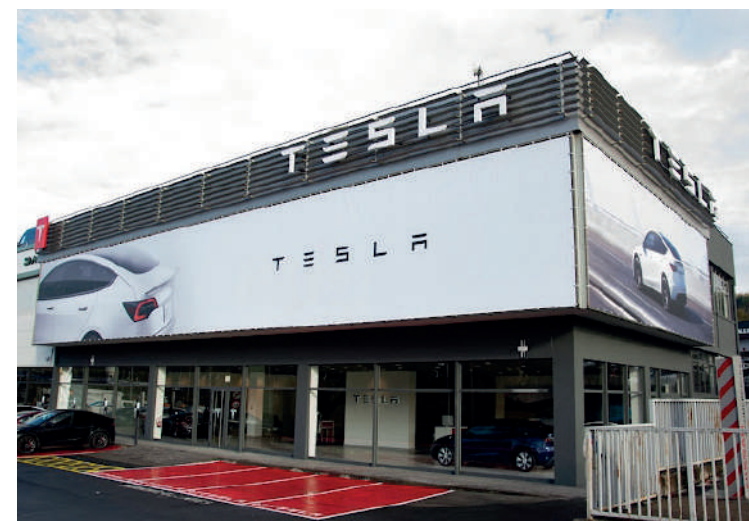
Gidatze-probak egiteko informazioa eskatu daiteke Tesla Center berrian.

Zerbitzu hauek batzen dituen Teslaren lehenengo zentroa da Euskal Herrian. Espainian bost daude.