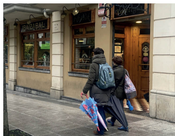
Ibaizabal taberna izen bereko auzoan dago.