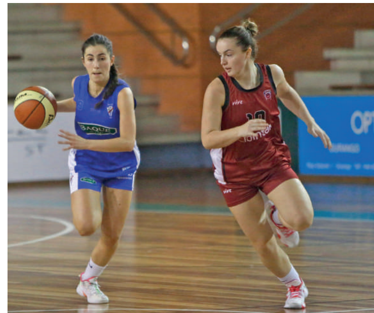
Tabirako neskek zapatuan jokatu dute ligako partidua.

EBA mailan, gizonak Errioxara joango dira zapatuan, orain arteko zazpi partiduak irabazi dituen LBC Cocinas taldearen kantxara. Tabirako-Baqué bederatzigarren dago sailkapenean, hiru garaipen eta lau porrotegaz. Azken neurketa irabazi egin zuen etxean Kantabriako Pielagos taldearen kontra partidu borrokatu baten ostean eta animo biziberrituekin egingo dio aurre mailako oilarrari.