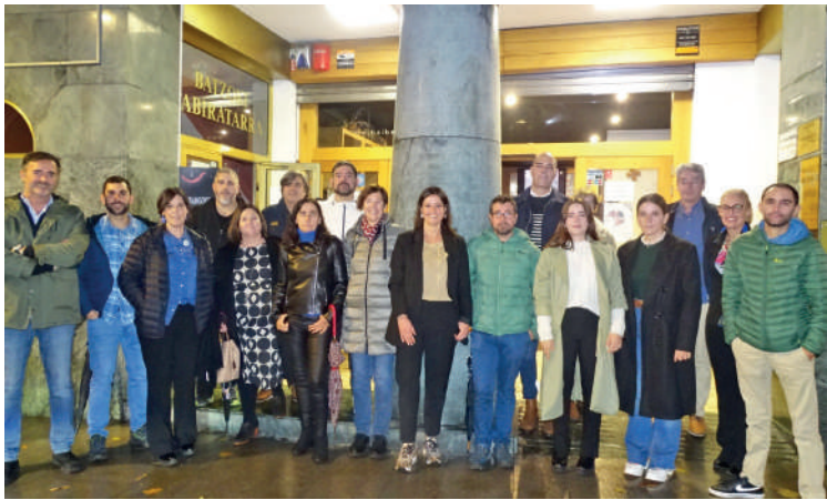
Plazan egurrezko estaldura bat jarriko dute, besteak beste.