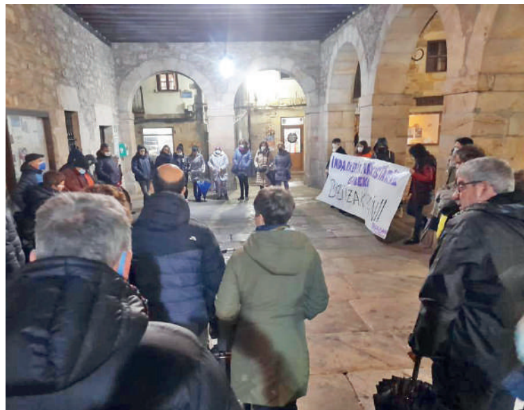
lazko azaroaren 25ean Otxandion egindako elkarretaratzea.

Durangaldeko mugimendu feministek eta instituzioek hainbat mobilizazio antolatu dute herririk herri