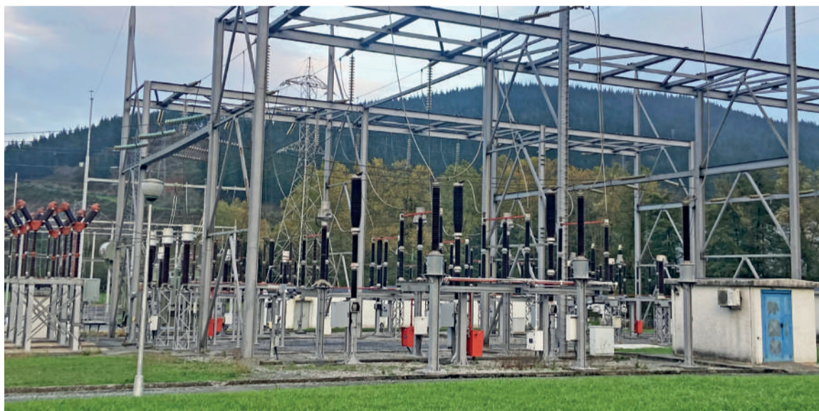
Zentral elektriko bat Abadiñoko San Antolin auzoan.

Horrek guzti horrek bete-betean eragin die eguneroko martxan tipi-tapa dabilzan komertzio txikiei. Ondotxo dakite honako hau: urruti dituzte energia garestitzearen faktoreak, baina etxe barruan itolarria igartzen dute. Horregaitik, kalera irten eta mikrofonoa ipini diegu joera makroekonomiko erraldoien aurrean hauskorrak diren komertzioei, zero kilometroa osatzen duten kideei, eskualdeko sare soziala (egiazko sarea, digitala ez dena) osatzen dutenei.