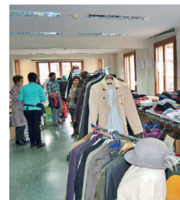
Kultur etxean egingo dute Azoka Solidarioa

Abenduaren 12tik 16ra bitartean VIII. Azoka Solidarioa egingo dute Iurretan. Hasi dira azokarako objektuak batzen. Jostailuak, bitxiak, arropa, dekorazio elementuak utzi daitezke, besteak beste, Ibarretxe kultur etxean. Abenduaren 2ra bitartean batuko dituzte donazioak, 09:00etatik 13:00etara eta 15:30etik 20:00etara. Azokan baturiko dirua JAED gizarte laguntza elkarteari emango diote.