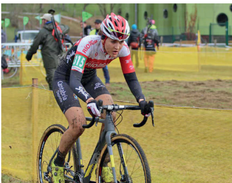
Abadiñoko ziklo-krosak zortzigarren aldia egingo du aurt.

Domekan, kadeetatik master mailara artekoen txanda izango da. 09:30ean, master mailako