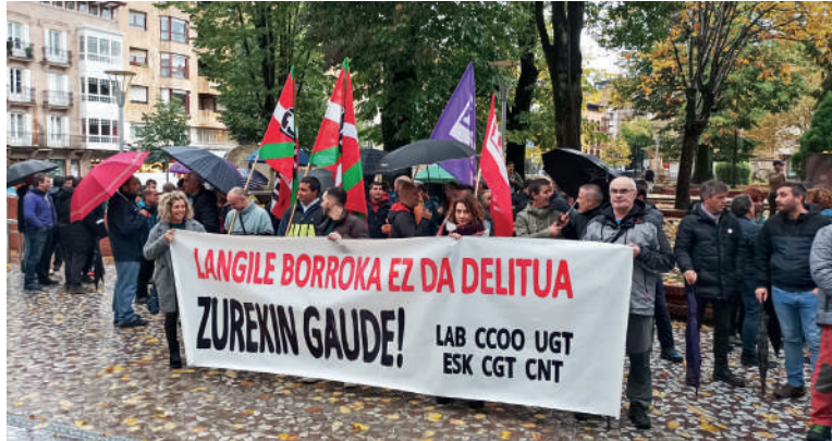
Sindikatuek babesa aderazi zioten grebetan zehar inputatutako behargin bati.

Metalgintzako ituna berritzeko negoziatioek huts egin dutela eta, sindikatuek beste bost greba egun antolatu dituzte. Astelehen honetan ekingo diete lanuzteei, abenduaren 2ra arte. Sindikatuen esanetan, FVEMek ez die "borrokan jarraitzea beste aukerarik utzi", orain arteko proposamenek "ez dutelako eros ahalmena bermatzen" eta patronalak "uko" egin diolako "langileen lan baldintzak hobetuko lituzketen bestelako