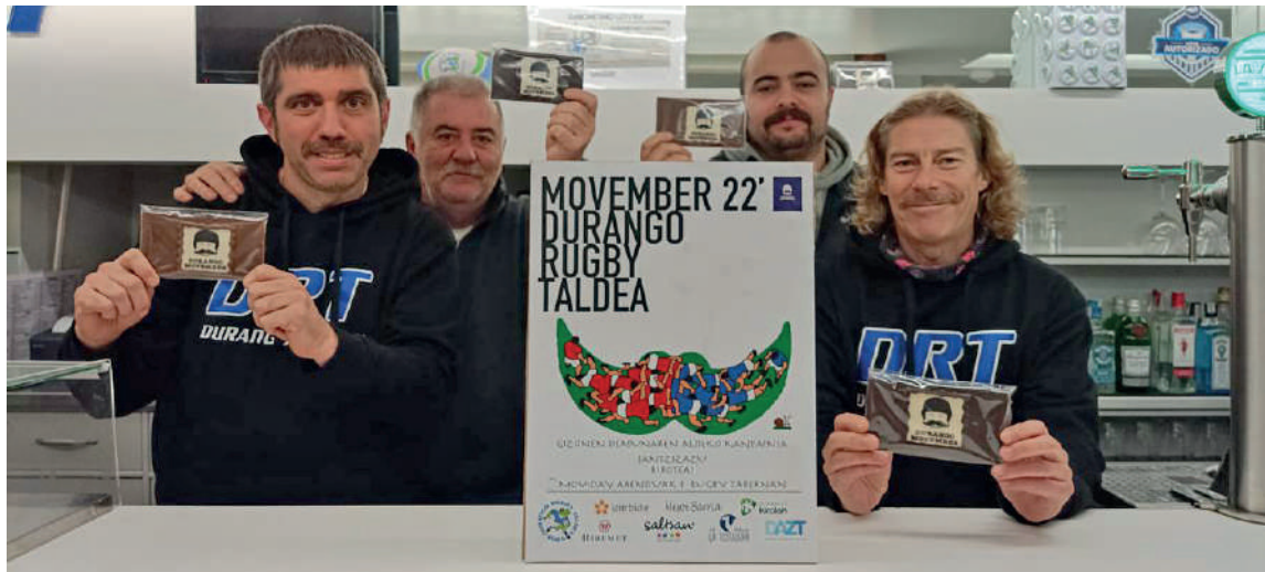
Ekimeneko sustatzaileak txokolate tabletekin, Rugby Tabernan.

Durango Rugby Taldeak MovDurango izeneko txokolate tabletak kaleratu ditu