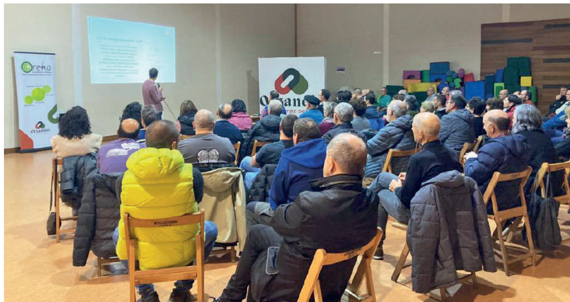
Joan zen astean egindako batzar informatiboko irudia. OREKA

presei aurrekontu zehatzak eskatuko dizkiete. Ondoren, interesdunek ipini beharreko diru kopuru definitiboak kalkulatu dituzte eta orduan izango da baiezeko definitiboa emateko ordua, hurrengo pausoa egitasmorako kapitala ipintzea izango delako.