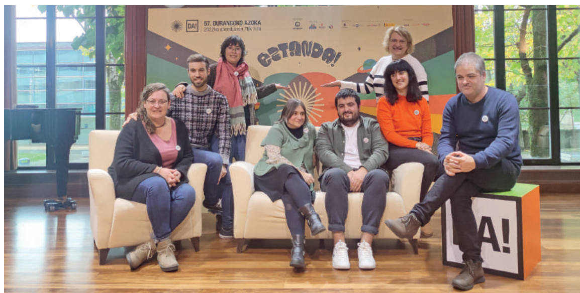
Durangoko Azokako guneetako arduradunak.