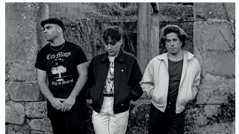
Ezta Ilen taldeko kideak. UNAI URIZAR

Abadiñon Elkartasun Asteburua egiten dabilta. Bihar, esaterako, sokatira ikuskizunagaz emango diote hasiera egunari, 12:00etan. 13:00etan elkarretaratzera egingo dute, eta ondoren trikipoteoa. 14:30ean bazkaria egongo da frontoian, eta gero bingo musikala, argazki eta postal bidaltzea eta karropoteoa. Ainke, Ezta Ilen eta Katuren kontzertuagaz eta DJ Alusegaz emango diote amaiera egunari. Kontzertua 20:00etan hasiko da.