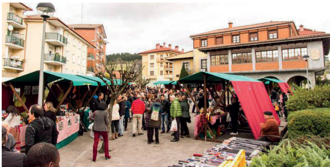
Aurreko azoka bateko irudia.

Domekan izango da jaien plater nagusia: neguko nekazari azoka. Aurtengoa XXIII. edizioa izango da. 11:00etan zabalduko ditu ateak; ordu horretan, Eingou taldeak kalejira egingo du. Ordu horretan hasiko da baita ere arku taldearen ate irekien jardunaldia, Olazarren. Aurtengo San Andres jaiak borobiltzeko, azaroaren 30ean meza eta jubilatuen bazkaria egingo dute; 18:00etan Olazar txapelketako partiduak jokatu dira.