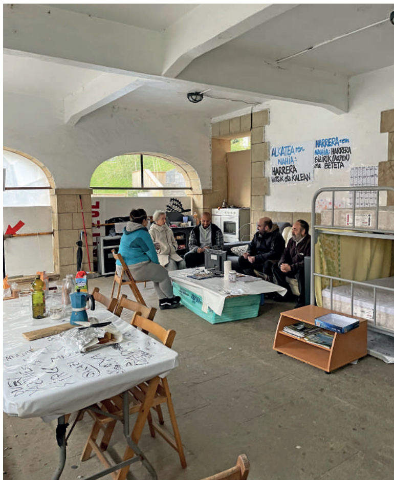
Udaletxe azpian bizitokia muntatu dute.