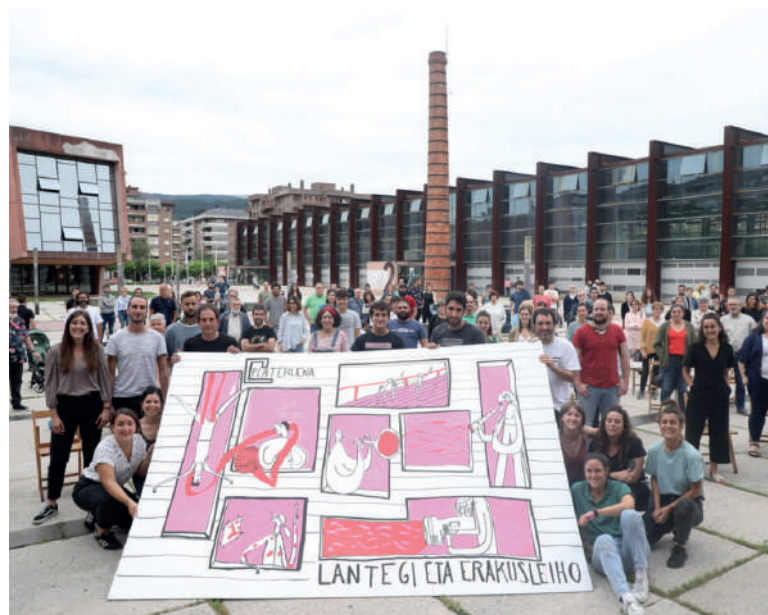
Dinamikaren ondorioen aurkezpenean ateratako argazkia.

Oharraren amaieran, eskerrak eman gura izan dizkiete proposamena osatzeko laguntza eskaini duten guztiei. "Zorte ona opa diogu Plateruena berriari, espero dugu euskal kultura sustatzeko lekua izatea, komunitate bat sortzeko gaitasuna edukitzea eta gune euskalduna izatea", gaineratu dute.