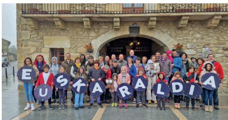
Garaitarrek joan zen domekan atera zuten argazkia.

Garaiko bizilagun talde batek familia argazkia egin zuen domekan, egitasmoagaz bat egin dutela adierazteko