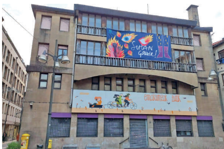
Correoseko eraikin zaharra udaletxearen parean dago, Durangoko Alde Zaharrean.