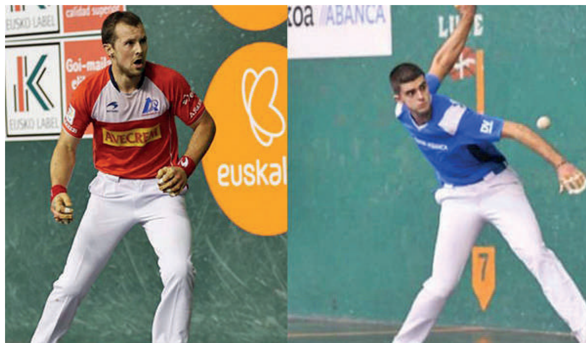
Elordik orain sei urte debutatu zuen profesionaletan eta Morgaetxebarriak aurtengo uztailean debutatu du.

teko abonua edo sarrerak entradasfronton.com web orrialdean eskuratu daitezke jadanik. Zornotzan ere erosi daitezke, Urtza Tabernan eta Venecia Kafetegian.