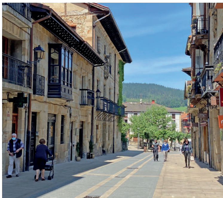
Berriotxoa kaleko argazkia.