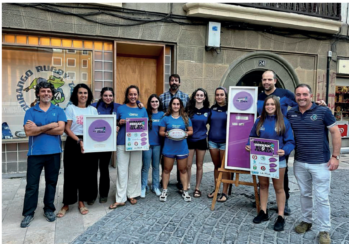
DRTko jokalariek eta ordezkariek, eta Durangoko udal arduradunak aurkezpenean.

La Salve Garagardoak da torneoko babeslea, eta Durangoko Udala, Durango Kirolak, Aldundia eta Jaurlaritzak laguntzaileak.