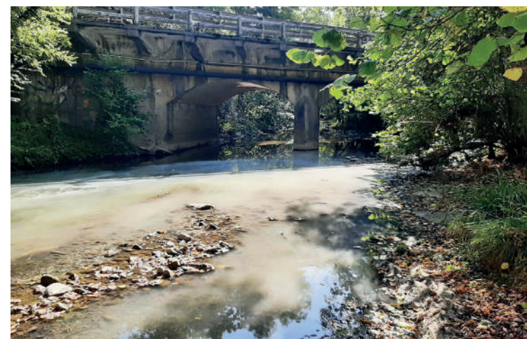
Zelaieta eta Astola arteko zubia.

Proiektua jasota dagoen arren, "udal gobernuak obra esleitzeko prozesua oraindino ez duela hasi", kritikatu dute.