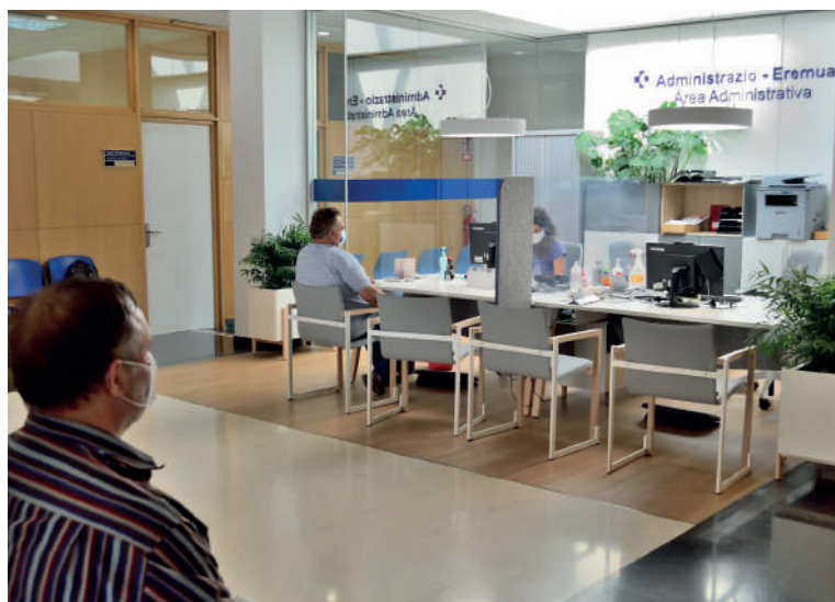
Iurretako osasun zentroak inguruko 4.355 pertsonari ematen die arreta.

Osakidetza ohiko mostradoreak kendu eta mahaiko arreta guneak ipini ditu, arreta "hobetzeko"