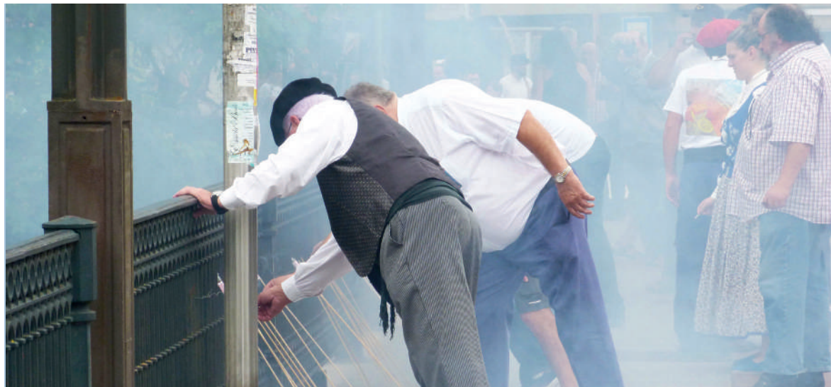
Jaien hasieran hainbat txapligo jaurtitzen dute Montoiko zubitik.