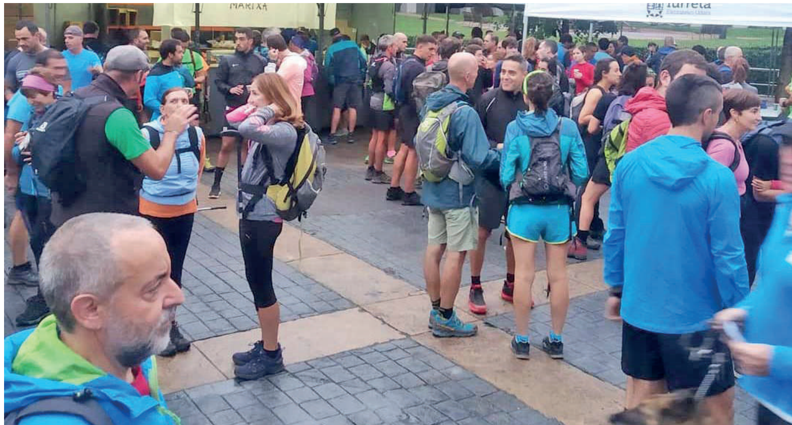
Betiko moduan, mendi martxak Iurretako plazatik irtengo du, 08:30ean.

Urte biko parentesiaren ondoren, Iurretako mendi martxa bueltan dator, domekan, ibilbidean moldaketa txiki batez