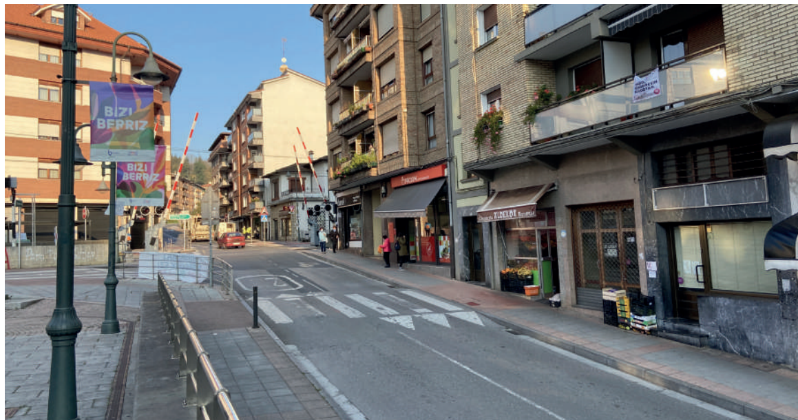
Irailaren 12an hasi zuten Harraskatu eta irabazi! kanpaina.

deskontu txartela zozkatuko da gainera. Kanpaina hau urriaren 11n amaituko da (edo lehena-go, bonuak amaituz gero), eta aste bete geroago egingo dute zozketa.