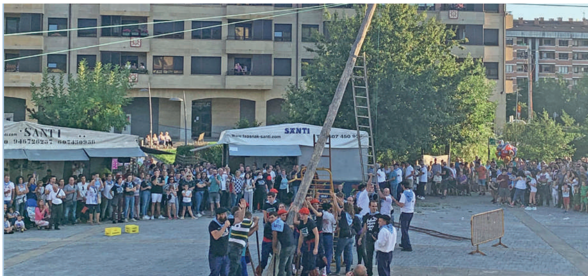
Donien Atxa Iurretako plazaren erdi-erdian jartzen dute.