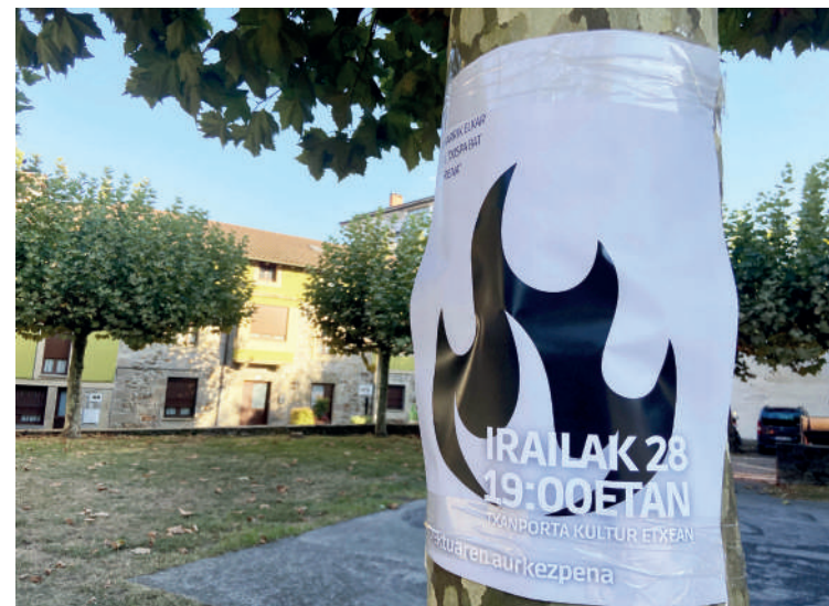
Aurkezpena iragartzeko kartel bat, Zelaietan.

egitasmoaren bultzatzaileek, eta datorren eguaztenean emango dituztela proiektuari buruzko xehetasun guztiak. Proiektuak "bidelagunak" behar dituela azpimarratu dute, eta, alde horretatik, herritarrak aurkezpena deitu dituzte, eta "bakoitzak gura eta ahal duen ekarpena" egitera.