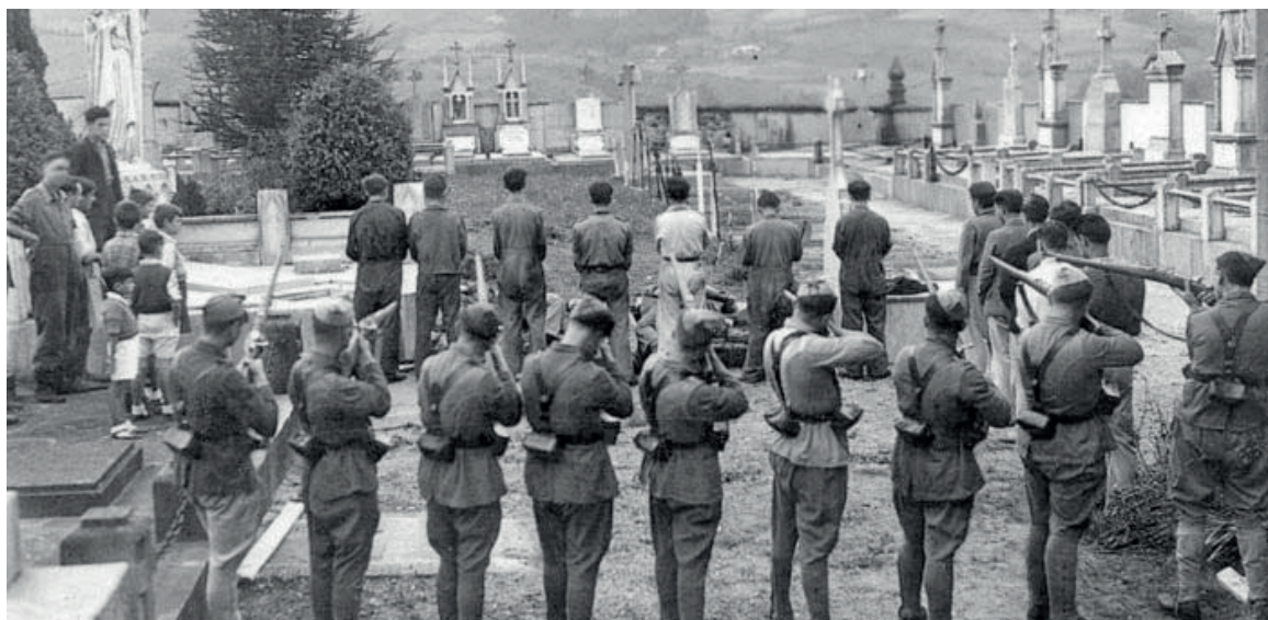
Fusilamenduaren errekreazioa izan daitezkeen argazkia. GEREDIAGA ELKARTEA

daude. Data batean kokatzekotan, argazkia 1941a baino lehenago aterata egon behar dela dio Irazabalek, kapera zaharra agertzen delako, eta ondoren berriztu egin zutelako. Irazabalek azaltzen duenez, interesgarria izango litzateke udal artxiboa ikertzea, ikusteko 1936tik 1941era Foto Germani enkargurik egin ote zioten jakiteko, Otxandioko bonbardaketan egin zuten legez.