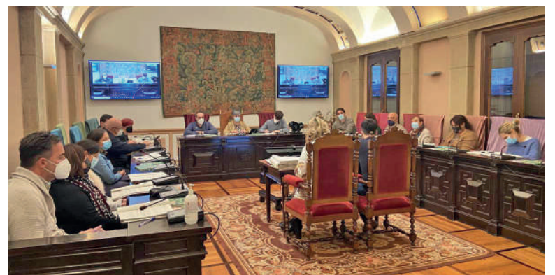
Durango egindako osoko bilkura bat.

pio orokorra" ez dela betetzen gaineratu dute jeltzaleek. "Formalki eskaturiko informazioa ez ematea" eta "tratu-berdintasunaren eta diskriminazio ezaren printzipioa" ez betetzea egotzi dizkiote gobernu taldeari, "aipamenengaitiko esku hartzeak eteteagaitik".