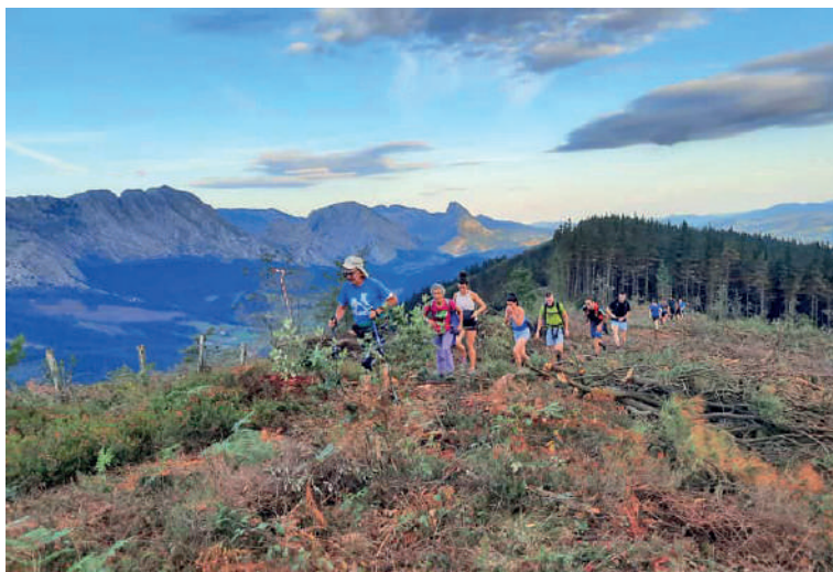
Elorrioko Birako iazko argazki bat.

Bira txikiak ere herriko plazan izango du irteera puntua; kasu honetan, 9:00etan, eta Aldape, Erdella eta Berriozabaletatik igaroko dira, besteak beste, Elorriora bueltatu aurretik.