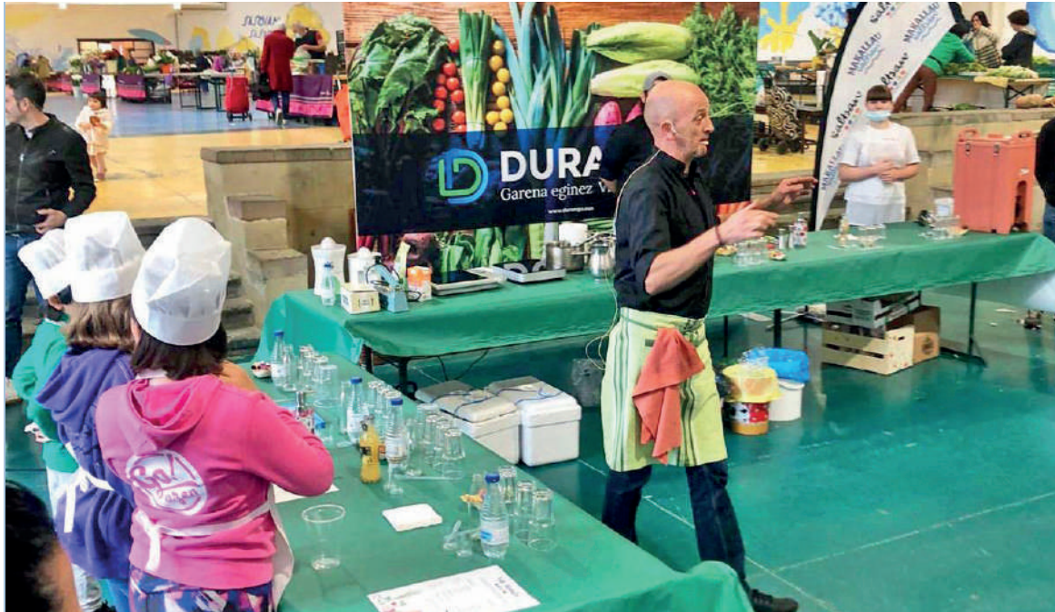
Txorria Nuen Maite tabernako kideek alkoholik bako cocktail tailerra egin zuten umeekin, maiatzean.

Soloko elkarteak eta udalak ekintza sorta aurkeztu dute merkatu plaza biziarazteko. Zapatuan egingo dute lehenengo ekintza, sendabelarrak kozinatzenko tailerragaz