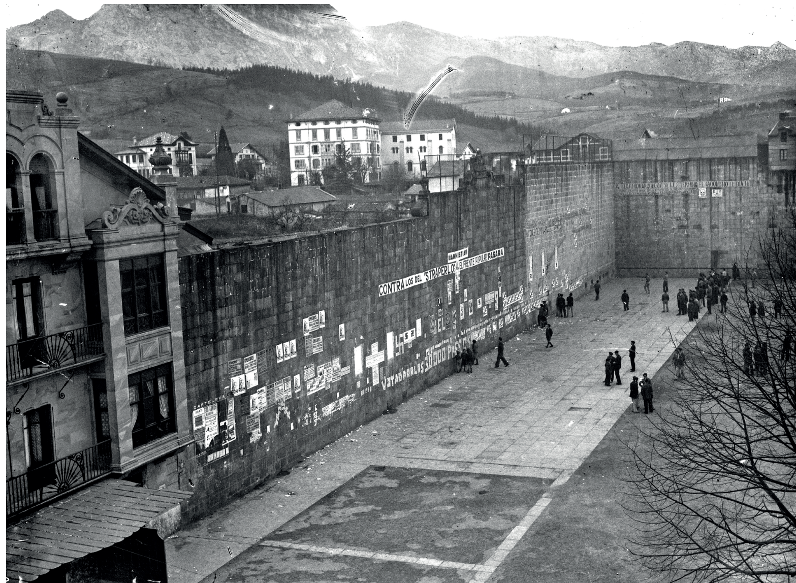
Durangoko frontoi zaharra. GEREDIAGA ELKARTEA

Gerediaga Elkarateak, Durango 1936 elkarteak eta Durangoko Udalak ekitaldi bi antolatu dituzte aste honetarako, "memoria historikoan sakontzen jarraitzeko"