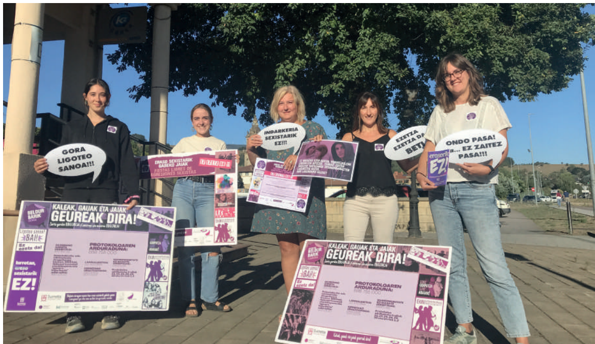
Auskari neska taldeko, Anderebide elkarteko, udaleko eta Jai Batzordeko ordezkariak agerraldia egin dute asteon.

Edozein eraso mota dela eta, erantzun bat ematera dei egin du