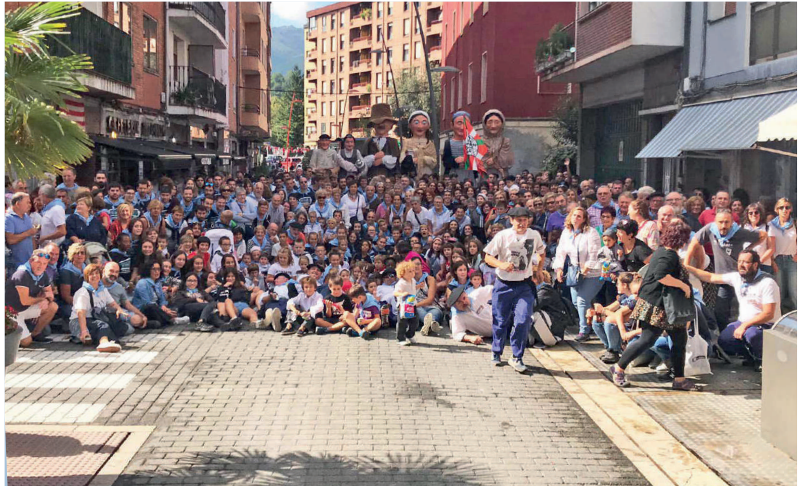
2019ko jaietako familia argazkia.

Nobedade nagusienetariko bat urriaren 2an egingo diren mutil-dantzak izango dira; edozeinek dantza egin dezake