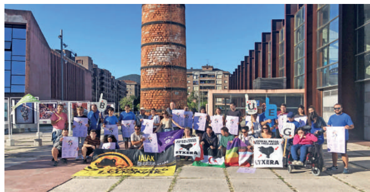
Durangoko txosnen aurkezpena, martitzenean.

Bilgune Feministak 20 urte bete dituela eta, txosnaguneko egitarauari hasiera emango dion txupinazoa elkarte horrek botako du. Urriaren 11n izango da, 20:30ean. Txosnen egitarau osoa anboto.org atarian kontsultatu daiteke.