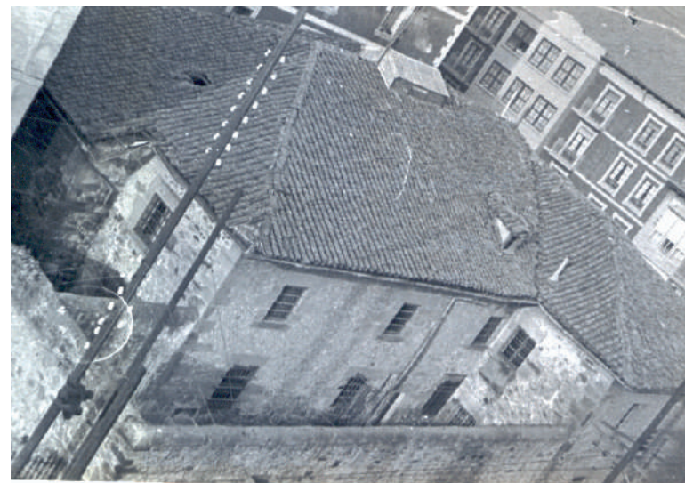
Durangoko kartzela.