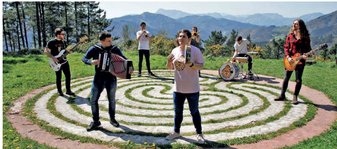
Mugi Panderoa taldeko kideak.

Kulotxako jai hauek Kulotxa auzo elkarteak antolatu ditu, Elorrioko Merkataria Elkartearen eta Elorrioko Udalaren babesagaz, besteak beste.