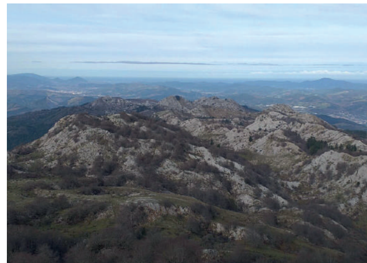
Alpino Tabira mendi klubaren irteerak 53. aldian beteko du aurten.

'Durangaldeko Gandorrrak' izeneko ibilbideak 23 kilometro ditu, eta 1.150 metroko desnibela