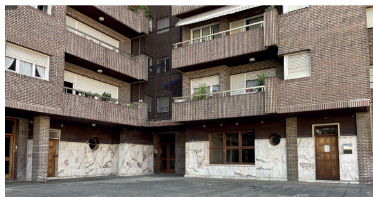
Berrizko adinekoen egoitza.

Adinekoen egoitza berriko obrak lizitaziora ateratu dituzte; lanek 495.000 euro inguruko aurrekontua dute