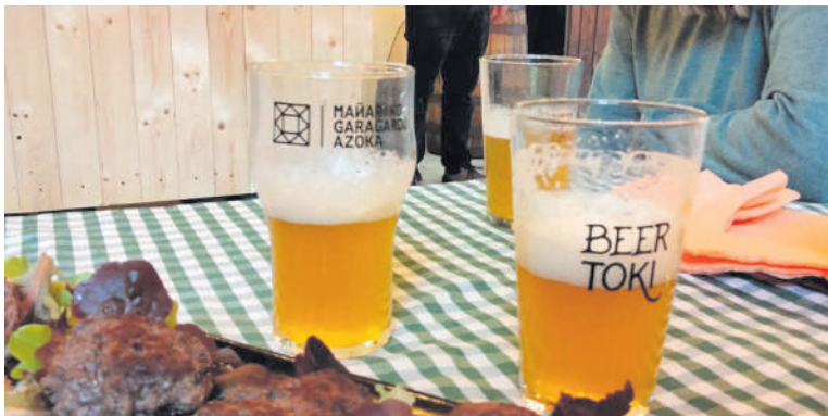
Dastatze bakoitzak 30 euro balio du.

Garai garagardo etxeak zerbeza-dastatzeak egingo ditu bere lantegian. 6 dastatze izango dira eta martxotik ekainera bitartean egingo dituzte. Honako hauek dira datak: martxoaren 25a, apirilaren 9a eta 29a, maiatzaren 14a eta 27a eta ekainaren 10a. Saio bakoitzean 5 garagardo eta 5 pintxo dastatuko dituzte, 30 euro ordainduta. 18:00etan ipini dute ordua. Taxi zerbitzua ere egingo da.