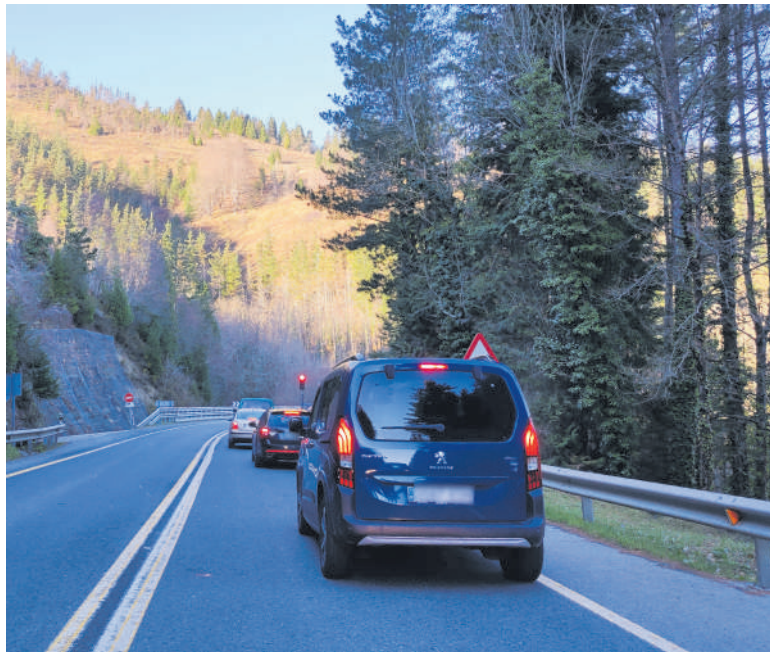
Orain errei bat dago zabalik eta semaforo sistema baten bitartez erregulatzen da trafikoa.

Orain errepide azpiko drainatze sistemak berritzen dabilta, besteak beste; lanek milioi bat eta erdi eurotik gorako inbertsioa dute