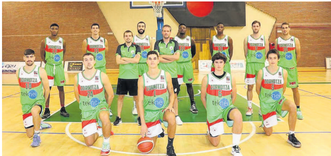
Sarrerak bizi-bizi saltzen dabiltzala adierazi dute klubetik.

Teknei Zornotza eta Ibiza taldeek Larrea kiroldegian jokatu dute finala, zapatu arratsaldean