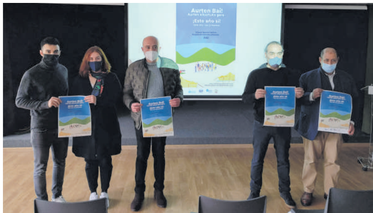
Durangoko Udaleko, elkarteetako eta erakundeetako ordezkariak aurkezpenean.