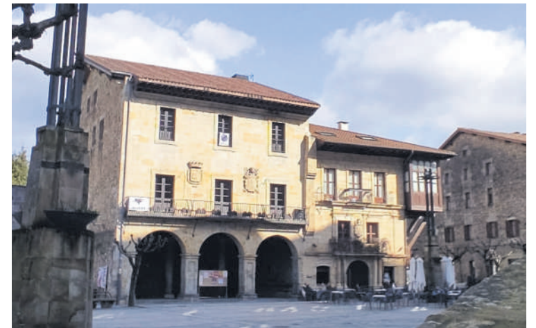
Osoko bilkuran onartu zuten partaidetzarako programa.

EH Bilduk eta EAJk emandako aldeko botoekin Herritarren Partaidetzarako Programa onartu dute