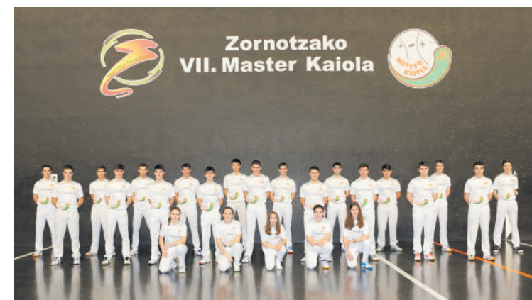
Txapelketako hainbat pilotari Master Kaiolaren aurkezpenean.

Eskualdeko pilotarien artean, Faben Ituarte dago sasoirik onenean. Joan zen asteburuan, Euskal Herriko klubean arteko txapelketa irabazi zuen, binaka.