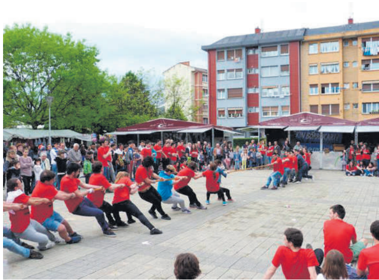
Traña-Matienako jaietako irudi bat.

Joan zen barikuan, Ertzaintzak gizonezko bat atxilotu zuen Abadiñoko Muntzaratz auzoan, indarkeria matxistagaitik. Erasoa salatzen, mugimendu feministak elkarretartzera deitu du martxoaren 17rako. Abadiñoko Udalak ere babesa eskaini dio biktimari eta mobilizazioan parte hartzeko deia egin du. "Gure gaitzespena eta arbuioa adierazi gura ditugu, eta biktimaren eta haren inguruaren eskura ipini gura ditugu haren babeserako baliabideak", adierazi zuten udaletik. Elkarretartzera Txanporta plazan izango da, 18:30ean.