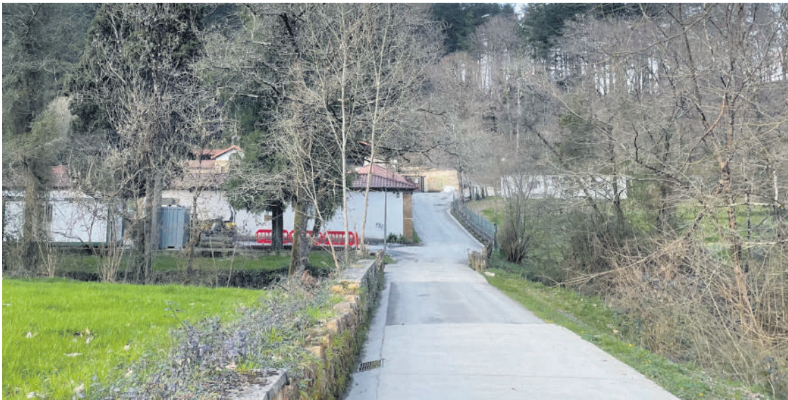
Bidea berri eta inguruko harresiak konponduko dituzte, besteak beste.