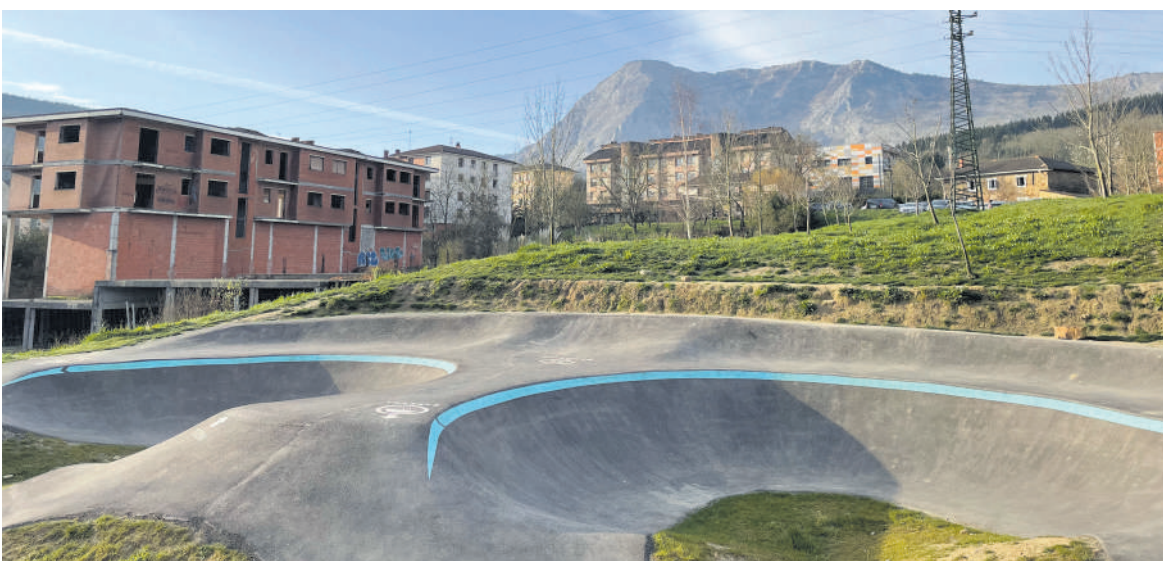
Pump Track gunearen ondoan egingo dute eremu hori.

Parke biosasungarri berri honek kalistenia gunea, parkour pista bat, rokodromoa eta tirolina izango ditu, besteak beste. Parkeak 400.000 euroko aurrekontua du eta Atxondoko Udalak aurreikusten du udarako amaituta egongo dela