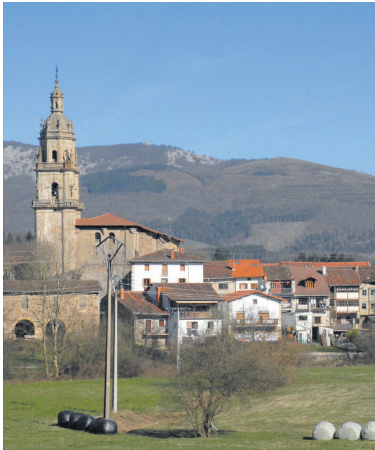
Otxandioko Udala sustatzaileen artean dago eta GoiEner-en laguntza dute.

Lehenengo proiektuan, zenbait instalazio fotovoltaiko ipini gura dituzte. Gura duten herritarrek eurretatik argindarra hartzeko aukera izango dute. Interesdunen argindar fakturaren eta titula-