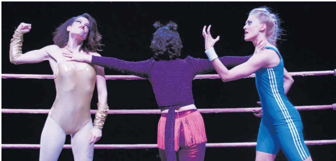
Lau borrokalari dira emanaldiko protagonistak.