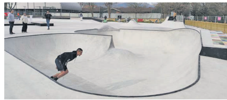
Skate pista berria Arripauseta inguruan dago.

eta musika, besteak beste. Arratsaldean, grafitigileek Durangoko skate parka dioen murala pintatuko dute, eta haren ondoan errespetua berba ipiniko dute hainbat hizkuntzatan. Egitarauko ekintzak 9:30ean hasiko dira eta iluntzera arte iraungo dute.