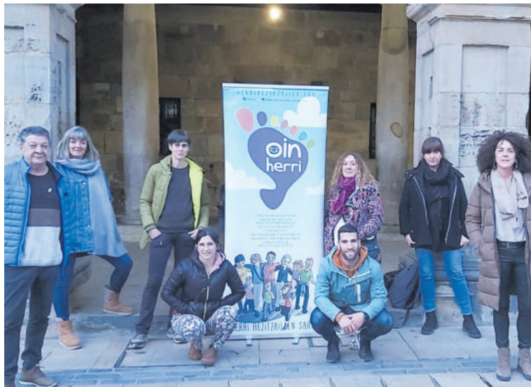
Oinherriko eta Elorrioko Udaleko kideak.

Horrez gainera, proiektuan parte hartu gura duten talde eragileei martxoaren 23an 19:00etan egingo den batzarrean parte hartzeko deia egin diete udaletik.