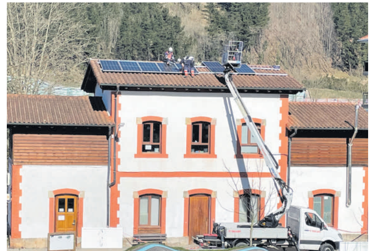
Liburutegiko teilatuan eguzki plakak jarri dituzte.

Guztira, 87 eguzki plaka ipiniko dituzte: 21 plaka liburutegian eta 66 Atxondoko Herri Eskolako teilatuan