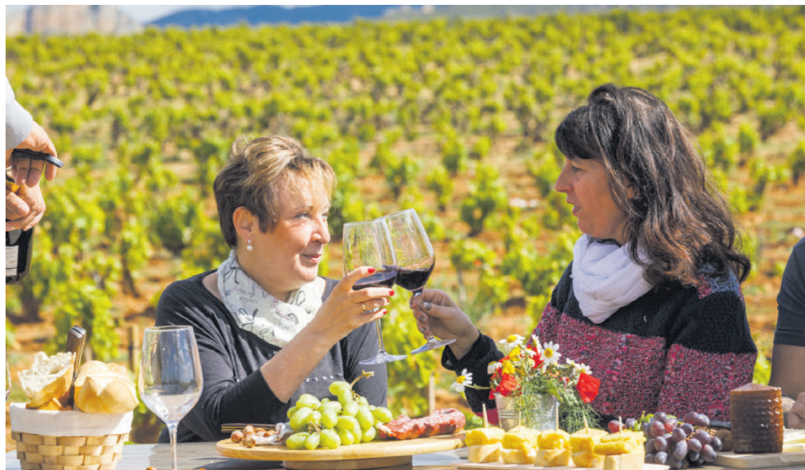
Gastronomiaz, ardo bikainez, upategiez eta mahastien edertasunaz gozatzeko hamaika aukera eskaintzen ditu Errioxak.

Izan ere, horrelakoa da Errioxa, elkargunea eta elkar ulertzeko gunea, bideak gurutzatzeko gunea, berezko nortasuna duen lurraldea, elementu natural, kultural eta historikoen heterogeneotasun handia hartzen duena. Ezaugarri horrek izaera bereizgarri eta erakargarria ematen dio zentzumenean atsedean eta atseginerako lekua bilatzen dutenentzat, bisita ba-