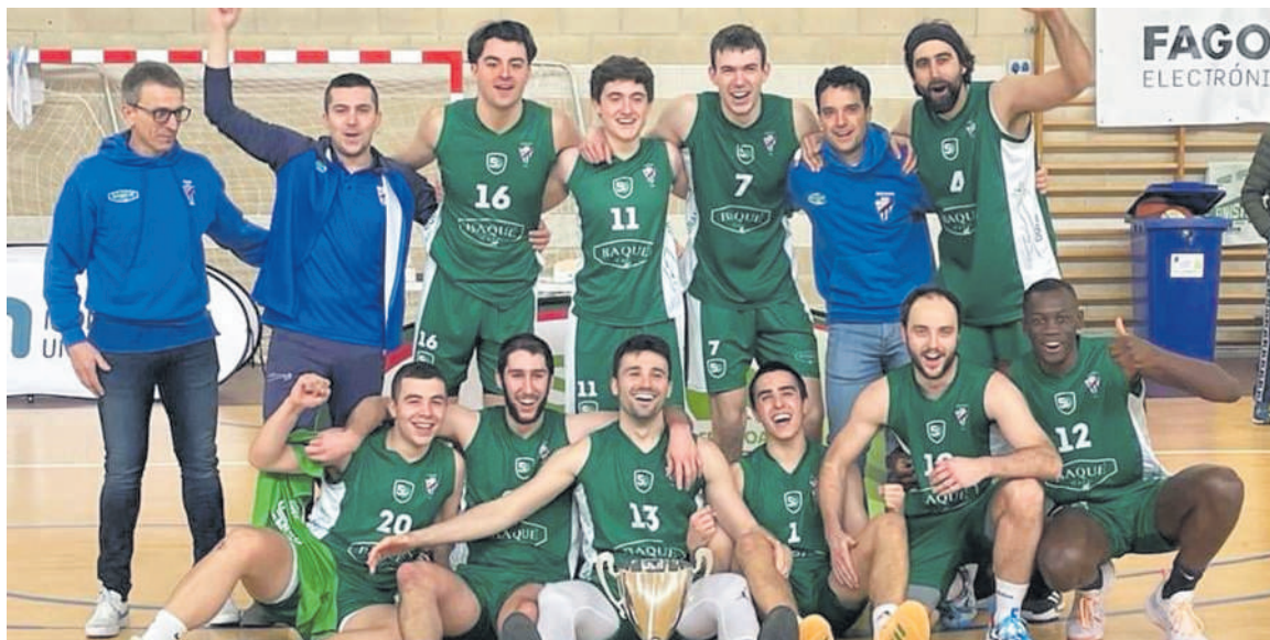
Tabirako-Baqué taldeko jokalariek Arrasaten, Kopa txapelketa irabazi eta gero. LUIS ITURRIOZ.