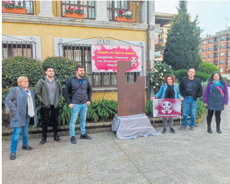
Hainbat zaldibartarrek bat egin dute kanpainagaz; erdian, eskultura.