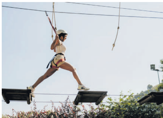
Abentura-parkeak ere asko dira Errioxan.