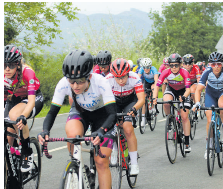
Zaldibarko txirrindulari lasterketa.

Abadiñon ere bizikleta izango da protagonista asteburuan, baina kasu honetan ez da lehiarik egongo eta berdintasuna aldarrikatzea izango da helburua. Zapatuan, 12:00etan, bizikleta martxa bat egingo da Mutsaratzeko dorretxetik Traña-Matienara. Abadiñoko Udalak eta Eneicat taldeak antolatu dute ekimena.