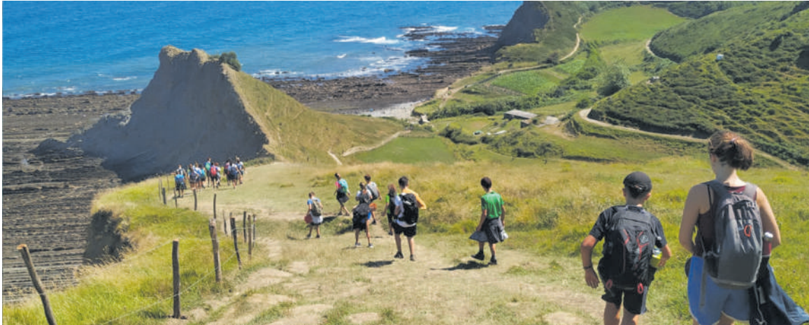
Berbarok antolatutako udalekuetako argazkia.

Izena emateko epea martxoaren 7tik 10era bitartean izango da