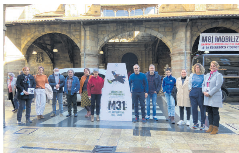
Eragileek astelehenean egindako agerraldia.

Durangoko eragileek aspaldiko egitaraurik oparoena prestatu dute. Aurten, gazteek leku berezia izango dute