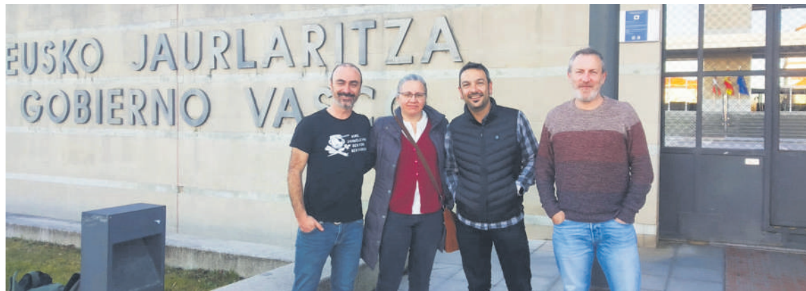
Berton Bertokoa dinamikako kideak Gasteizen, Eusko Jaurlaritzaren egoitzan.

eta tokiko ekoizleek ekoizirikoa dela bermatu gura du dinamikak. Baina Berton Bertokoako kideek diotenez, Eusko Jaurlaritzak "zalantzak" agertu ditu puntu horretan. Atal hori argitu barik dago oraingoz.