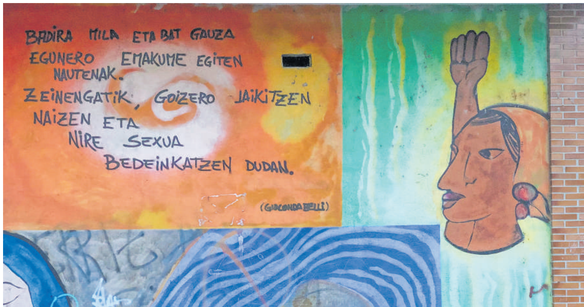
Berrizen dagoen horma irudiko argazkia.

Elkarrekin Podemosek Berrizen jaiotako gerrillariaren memoria berreskuratu gura du