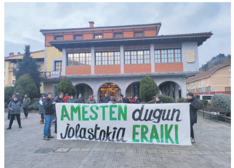
Otsailaren 24an egindako protesta.