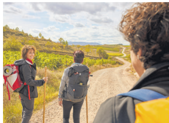
Donejakue bidea da beste aukera bat.