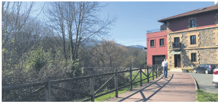
Arandiatik hasita, Beresi aisialdi guneraino egin gura dute bidegorria.

Zornotza eta Iurreta lotuko dituen Bizkaiko lehenengo bizipistaren barruan egingo den bidegorriak Tabernabarri eta Arriandi industrialdea ere lotuko ditu herriguneagaz