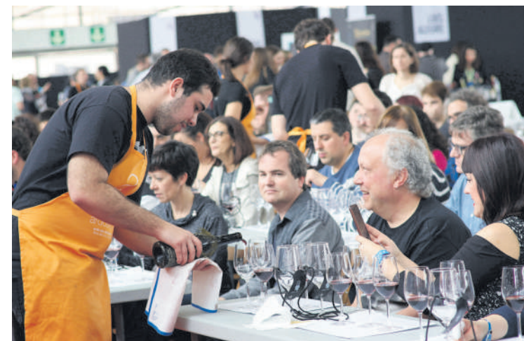
2019ko Ardo Santsaneko argazkia.

Aurtengoa jaialdiaren lehenengo edizioa izango da. Martxoaren 22tik 26ra egingo dute, Olajauregi hotelean