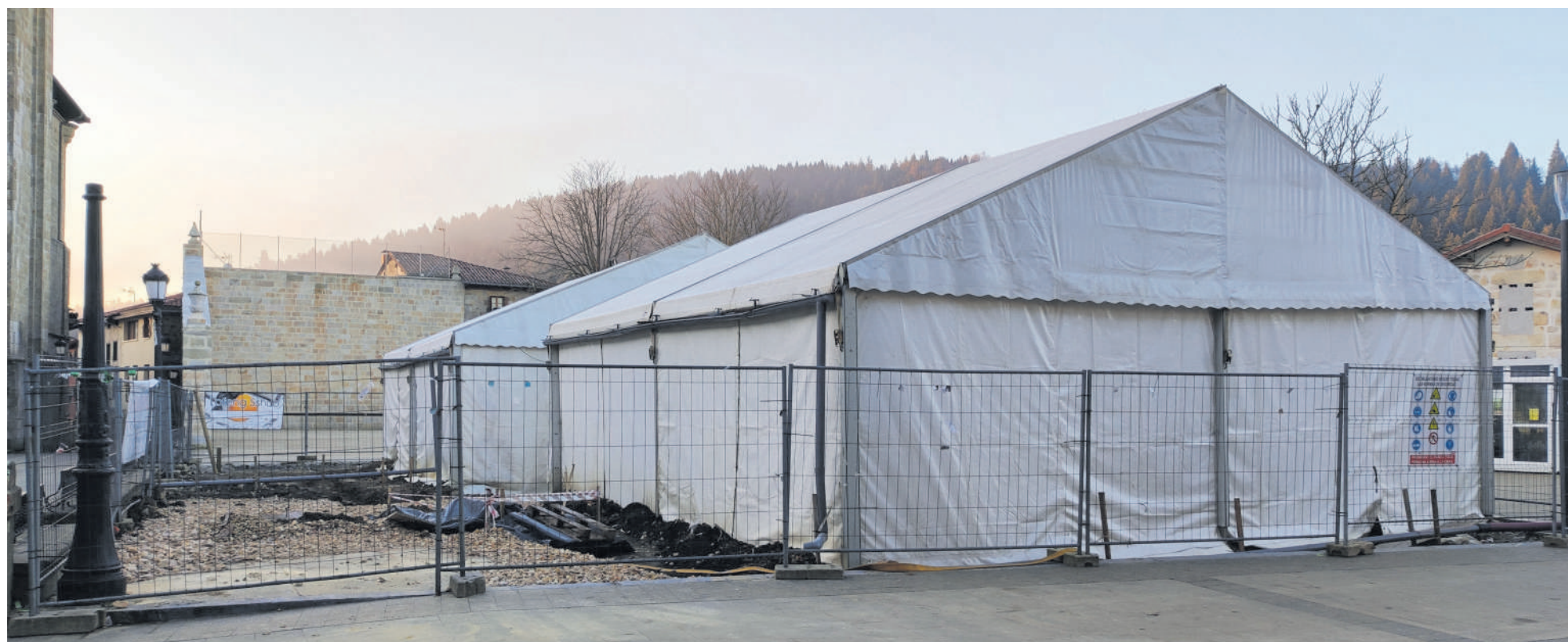
Hilabete batzuetan irudi hauxe izan du Otxandioko plazak, indusketa babesten zuten karpekin.

handi-handi bat ipintzea, leku altu batean.