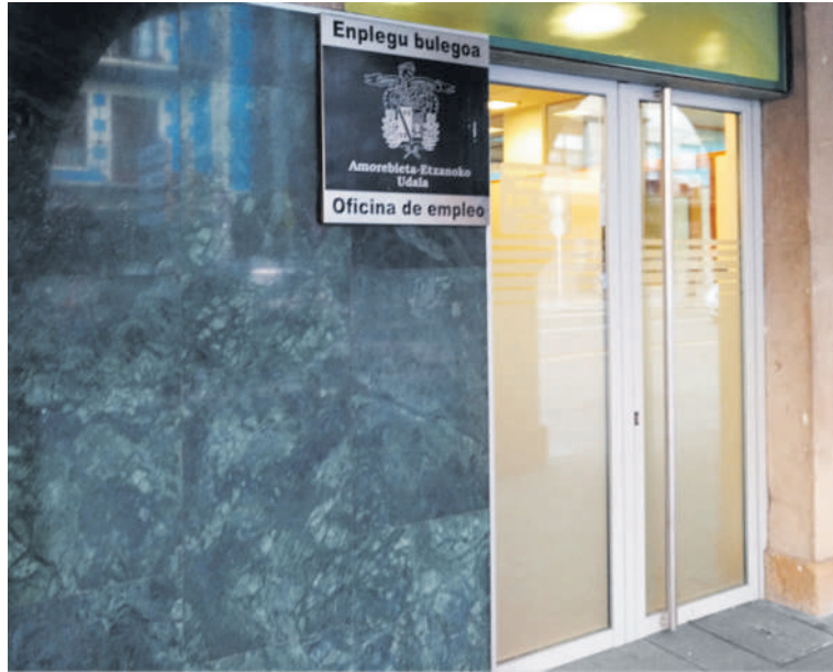
Zornotzako enplegu bulegoa.

1.794 lagun egon ziren lan eskatzaile legez izena emanda. Bete beharreko 119 postuetatik 113 bete ziren