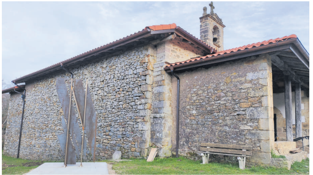
Nestor Basterretxearen eskulturaren erreplika, San Roke ermitaren ondoan.

Iazko indusketetan, ustez hobi komuna zegoen tokian enterramendu indibidualak aurkitu zituzten; hau da, gorpuak banan-banan eta bata bestearen ondoan zeuden lurperatuta, ilaran. Aranzadiko adituen ustez, haiek ez ziren bonbardaketa-oste batean egingo liritekeen enterramendu motak eta ez zuten gehiago ikertzeko arrazoirik ikusten. Baina horrek ez du esan gura