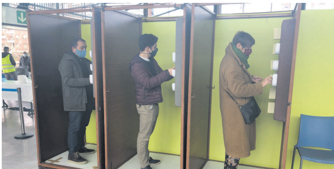
Iazko martxoaren 14an Durangon egindako herri galdeketa irudia.