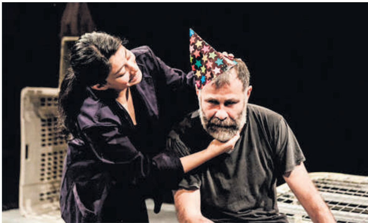
'Atzerrian lurra garratz'.