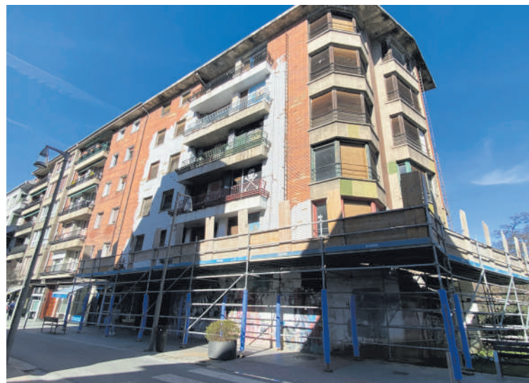
Uribarri 23 zenbakiko eraikina.

Akordioa beharrezko txostenak aurkeztu barik egin zuten. EAEko auzitegiak arrazoia eman dio Herriaren Eskubideari