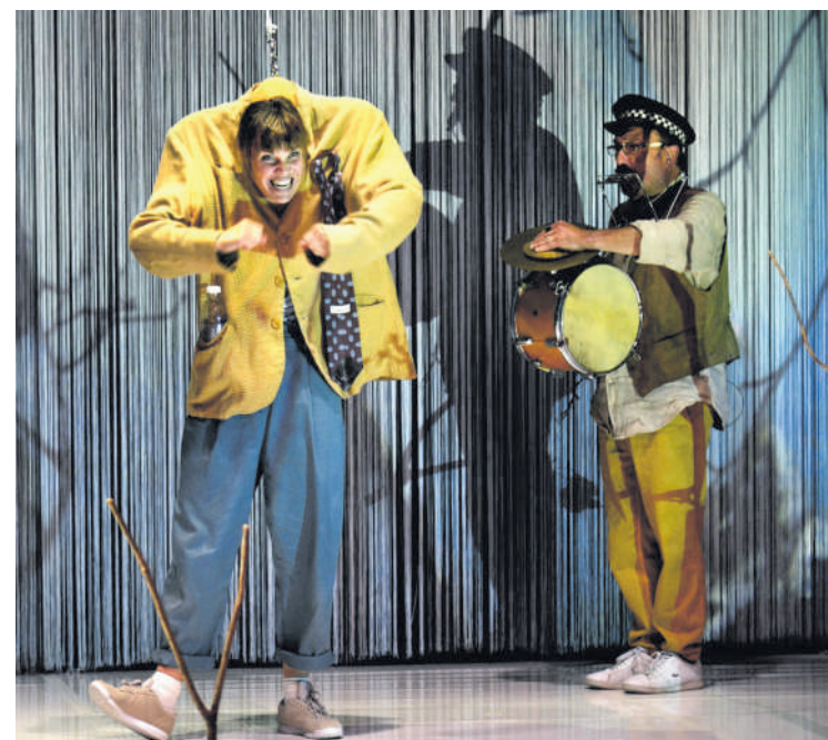
'Zuhaitzak landatzen zituen gizona'.

Gorakada erreferentziatzko konpainia da Euskal Herrian zein Espainian.