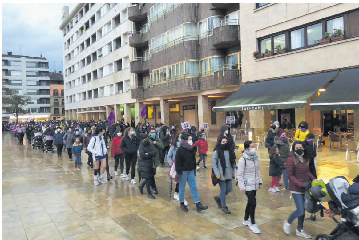
lazko mobilizazio bateko argazkia, Durangon.