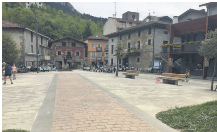
Proiektuko dinamizatzaileak kalerik kale ibili dira herritarren iritzia jasotzen.

Horrez gainera, prozesua dinamizatzeke arduratu duten Maraka taldeko kideek herriko plazara irten zuten joan zen asteko egun batean, herritarren iritzia jasotzera. Modu horretara, beste 11 ekarpen jaso zituzten. Proposamen guztiak bilera batean aztertzea izango da hurrengo urratsa.