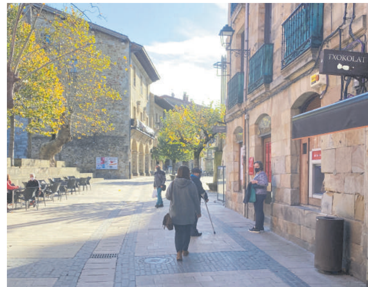
Elorriorek eskura dute zerbitzua.

Elorrioko Udalak jakinarazi du zerbitzua berriro aurrez aurrekoa izango dela martxoaren 4tik aurrera