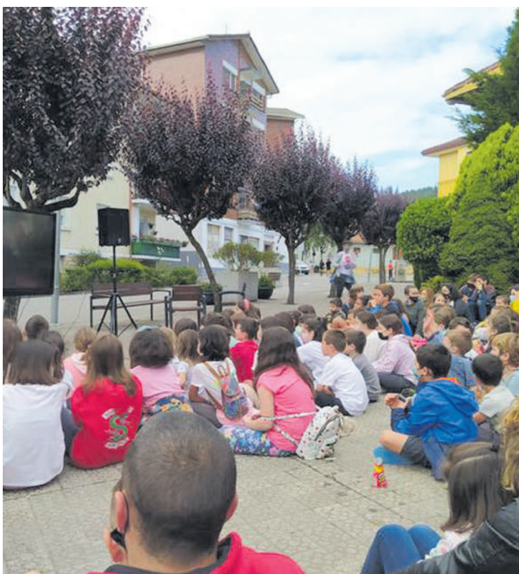
Zaldibarko jolastokiaren aldeko ekimen bateko argazkia.

Kurutzezarreko lursailean eraikiko diren etxebizitzaren eraginez "eskola eremua handitzea ezinezkoa" dela salatu dute