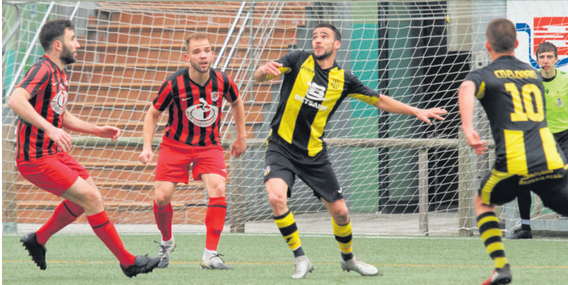
Iurretarek irabazi zuten Elorriok eta Iurretakok jokaturiko derbia. JON IGLESIAS

Asteburuko jardunaldia bakarrik falta da lehen fasea amaitzeko eta Iurretakok asko du jokoan