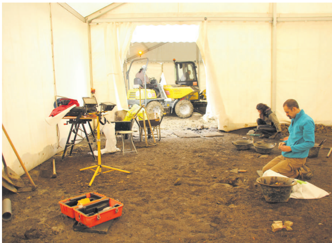
Ikerlariak plazako indusketan lanean.

Hormek V forma dute. Poste-zuloak sartuta ikusten dira. Zuzeko hesi moduko bat egongo zen, espazio hori gehiago babesteko. Hobiaren hondoan egur batzuk agertu dira. Analisia egingo diegu eta eraztunen bitartez datak jakin ahalko ditugu. Burdinezko pieza batzuk ere agertu dira inguru horretan. Pieza horiek plegatuta daude. Burdinoletatik