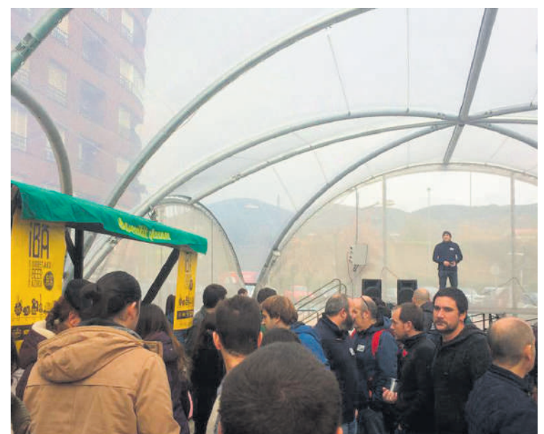
Garagardo azokaren aurreko edizio bateko argazkia.

Askondoko aterpean. Prestaturiko egitaraua birmoldatu egin dute eta azken zehaztapenak daude lotzeko, antolatzaileen berbetan. Azokak herriko ostalarien babesa du aurrean ere, eta lau garagardogile izango dira bertan: Garai Brewing, Drunken Bros, Saltus eta Baober.