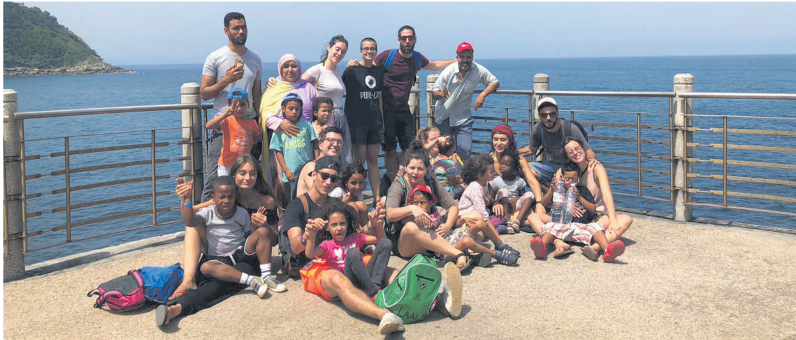
Río de Oroko kideak Saharako umeekin egindako irteeran.

Elkarteak Oporrak Bakean programari heldu dio berriro. Bestalde, Karabana Solidarioa 25.600 kilo produktugaz bete dute