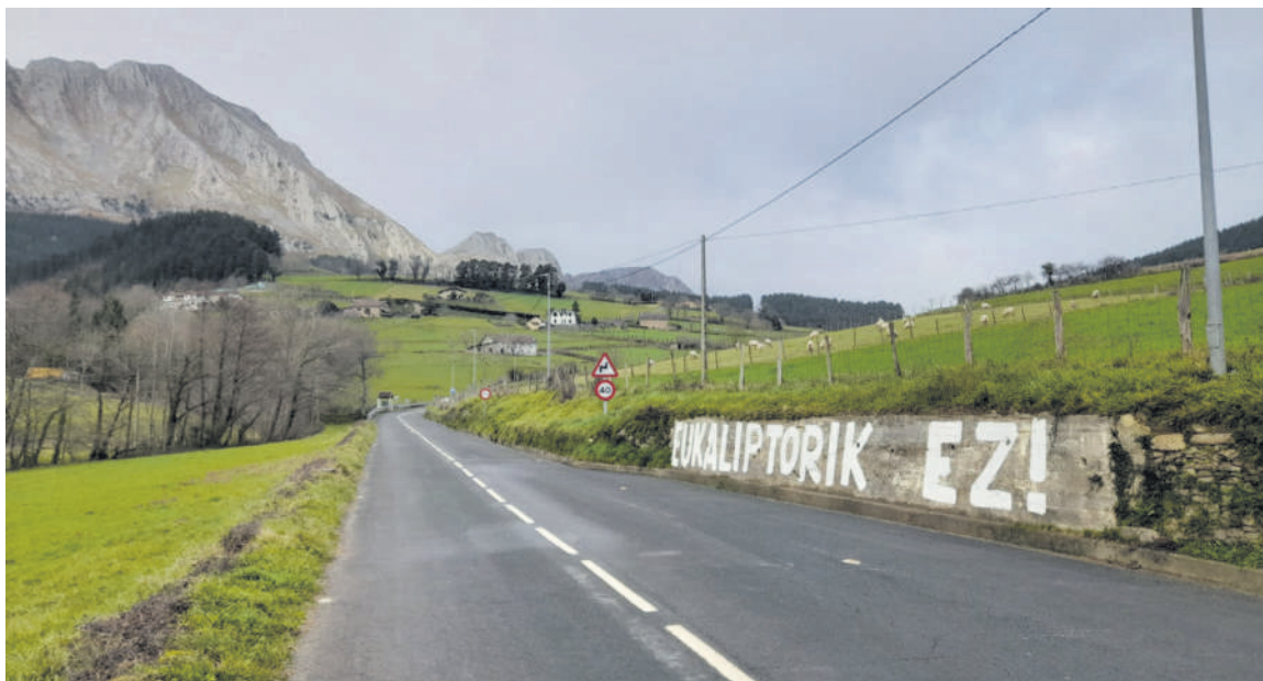
Axpen egindako pintaketaren argazkia.

Atxondon sorturiko talde honen helburua basogintza "eredu berri bat" saretzea da