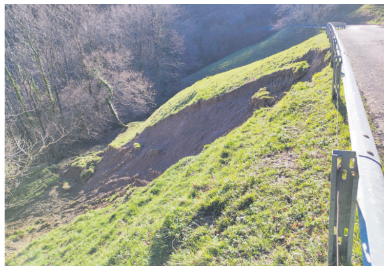
Gerea auzoan gertatutako lur-jausia.

pertsonak banan-banan eta bakoi-tza bere lekuan lurperatu zituztela, eta beste denak elkarregaz, zenbait lekutan", esan zuten. "Herri txikia izanik, hildakoak oso hurbilekoak izango ziren eta zentzu osoa du duintasunez lurperatu izanak", gaineratu zuten.