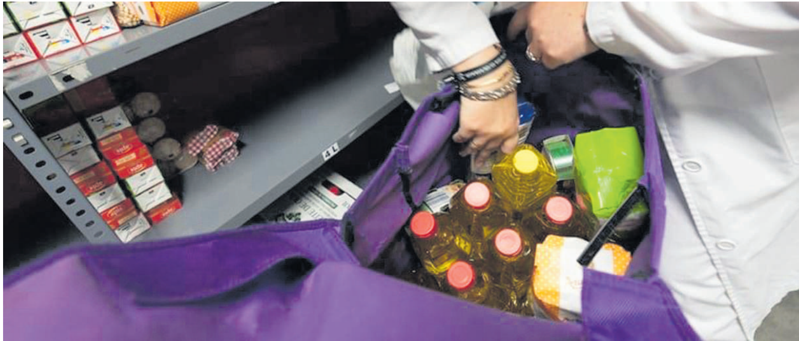
200 bat lagunek jaso dute laguntza.

2021ean, Elikagai Bankuak 18.047 kilo banatu zituen, 2020an baino zertxobait gehiago. 2020an, 17.627 kilo eman zituzten