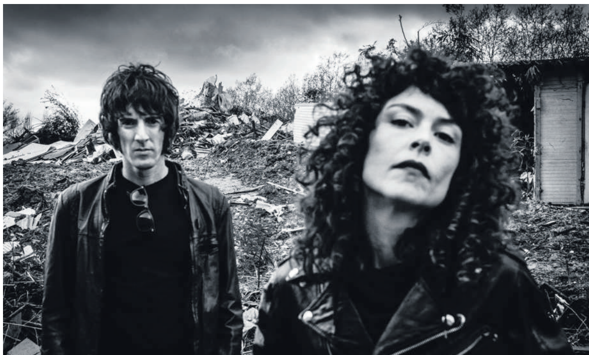
Niña Coyote eta Chico Tornado.