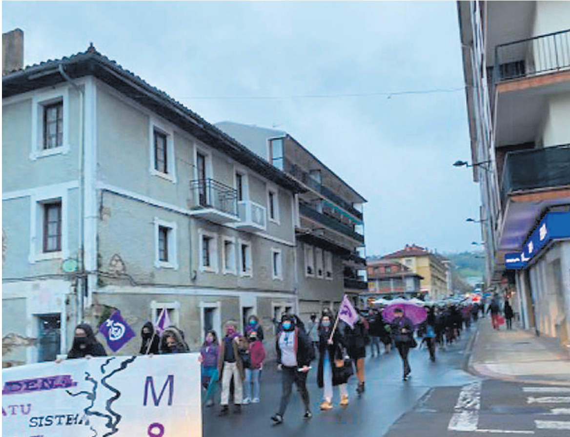
lazko Martxoaren 8ko mobilizazioko argazkia.

Manifestaziora deitu dute Martxoaren 8rako. Udaletxeko plazatik irtenda, herriko kaleak zeharkatuko dituzte